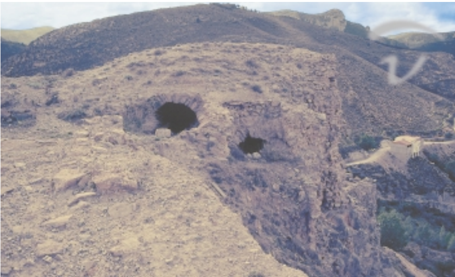
Foto 48. Detalle de su interior.