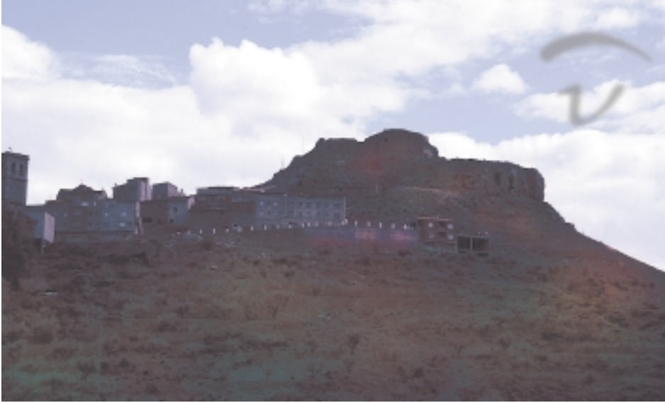
Foto 47. Sobre una elevación natural se ubicó su castillo.