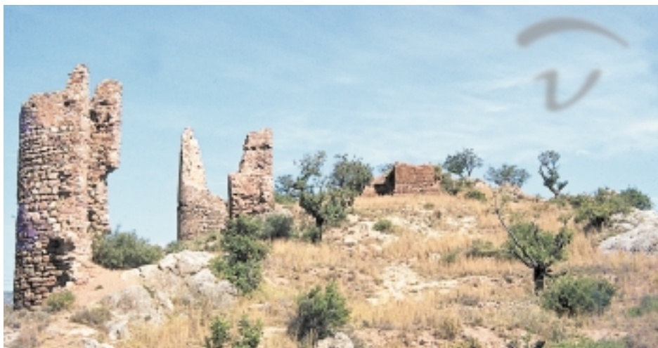
Foto 46. Detalle de dichas torres por su interior.