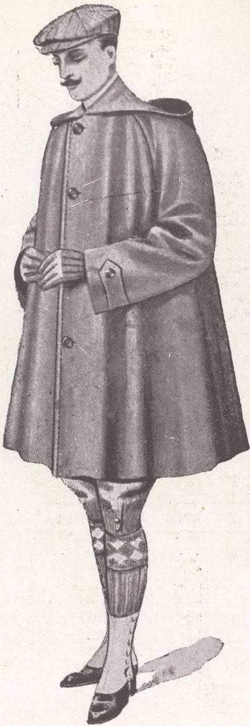
CAPA CON MANGAS