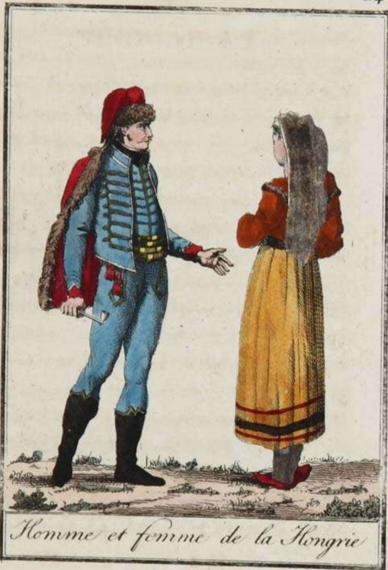
Homme et femme de la Hongrie

Marie-Thérèse monta sur le trône de la Hongrie en 1741. L'Europe entière était coalisée contre cette impératrice , et vou-