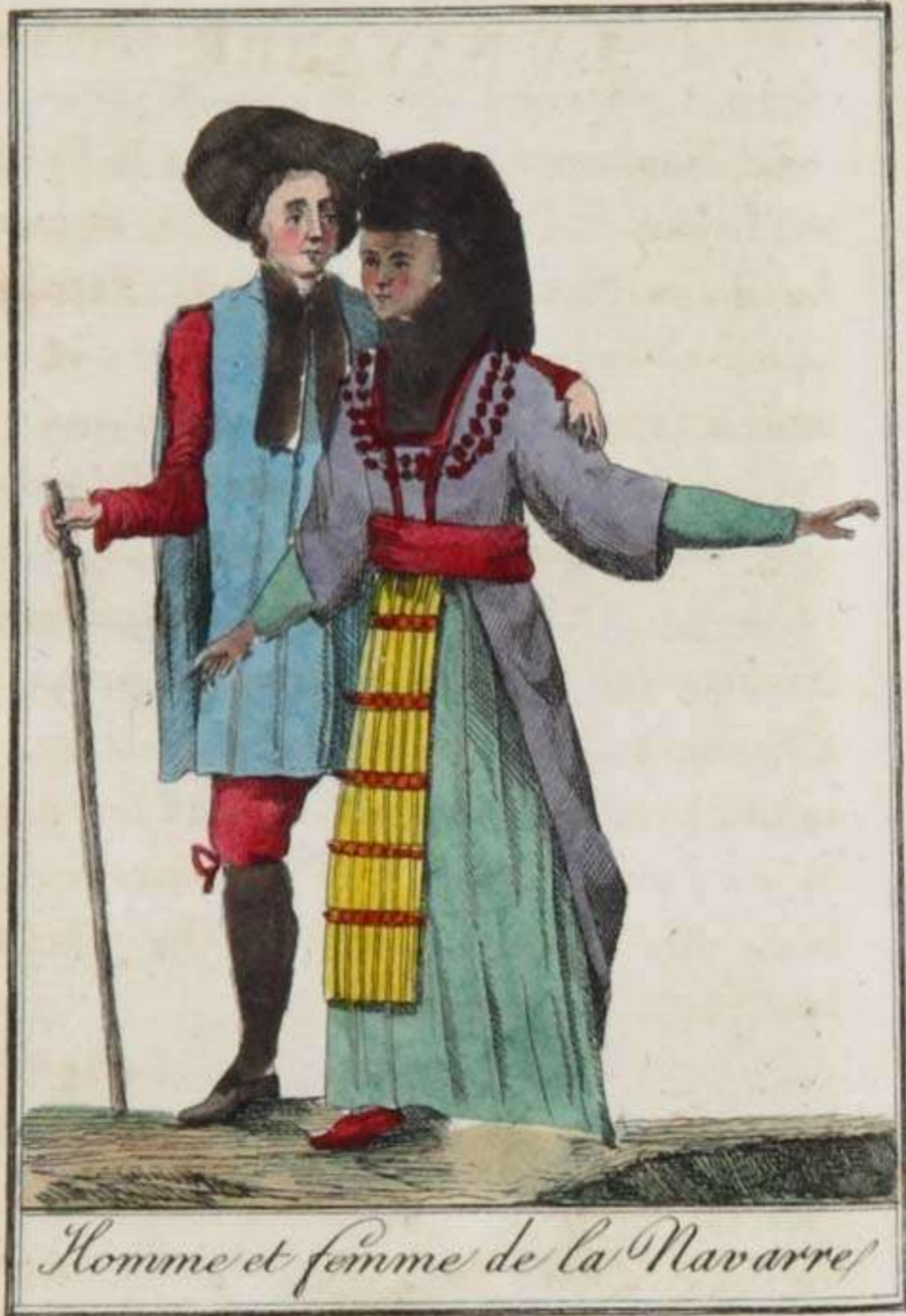
Homme et femme de la Navarre

Pampelune en est la capitale. Cette ville, qui, dit-on, a été fondée par Pompée, contient cinq à six mille habitans. Les rues sont larges et belles; mais les croisées y sont sans vitrages, et les chambres sans chemi-