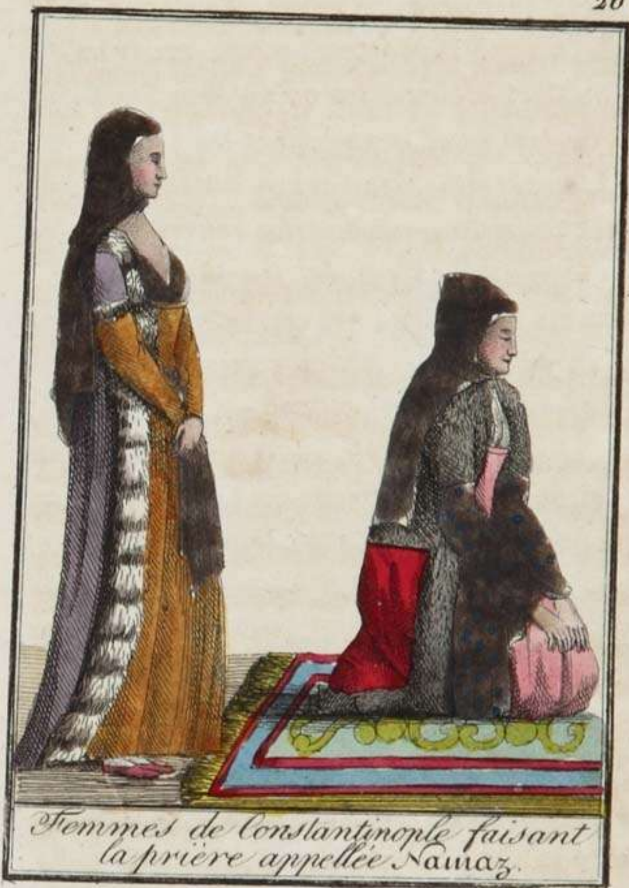
Femmes de Constantinople faisant la prière appelée Namaz.