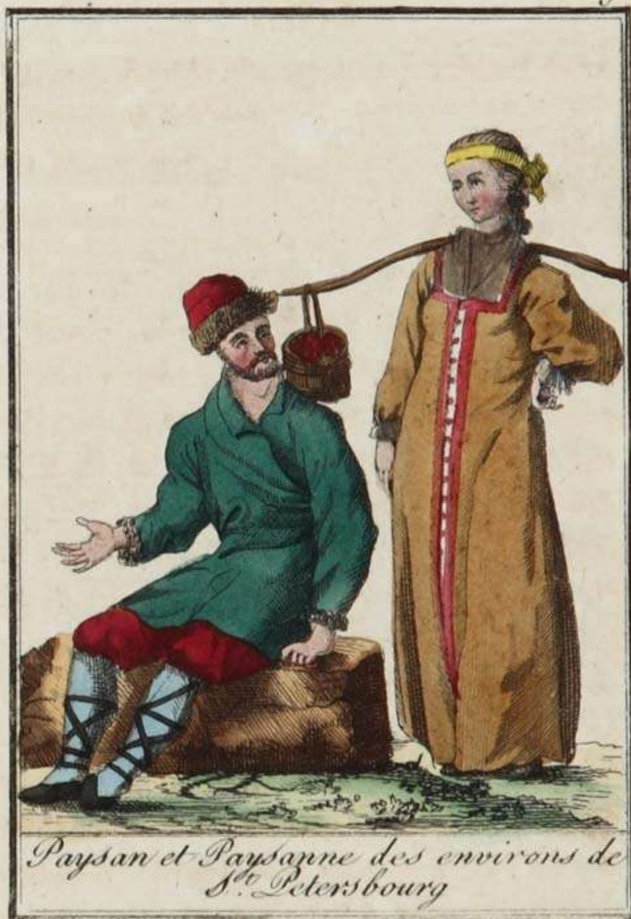
Paysan et Paysanne des environs de S t . Petersbourg

L'hiver de Saint-Pétersbourg est très-rigoureux; la Newa se couvre de glaces épaisses de vingt-huit à trente-six pouces, et la terre est gelée à deux ou trois pieds de profondeur. Le froid sert aux plaisirs des habitans, en fournissant l'occasion de faire des courses de traîneaux. En 1740, l'impératrice Anne fit élever, sur les bords de la Newa, un magnifique palais, construit de quartiers de glace taillés comme des pierres de taille. Les divers appartemens étaient garnis de meubles de glace. Devant le palais étaient des statues, et six canons, le tout aussi de glace; un de ces canons fut chargé, et le boulet traversa une planche de deux pouces d'épaisseur. Pendant la