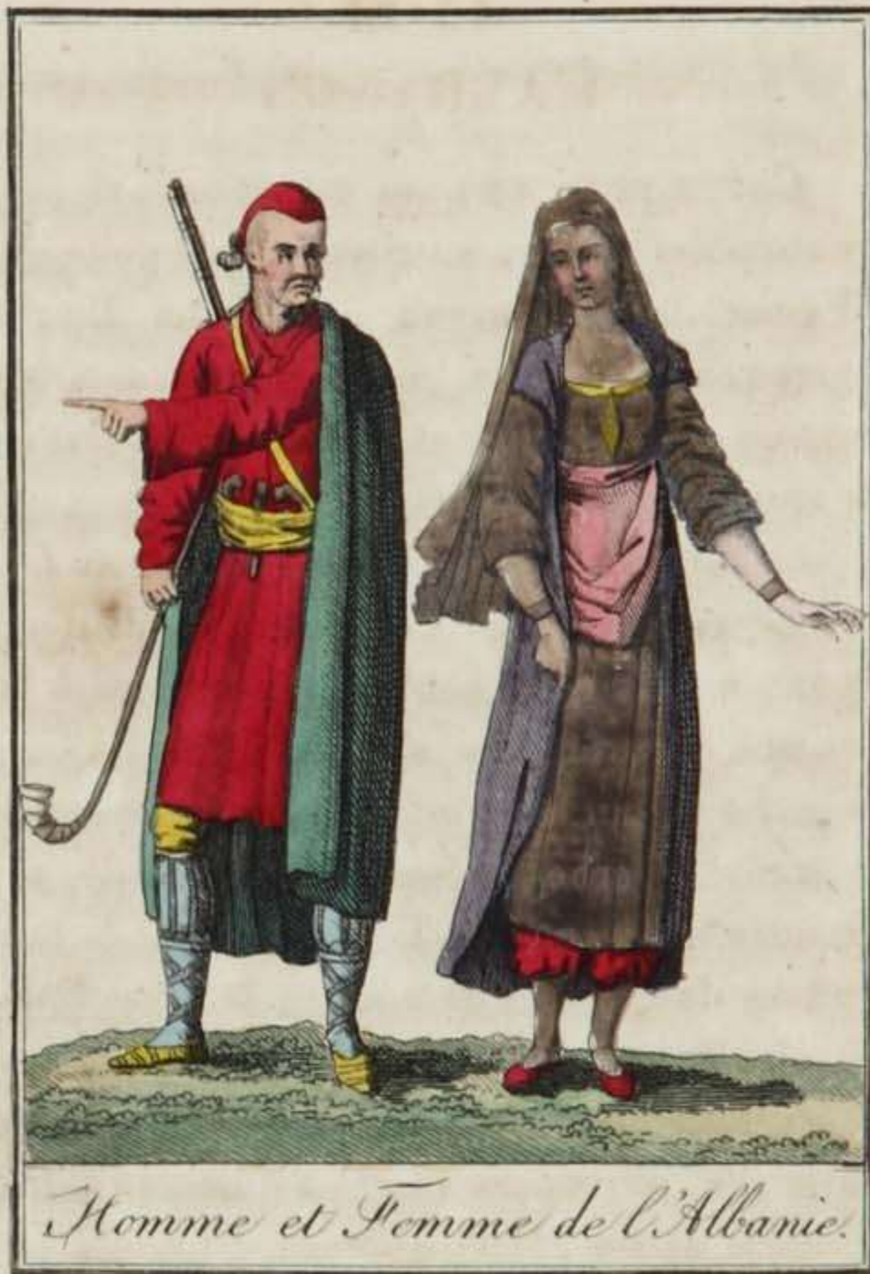
Homme et Femme de l'Albanie.

Ce fut l'Albanie qui donna le jour au fameux Scanderbeg . Ce guerrier , fils d'un petit roi de cette contrée , était élevé à la cour d'Amurat , qui s'était saisi de l'Albanie. Le sultan lui confia un corps de troupes : Scanderbeg résolut dès-lors de se rendre indépendant. Il s'empara de la capitale de l'Épire , et ensuite de toute l'Albanie. Pendant long-temps il arrêta les armes triomphantes de Mahomet II ; mais après sa mort , en 1467 , l'Albanie rentra sous la domination ottomane.