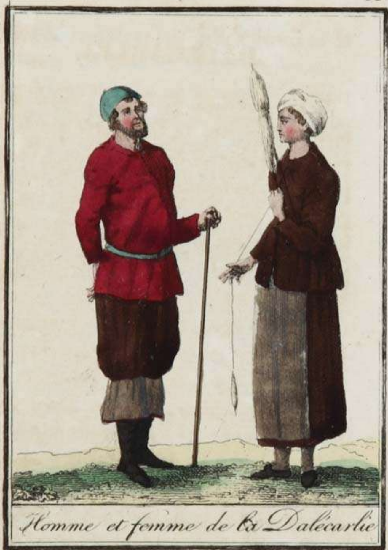
Homme et femme de la Dalécarlie

Les habitans de la Dalécarlie sont bons soldats , mais grossiers , et même féroces ; ils supportent impatiemment le joug , et ce sont toujours eux les premiers , parmi