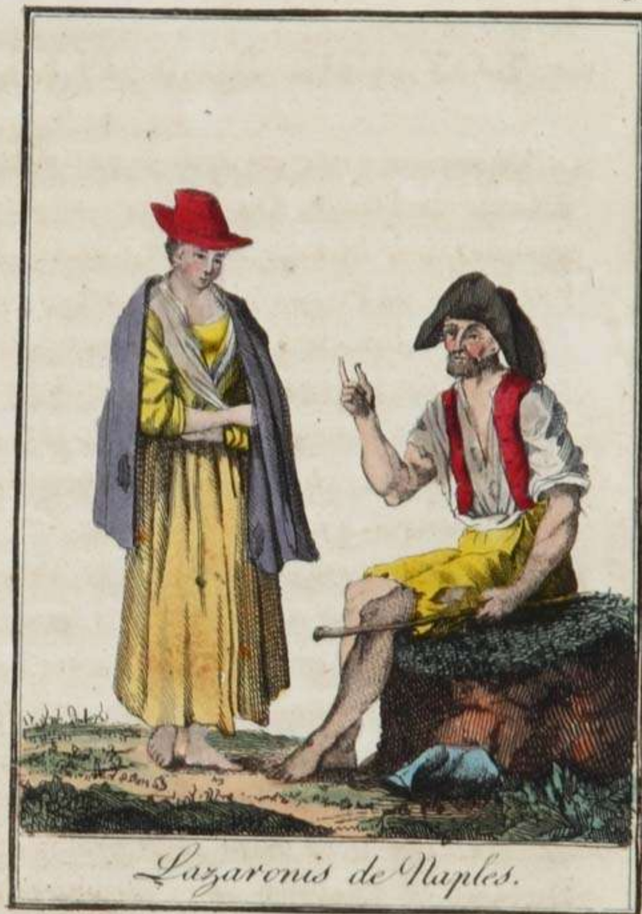
Lazaronis de Naples.

Naples, dans la Terre de Labour, capitale de tout le royaume, est une des villes les plus anciennes de l'Italie. Fondée par les Cuméens, elle passa successivement sous la domination des Romains, des Hérules et des Ostrogoths. Reprise en 536, par Bélisaire, elle fut saccagée. Vers 542, elle devint encore la proie des barbares; bientôt après, reconquise par l'eunuque Narsès, elle rentra sous la domination des empereurs d'Orient. Sous le gouvernement des exarques de Ravenne, elle profita de la faiblesse de l'Empire pour recouvrer une