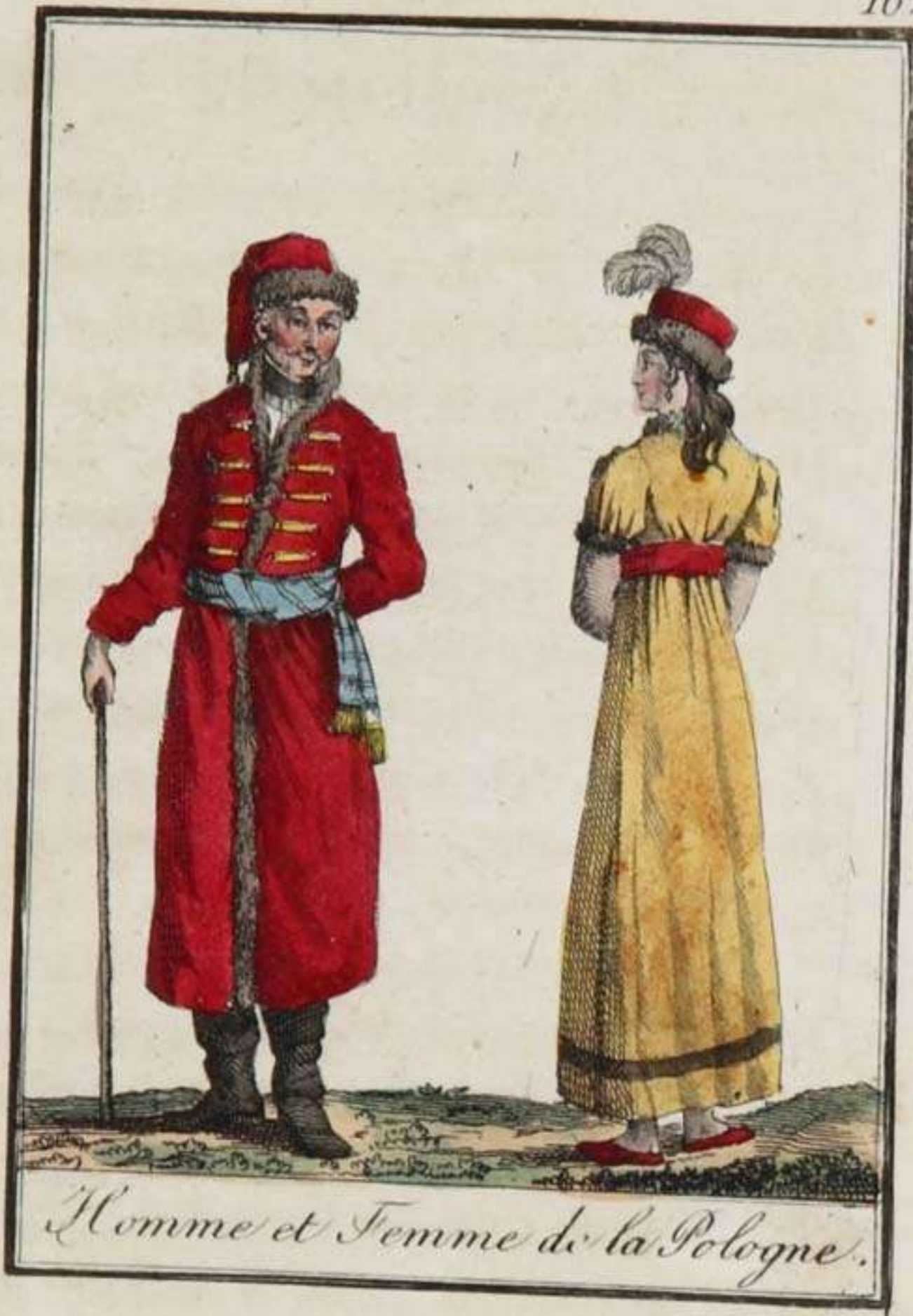
Homme et Femme de la Pologne.