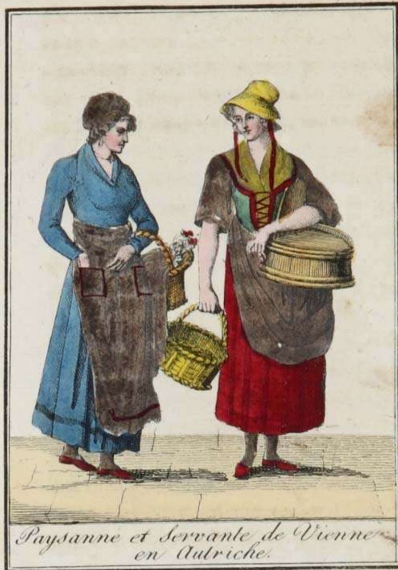
Paysanne et Servante de Vienne en Autriche.

Les habitans des îles Baléares ont à-peu-près les mêmes mœurs que les Espagnols. Ces insulaires ont le teint extrêmement basané. Les femmes ont les traits réguliers, les yeux et les cheveux ordinairement noirs.