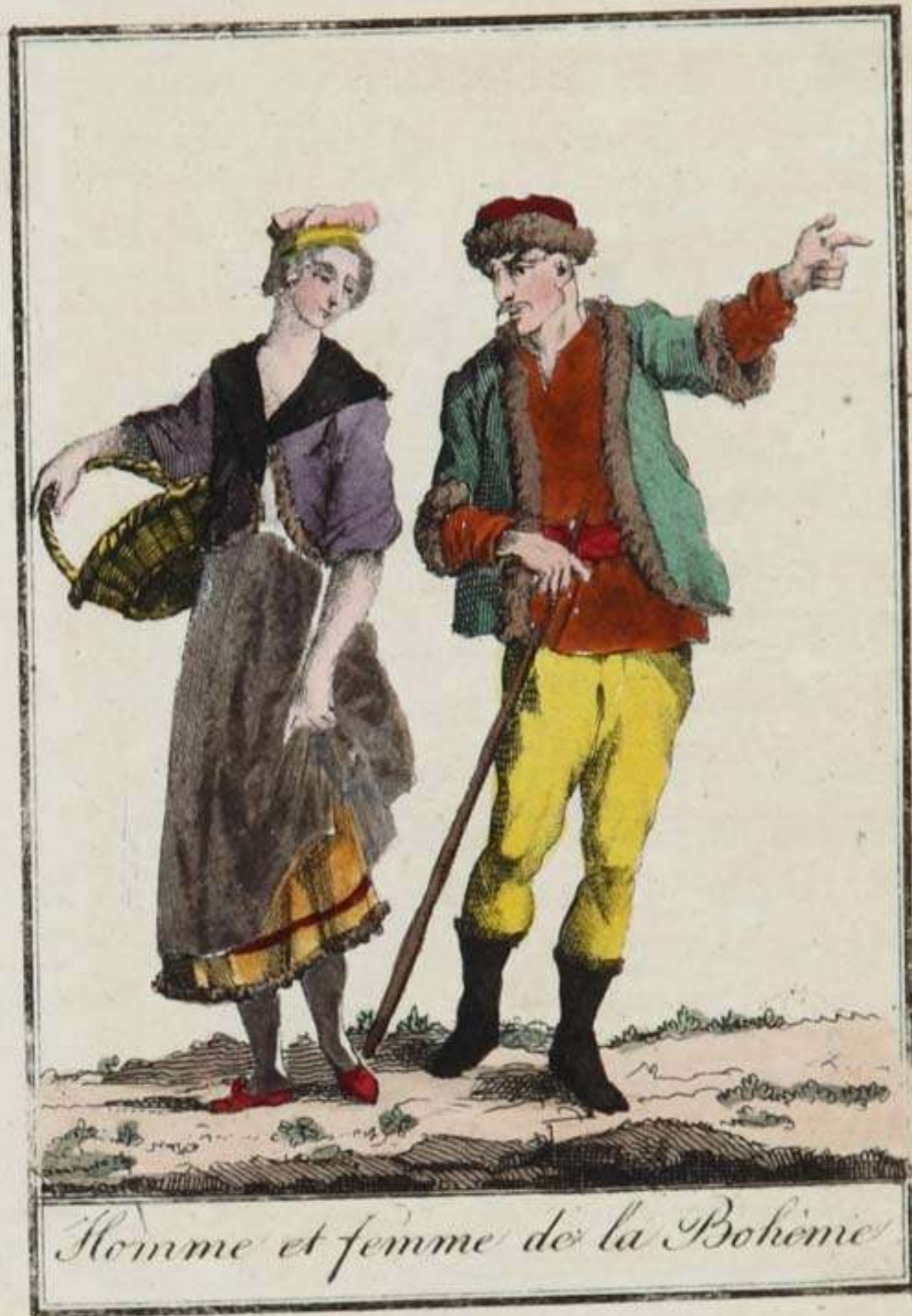
Homme et femme de la Bohême

Les premiers habitans de ce pays , qui faisait alors partie de la forêt Hercinie , furent les Boyens , peuples sortis de la Gaule sous la conduite de Sigovèse. Chassés de la Bohême par les Marcomans , ils lui laissèrent leur nom. Aux Marcomans succédèrent les Slaves. Botzivoï fut , vers la fin du neuvième siècle , le premier souverain chrétien de ce pays , mais il n'eut que le titre