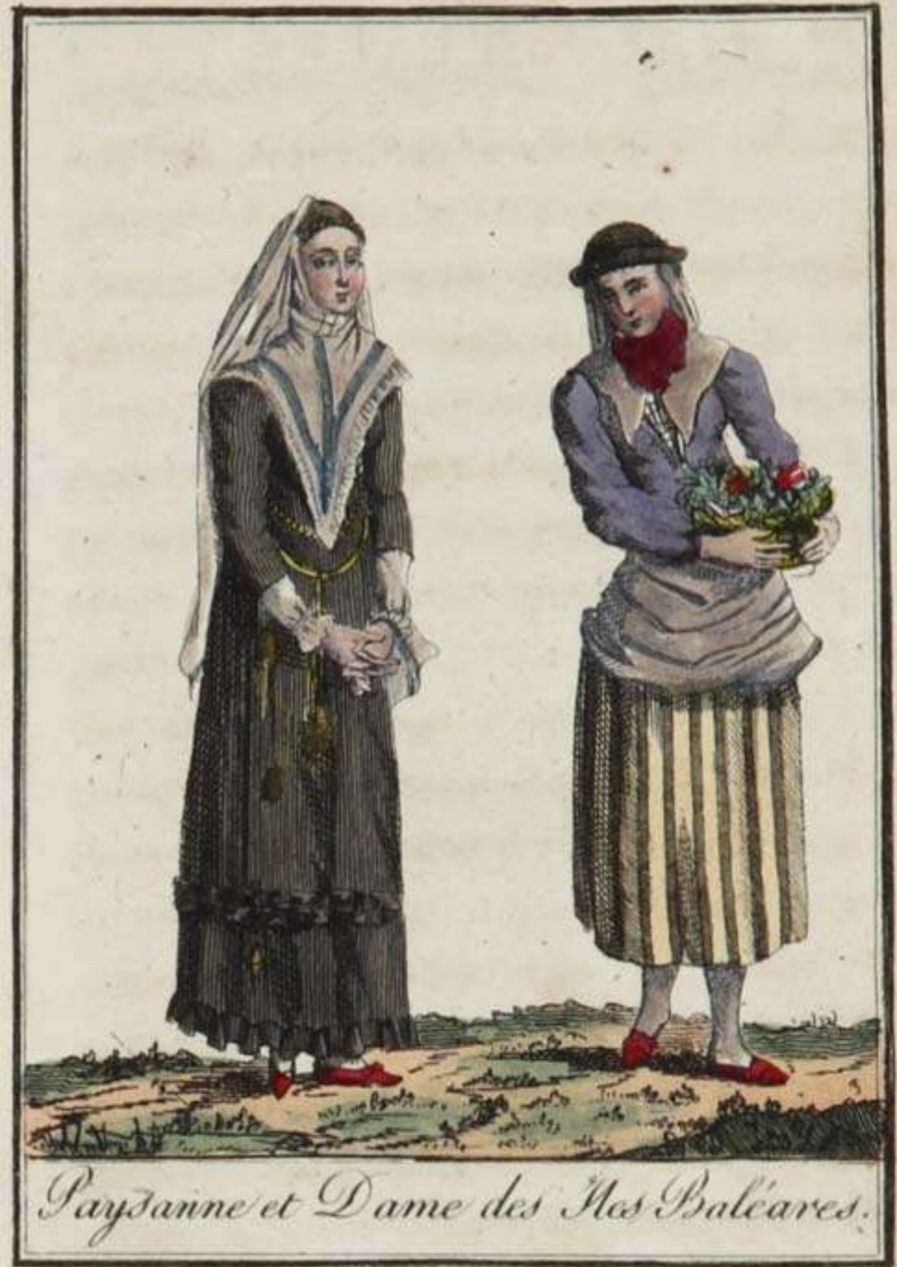
Payzanne et Dame des Îles Baléares.

L'île de Minorque est située à l'est de la