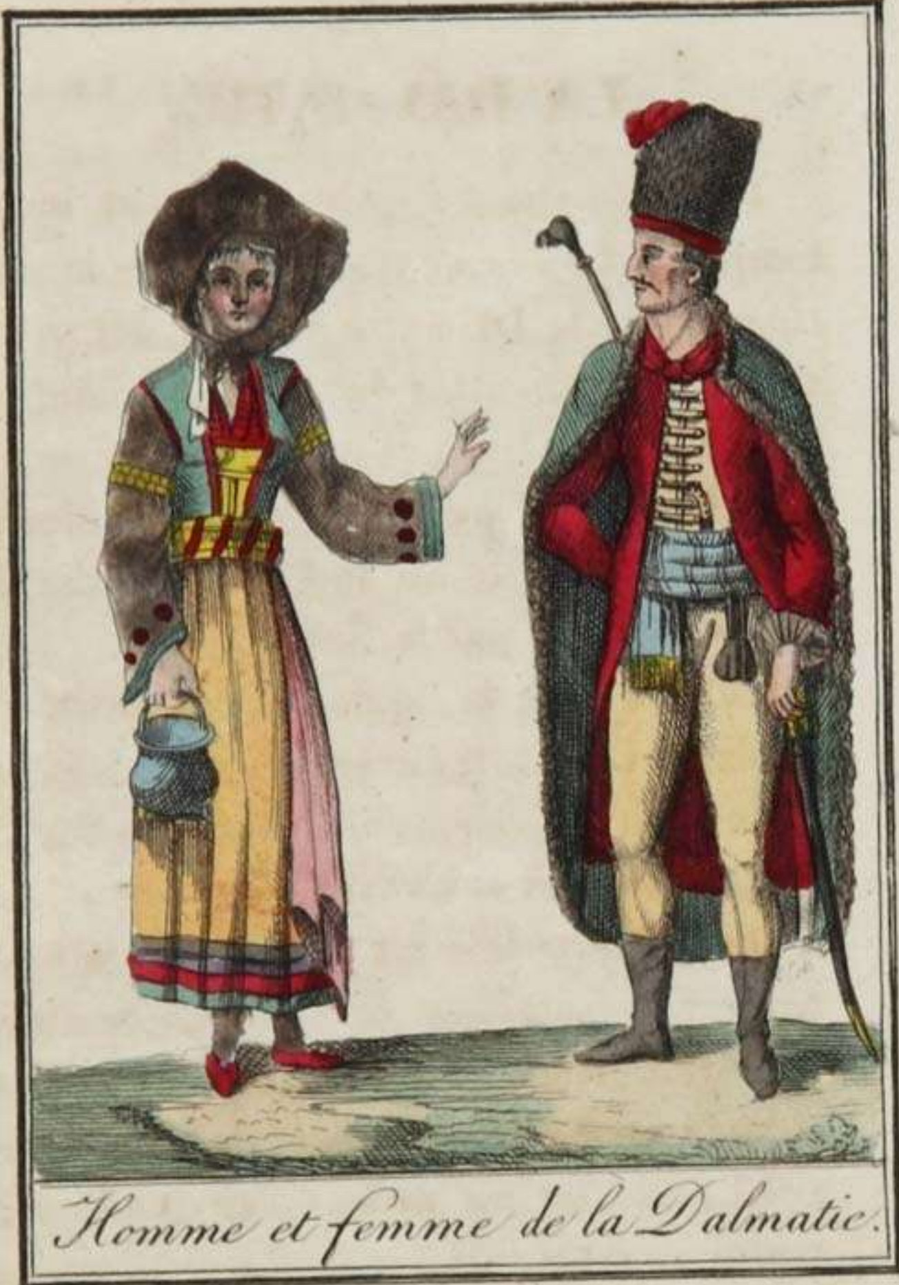
Homme et femme de la Dalmatie.

Raguse était la capitale d'une petite république dont le gouvernement aristocratique était modelé sur celui de Venise , à l'exception que son recteur changeait tous les deux mois. Elle est peu considérable ; à peine y compte-t-on 6000 âmes. Son port est bien défendu. En 1667, elle fut presque abîmée par un tremblement de terre ; et en 1763 , elle fut en proie à l'anarchie. Son territoire est stérile. — Spalatro , regardée