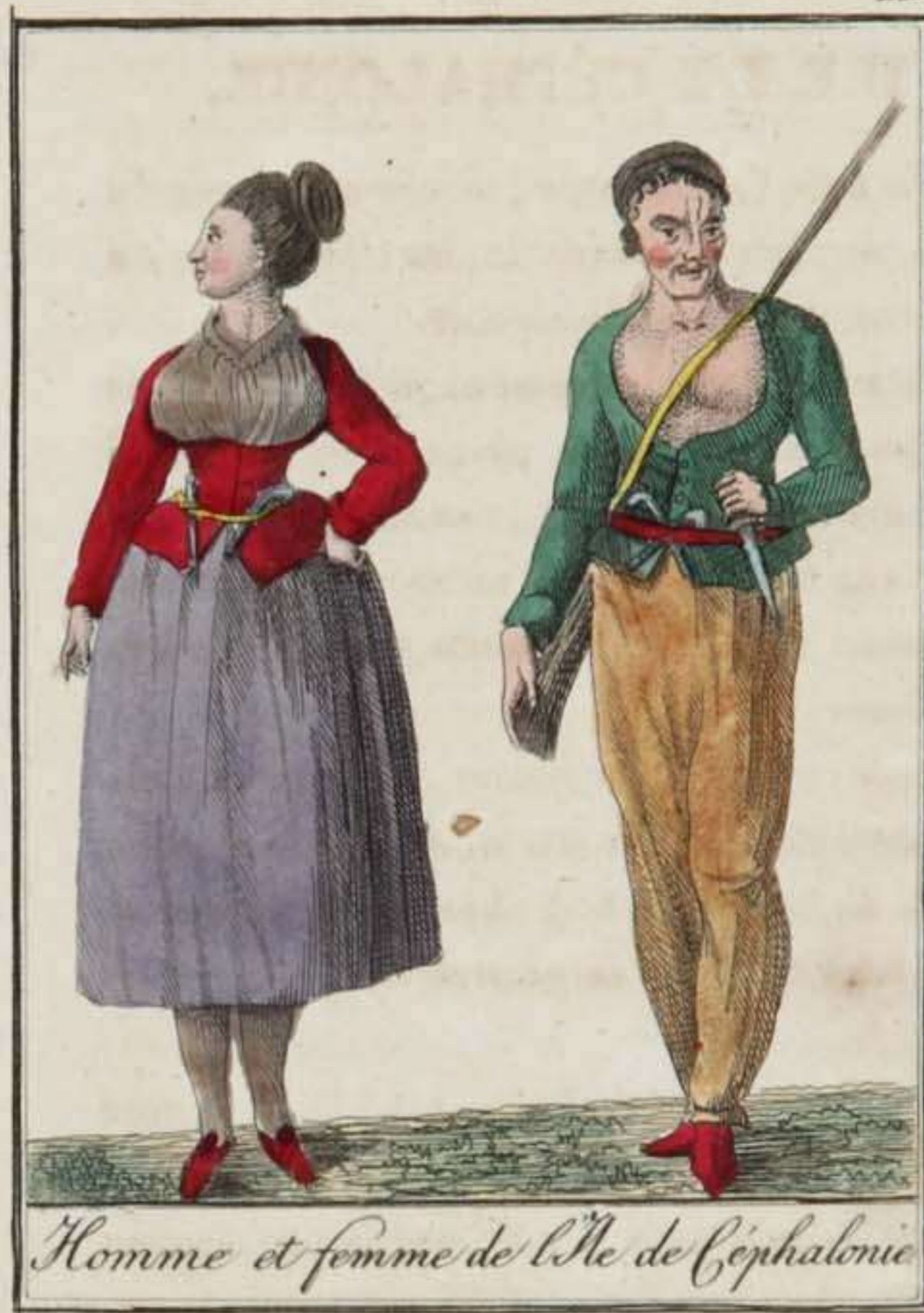
Homme et femme de l'Île de Céphalonie

Argostoli , sa capitale, est bâtie sur une baie qui s'étend au sud de l'île. Sa situation est aussi malsaine que désagréable, et rien n'annonce dans l'aspect de cette ville la ca-