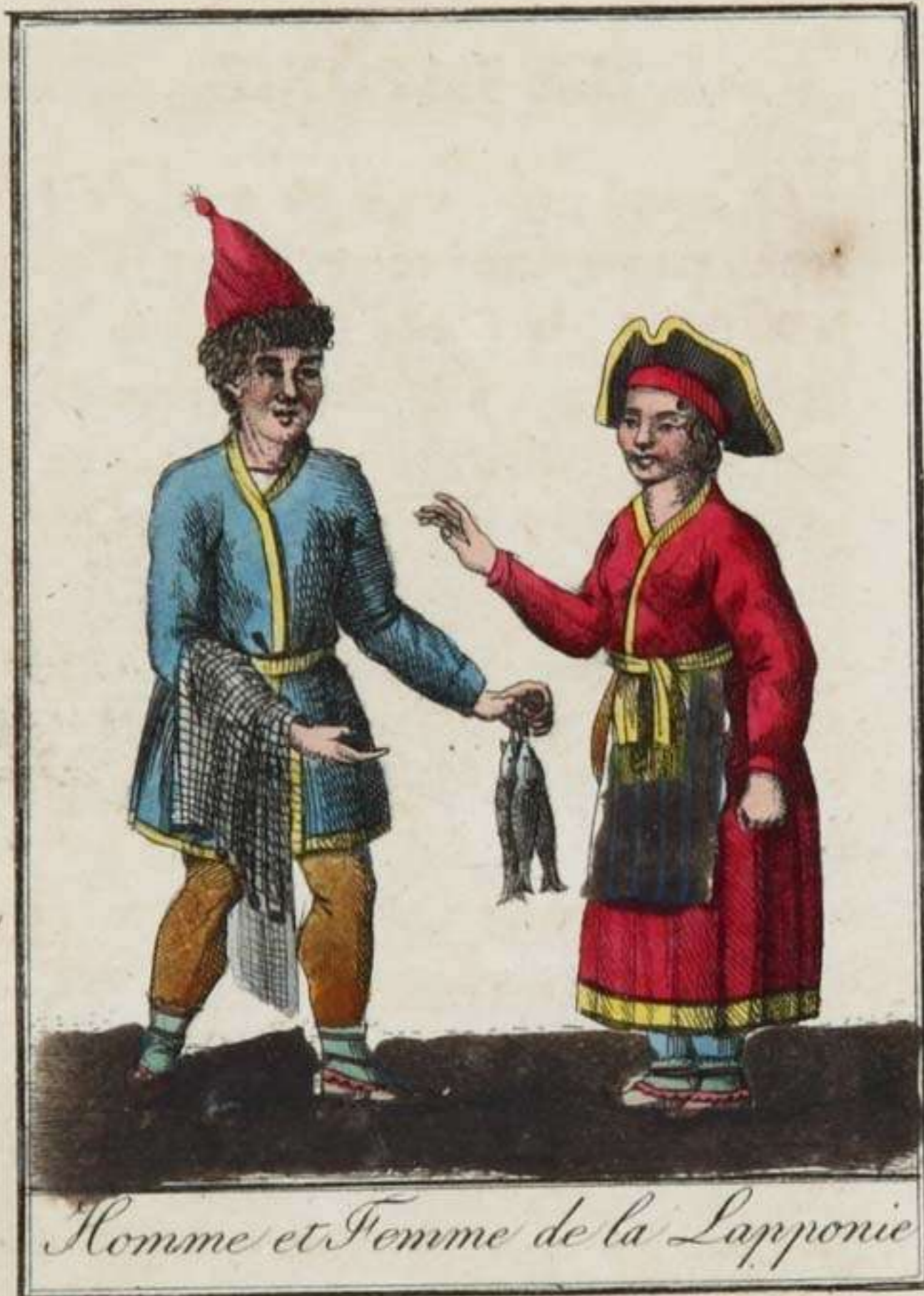
Homme et Femme de la Laponie