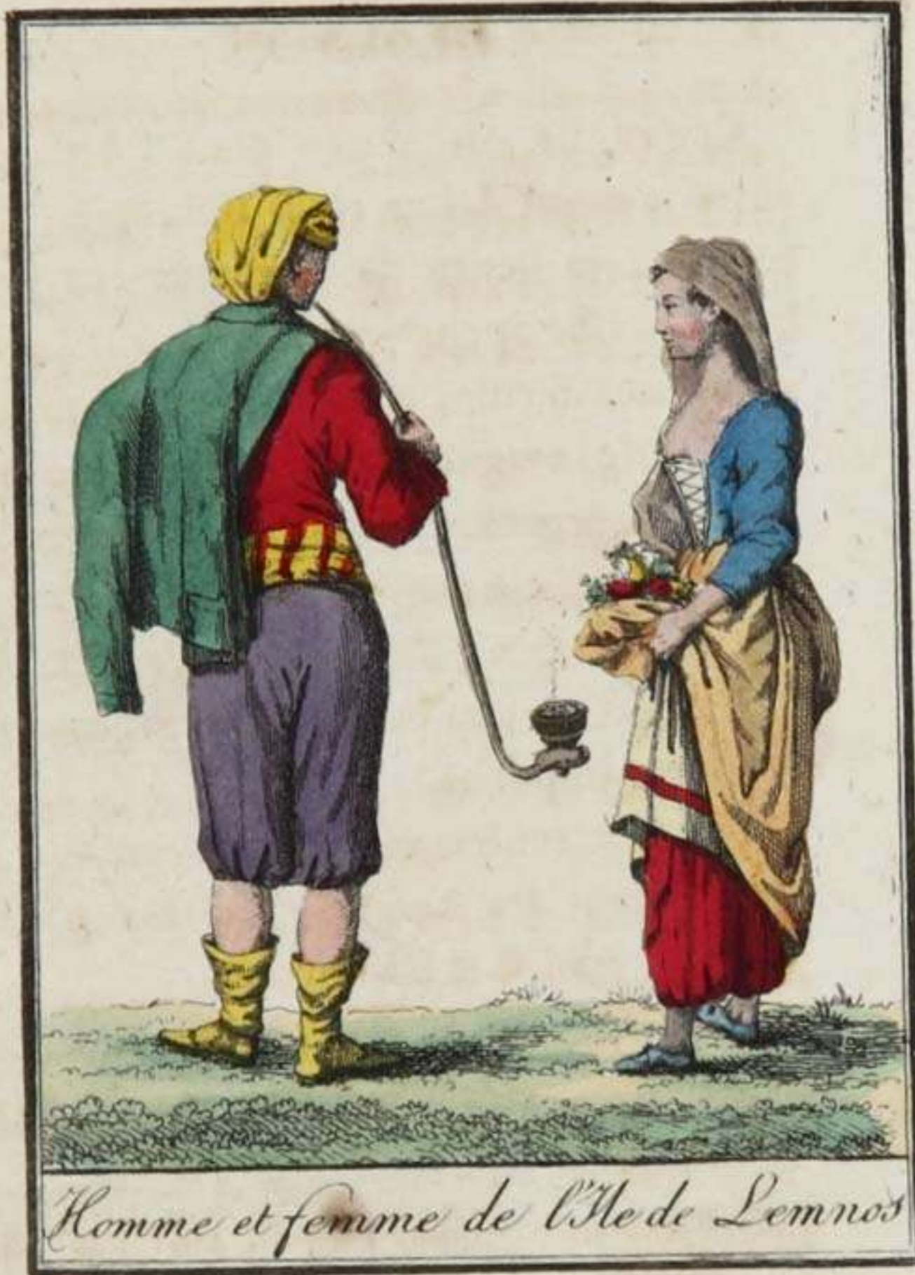
Homme et femme de l'Île de Lemnos