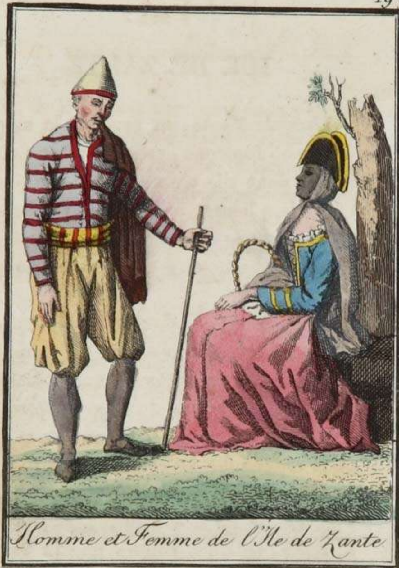
Homme et Femme de l'Île de Zante

Cette île est la Zacynthe des anciens. Plusieurs fois conquise par les Romains, elle passa successivement sous la domination des souverains du Bas-Empire, de princes particuliers, des Ottomans, et enfin de la république de Venise, à qui ceux-ci la cédèrent. A son tour, Venise céda, en 1798, cette île à la France, qui, l'année suivante, se la vit enlever par les Russes. Elle a été rendue à la France par le traité