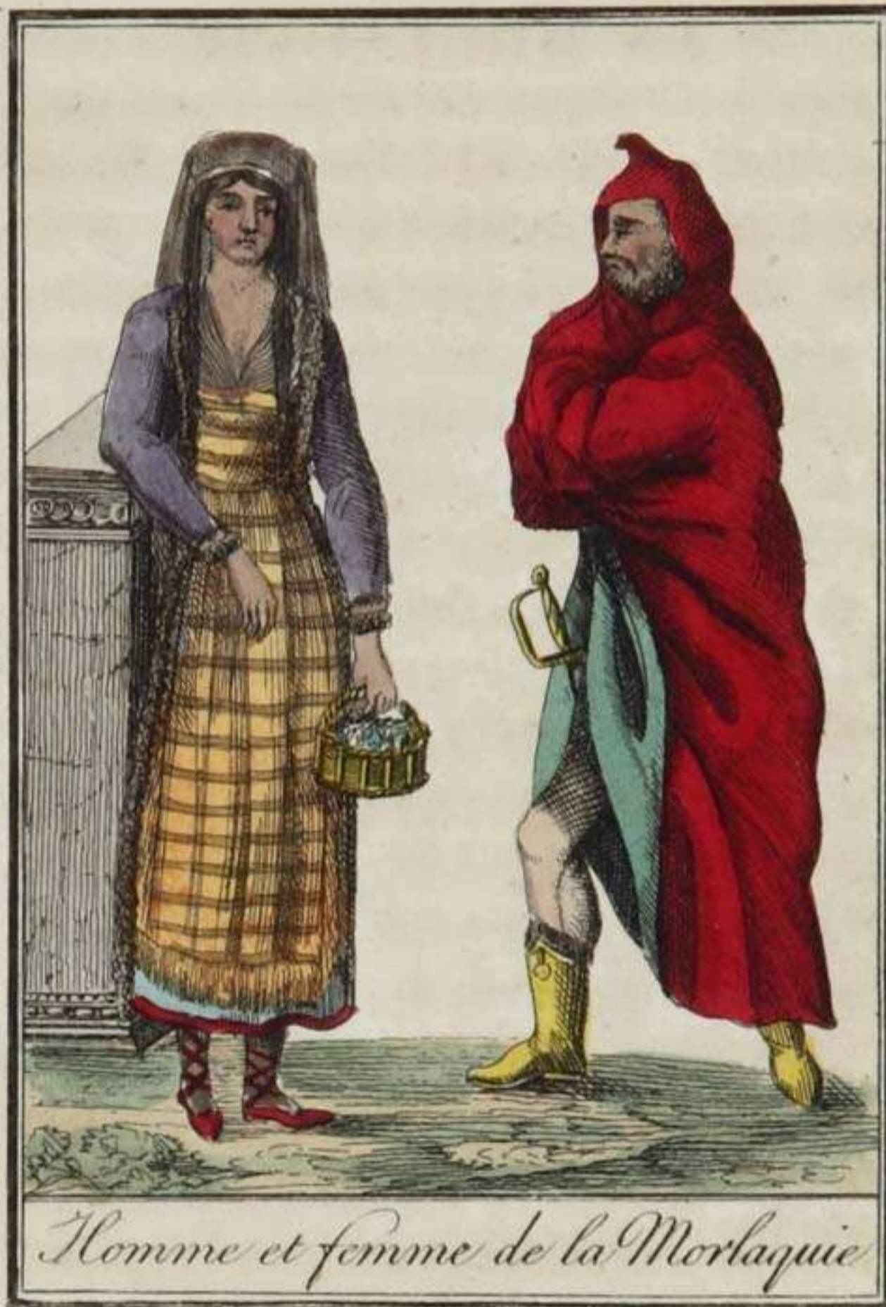
Homme et femme de la Morlaquie

Ce peuple, dont on rapporte l'origine aux Illyriens, qui furent si difficilement subjugués par les Romains, et qui même, après leur soumission apparente, fatiguèrent tant de fois ces maîtres du Monde par