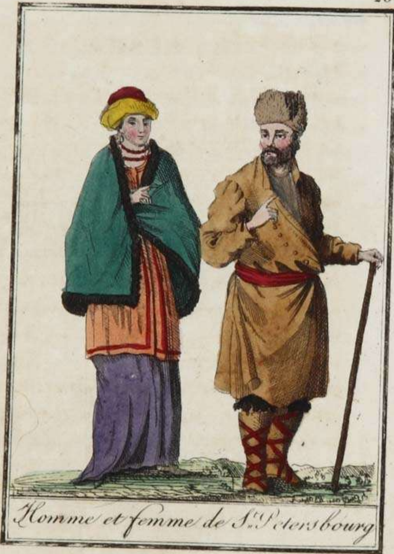
Homme et femme de S t Petersbourg

CET empire , le plus grand du monde , s'étend de la mer Baltique aux extrémités de l'Asie. Sa longueur, de l'ouest à l'est, est d'environ deux mille cent lieues, et sa largeur est, en quelques endroits, de huit cents lieues. Cette étendue prodigieuse renferme une multitude de nations différentes. Jamais la réunion de tant de pays sous une même domination n'eut d'exemple dans les annales du monde; ni l'empire romain dans le temps de sa splendeur, ni la monarchie d'Alexandre, ne parvinrent à cette étendue. La nature a divisé ce pays en deux parties inégales, par la chaîne des monts Ourals qui le traverse du nord au sud. La partie située à l'ouest de l'Oural est la Russie d'Europe, et celle qui est à l'est, est la Russie asiatique.