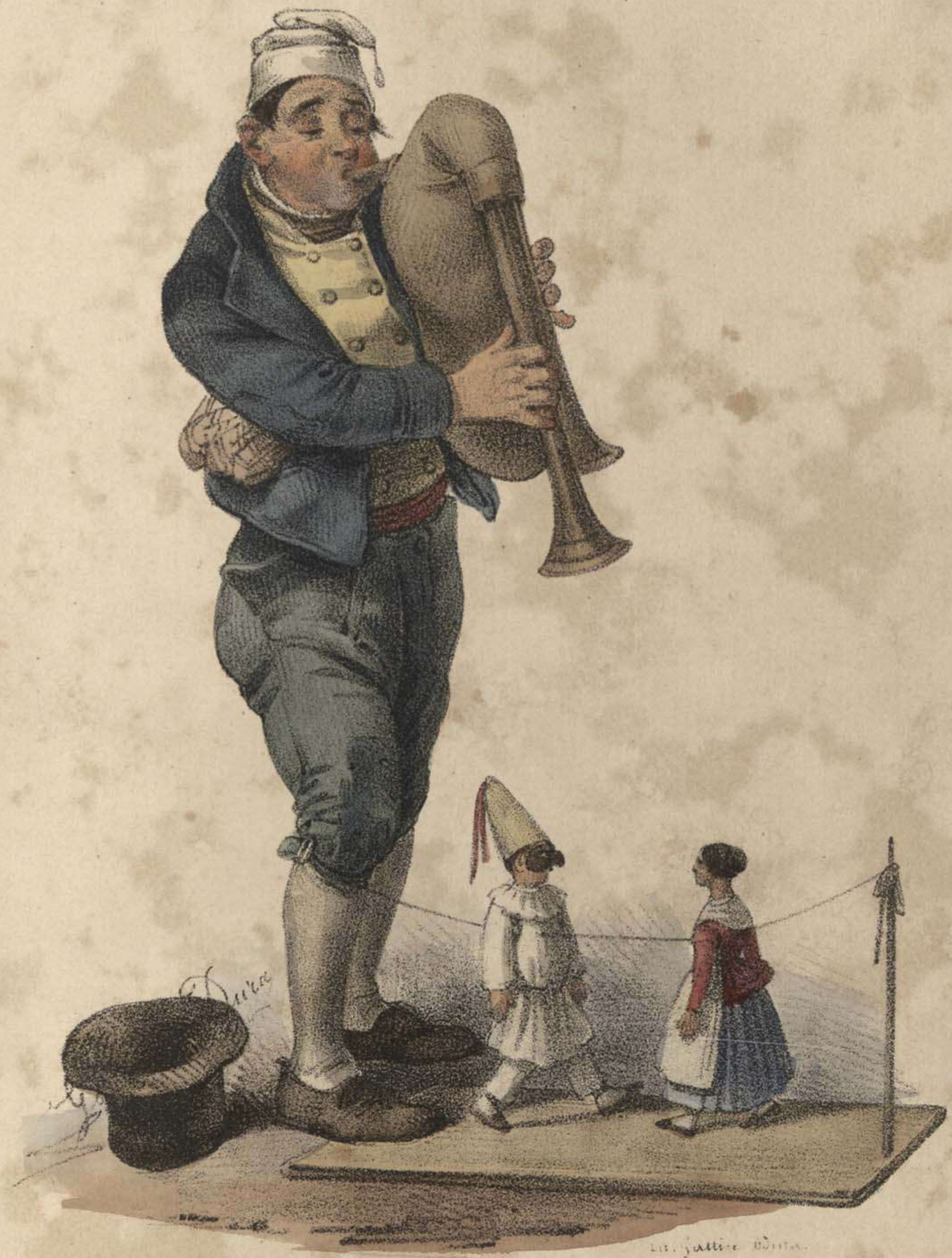
Lampognaro che fa ballare i burattini