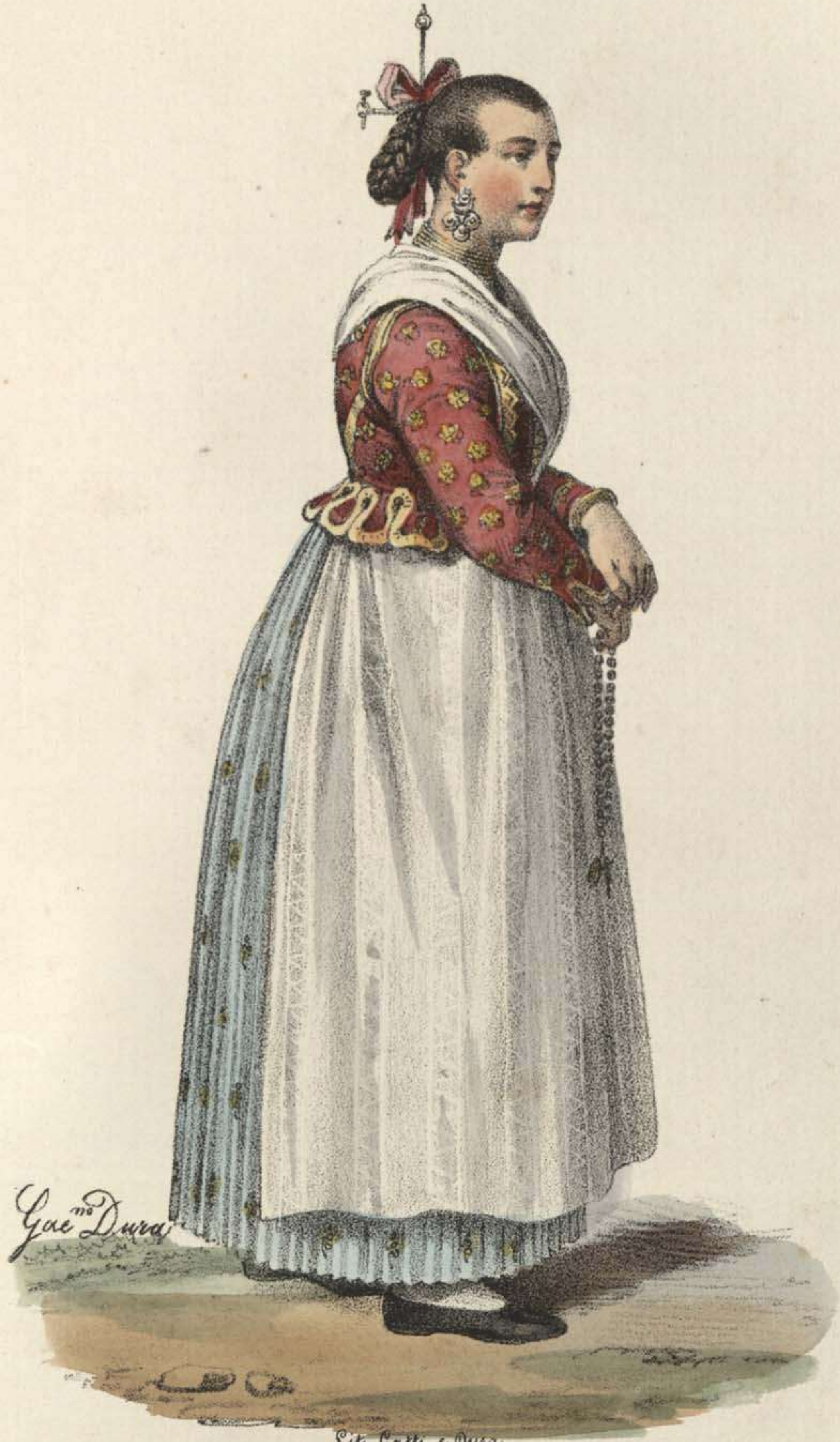
Donna di Sorrento