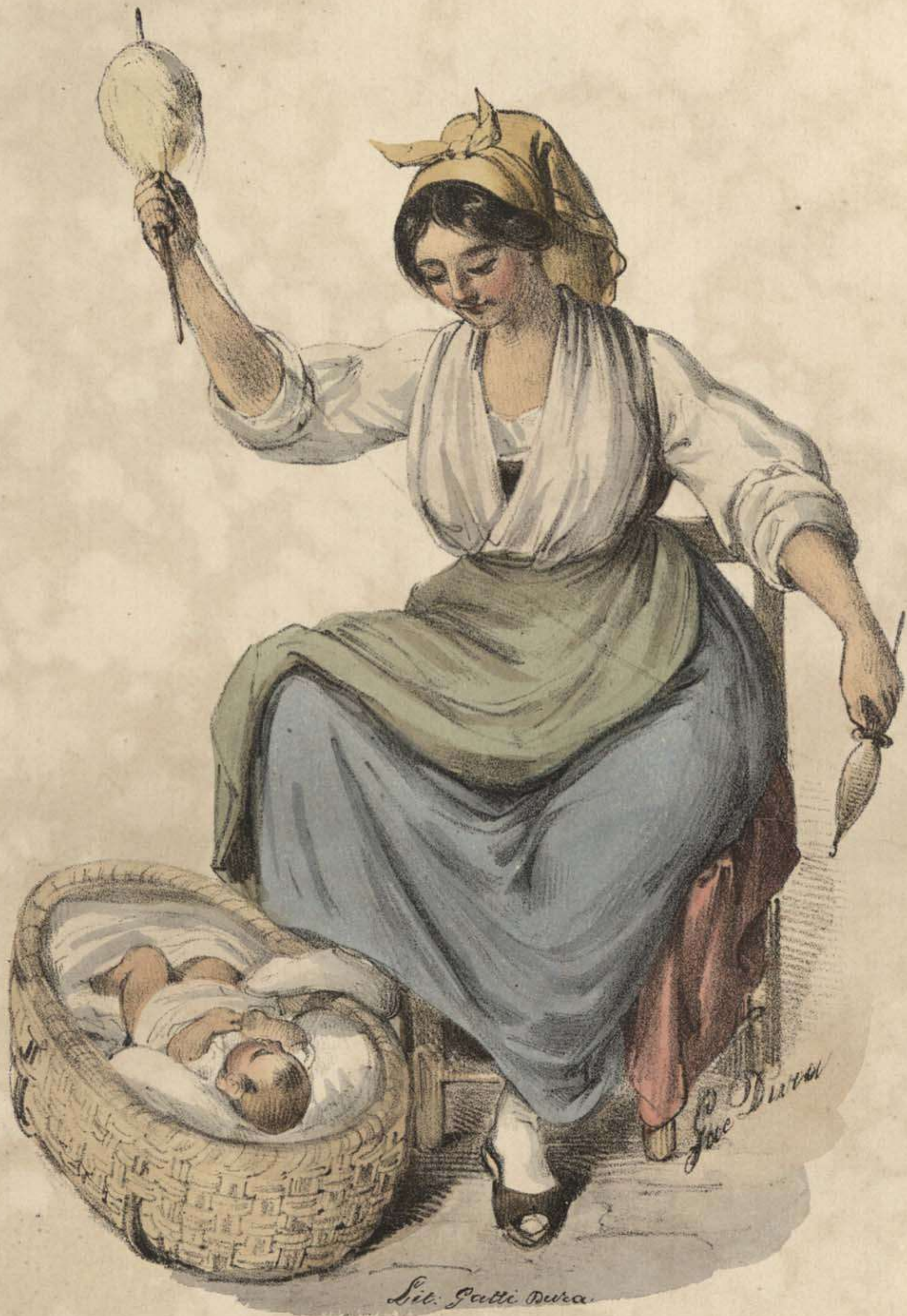
Donna di Calabria