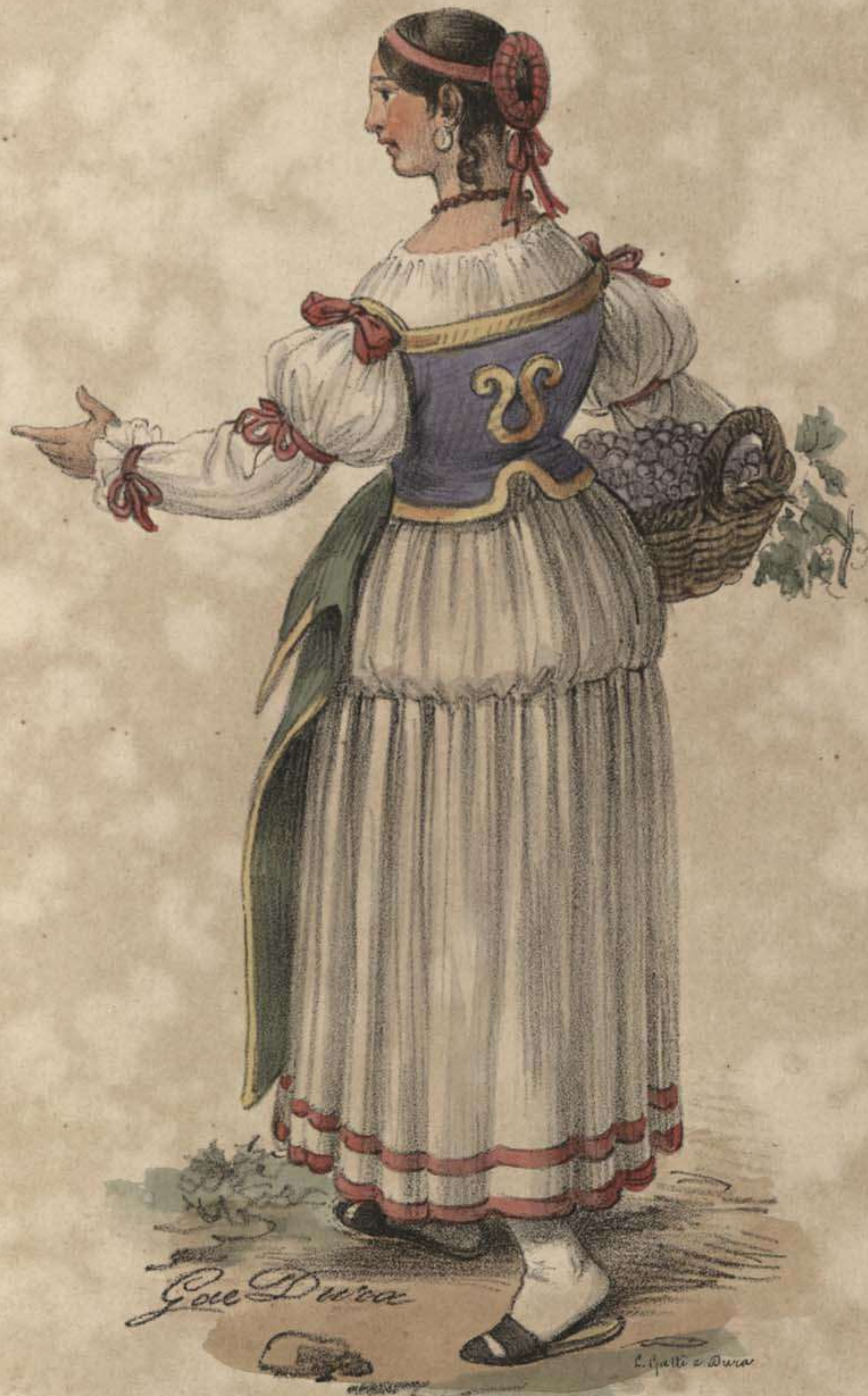
Donna di Egitto