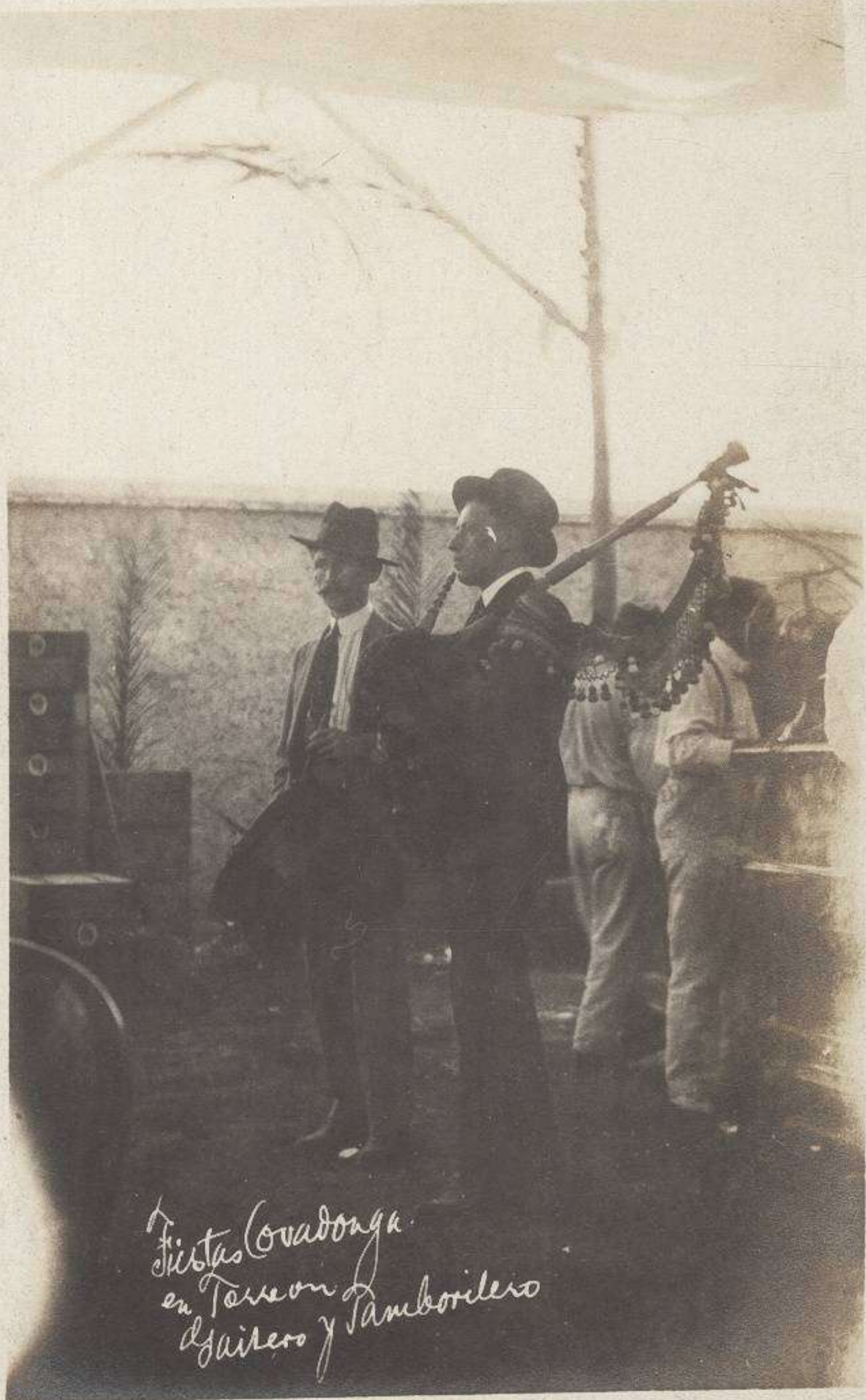
Fiestas Covadonga. en Terron de Gaitero y Tamborilero