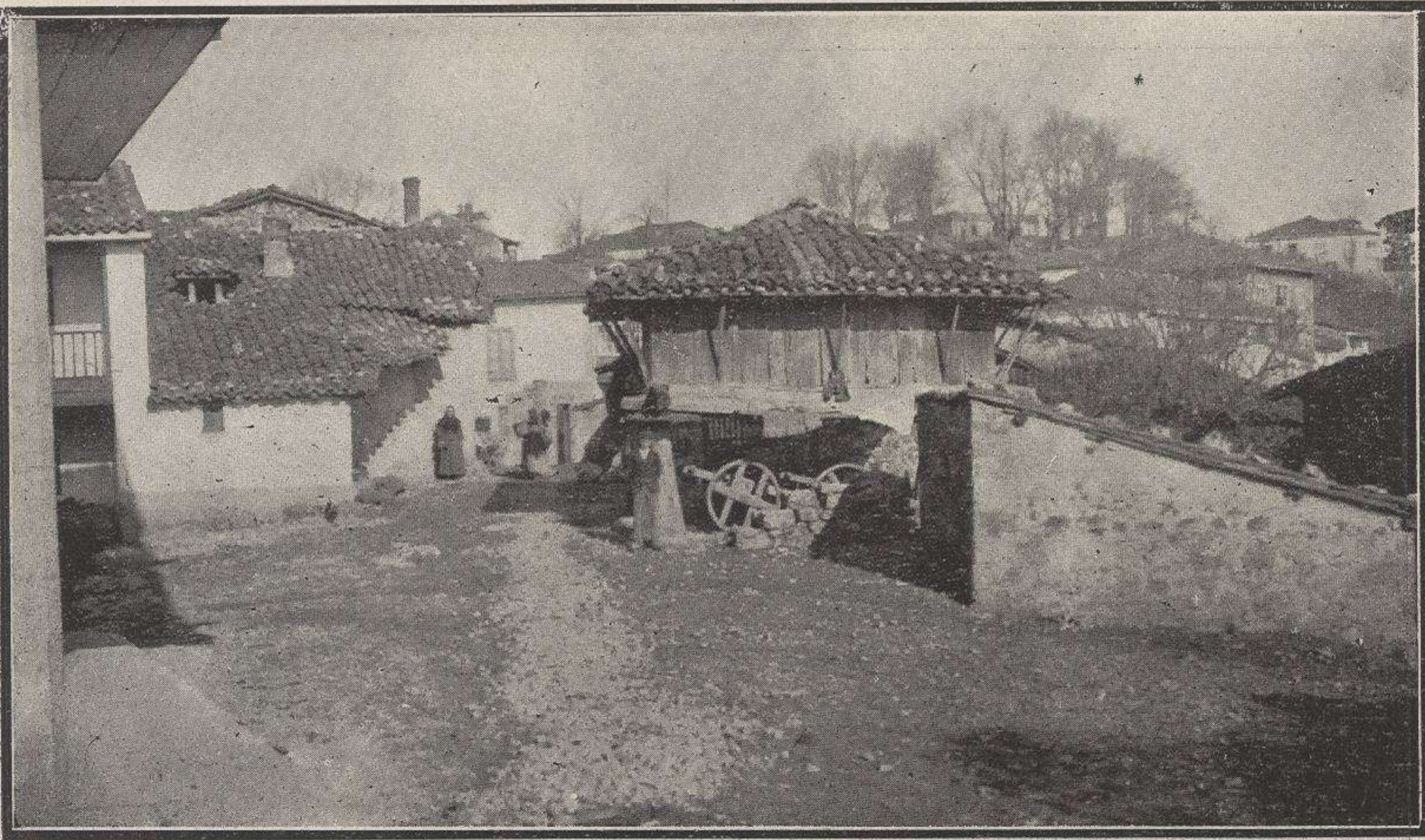
Tomando el Sol.