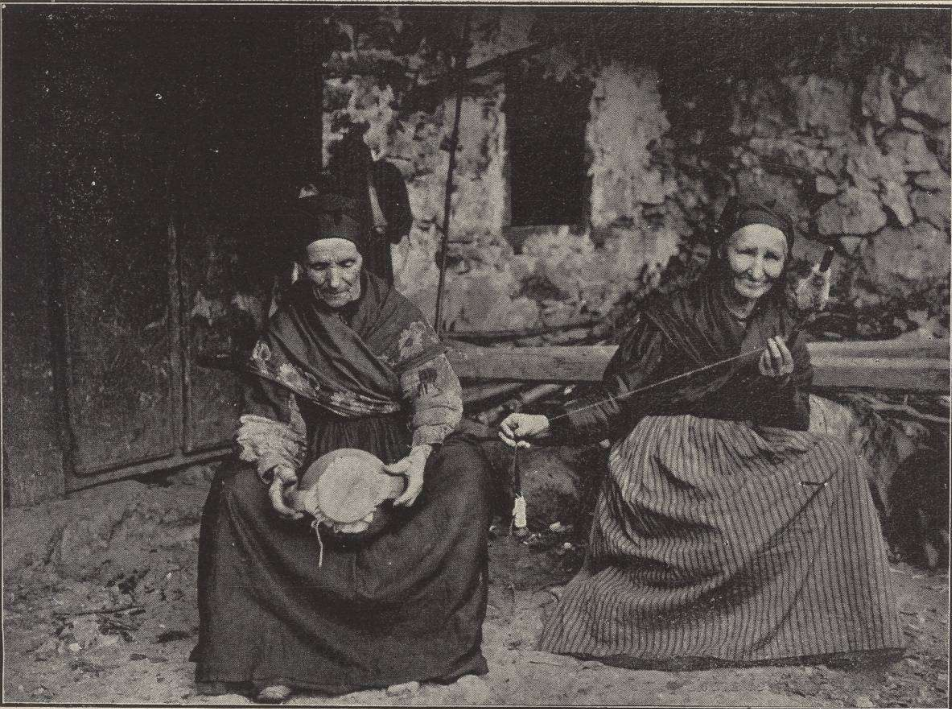
"Mazando y filando"