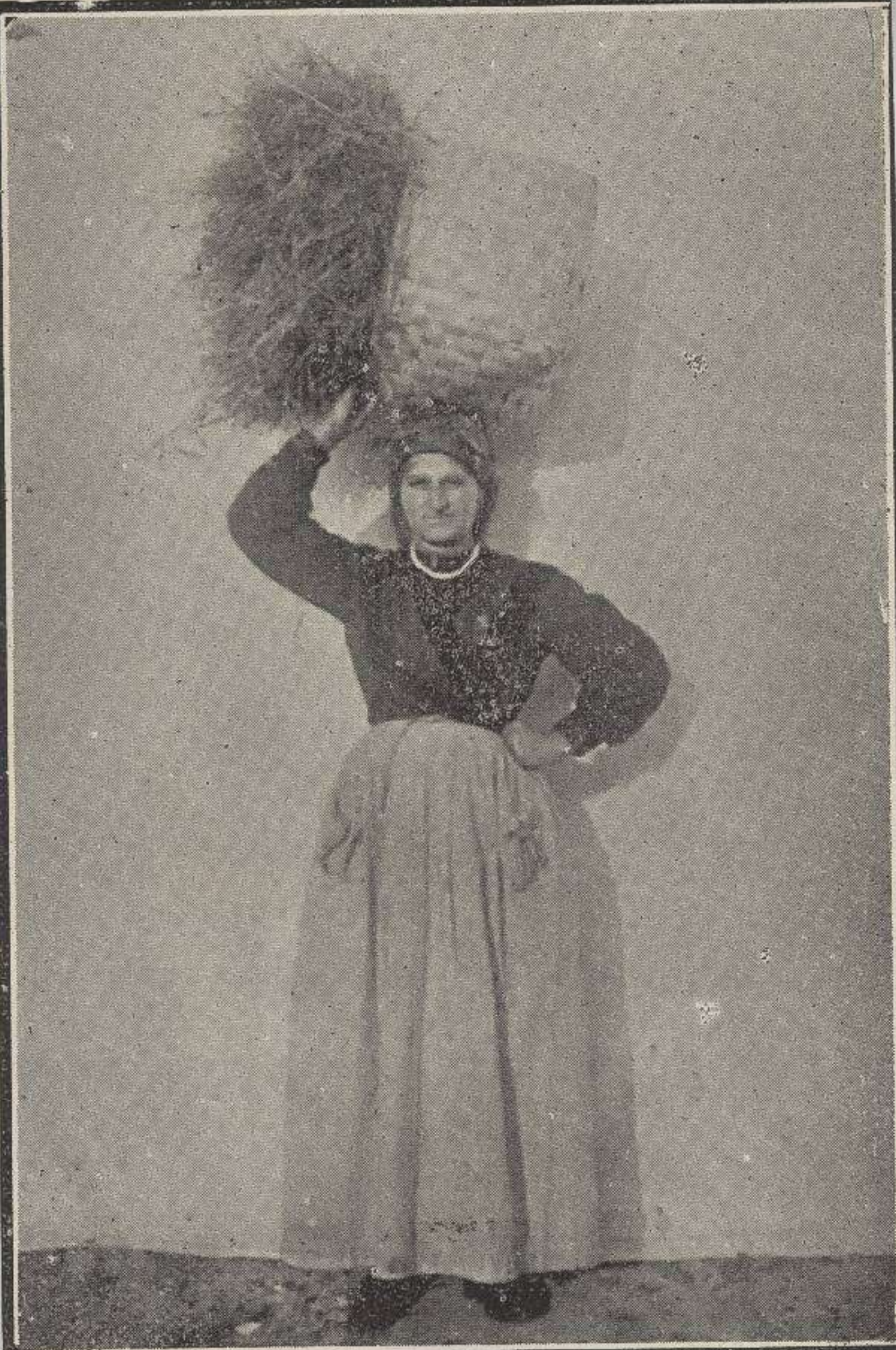
Una dama del Occidente.