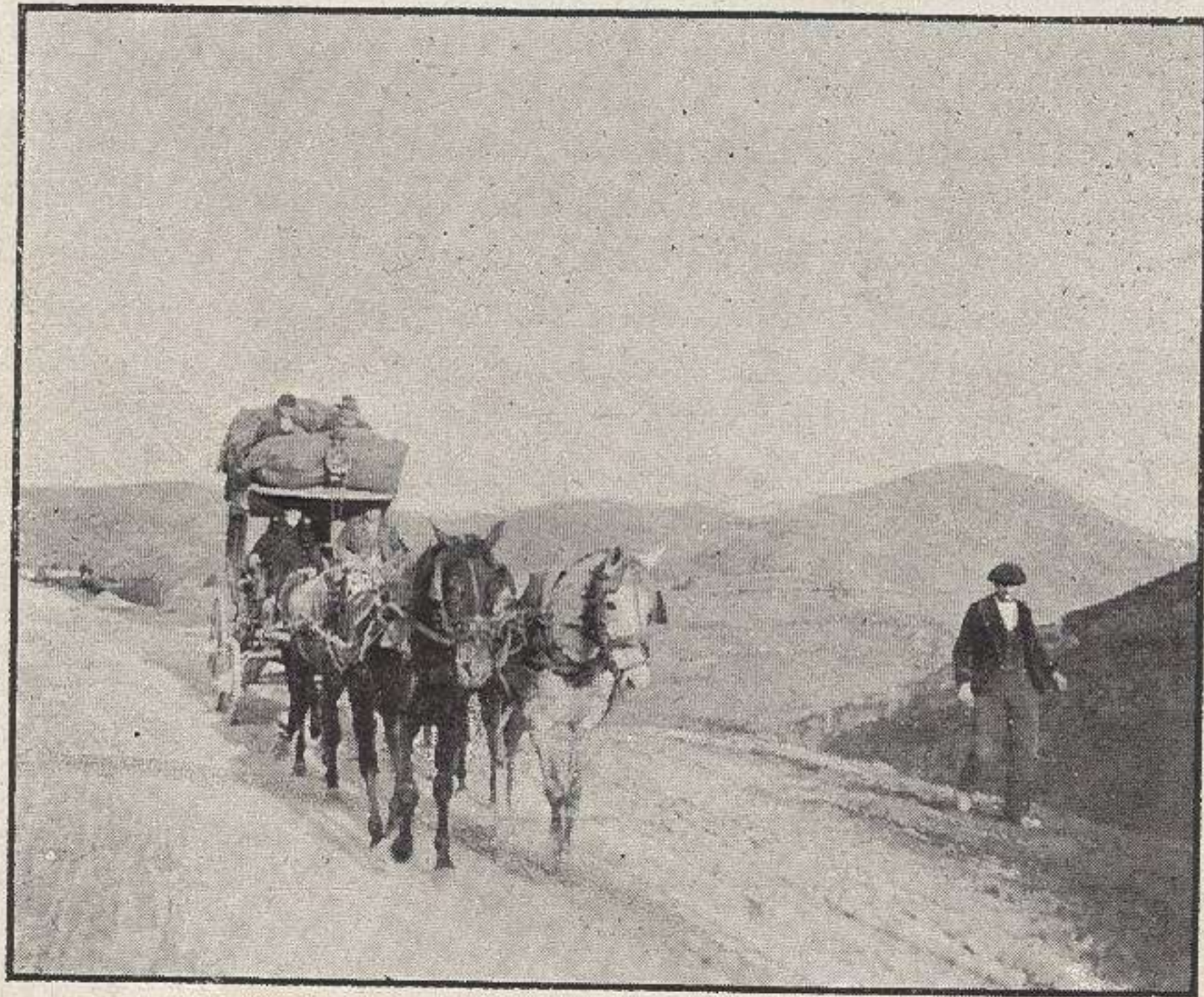
LA DILIGENCIA EN LA CUESTA DE LA ESPINA