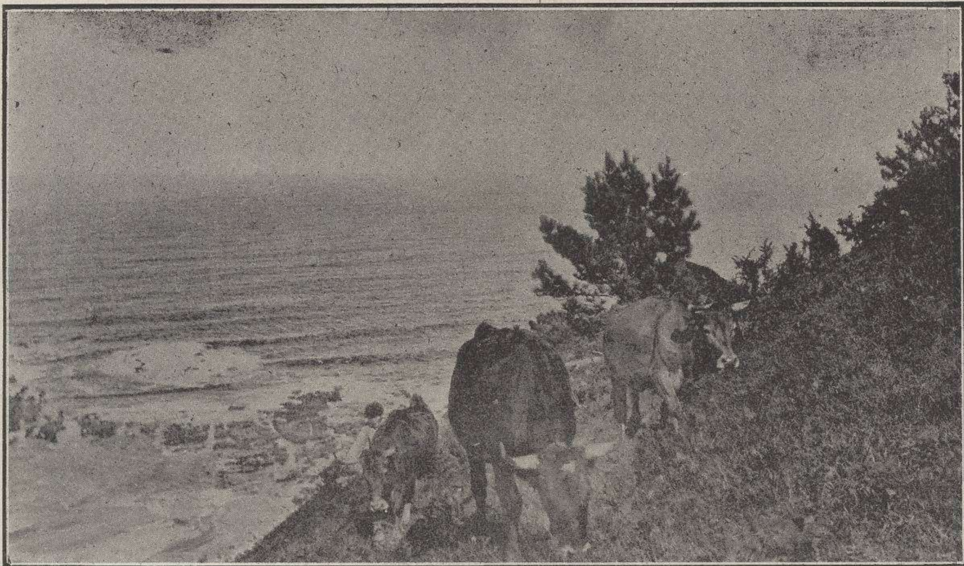
Llindando el ganado.