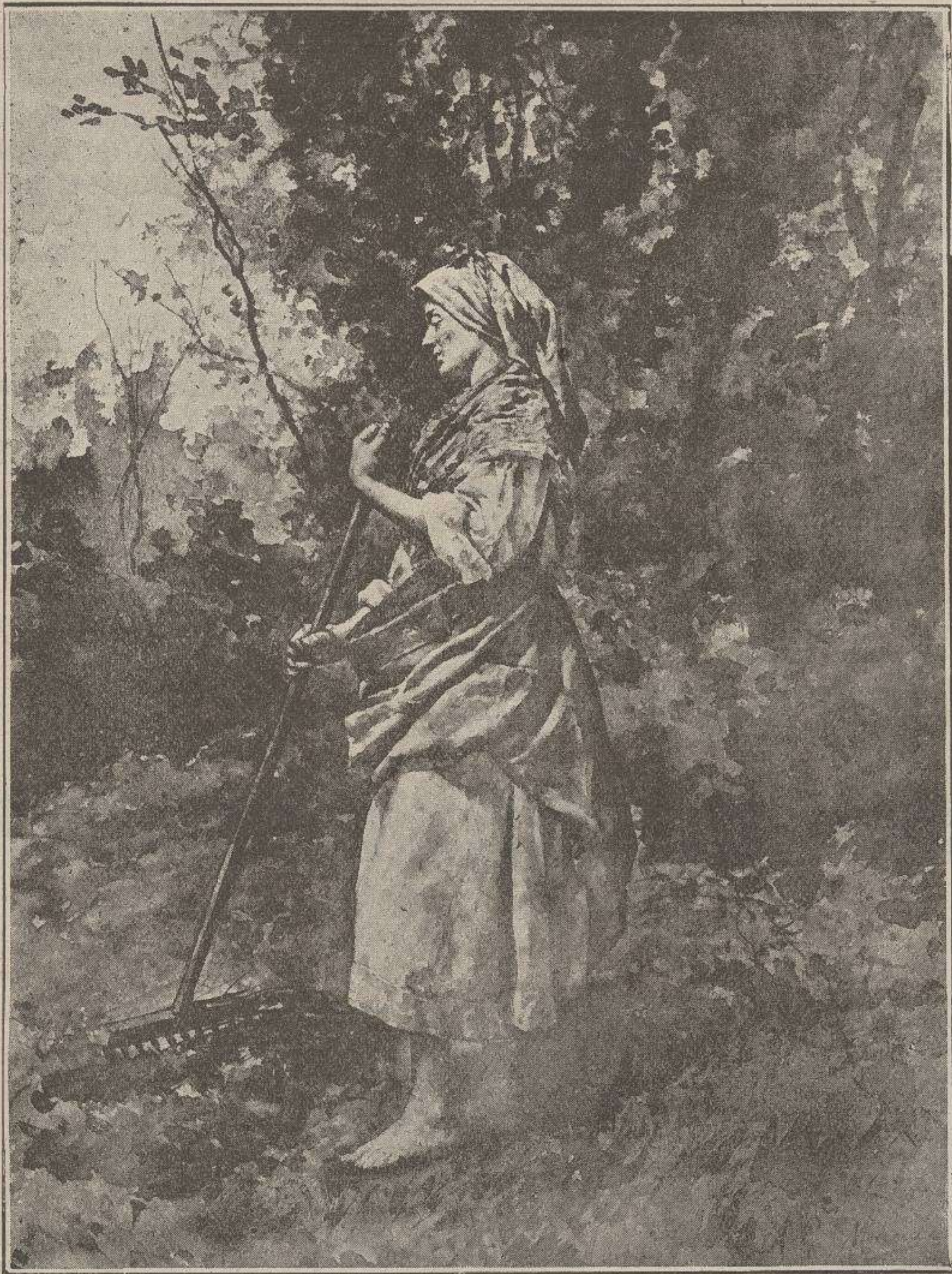
Coyendo la fueya.