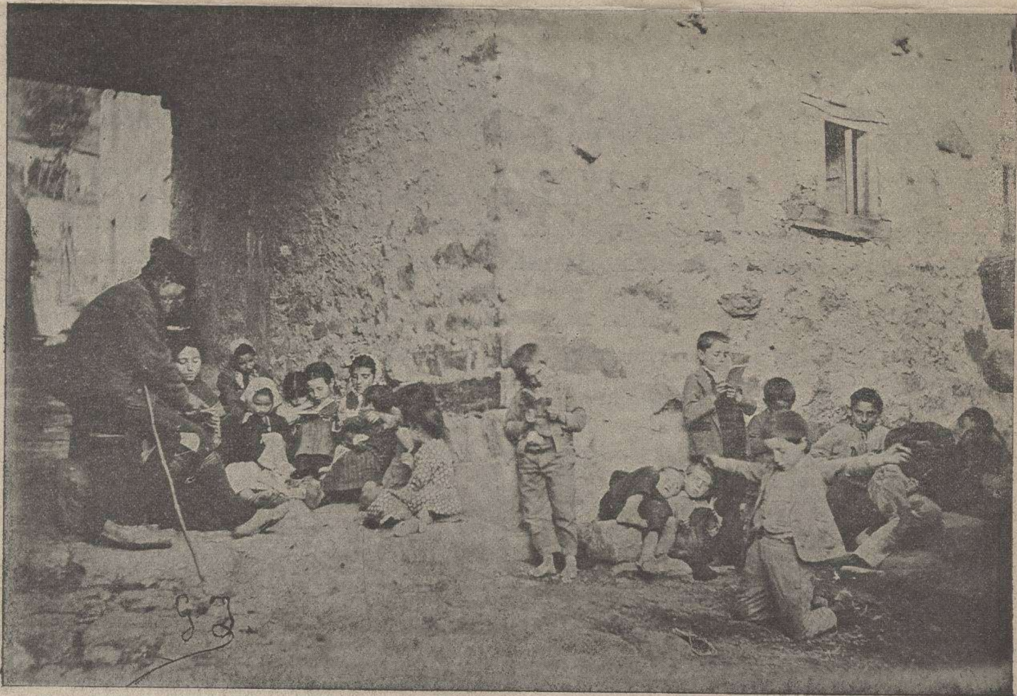
UNA ESCUELA ASTURIANA