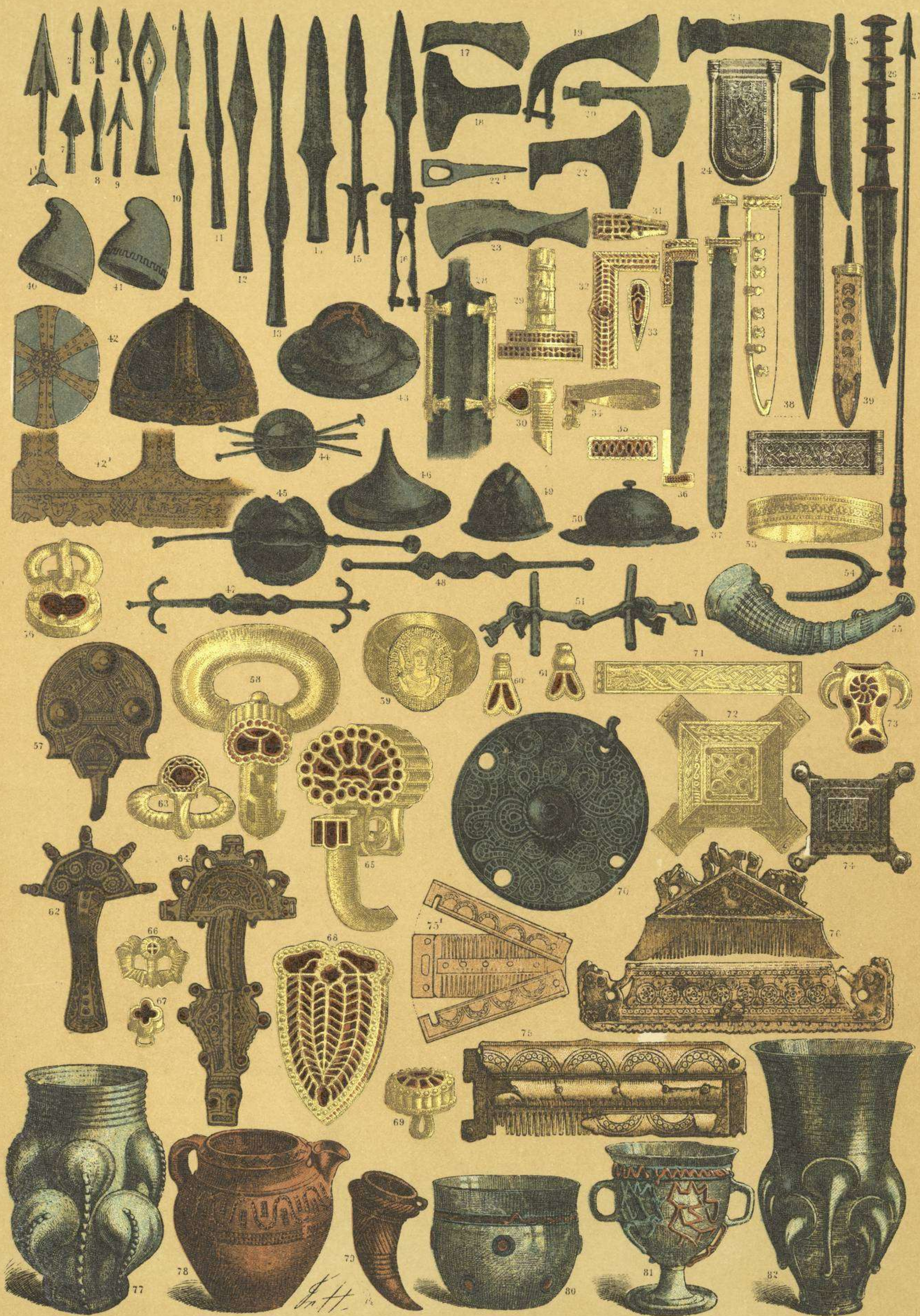
EDAD MEDIA.-ARMAS, ADORNOS Y VASIJAS DE LOS FRANCO DEL TIEMPO DE LOS MEROVINGIOS