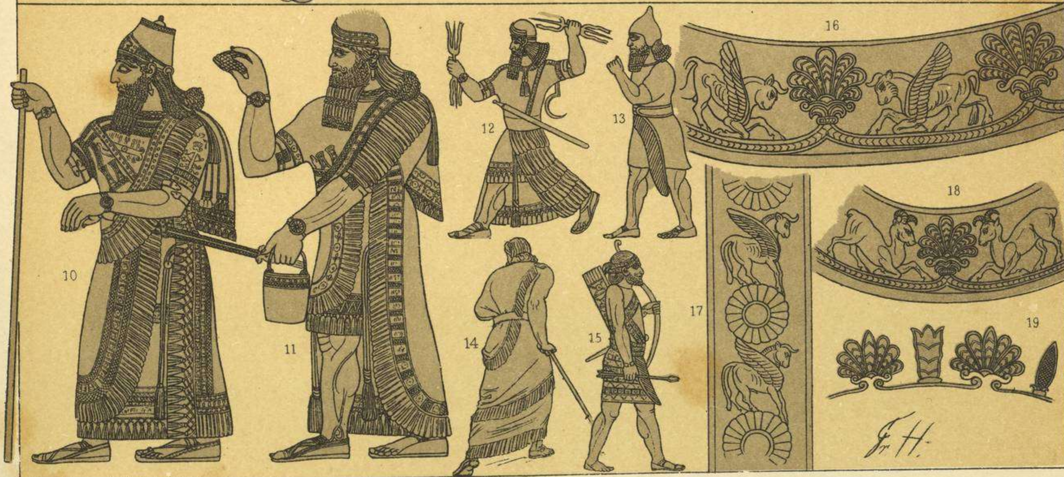
EDAD ANTIGUA.-TRAJES, ARMAS Y MÁQUINAS DE GUERRA DE LOS BABILONIOS Y ASIRIOS