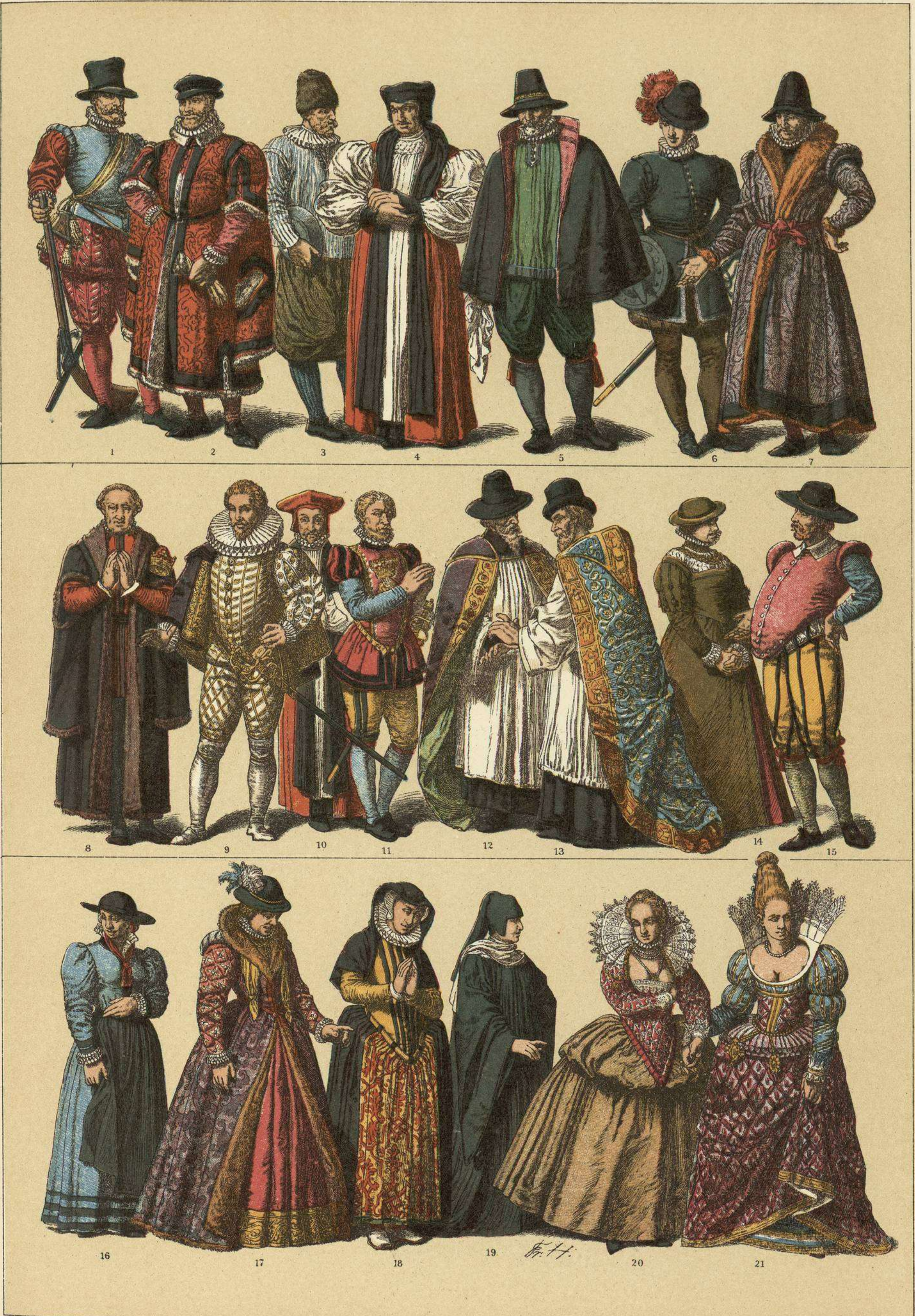
EDAD MODERNA. - TRAJES DE LOS INGLESES EN LA SEGUNDA MITAD DEL SIGLO XVI