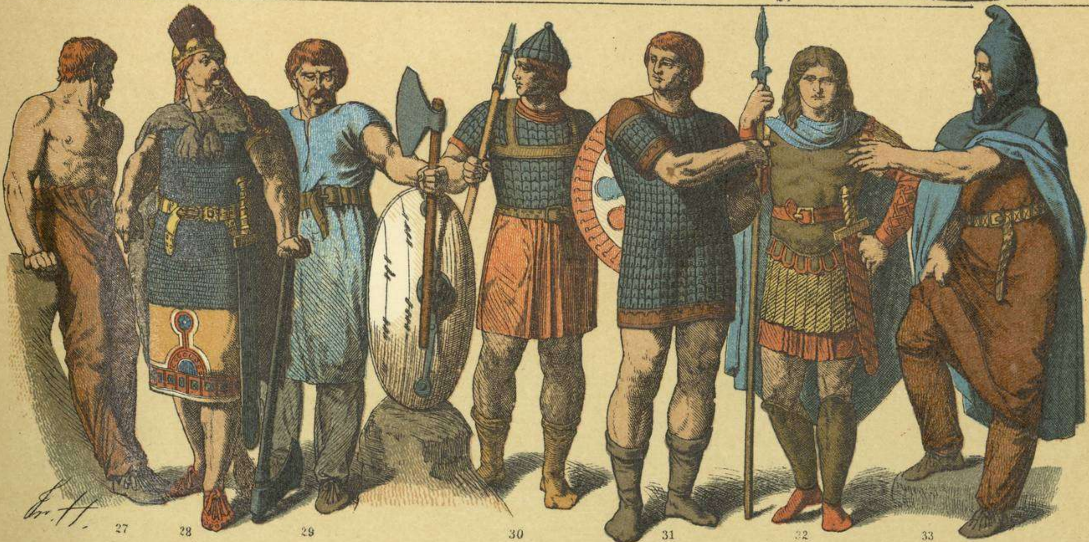
EDAD MEDIA.-TRAJES, ARMAS Y ADORNOS DE LOS LONGOBARDOS Y DE LOS FRANCO DEL TIEMPO DE LOS MEROVINGIOS