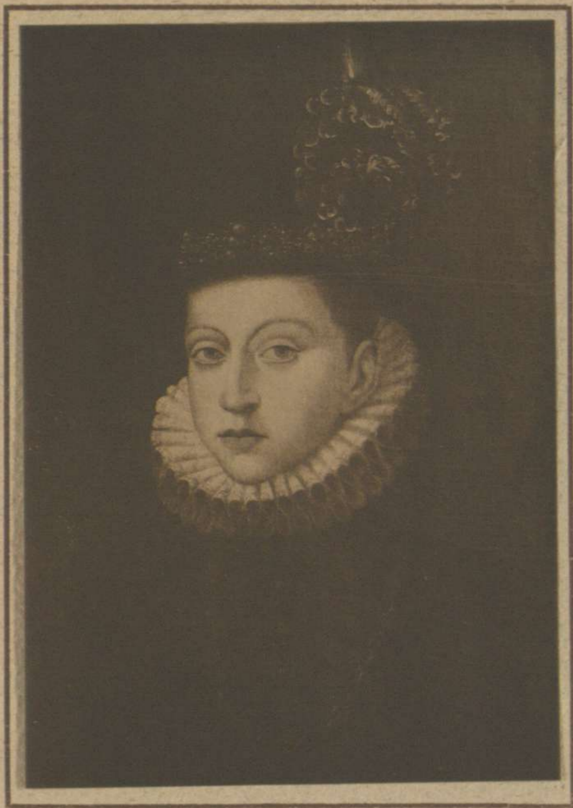
FELIPE III (PROPIEDAD DEL SEÑOR MARQUÉS DE CERRALBO)