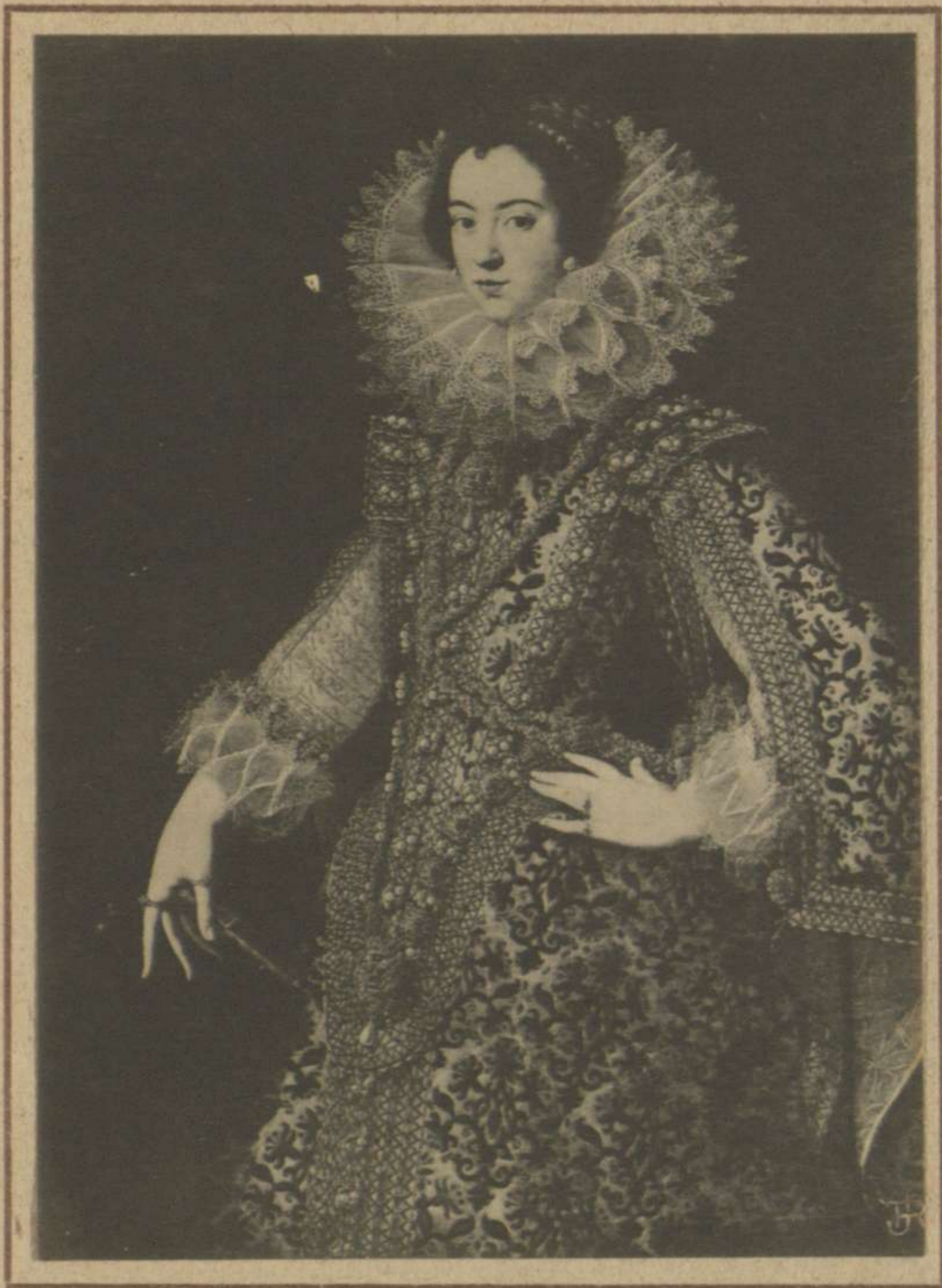
DOÑA ISABEL DE BORBÓN, O DE FRANCIA 29 (FALSAMENTE ATRIBUIDO A PANTOJA. AUTOR POSIBLE: CATALINA CANTONI)