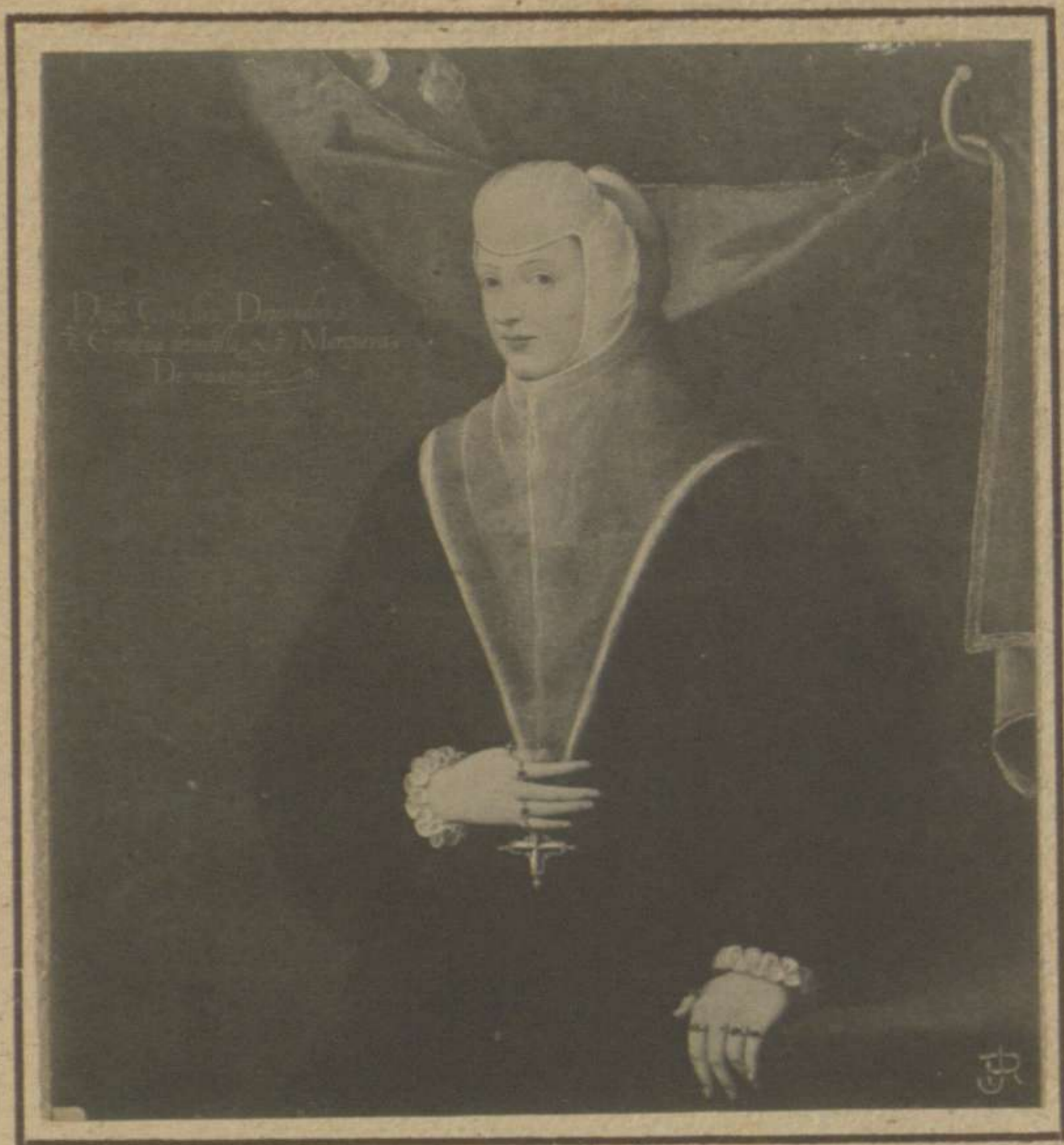
CONDESA DE TENDILLA (COLECCIÓN MARQUÉS DE CASA TORRES)