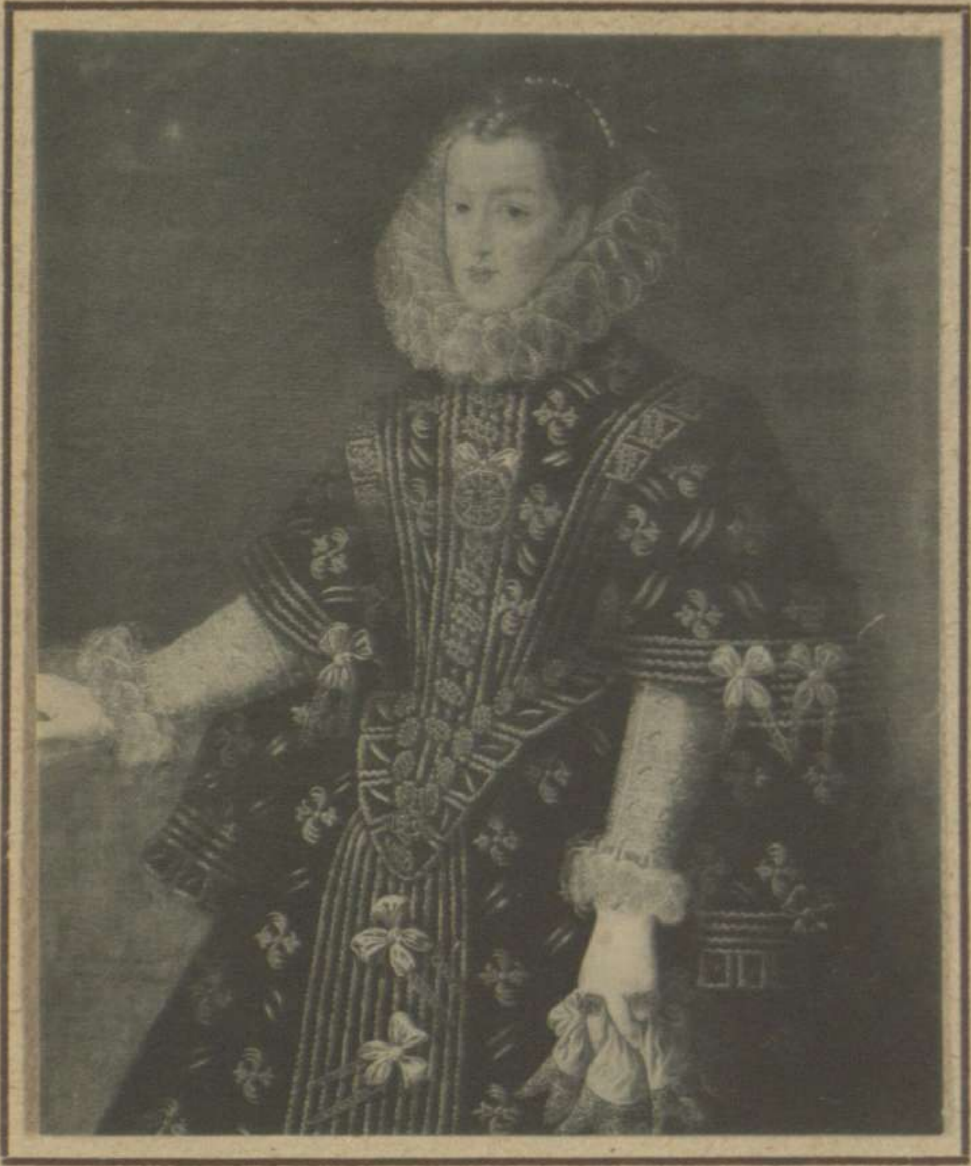
PRINCESA DE ANGLONA