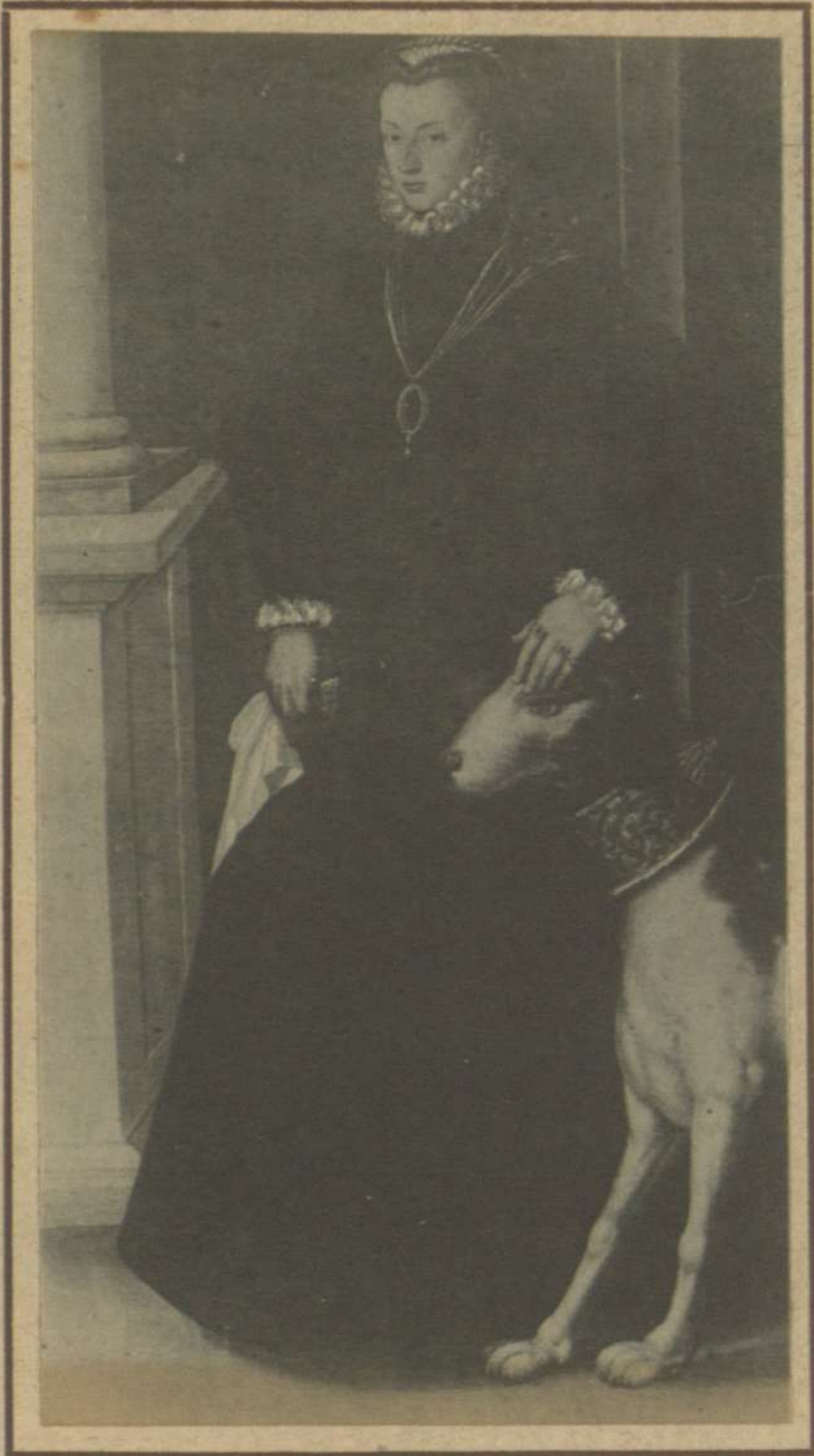
RETRATO DE UNA DAMA (PROPIEDAD DEL SEÑOR DUQUE DE MEDINACELI)