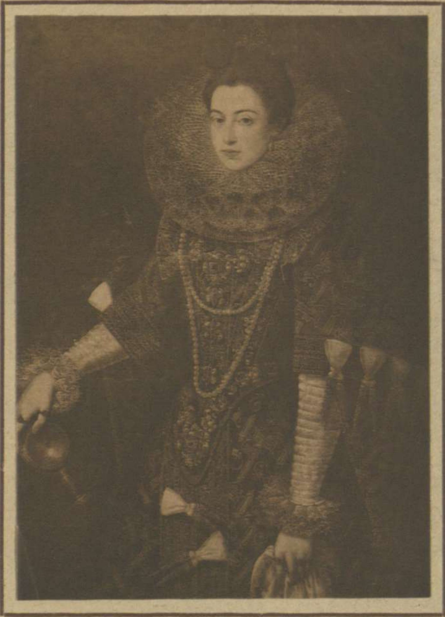
RETRATO DE UNA DAMA