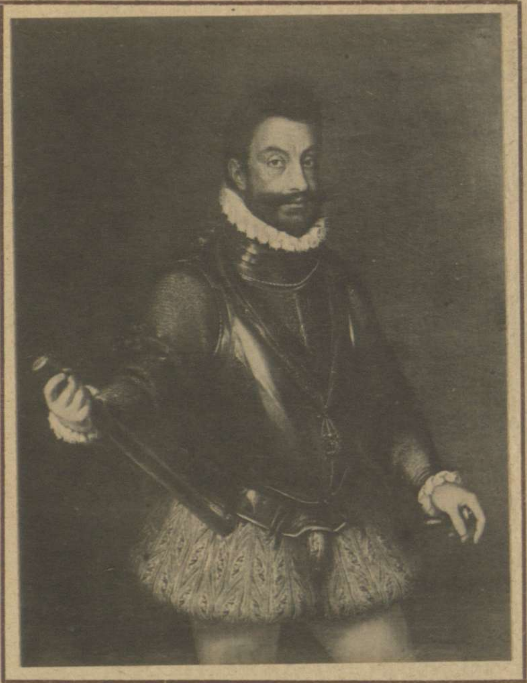
ALEJANDRO FARNESIO (SALAS CAPITULARES DE EL ESCORIAL)