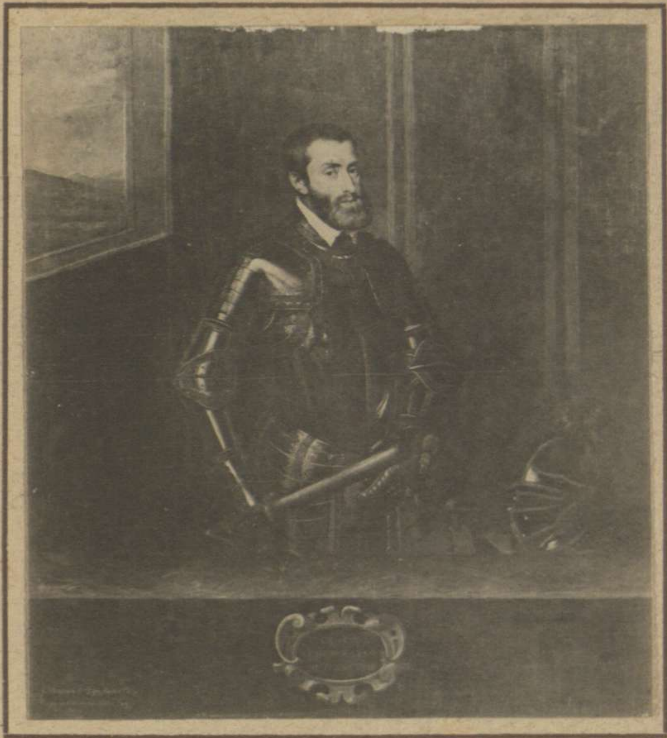
CARLOS V (EL ESCORIAL)