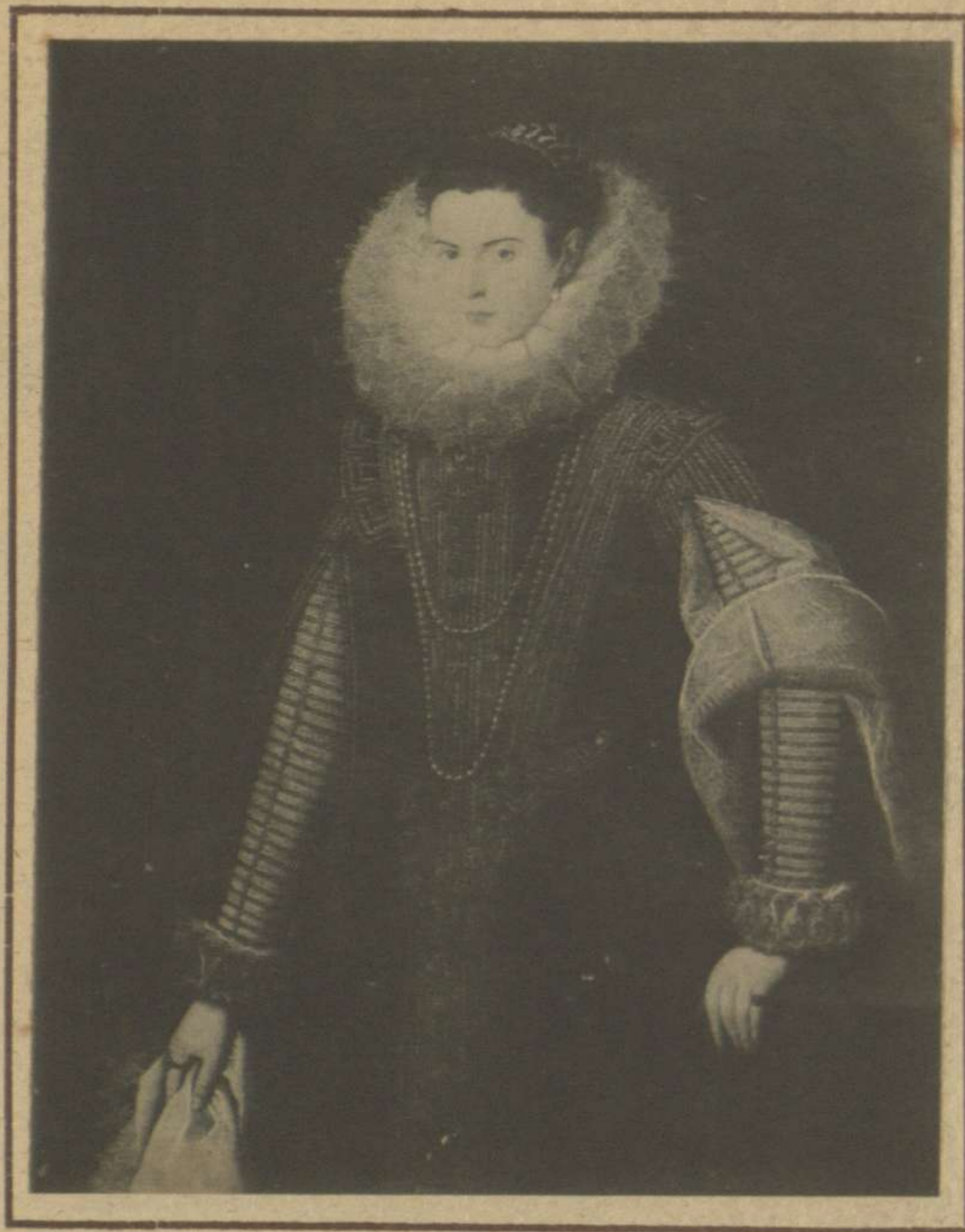
RETRATO DE DAMA (PROPIEDAD DEL SEÑOR DUQUE DE SAN CARLOS)