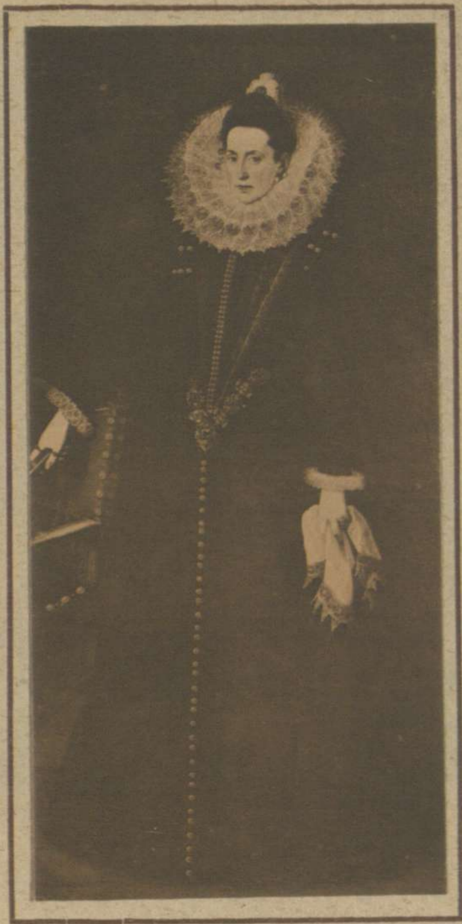
RETRATO DE UNA DAMA 11