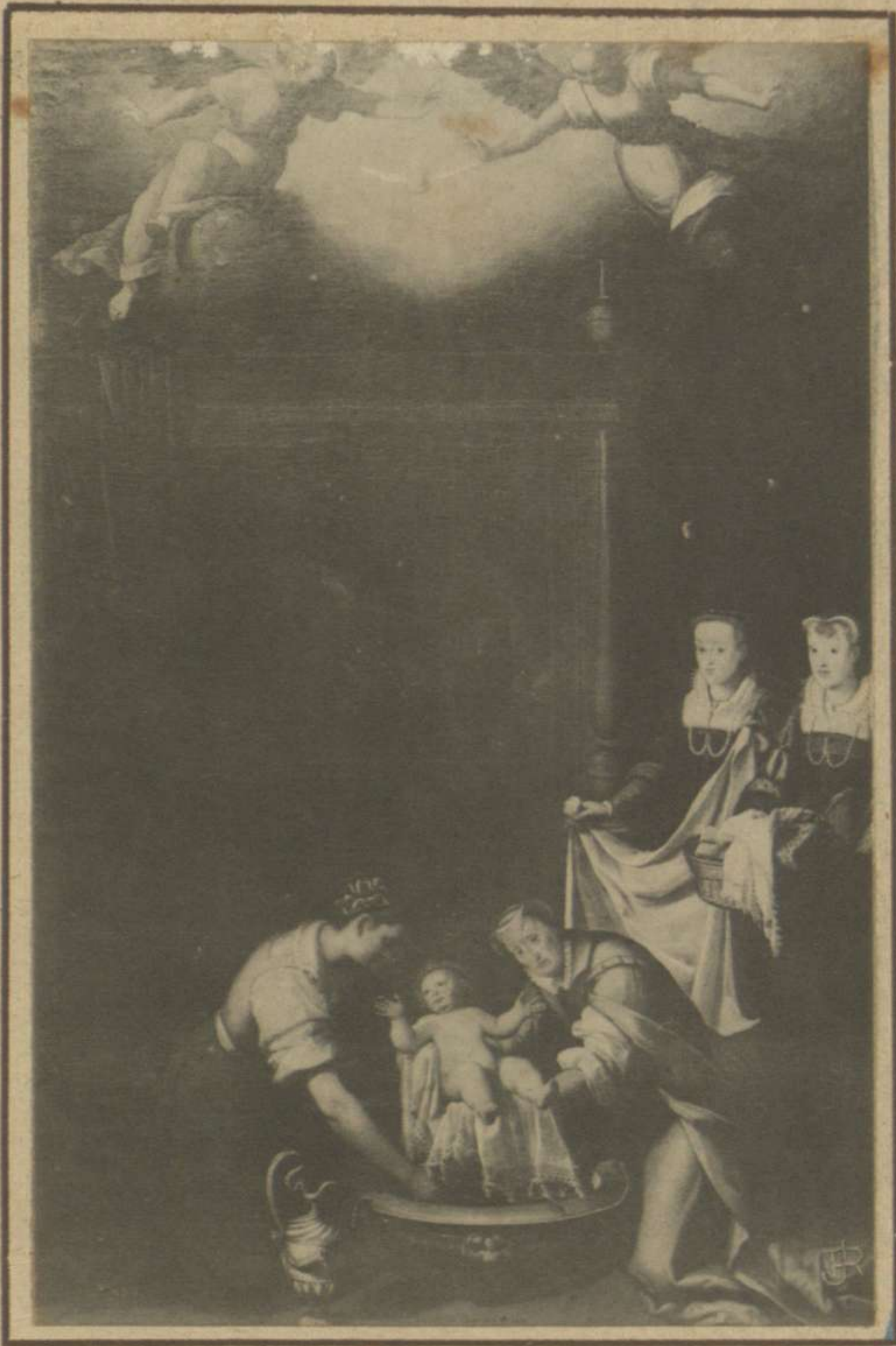
NACIMIENTO DE LA VIRGEN