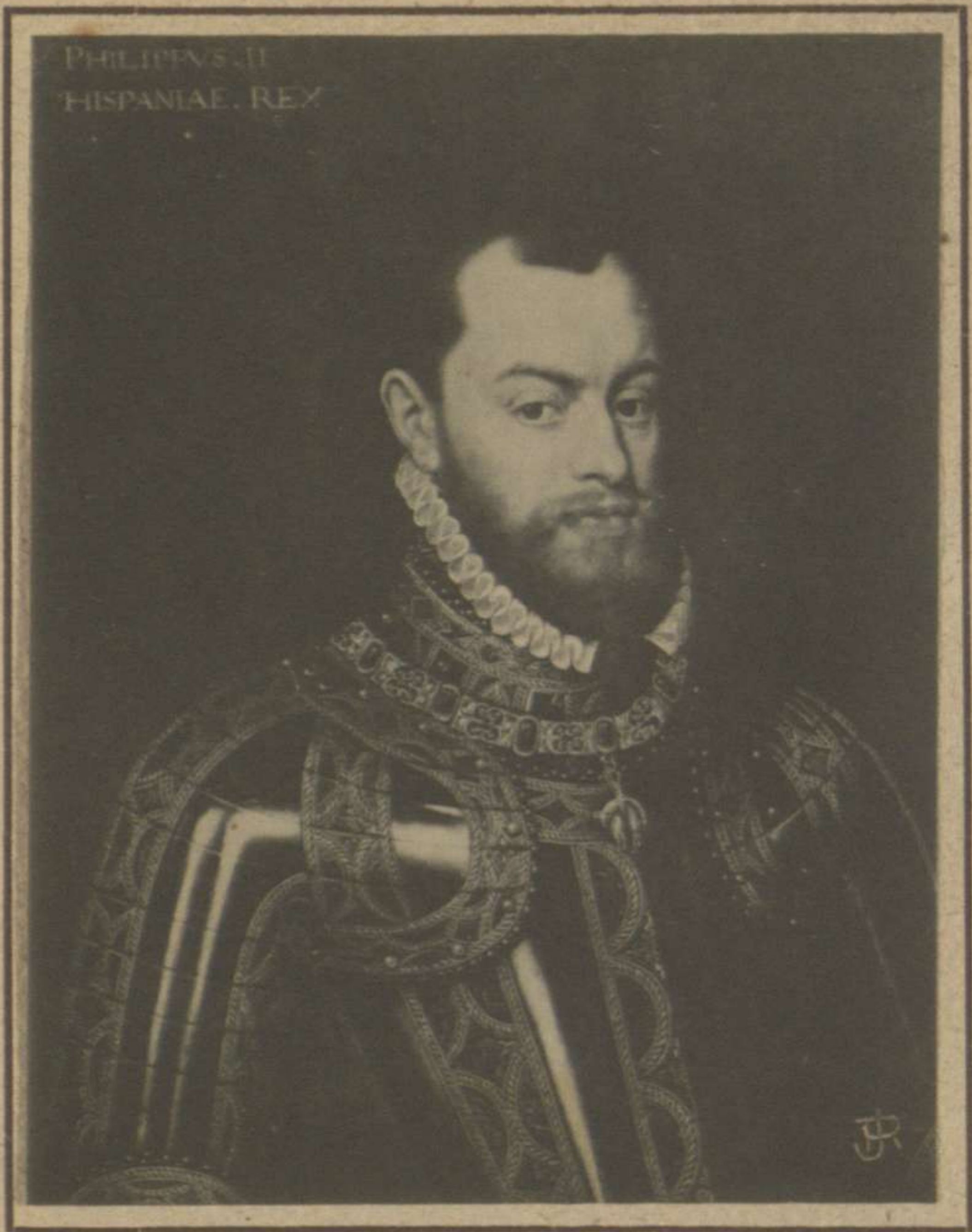
FELIPE II (COLECCIÓN DE D. LÁZARO GALDEANO)