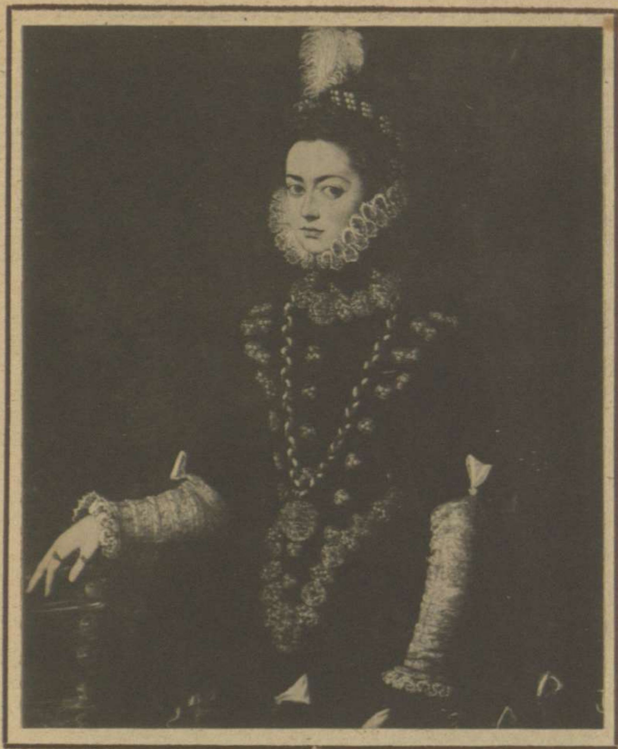
EMPERATRIZ DOÑA MARÍA DE AUSTRIA, HIJA DE FELIPE II, MUJER DE MAXIMILIANO II