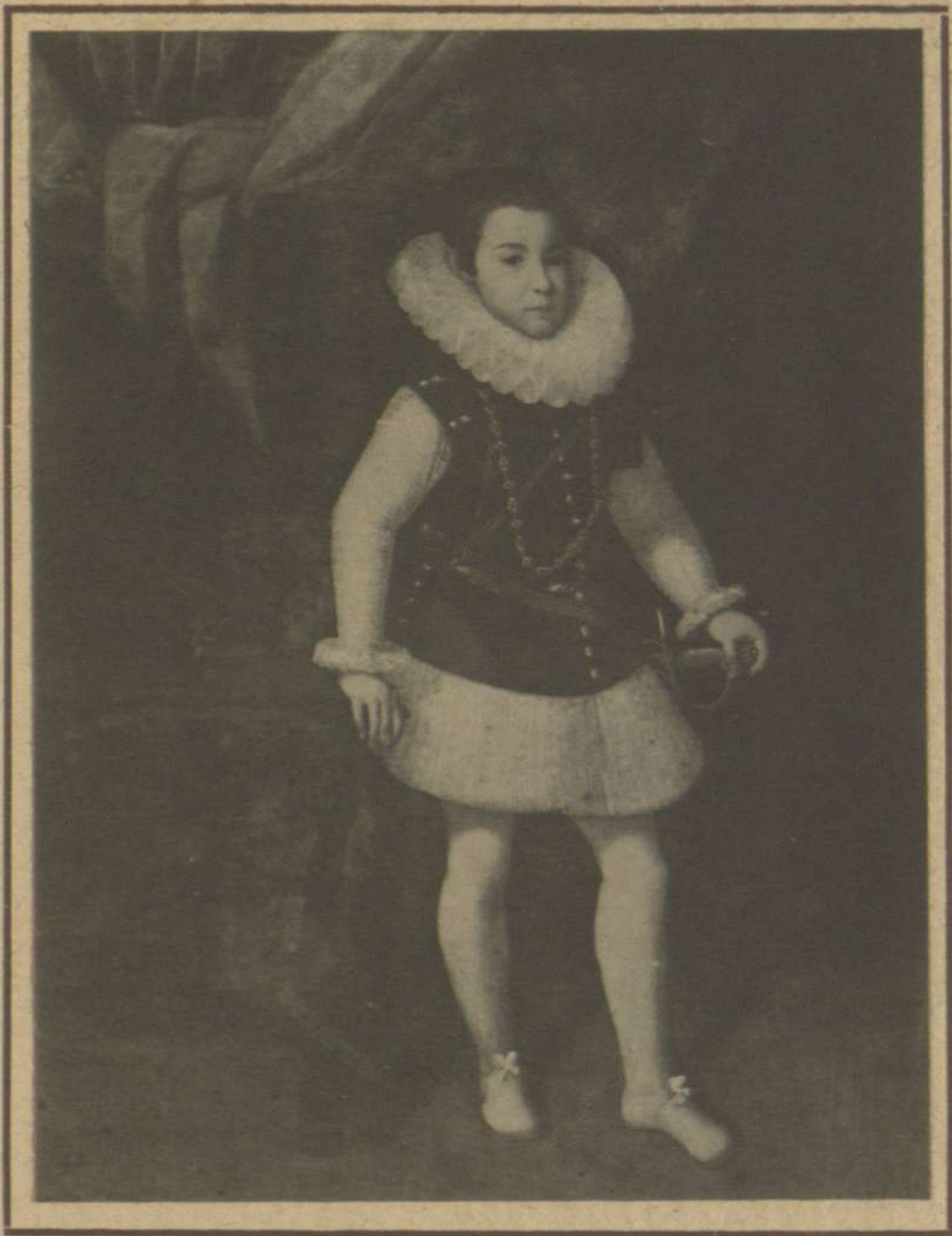
RETRATO DE NIÑO (PROPIEDAD DEL SEÑOR CONDE DE VILLAGONZALO)