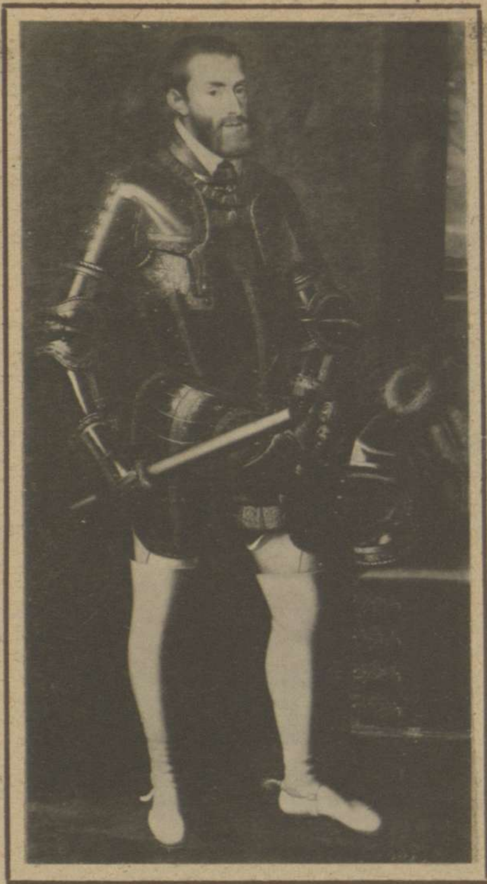
CARLOS V (MUSEO DEL PRADO)