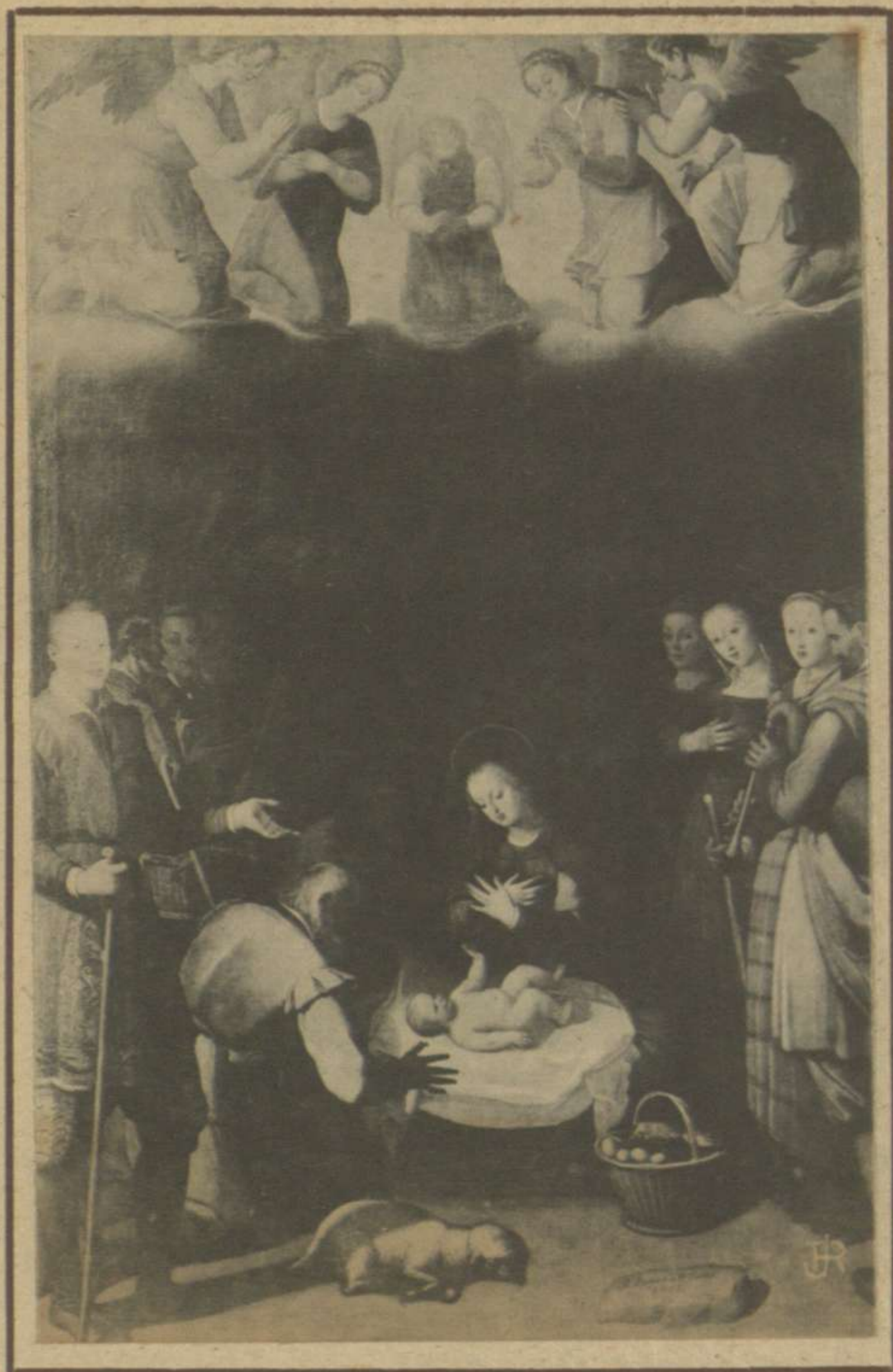
NACIMIENTO DE JESÚS