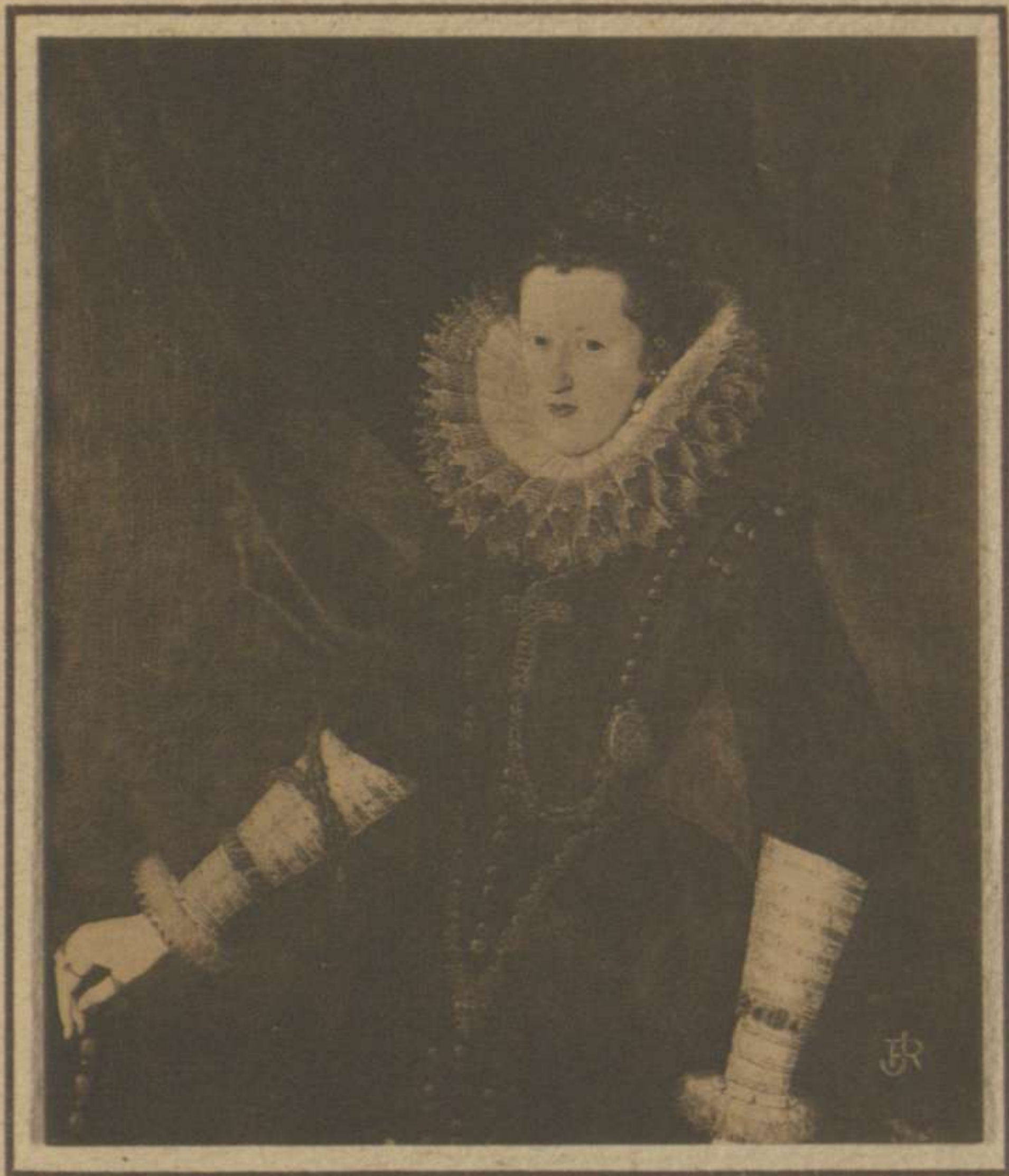
DOÑA MARGARITA DE AUSTRIA, MUJER DE FELIPE III 5 (MUSEO DEL PRADO)