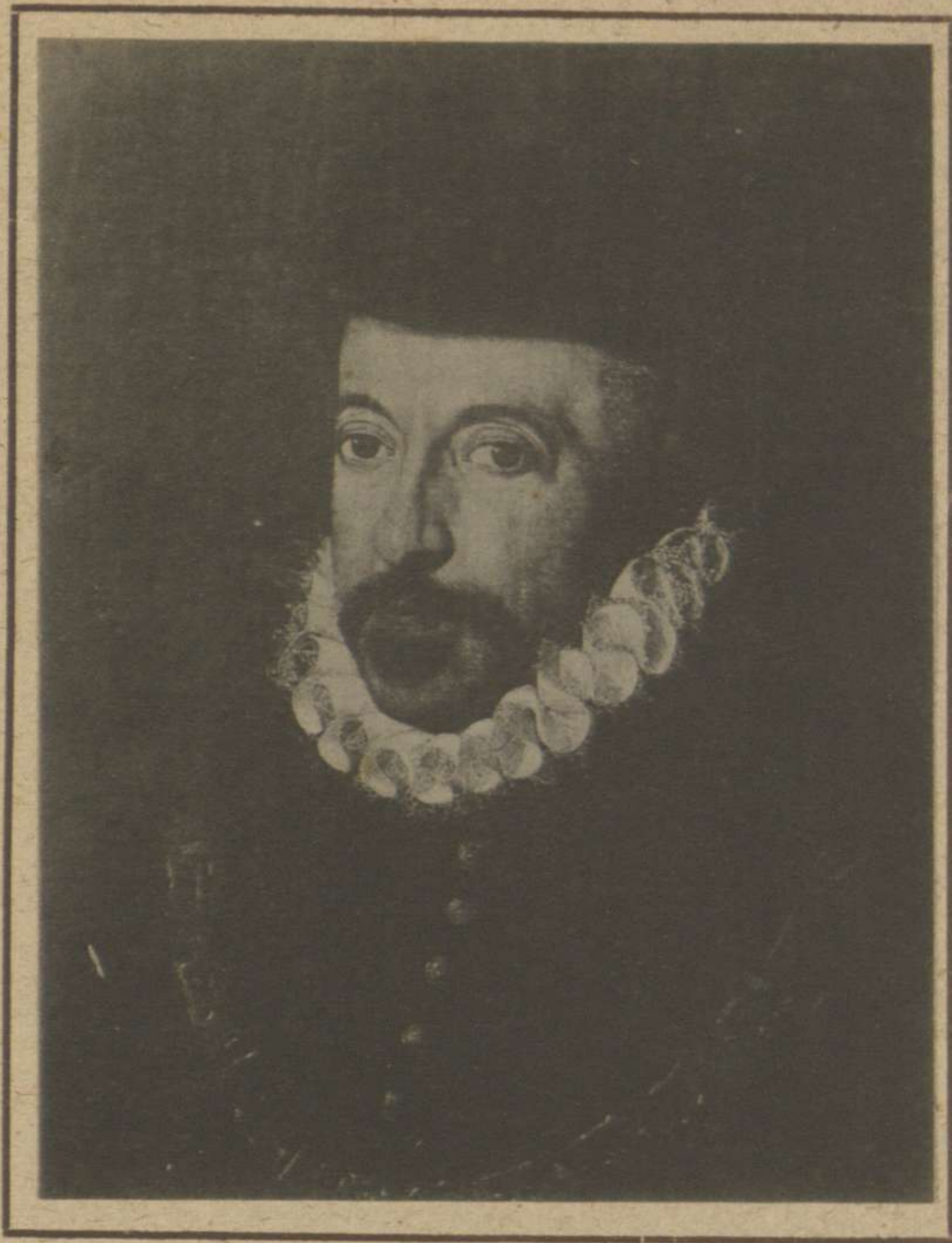
MARCO ANTONIO COLONNA (PROPIEDAD DEL SEÑOR MARQUÉS DE SANTILLANA)