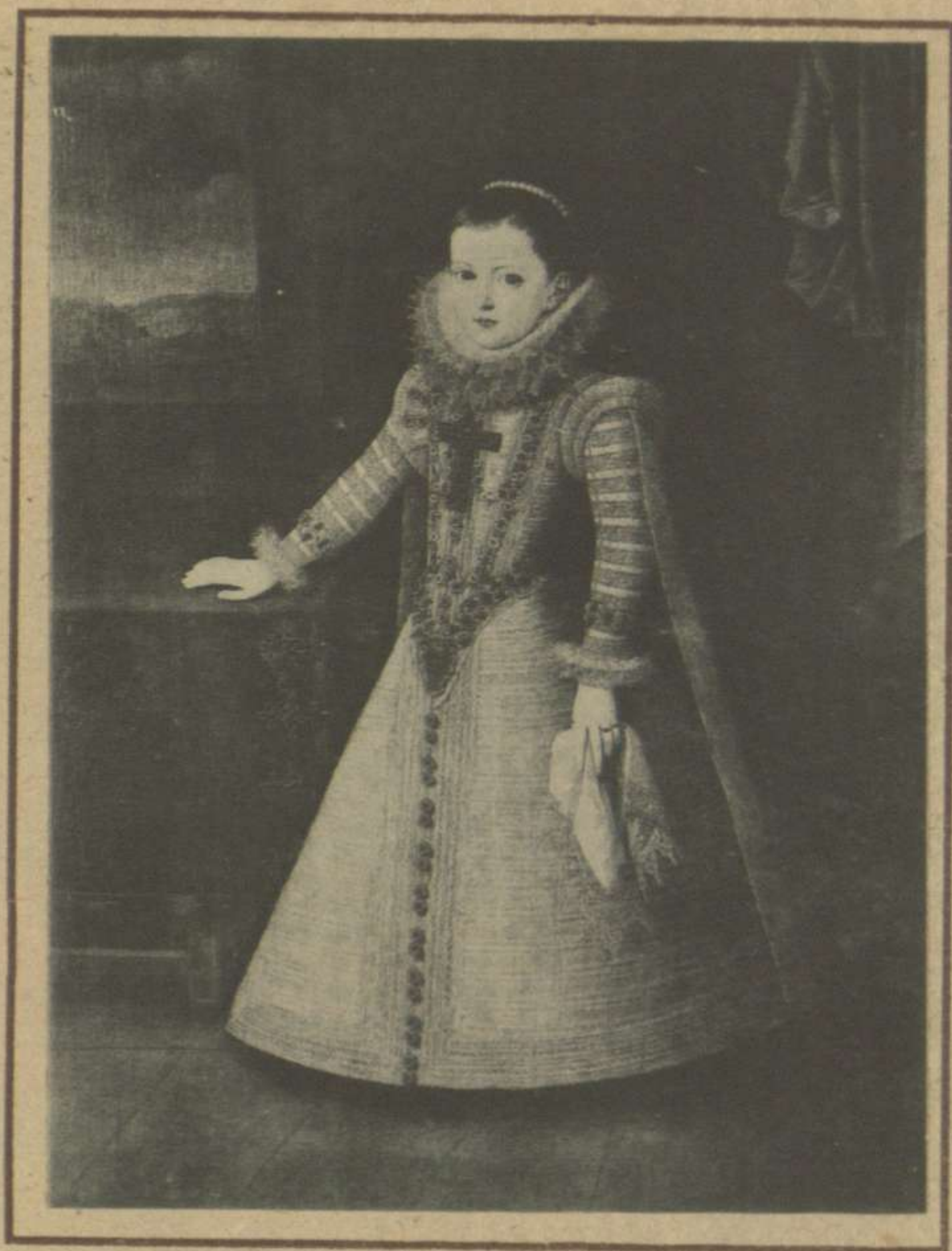
DOÑA ISABEL CLARA EUGENIA, HIJA DE FELIPE II 20