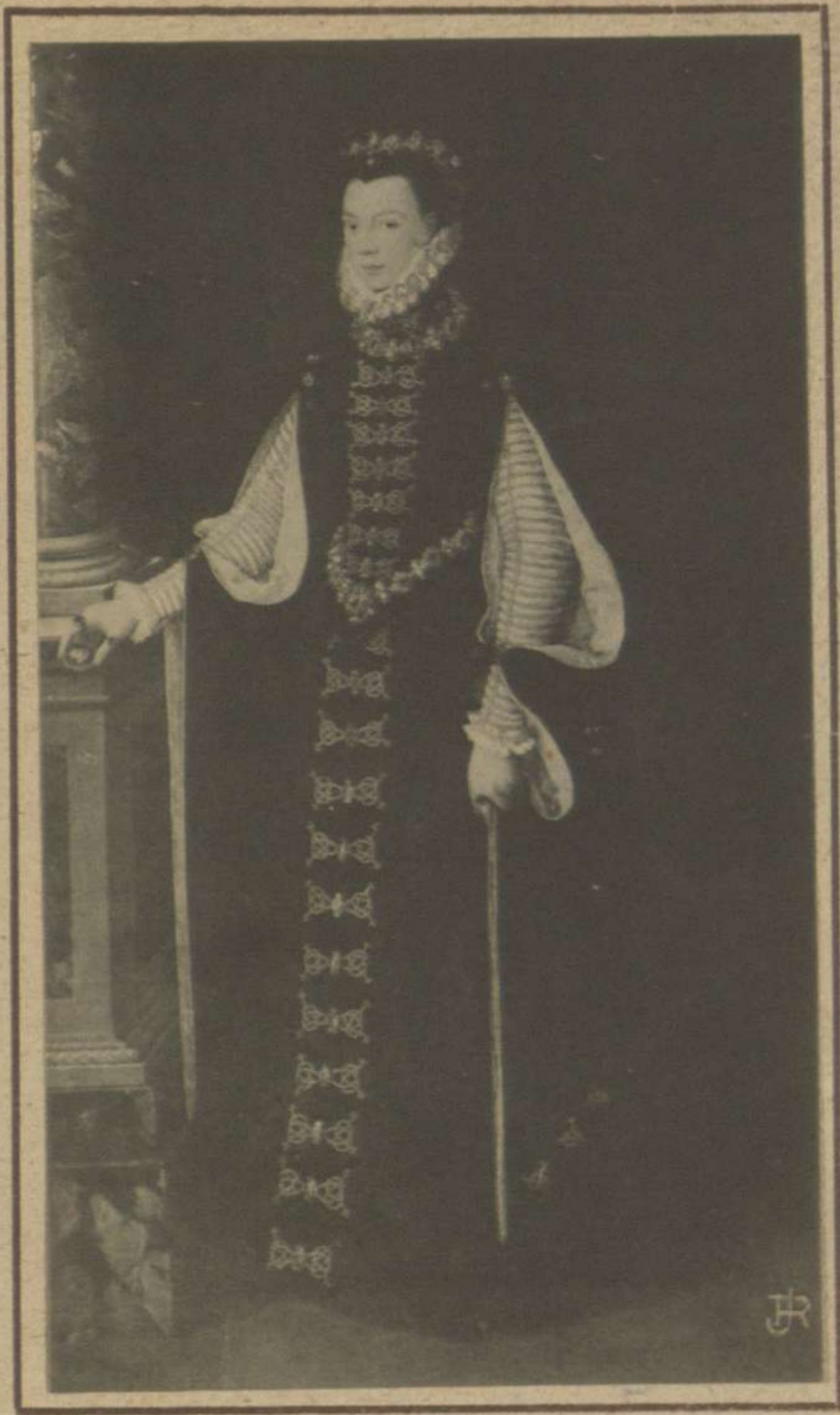
DOÑA ISABEL DE VALOIS O DE LA PAZ (MUSEO DEL PRADO)