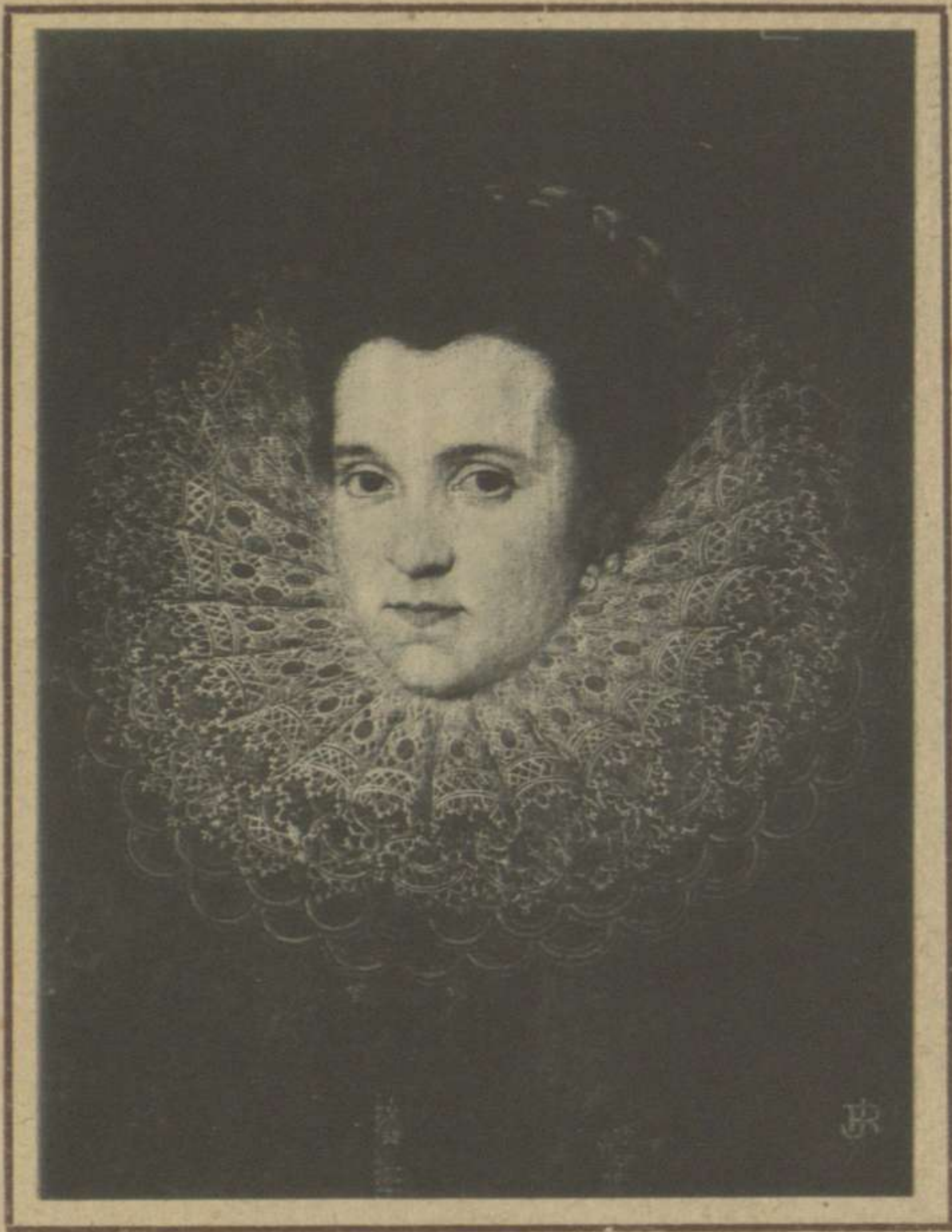
RETRATO DE DAMA (MUSEO DEL PRADO)