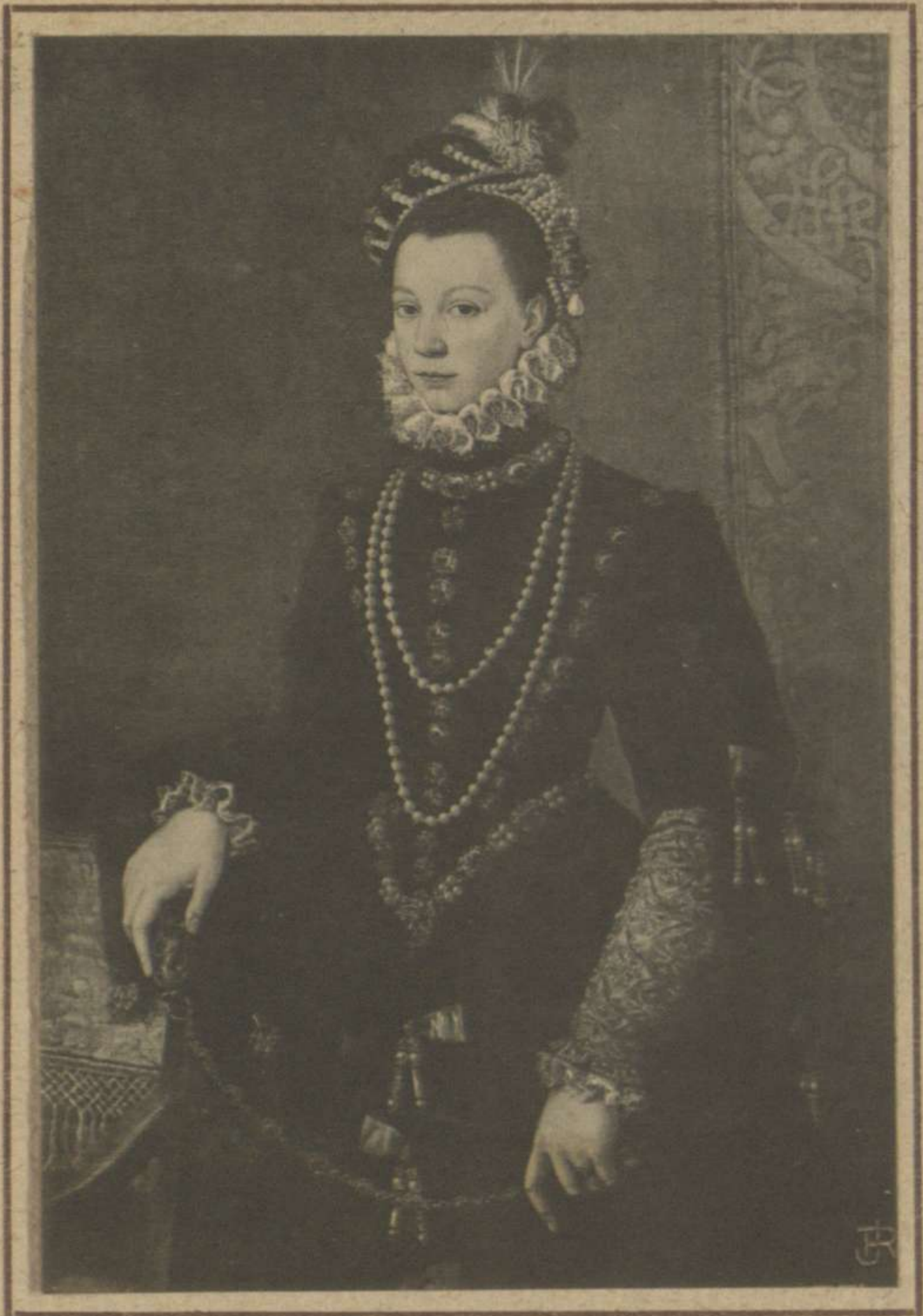
DONA ISABEL DE VALOIS, TERCERA MUJER DE FELIPE II 9