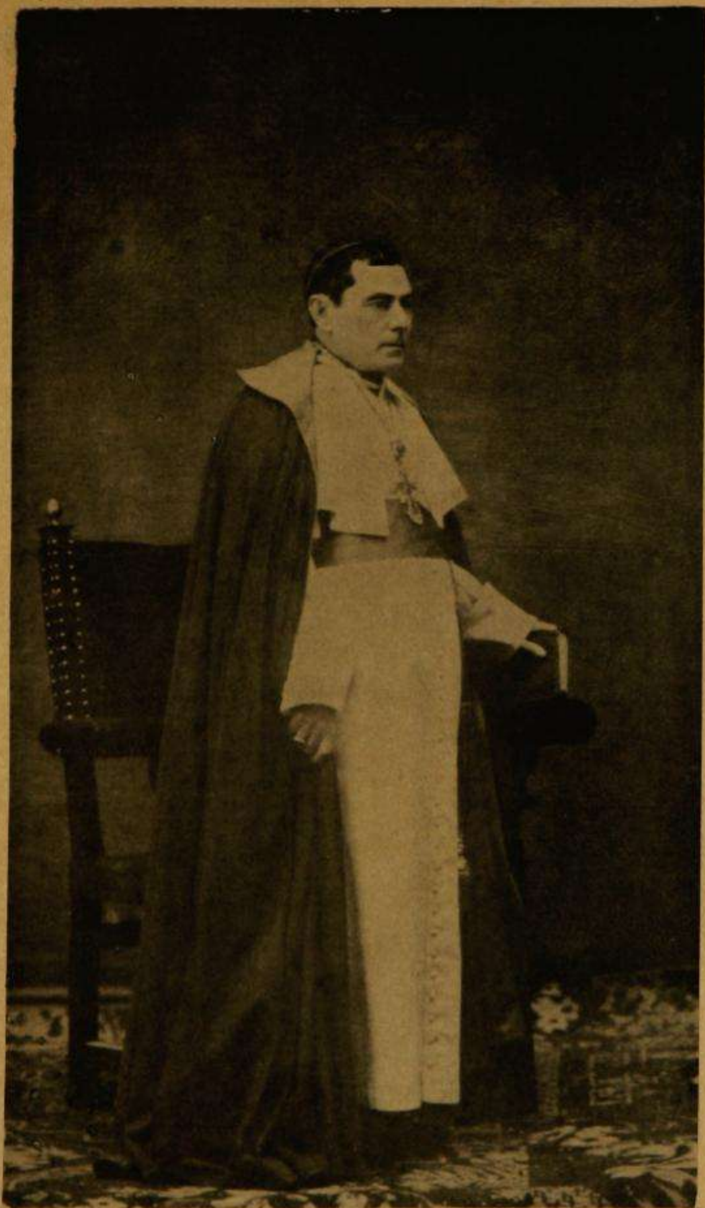
EL CARDENAL FR. D. CEFERINO GONZALEZ