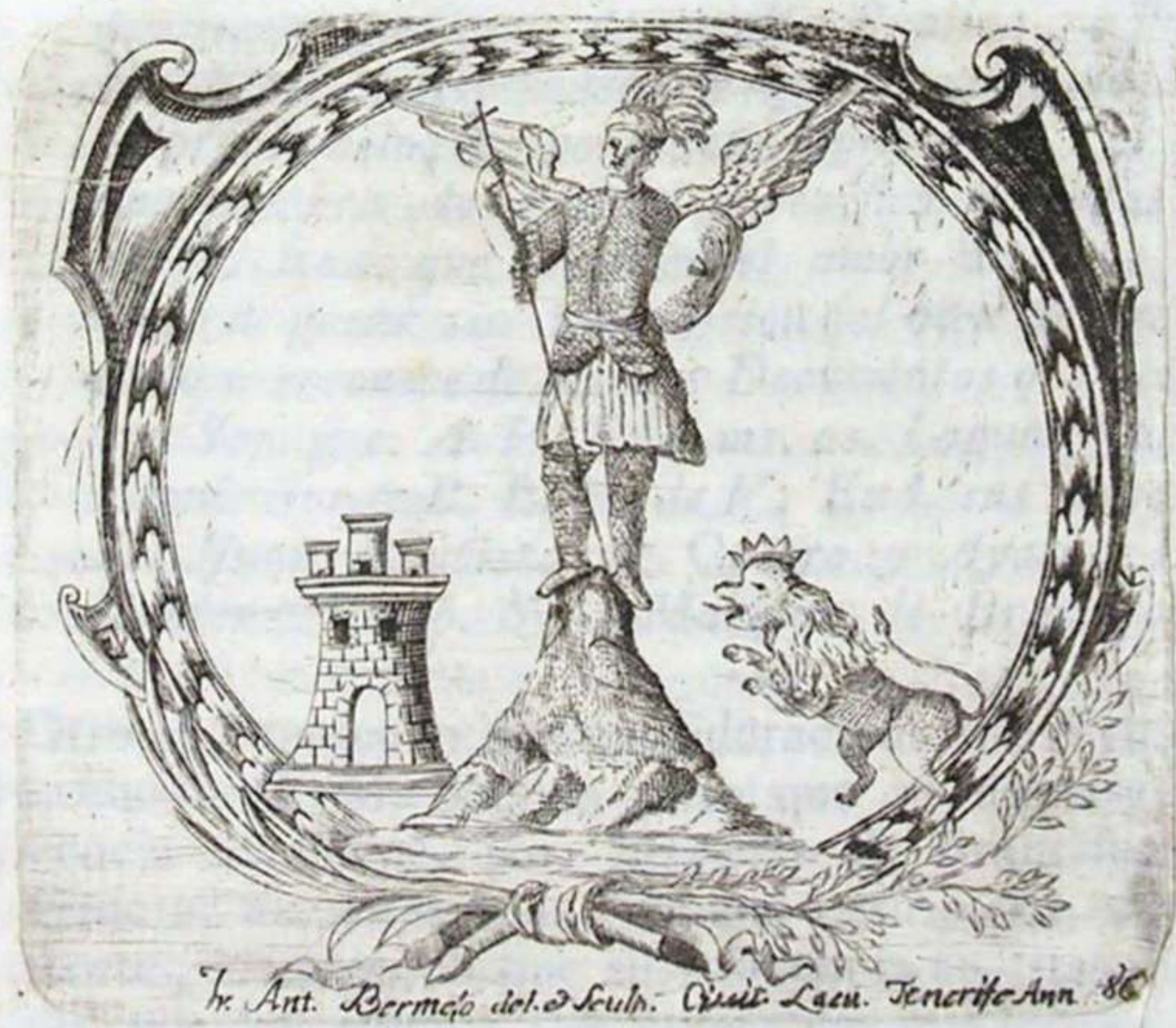
Jr. Ant. Bermúdez del. & Sculp. Cristóbal Lacu. Tenerife Ann. 86

Que se ha mandado imprimir por dicho Muy Ilustre Ayuntamiento, y à sus expensas.