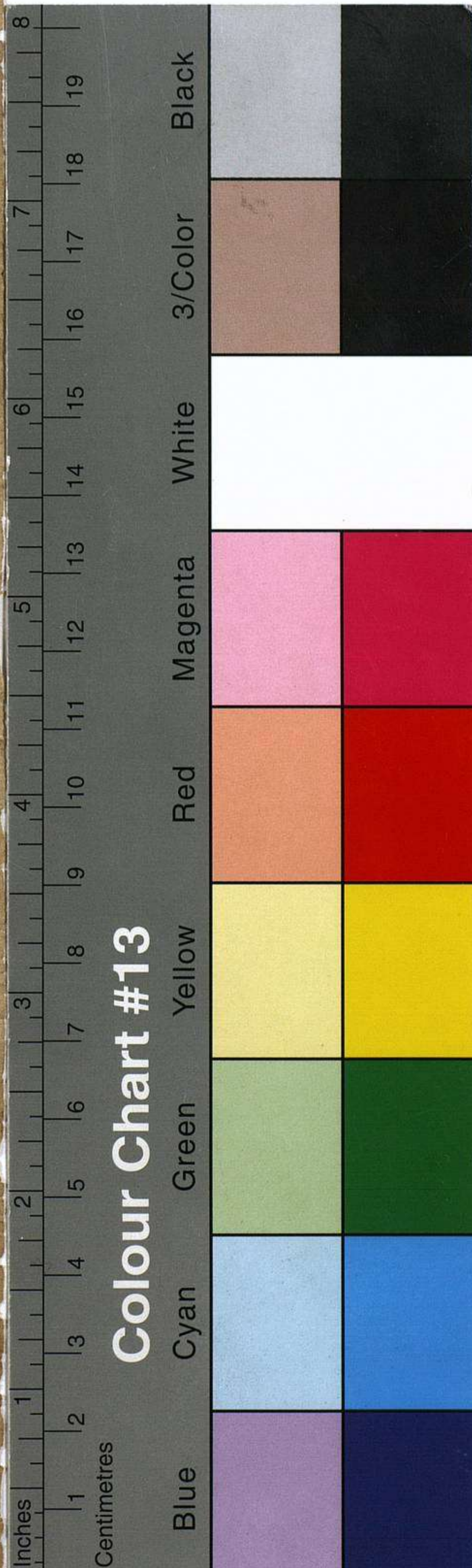
Colour Chart #13