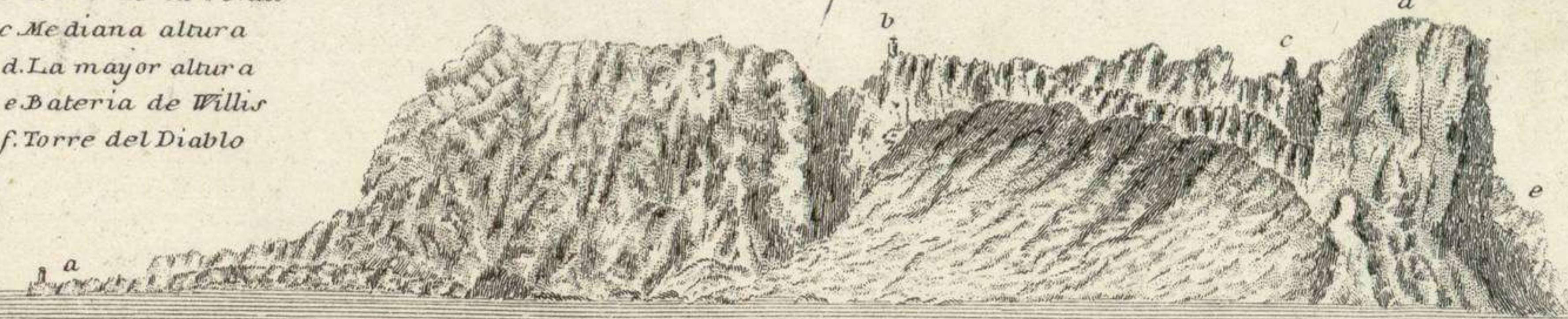
Vista de la Montaña de Gibraltar, por la parte de Oriente.