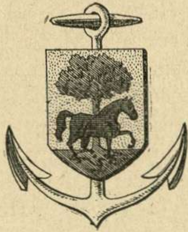
Armoiries de Ciboure