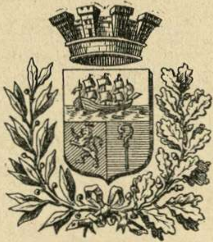
Armoiries de St-Jean-de-Luz (1)