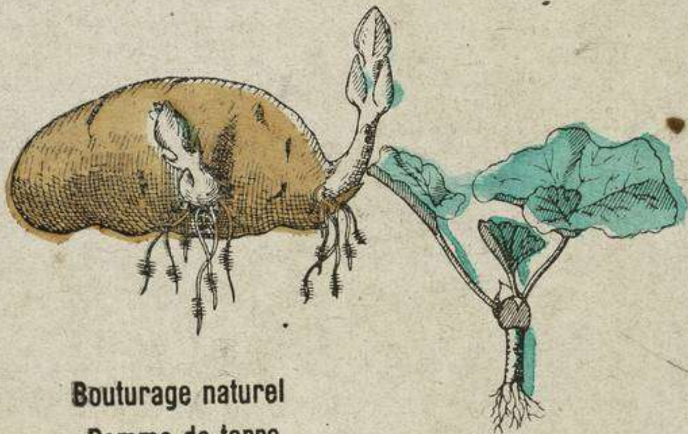
Bouturage naturel Pomme de terre