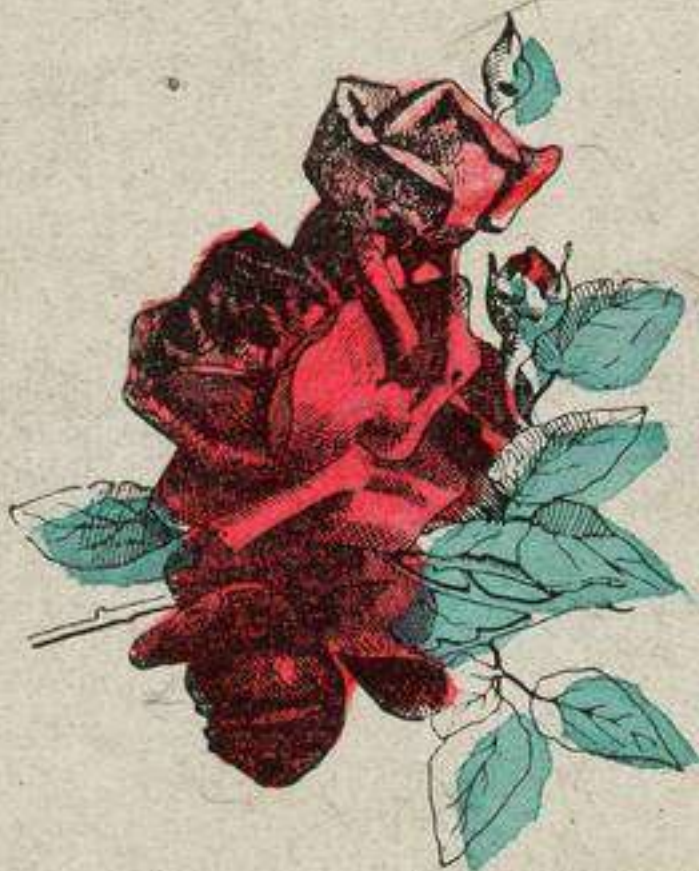
Variété conservée par marcottage