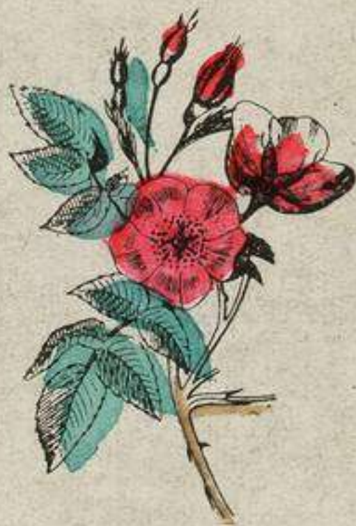
Semée elle produit souvent un églantier