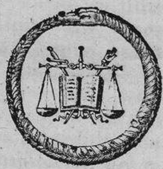
Constitucion y Justicia.