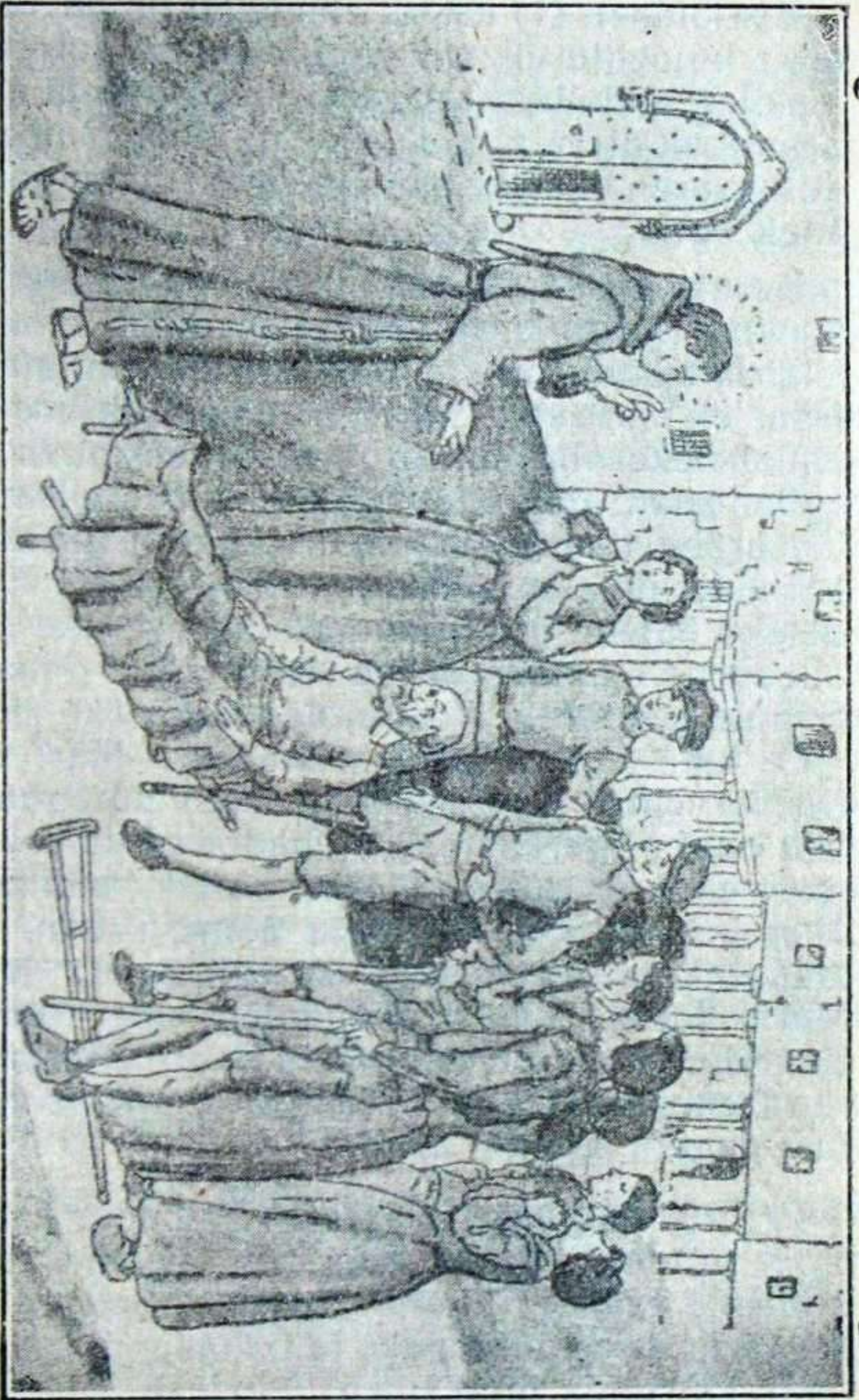
Salbador doatsua elbarriak sendatzen.