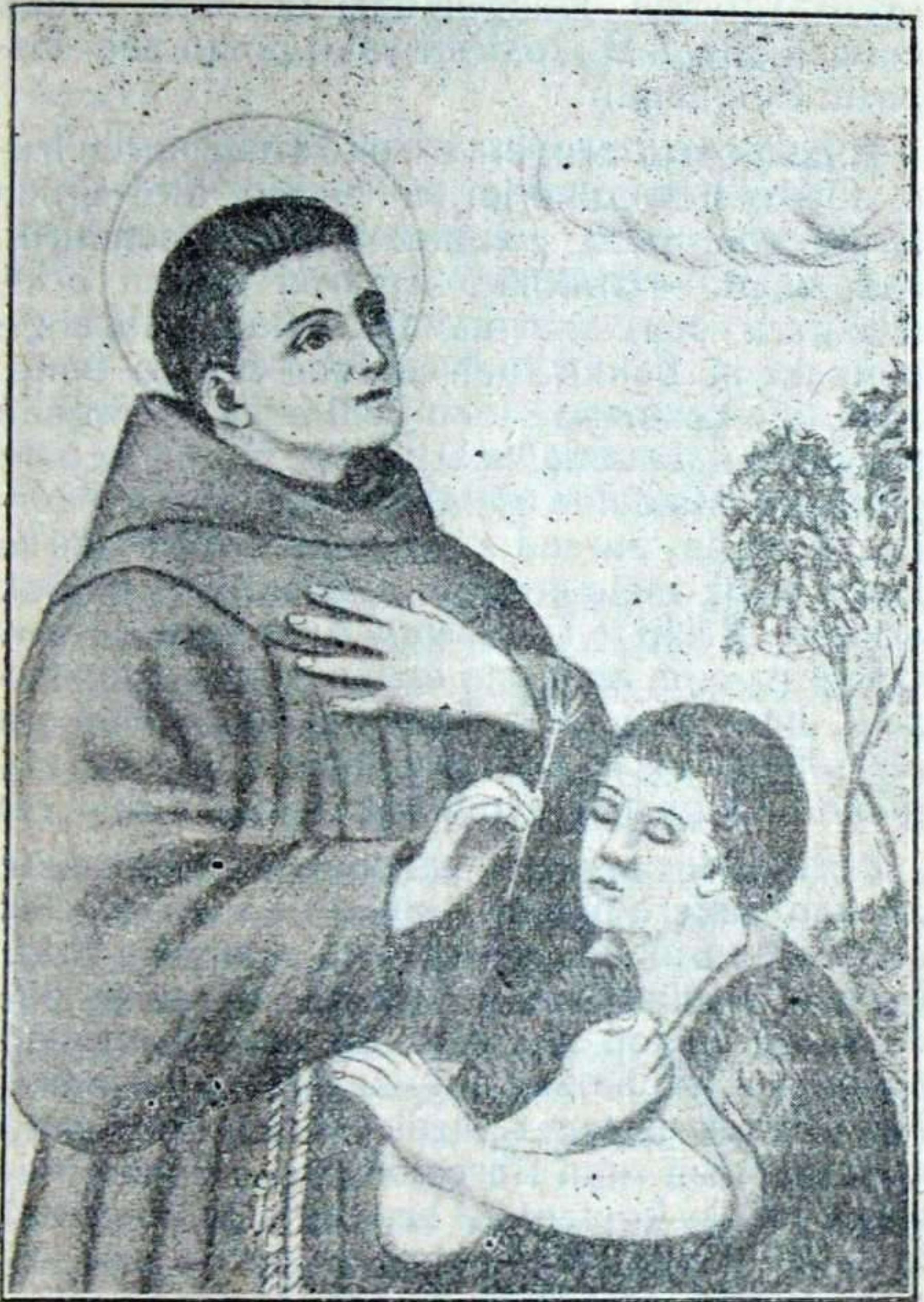
Salbador doatsuak itxuari ikusmena ematen dio.