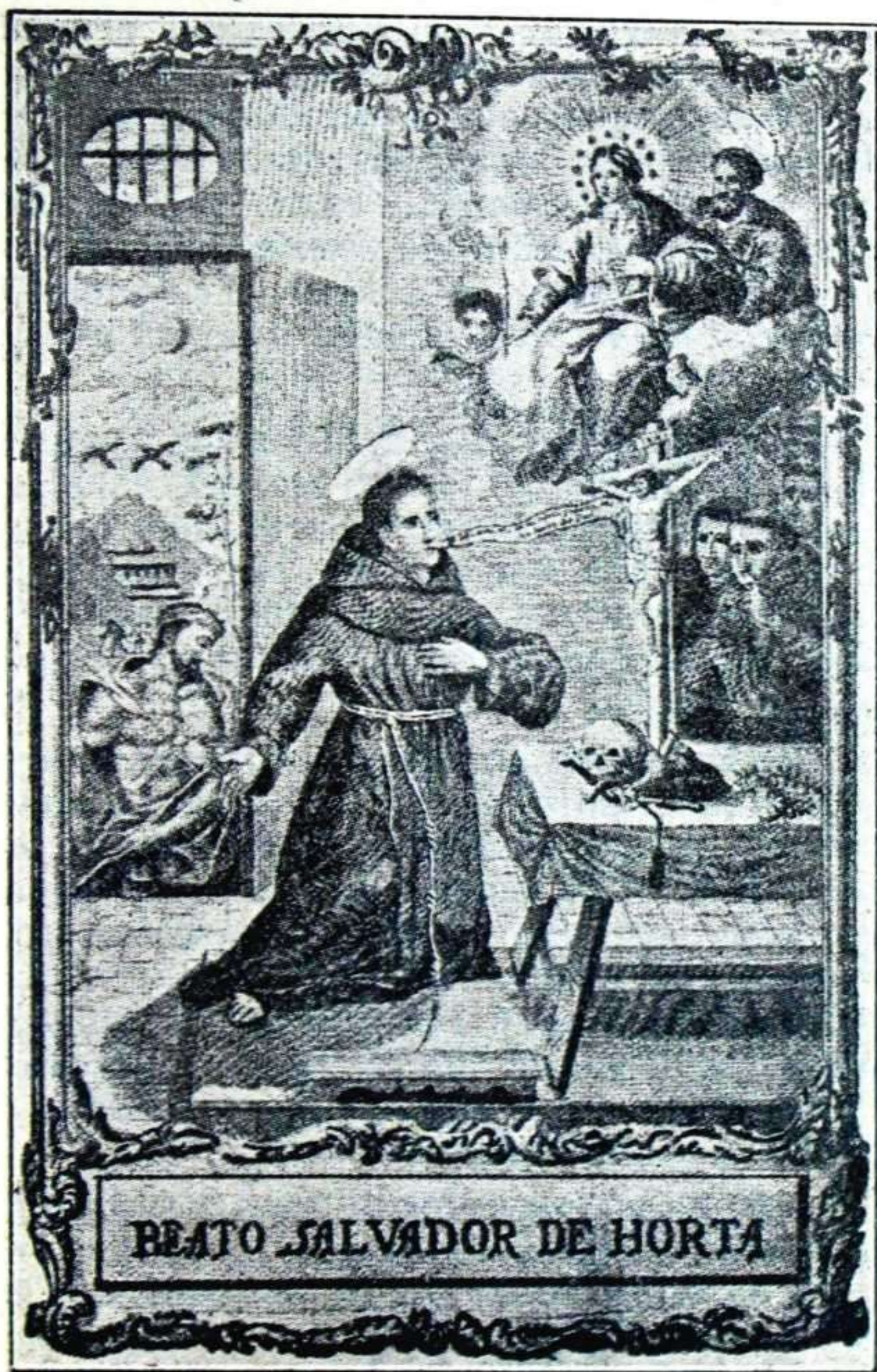
Salbador doatsua Jesus-Gurutzatuarekin izketan.