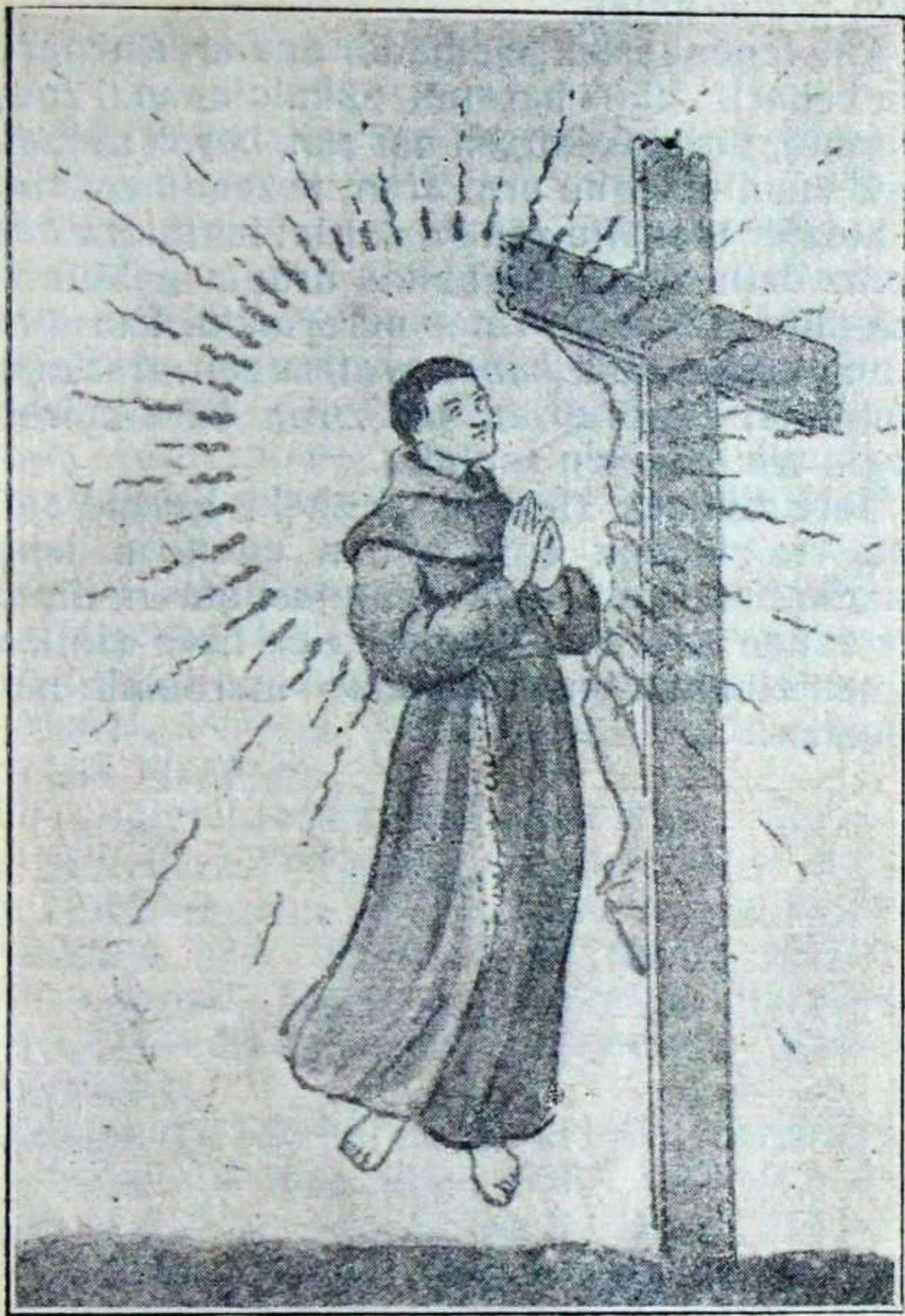
Salbador doatsua sentzu-galduta.