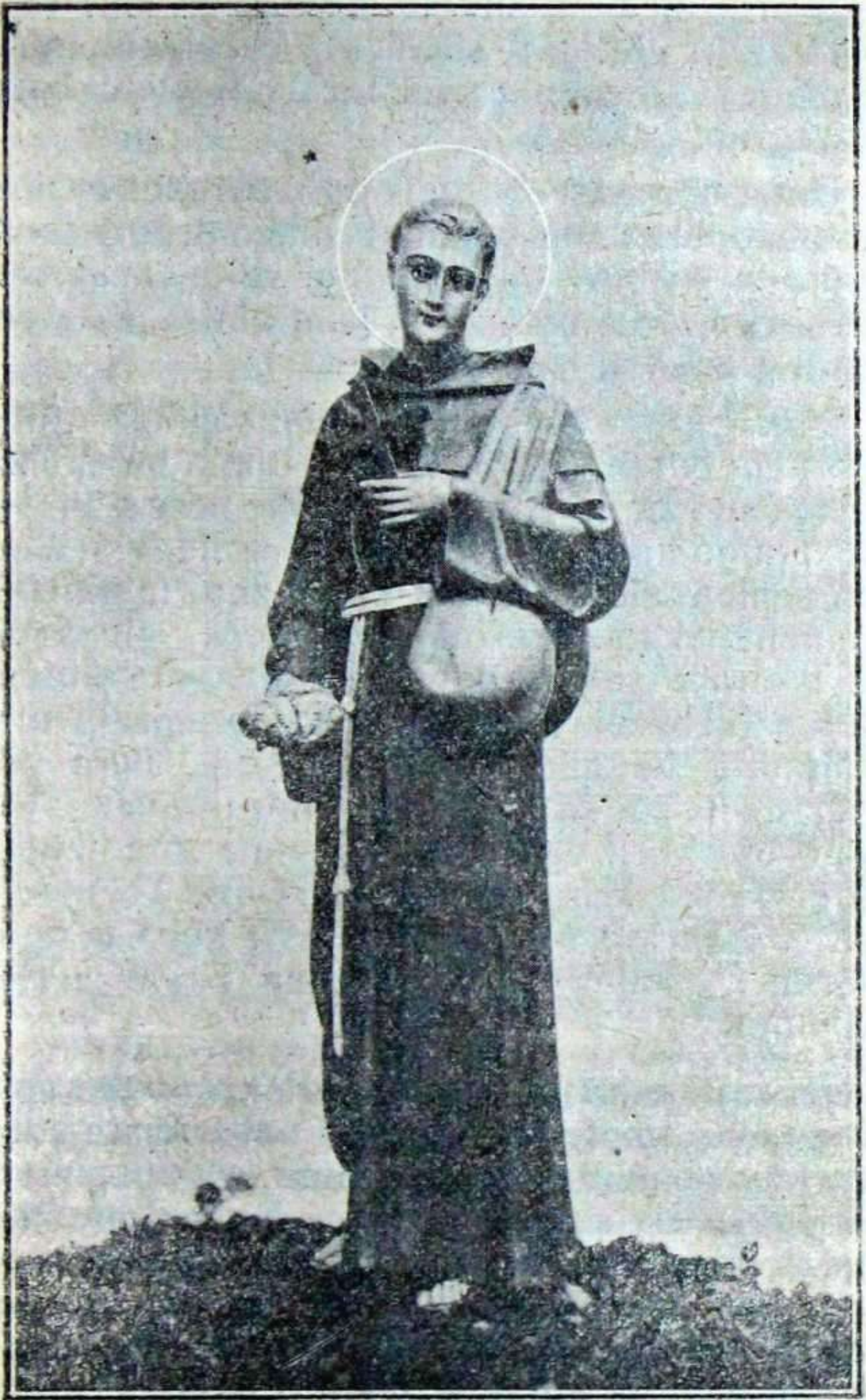
Salbador doatsua beartsuei ogi ematen.