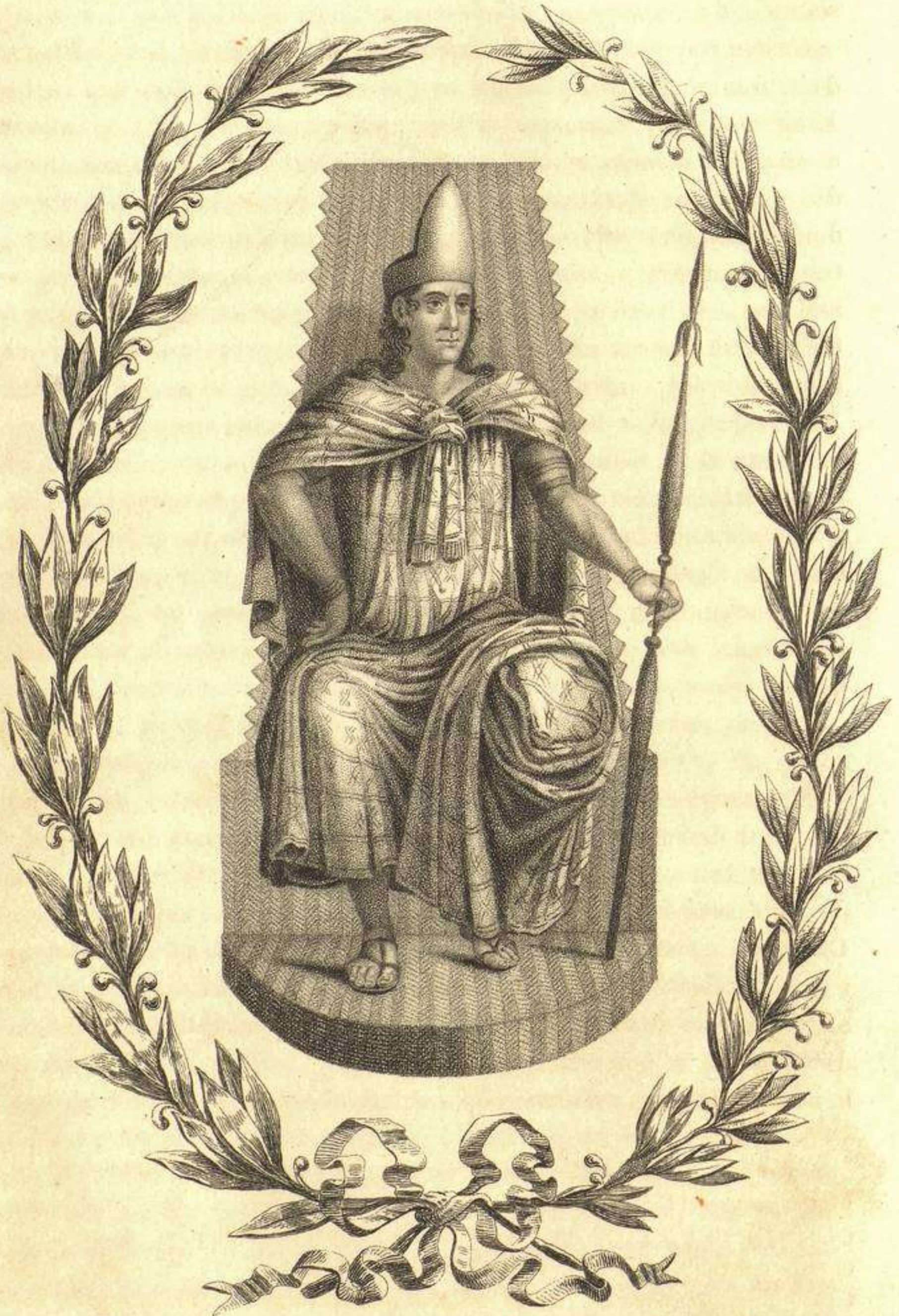
Motucuzoma III , ultimo Rei de Mexico antes de la Conquista.