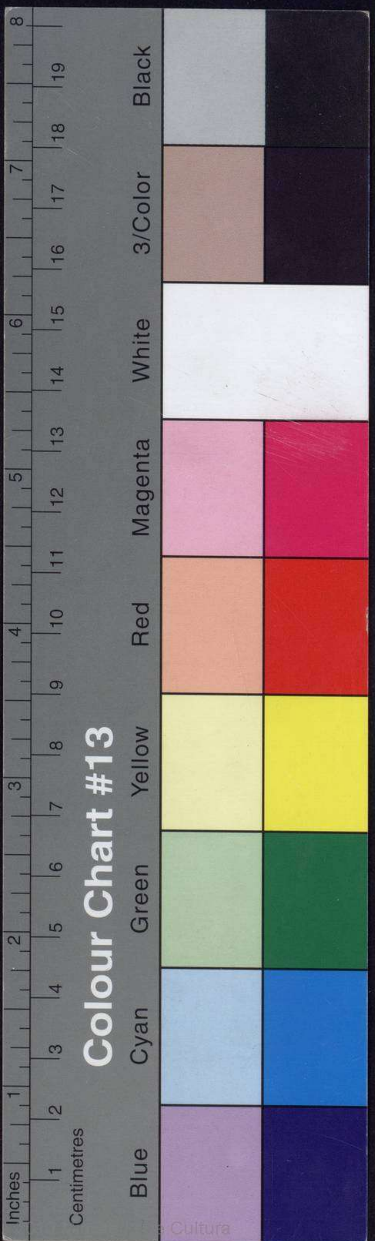
Colour Chart #13

איסטו נואיב'ו איסטאביליסימינוס נו טיפו נינגון אינטרומפ'יסו אין סו אדי' לאנטאמינוסו אין לה סיב'דאד, אינטונוסיס (* איל דיטו לוגאר, אים אוי דום קור' טיז'ום מאס אריב'ה די לה „חורבה“ די רבי יהודה החסיד, לה סינאגוגה „בית יעקב“ די מואיסטרוס אירמאנוס לום אשכנזים.