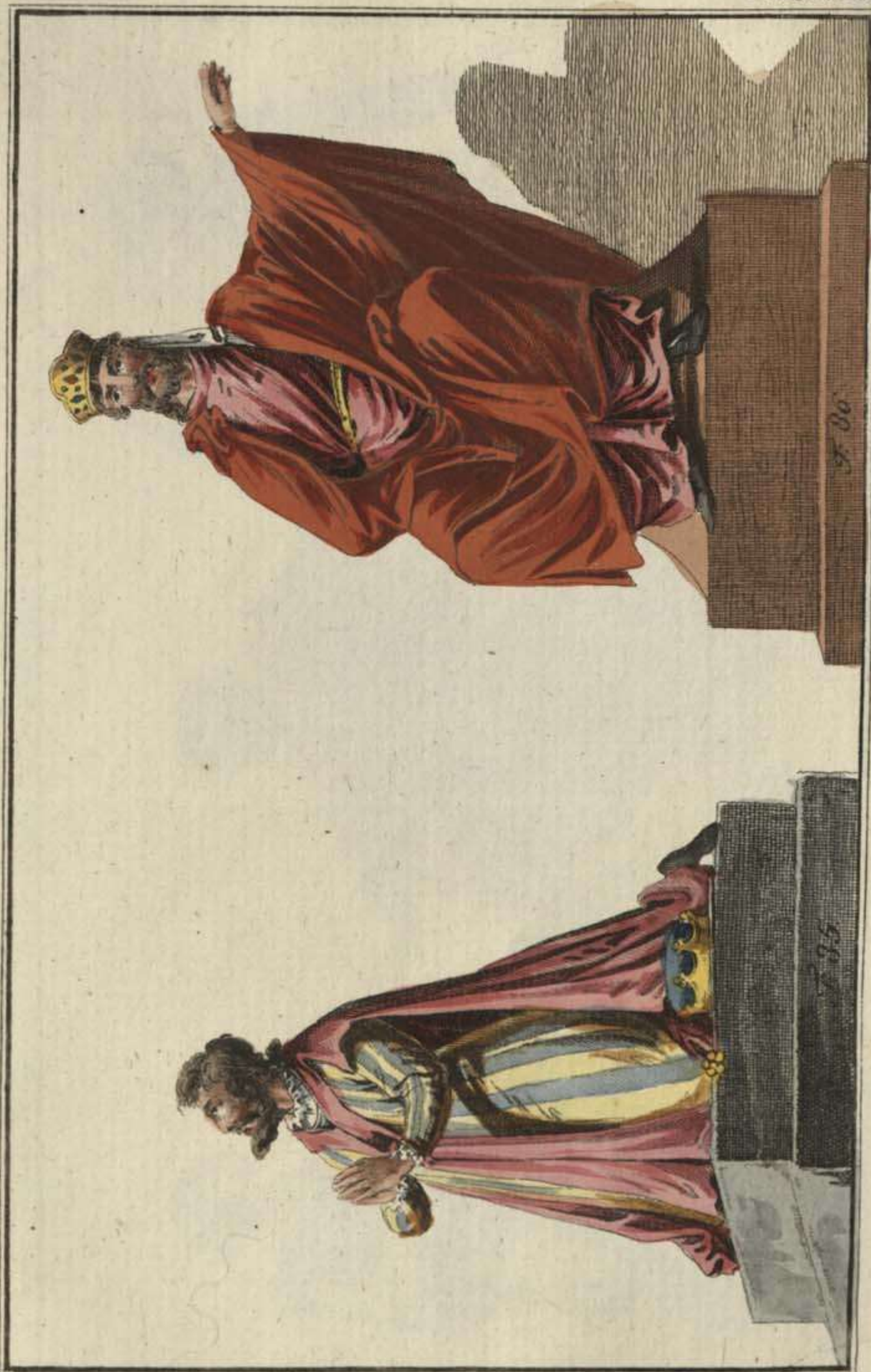
V. u. d. K. II. Ab. III. Th.