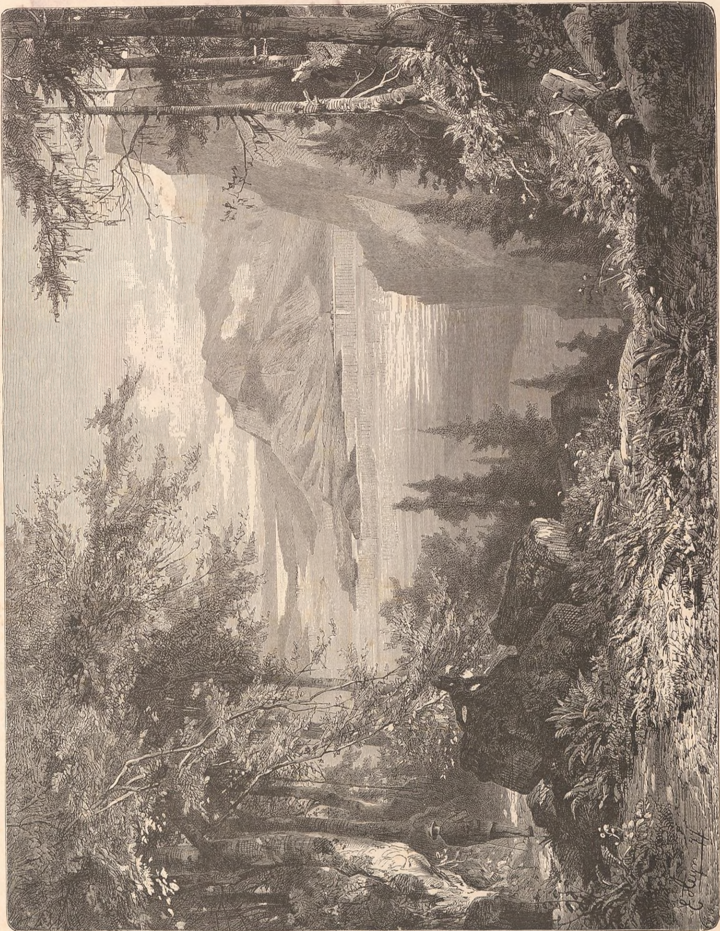
LE LAC DE WEGGIS VU DU BURGENTOCK.