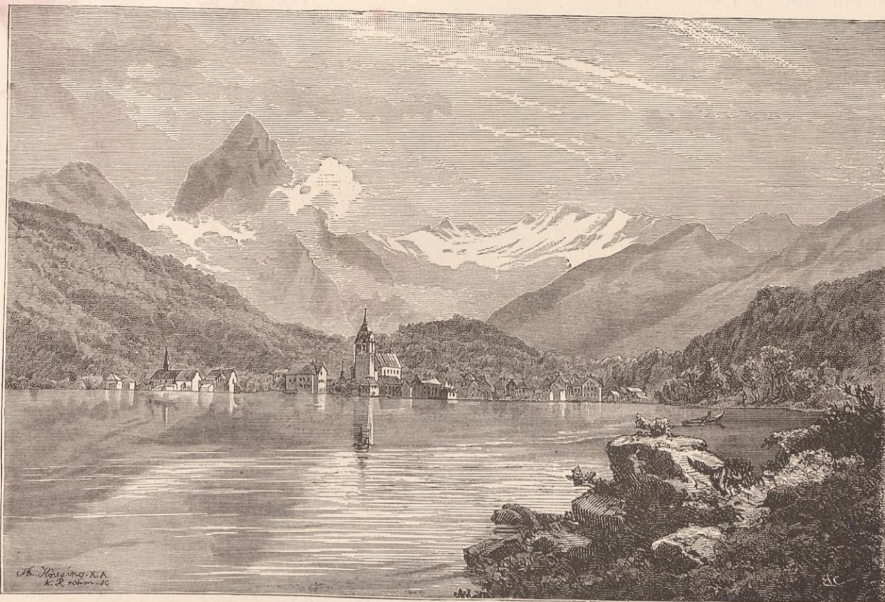
ARTH (LAC DE ZOUG).

un amas de décombres évalué à 40 millions de mètres cubes. De Goldau, particulièrement, il ne resta