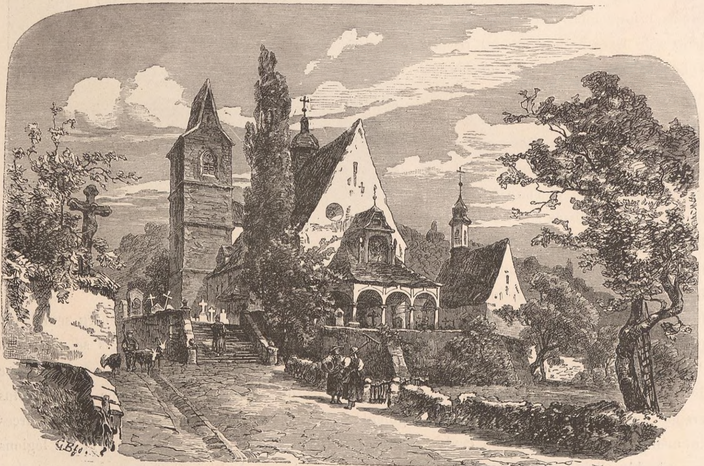
ZOUG : CHAPELLE SAINT-MARTIN.

comme on l'appelait pour ses riches cultures, était redevenue la proie du chaos. Quatre villages entiers,