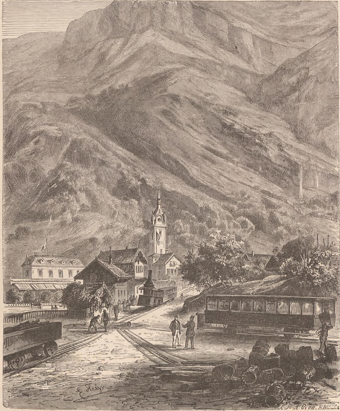
VITZNAU ET LE CHEMIN DE FER DU RIGI.

Pour vous, lecteur, la meilleure façon de continuer du point où nous sommes le tour du Rigi, c'est encore, je crois, de n'en point descendre. Le signal du Kulm a cet avantage que, n'étant qu'à une altitude modérée, le relief des objets inférieurs n'y apparaît point trop effacé, et que, de Lucerne à Zoug et aux Mythen, le regard peut suivre la route à son gré sans jamais embrouiller les fils de l'optique. C'est principalement à partir du lac de Küssnacht que la perspective a toute sa netteté.