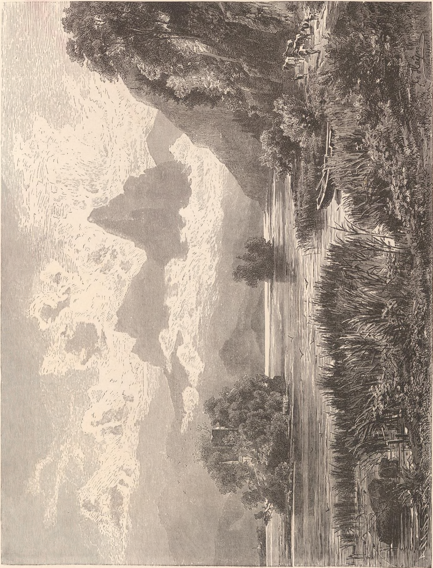
LE LAC DE LOWEZE ET LES MYTHEN.