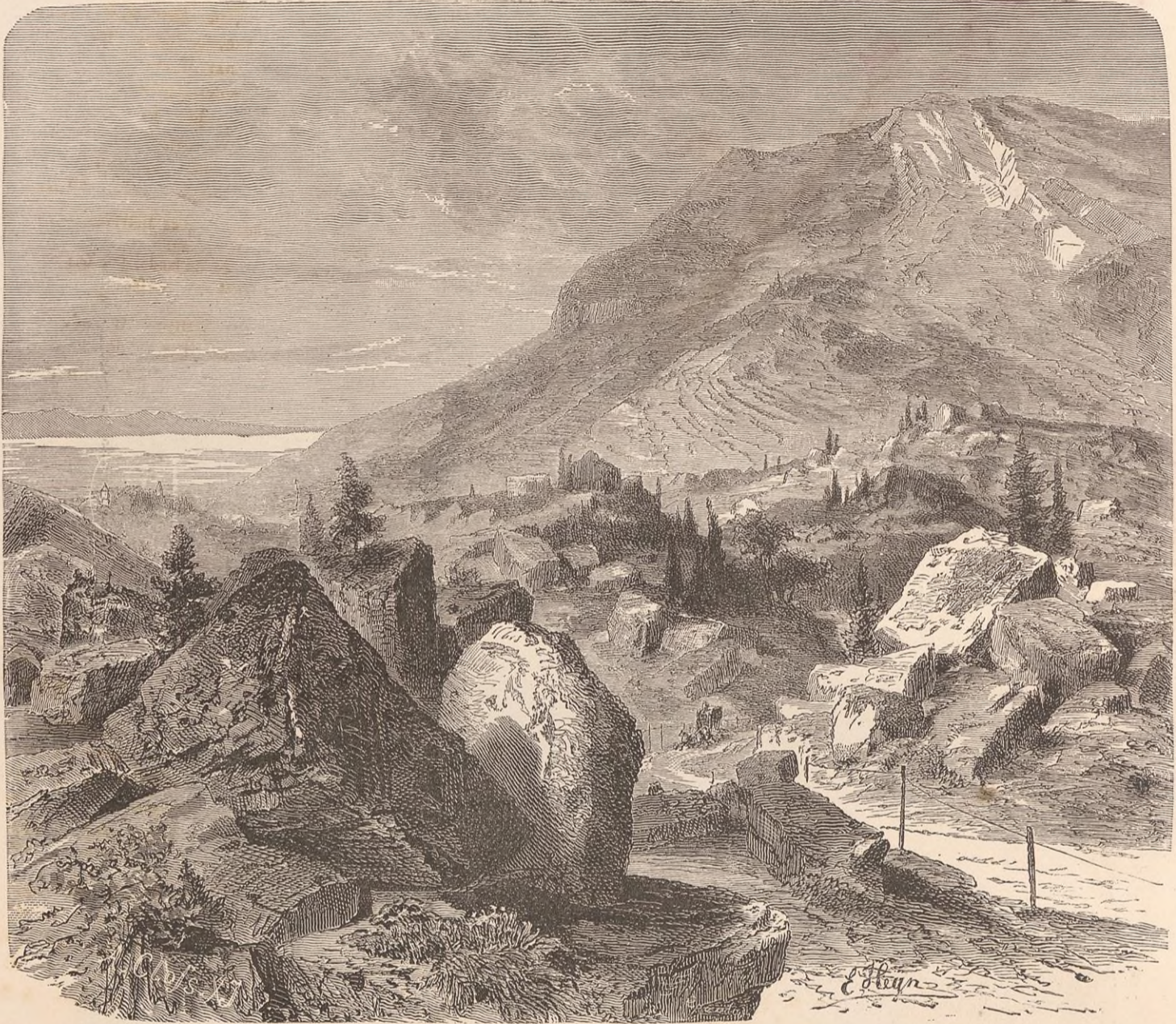
L'ÉBOULEMENT DE GOLDAU.

partie de la forêt de Sanz, s'était jetée sur la chapelle de Goldau pour s'échouer ensuite sur des amas de débris plus anciens ; la seconde, venue de la chapelle de Röthen, avait recouvert en un clin d'œil les prairies de Goldau, et ne s'était arrêtée qu'au pied du Rigi ; la troisième avait achevé la destruction du village de Röthen, tandis que la quatrième, la plus effrayante, franchissant la colline de Gruwi, avait entassé à elle seule presque autant de débris que les trois autres. Des blocs avaient même été lancés