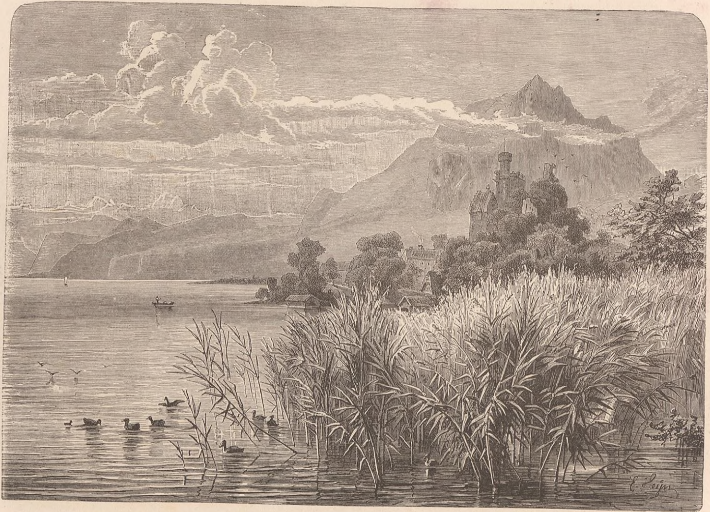
CHATEAU DE NEU-HABSBOURG.

offre un caractère tout pastoral et alpestre ; la ville elle-même a gardé d'une manière étrange l'empreinte moyen âge. J'ai dit qu'elle entra de bonne heure (1352) dans l'Alliance. Par un beau temps vous pouvez discerner du Kulm, avec la lunette, ses édifices principaux, les églises Saint-Michel et Saint-Oswald, l'hôpital, l'hôtel de ville et la petite chapelle Saint-Martin. Zoug a été de tout temps une ville amie du plaisir, de la satire et de l'agitation. On y célébrait autrefois, le 6 décembre, qui est le jour de la Saint-Nicolas, une sorte de procession, interdite, je crois, à plusieurs reprises par les conciles, et qu'on appelait, dit Bridel, la « Fête de l'évêque des écoliers ». Un écolier de l'endroit, habillé en évêque,