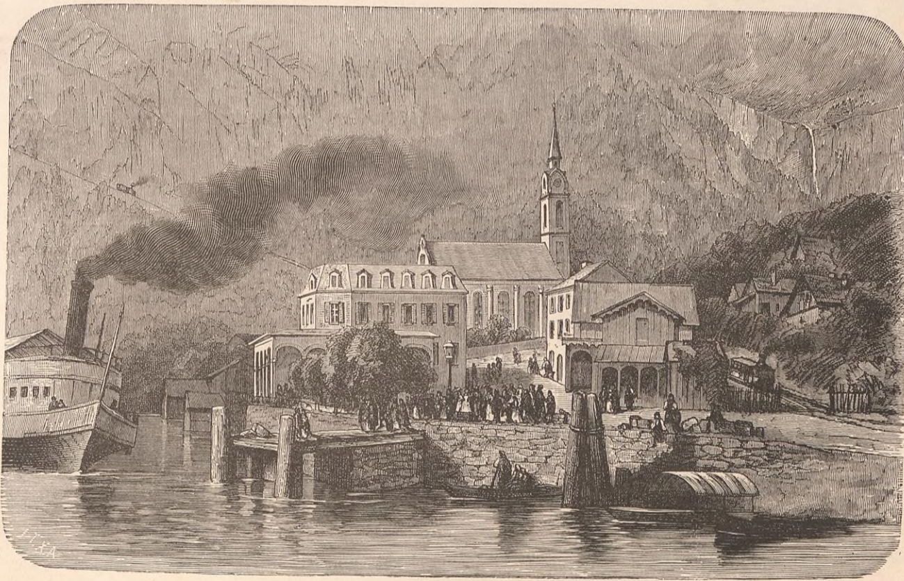
VITZNAU : LE PONTON DE DÉBARQUEMENT.

la haute et la basse ; l'église paroissiale est entre les deux, sur une éminence. Le Rigi a laissé ici mainte trace d'éboulement ; il paraît même qu'il existait jadis, non loin du lac, entre Weggis et Vitznau, des