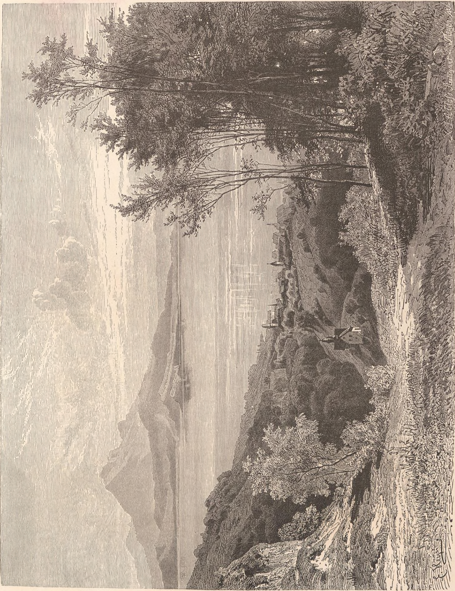
LE LAC DE ZOUC.