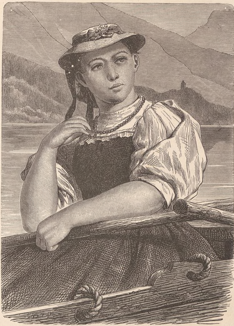
PÊCHEUSE DE ZOUG.