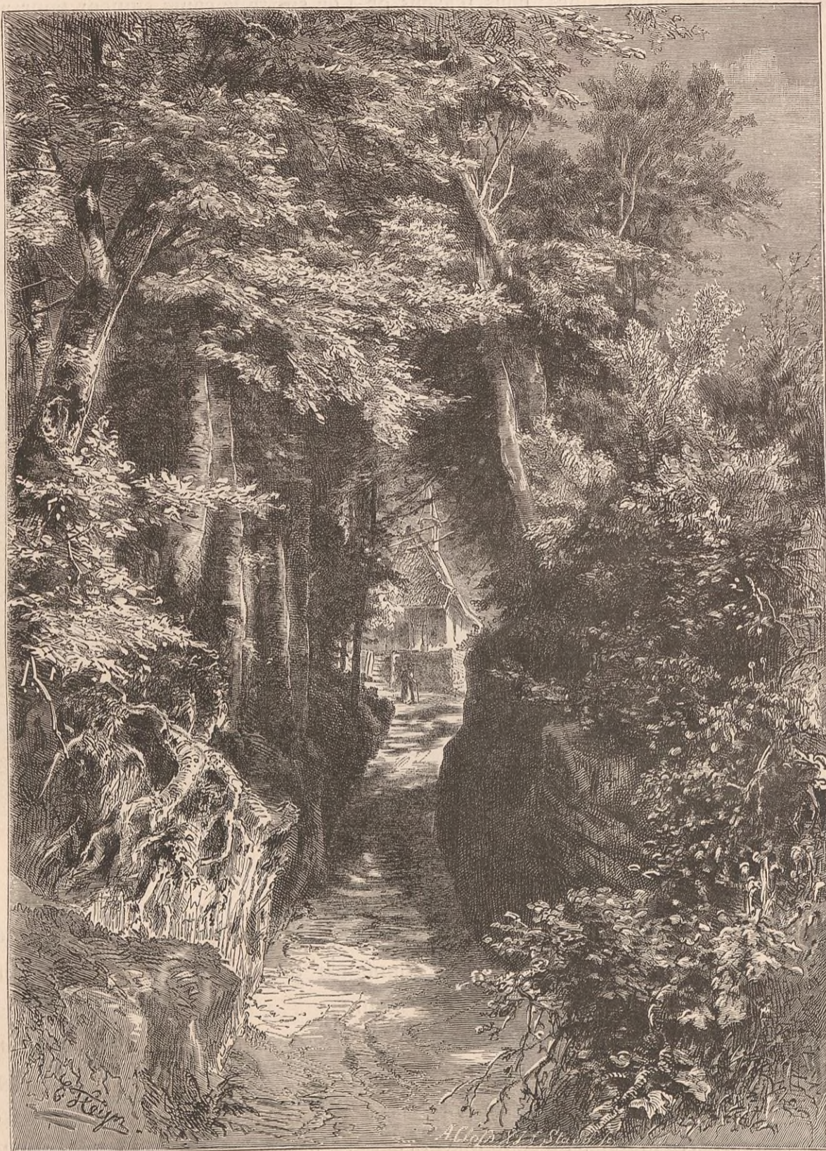
LE CHEMIN CREUX PRÈS DE KÜSSNACHT.

Le Rossberg ou Rüfiberg ( Rufus mons ) est cette montagne de nagelfluhe à quatre ou cinq sommités