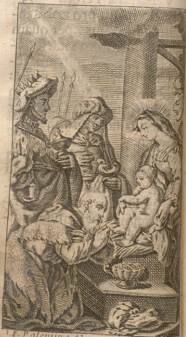
U. F. Palomino. f.