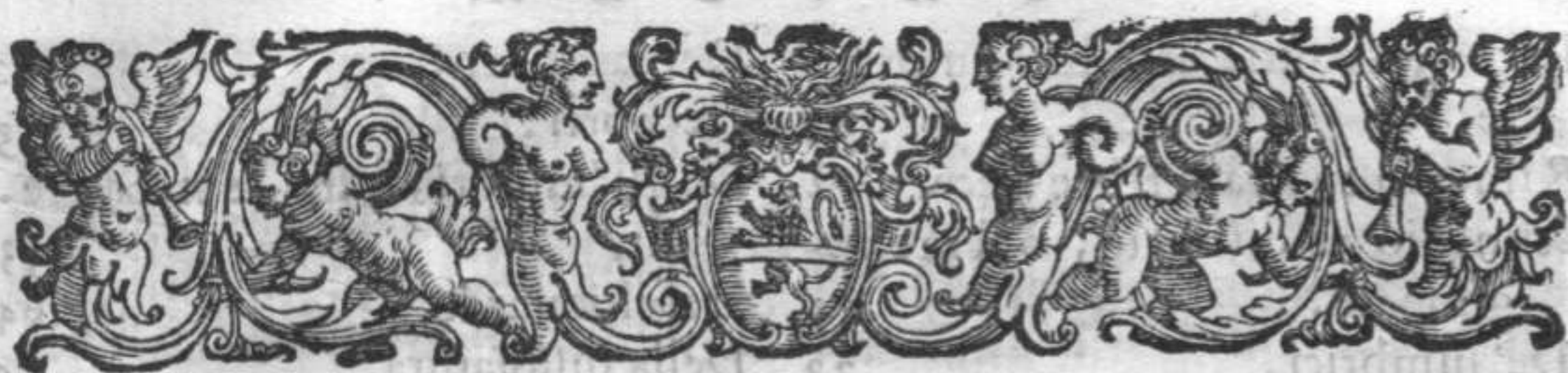
TAVOLA DI TUTTO QUELLO CHE SI CONTIENE NELL'OPERA.