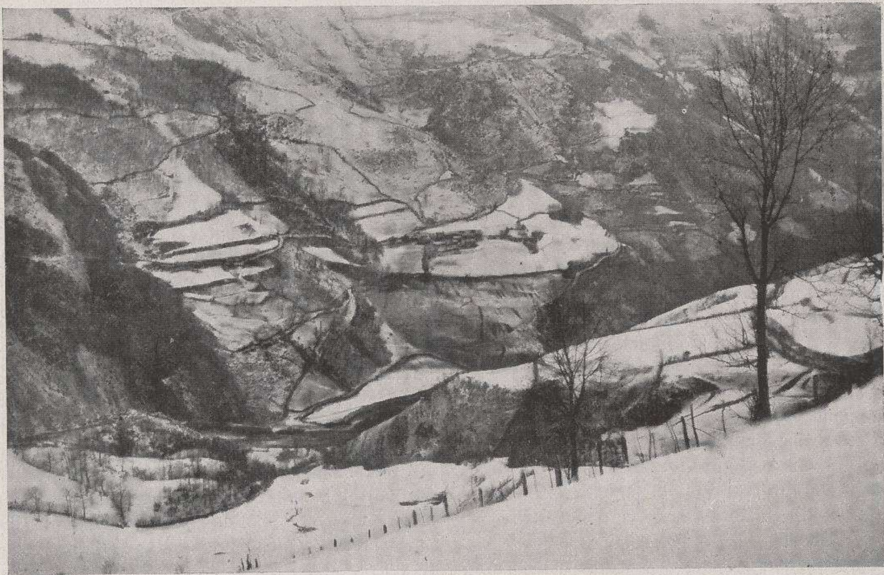
Pajares. Llanos de Somerón.