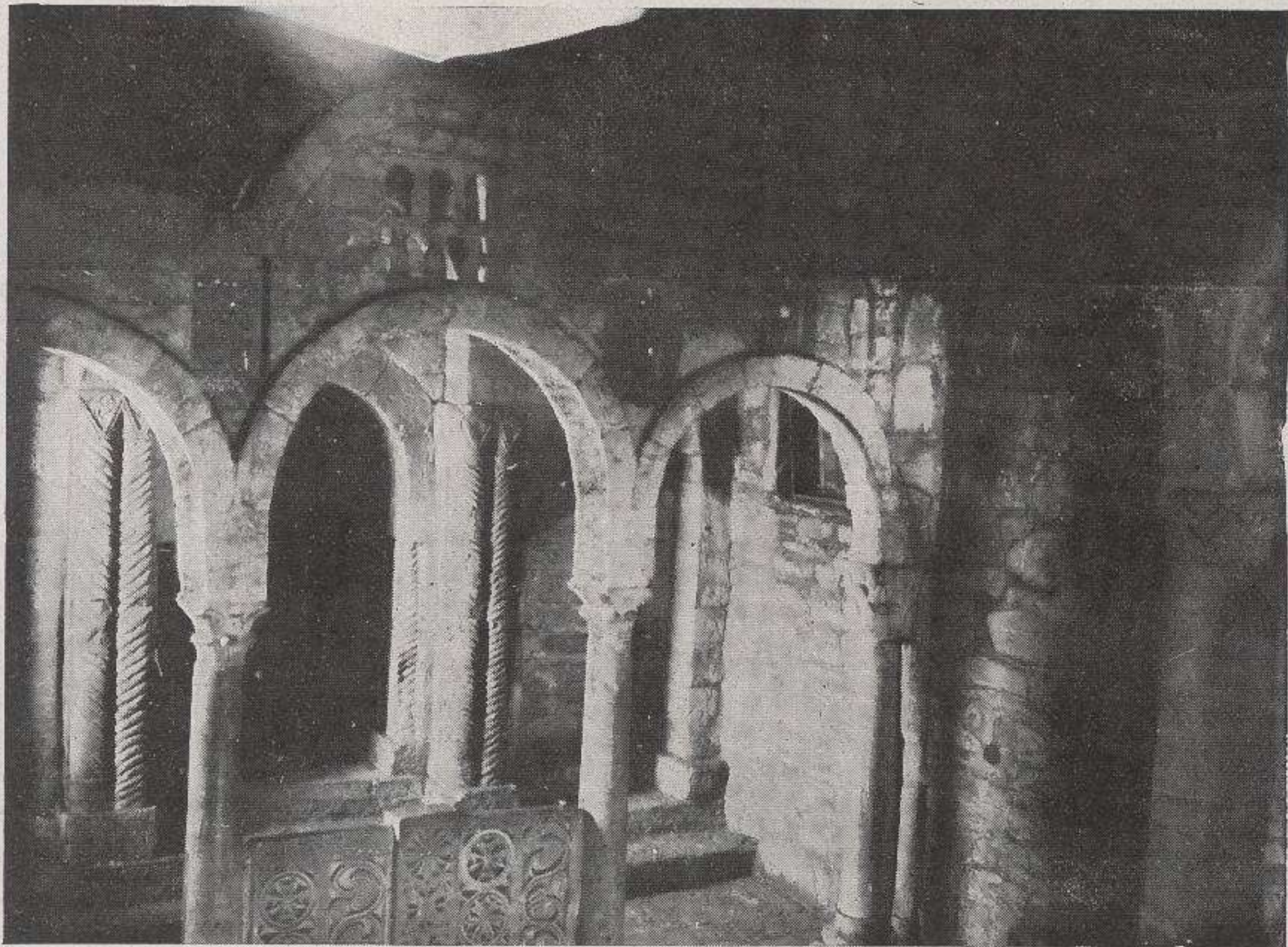
Sta. Cristina.—Detalle del interior.