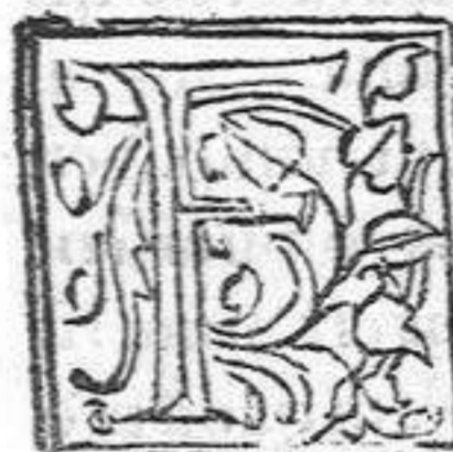
Figura autem simplex est, aut composita. Simplex quæ unam rem continet atque naturalis est: ut doctus. Composita uero quæ ex arte fit: duas res habet: ut indoctus. Composita uero fit figura quatuor modis. Quæ in arte sunt positi: quod autem dixit ex corruptis: ita intelligere debemus: ut tunc intelligamus corrupta esse in compositione quotiens resoluta integrari possunt ut si quis dicat concipio iure dicitur corruptum quia si soluat facit capio: quod est in egrum: & conficio facit facio & similia.

N umerus autem singularis est aut pluralis. Dualis uero græcus non usurpatur nisi in nominibus duobus quæ sunt duo & ambo atque ideo etiā inæqualiter declinantur.