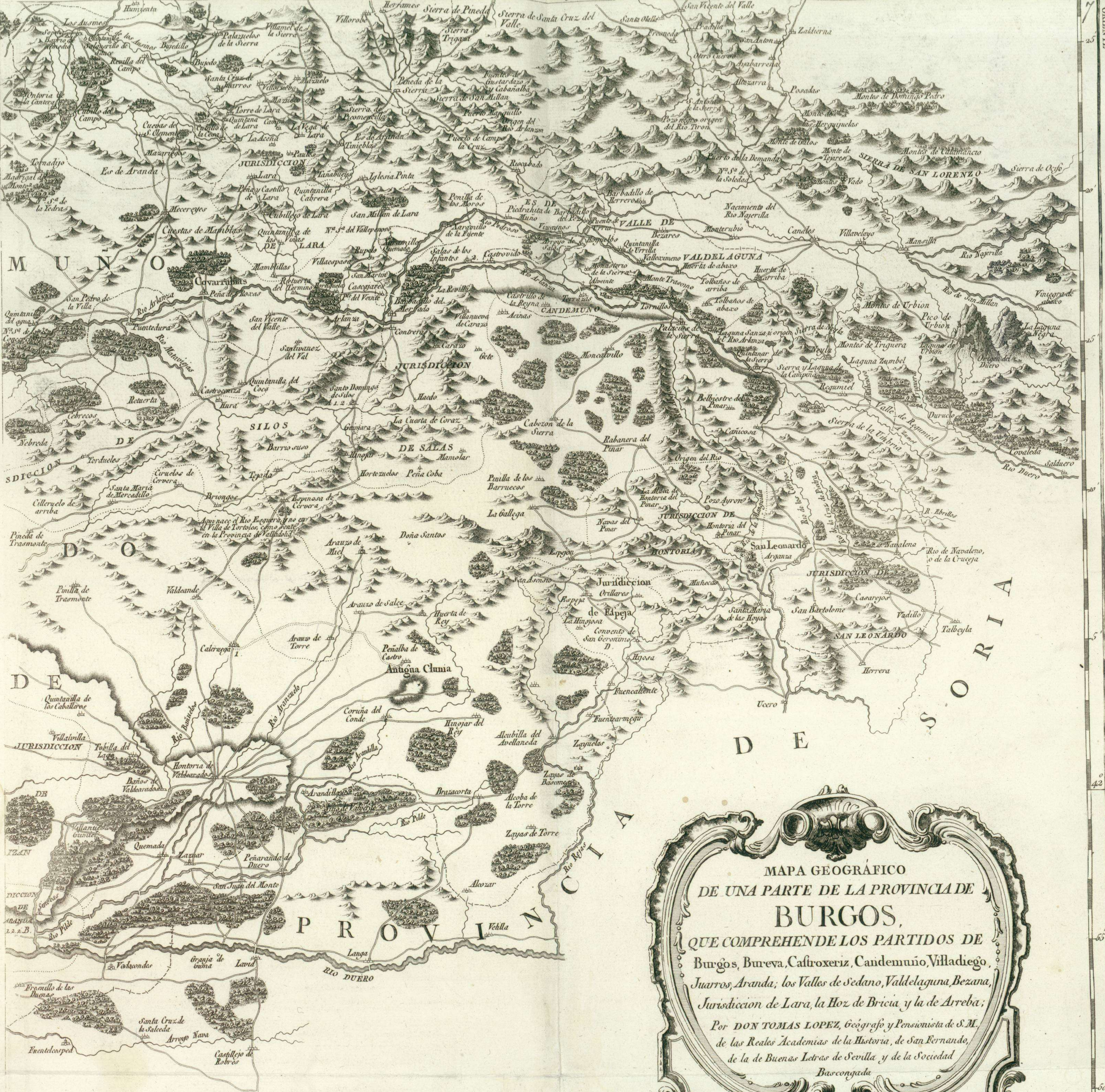
MAPA GEOGRÁFICO DE UNA PARTE DE LA PROVINCIA DE BURGOS, QUE COMPREHENDE LOS PARTIDOS DE Burgos, Bureva, Castrojeriz, Candemuño, Villadiego, Juarros, Aranda, los Valles de sedano, Valdelaguna, Bezana, Jurisdicción de Lara, la Hoz de Bricia y la de Arreba; Por DON TOMAS LOPEZ, Geógrafo y Pensionista de S.M. de las Reales Academias de la Historia, de San Fernando, de la de Buenas Letras de Sevilla y de la Sociedad Barcongada 1784

SEG O V I A Longitud oriental del Pico de Teide, o de Tenerife 40° 45° 50° 55° 13° 5' 10' 15' 20'