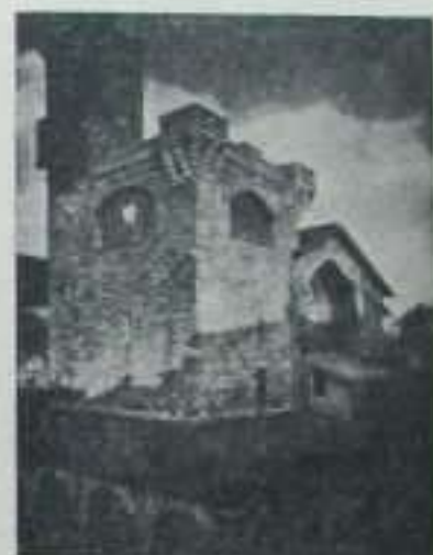
San Nicolás, Pamplona, (Nabarra).