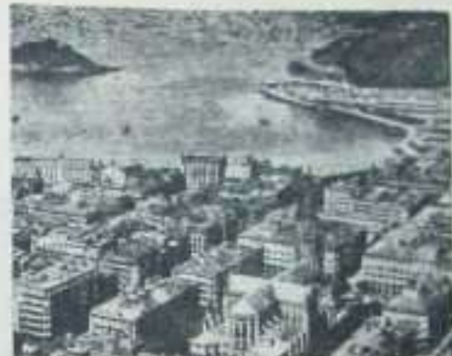
Vista parcial de S. Sebastián (Guip.)