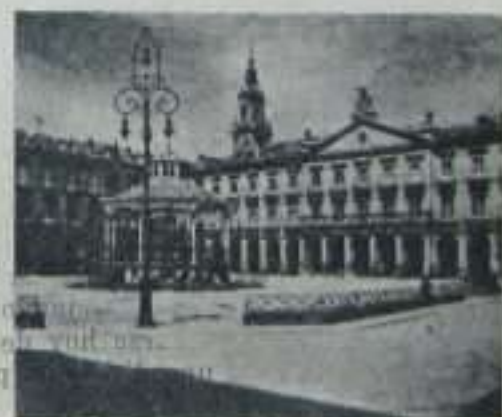
Plaza Nueva, Gasteiz, (Araba)