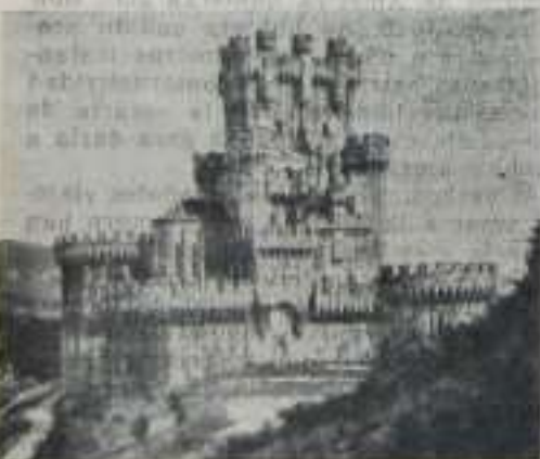
Castillo de Berrón (Bizkaya)