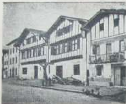
Casas típicas en Añorón (Laburdí)