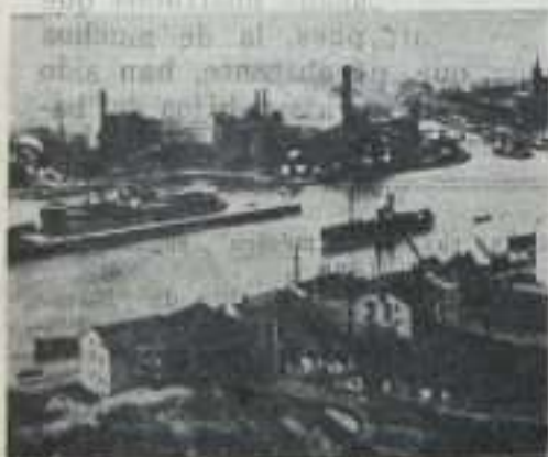
Los altos hornos (Ribao)