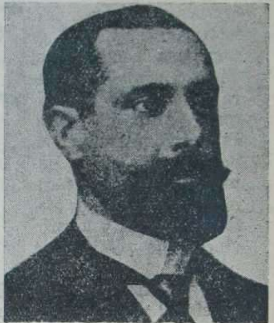
Sabino de Arana y Goiri, hombre de acción, ciencia y doctrina. Impulsó la nación baska hacia la reconquista de sus derechos

De ahí que el aspecto saliente de la historia de Euzkadi pueda resumirse en la lucha constante de un pueblo que defiende su libertad.