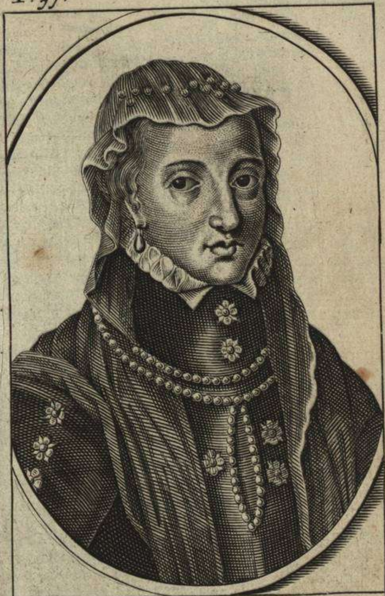
MARGARITA, Parmæ et Placentiæ Dux, Caroli V. Filia, Belgii Gubernatrix.