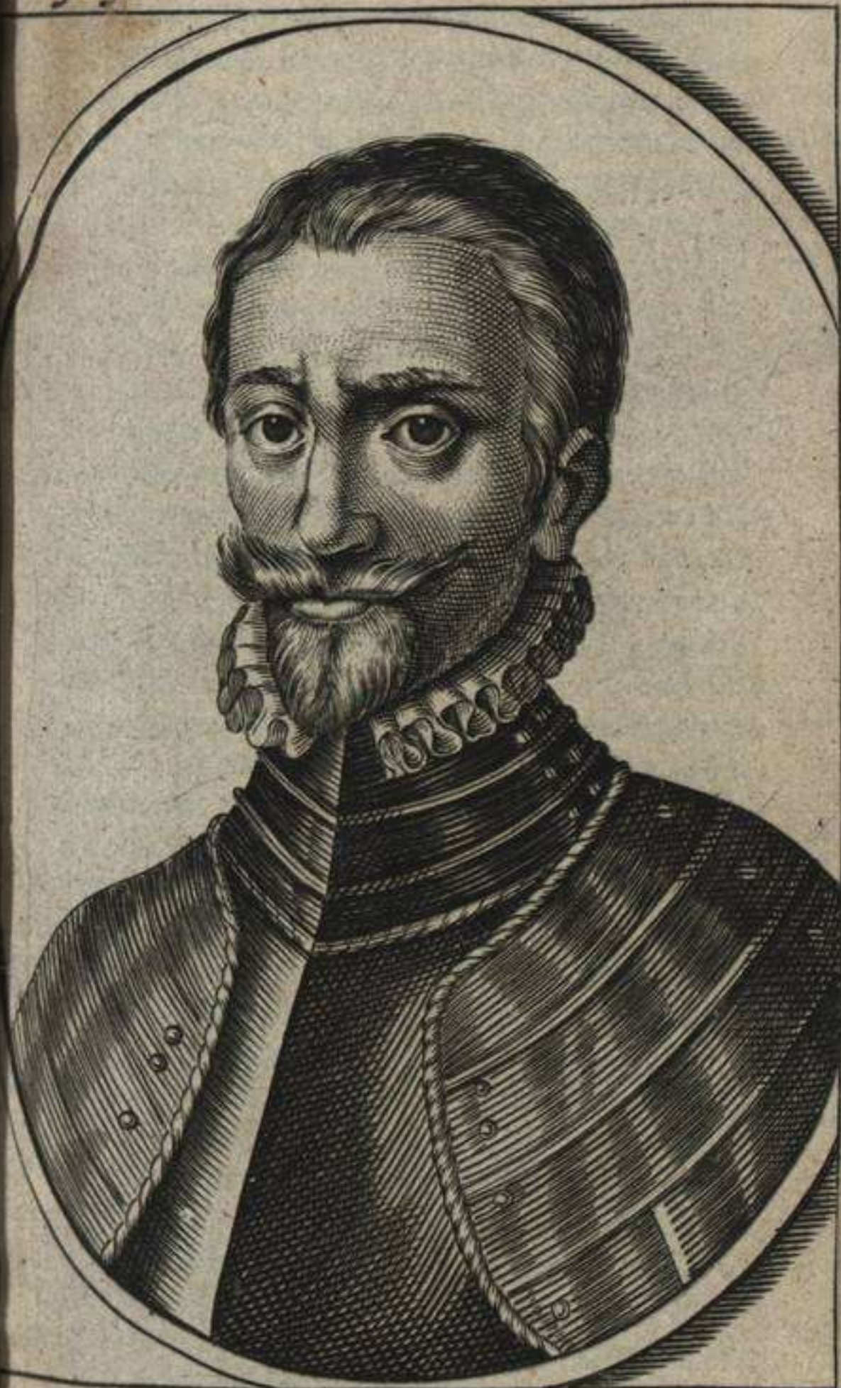
SANCTIVS AVILA, Arcis Antwerpianae Praefectus, Mokenfis expeditionis Dux.