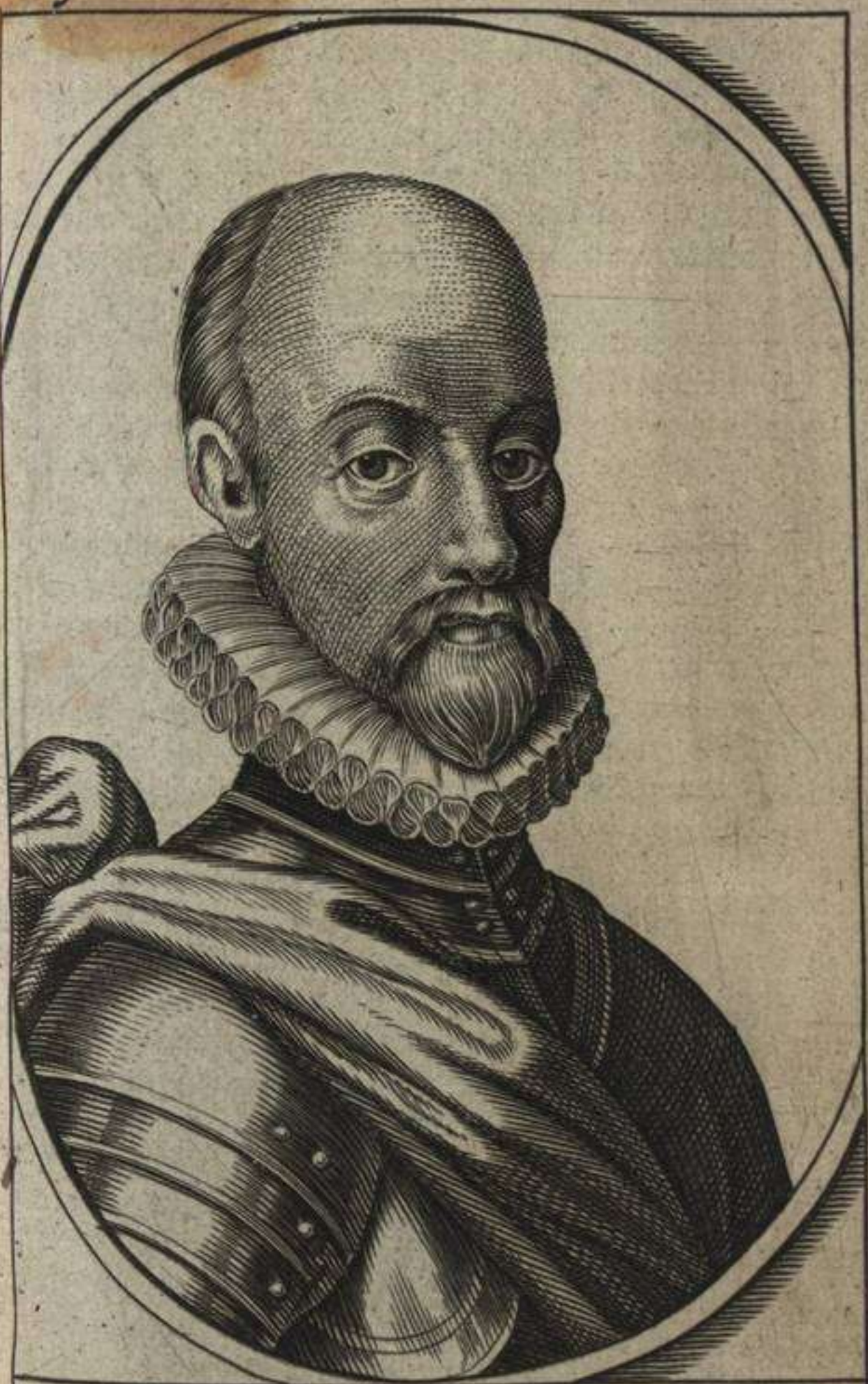
I. LIGNIVS , Comes Arembergü, Friesiæ Præfectus, expeditionis Hiligerlææ Dux.