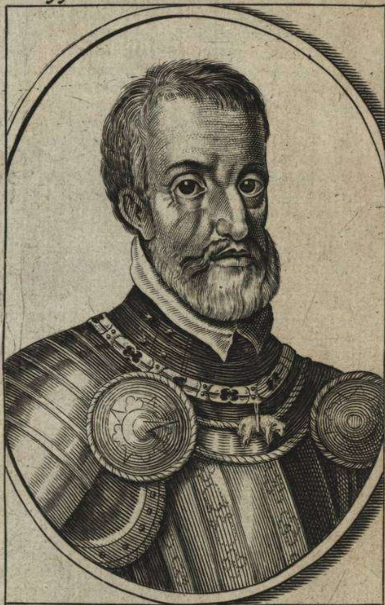
CAROLVS V. IMP. BELGII PRINCEPS.