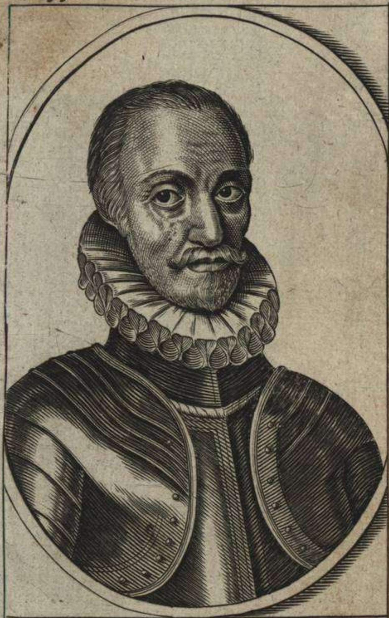
GVILIELMVS NASSOVIVS, Orangii Princeps, Hollandiæ Zelandiæque Præfectus.