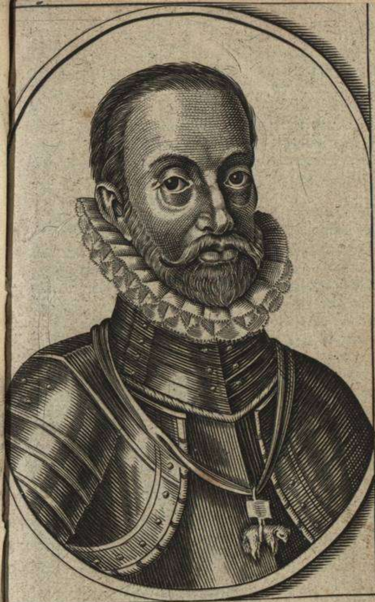
PHILIPPVS II HISPANIARVM REX BELGII PRINCEPS.