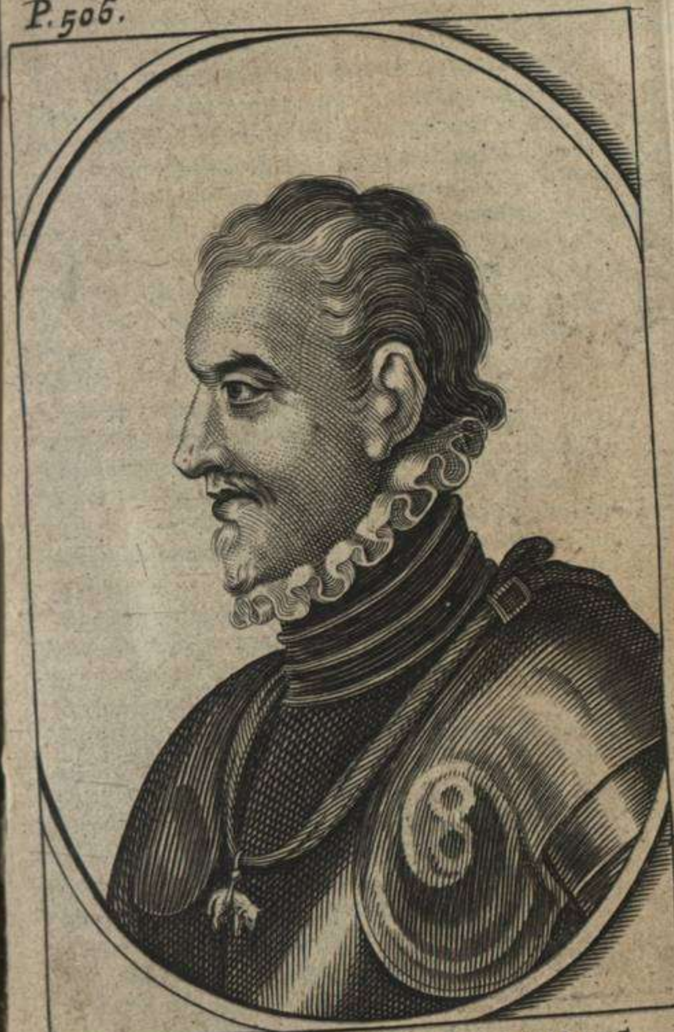
IOANNES AVSTRIACVS, CAROLI V. IMP. FILIVS Belgicae Gubernator.