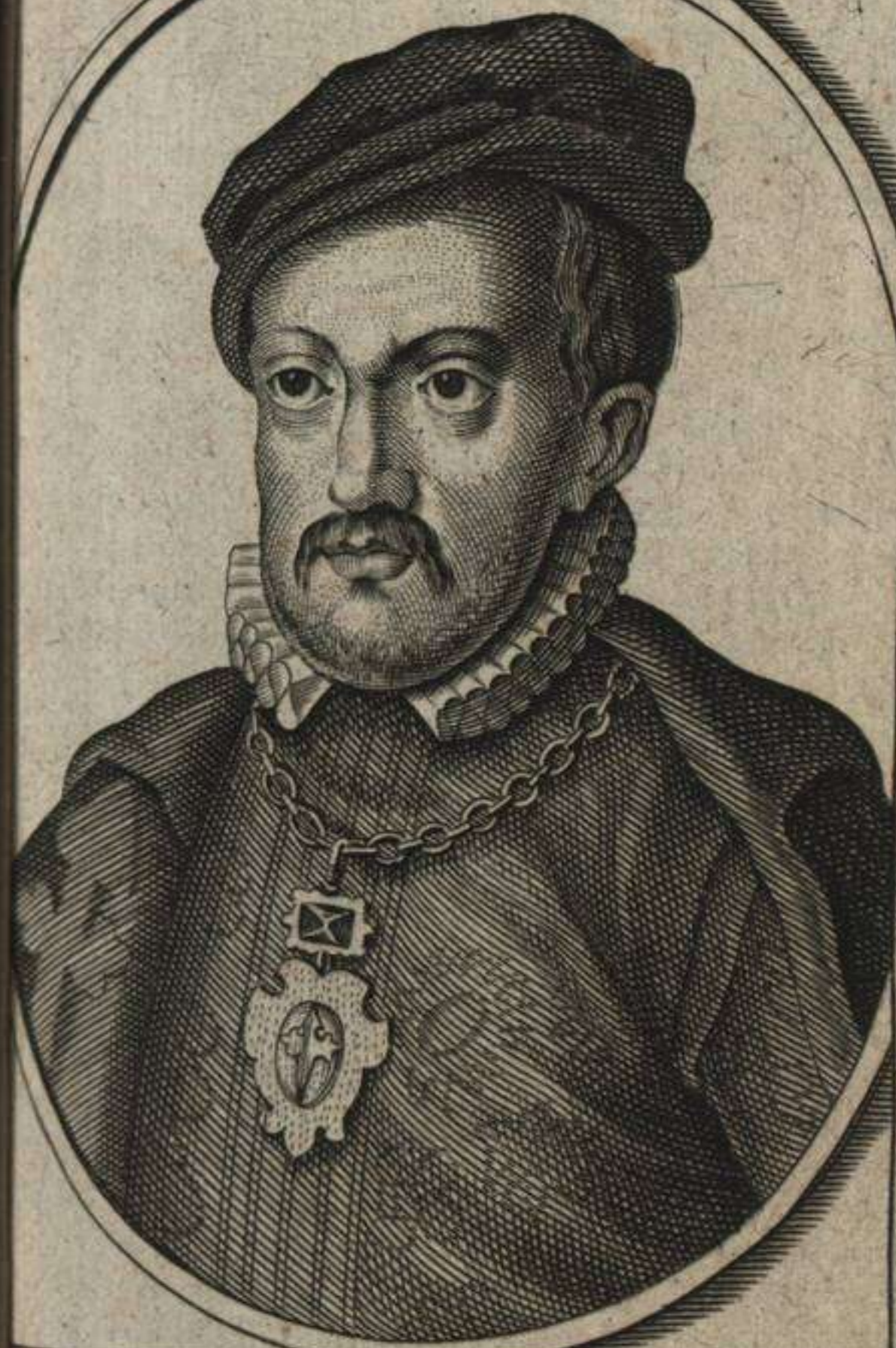
LUDOVICVS REQVESENIVS, Magnus Castellæ Commendator, Gubernator Belgii.