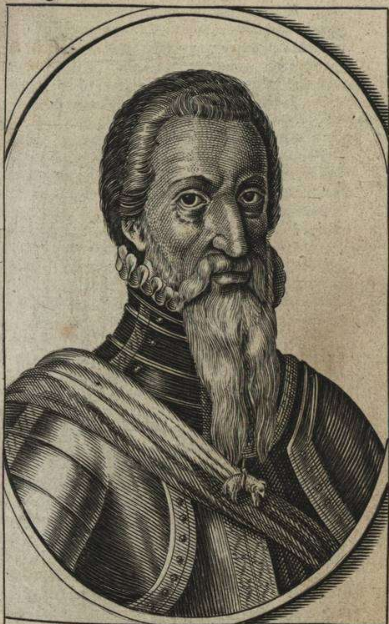
FERDINANDVS TOLETANVS, Albæ Dux, Belgii Gubernator.