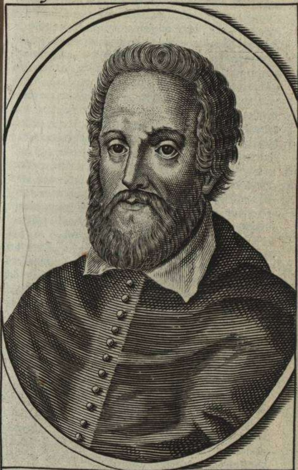
ANTONIUS PERENOTTUS Granvellanus, Margaritæ à consiliis.