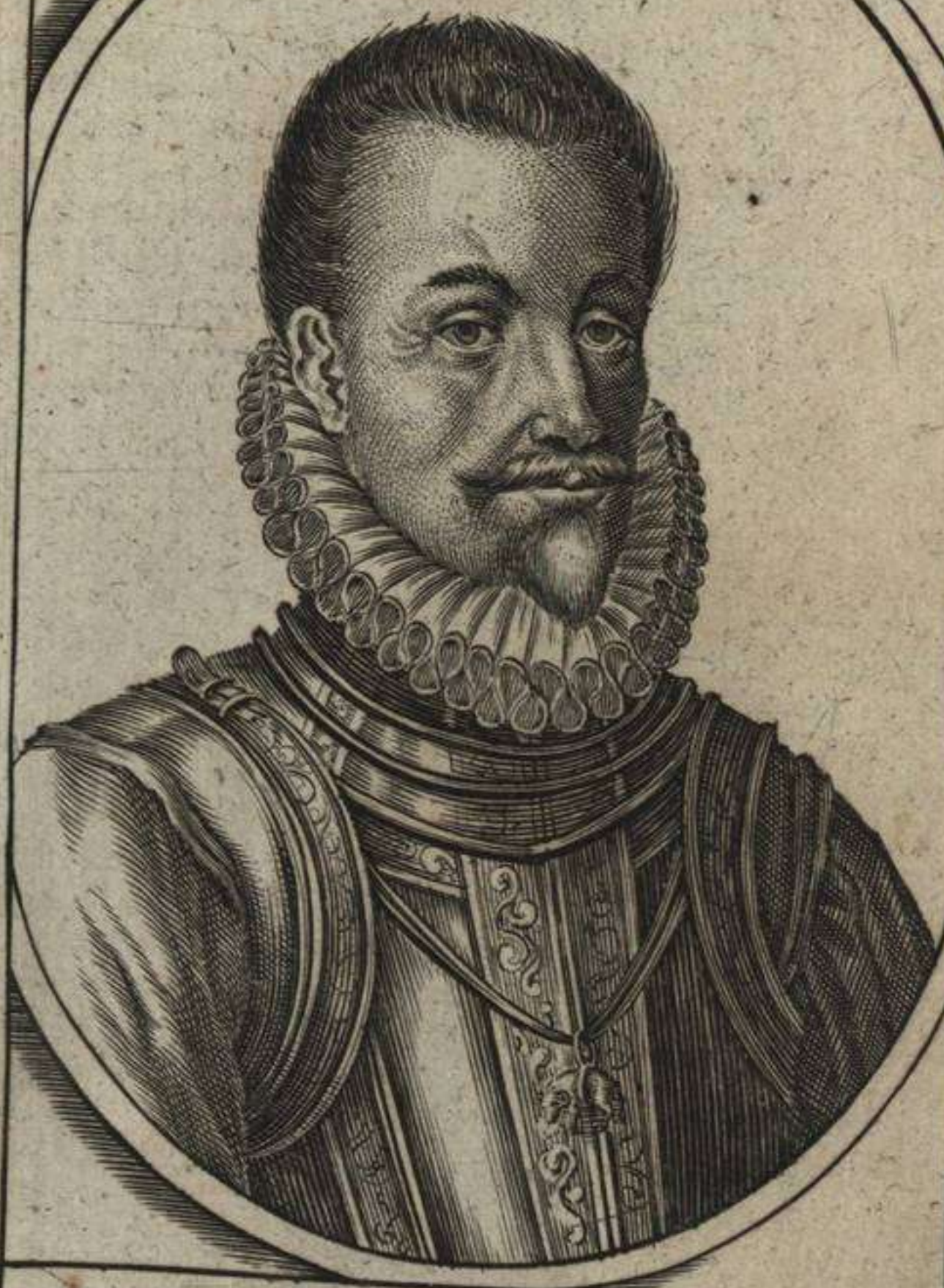
ALEX FARNESIUS PAR ET PLAC PRIN CEPS CAR V. NEPOS BELGII GVBER