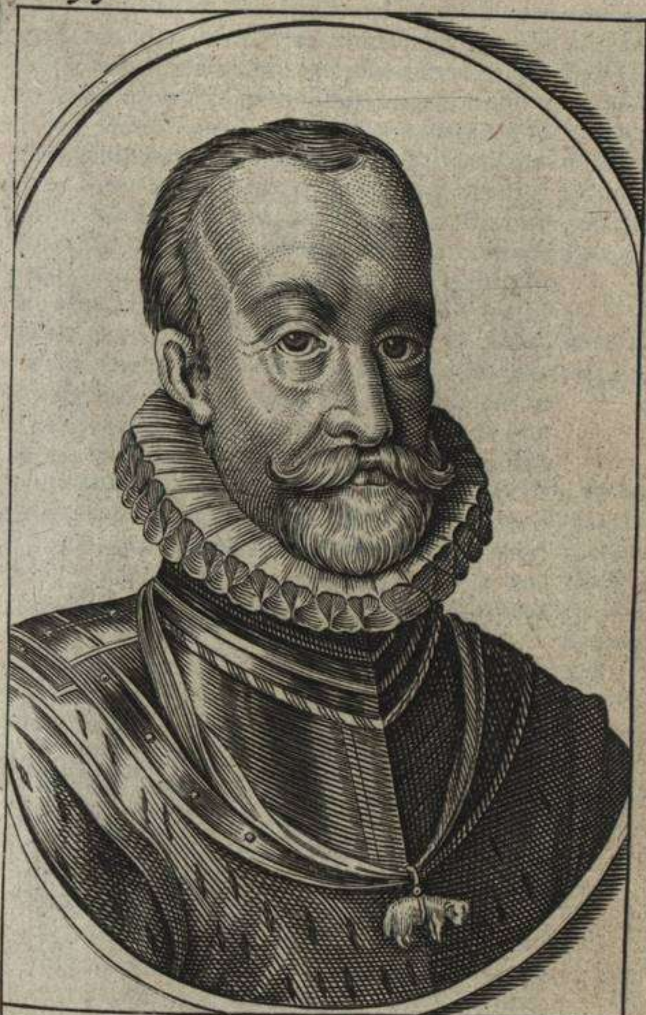
PETRVS ERNESTVS, Comes Mans. feldius, Lunenburgi Gubernator, Generalis Castrorum Praefectus, expeditionis Gallicae Dux.