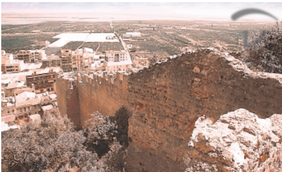
Foto 200. Detalle posterior de la torre albarrana.