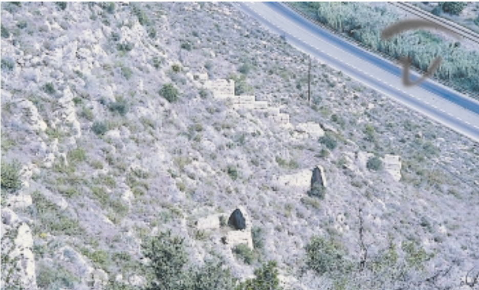
Foto 198. Muralla de la zona de habitación.