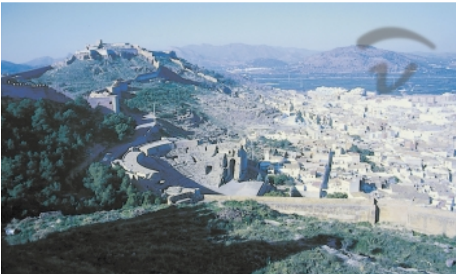
Foto 208. Vista general de su interior y del antiguo teatro romano.

Amplia panorámica de todo su recinto (fotos 206 y 207).