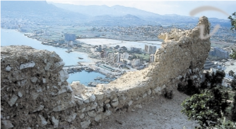
Foto 193. Vista general y ruinas de estructuras.