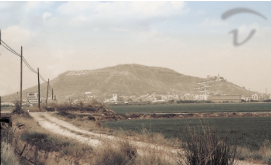
Foto 202. Visión de conjunto.