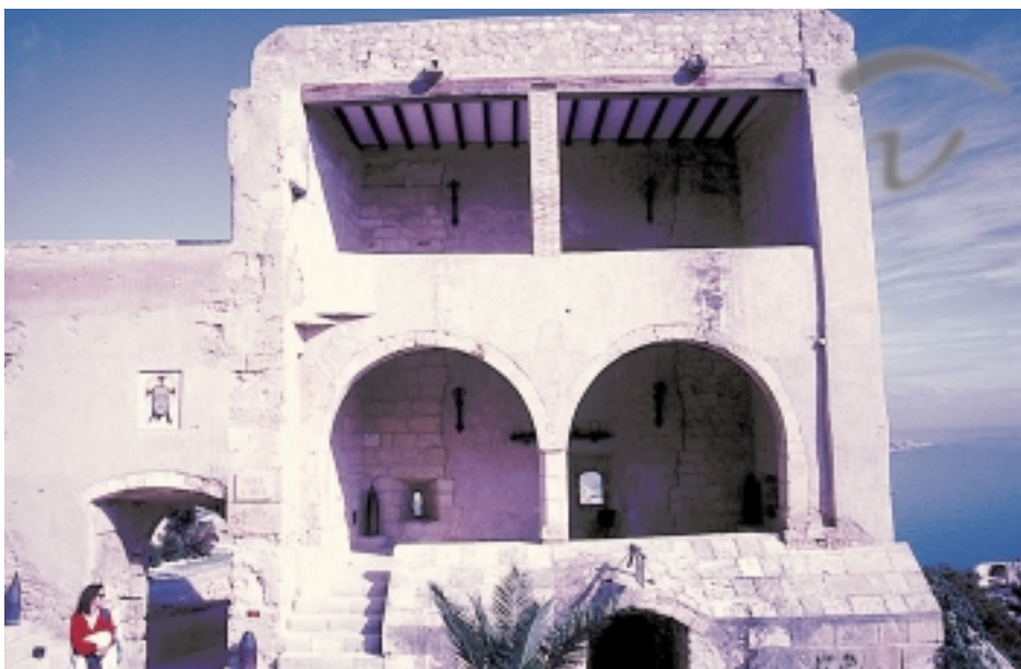
Foto 196. Algunas de las estructuras más importantes de su interior.