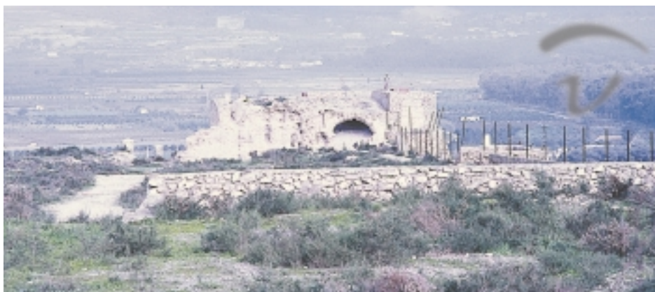
Foto 190. Perspectiva general.