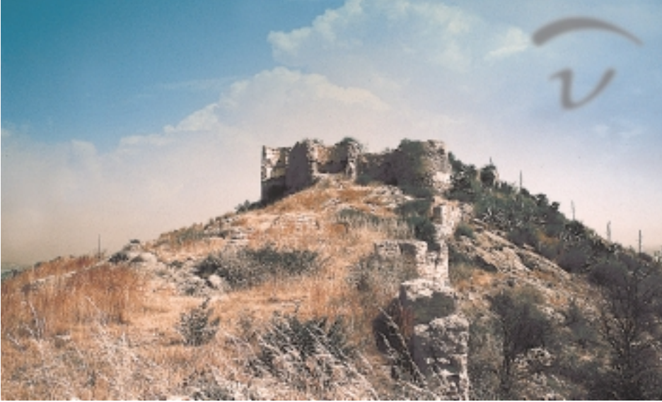
Foto 197. Vista general de uno de sus lados.