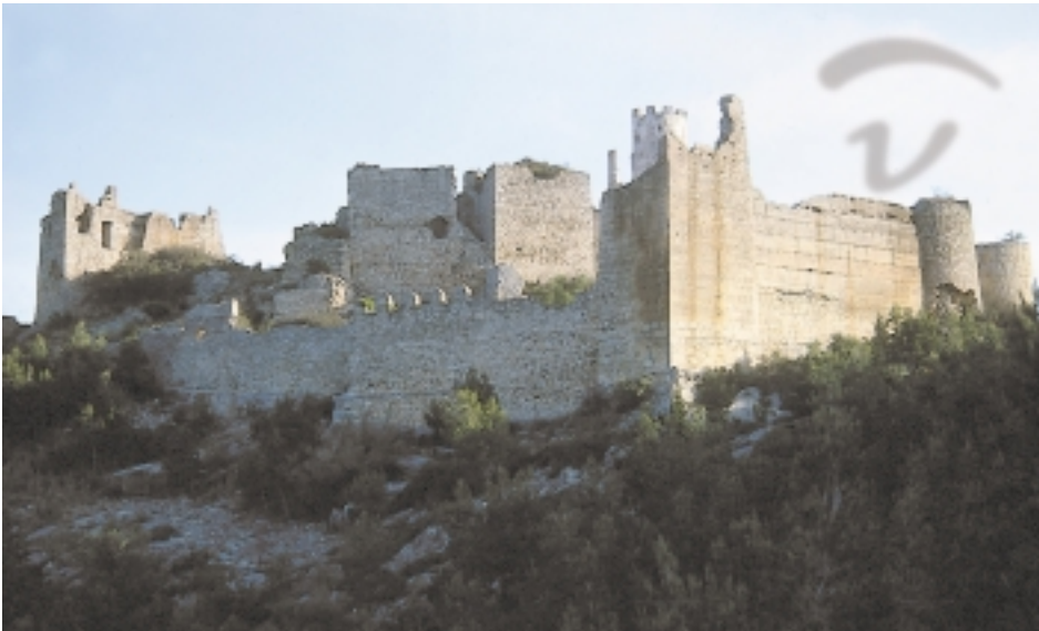
Foto 219. Restos de estructuras exteriores.