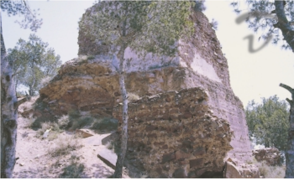
Foto 205. Escasos y deteriorados restos de este histórico castillo.