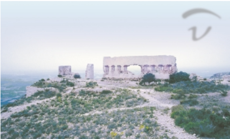
Foto 204. Recinto superior.