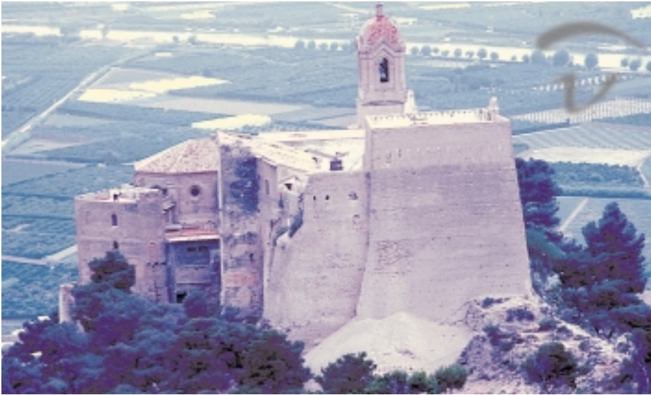
Foto 203. Castillo inferior.