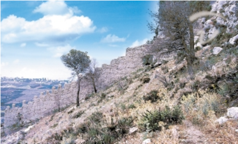
Foto 217. Muralla de la zona de habitación.