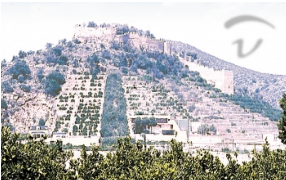
Foto 199. Aspecto general con la torre albarrana que descende hasta media ladera.