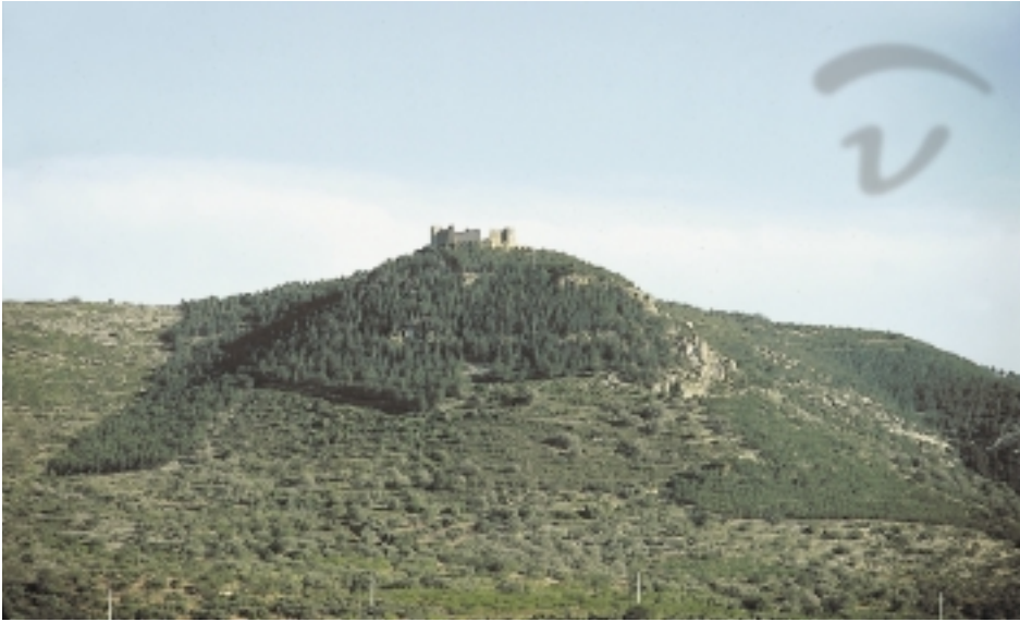
Foto 218. Panorámica general.