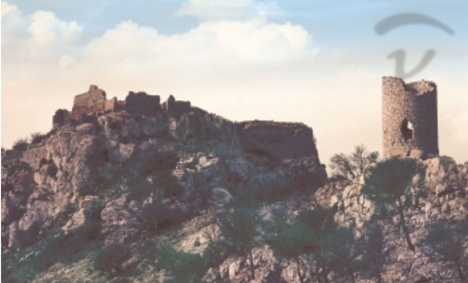
Foto 216. Torre circular adelantada del castillo que servía de punto de control.