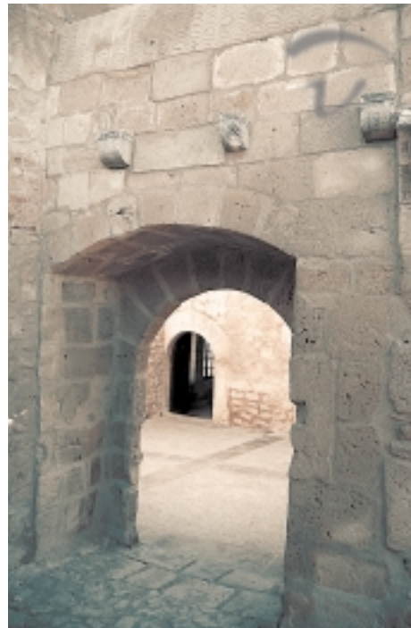
Foto 194. Puerta interior.