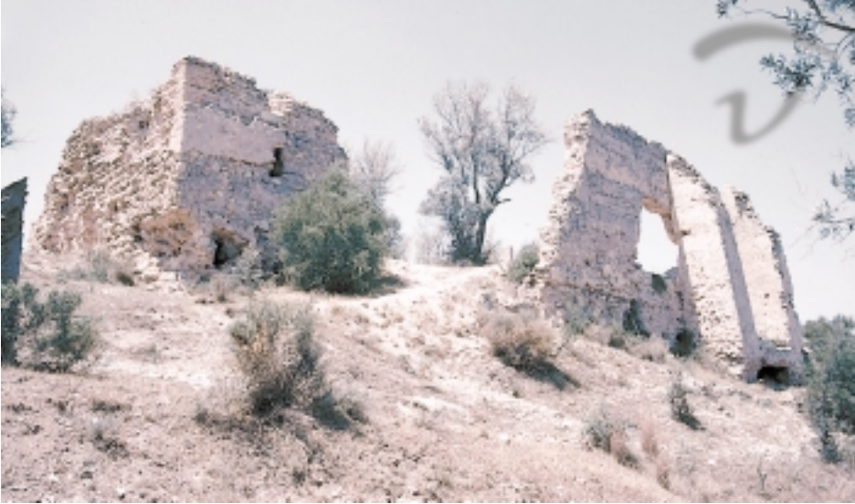
Foto 201. Restos o ruinas del interior.