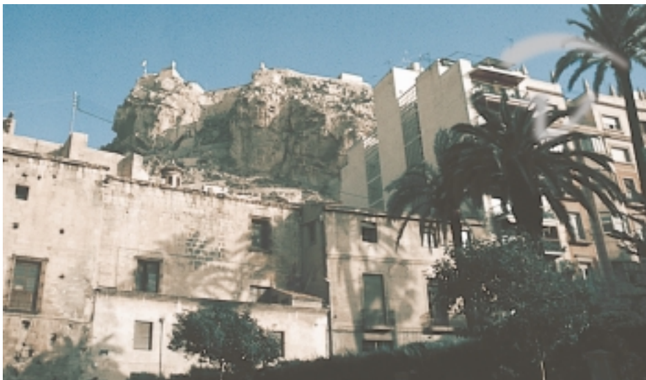
Foto 195. Posición del castillo.