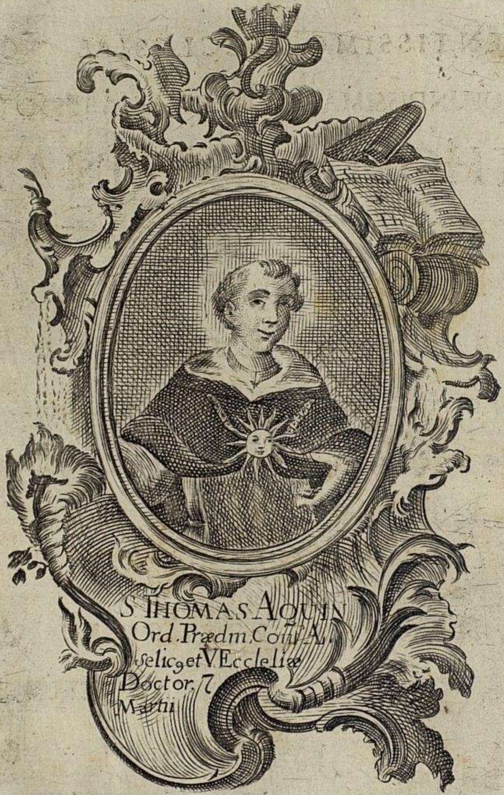
S THOMAS AQUIN Ord. Prædm. Con. A. Selic et V Eccleliæ Doctor. 7 Martii