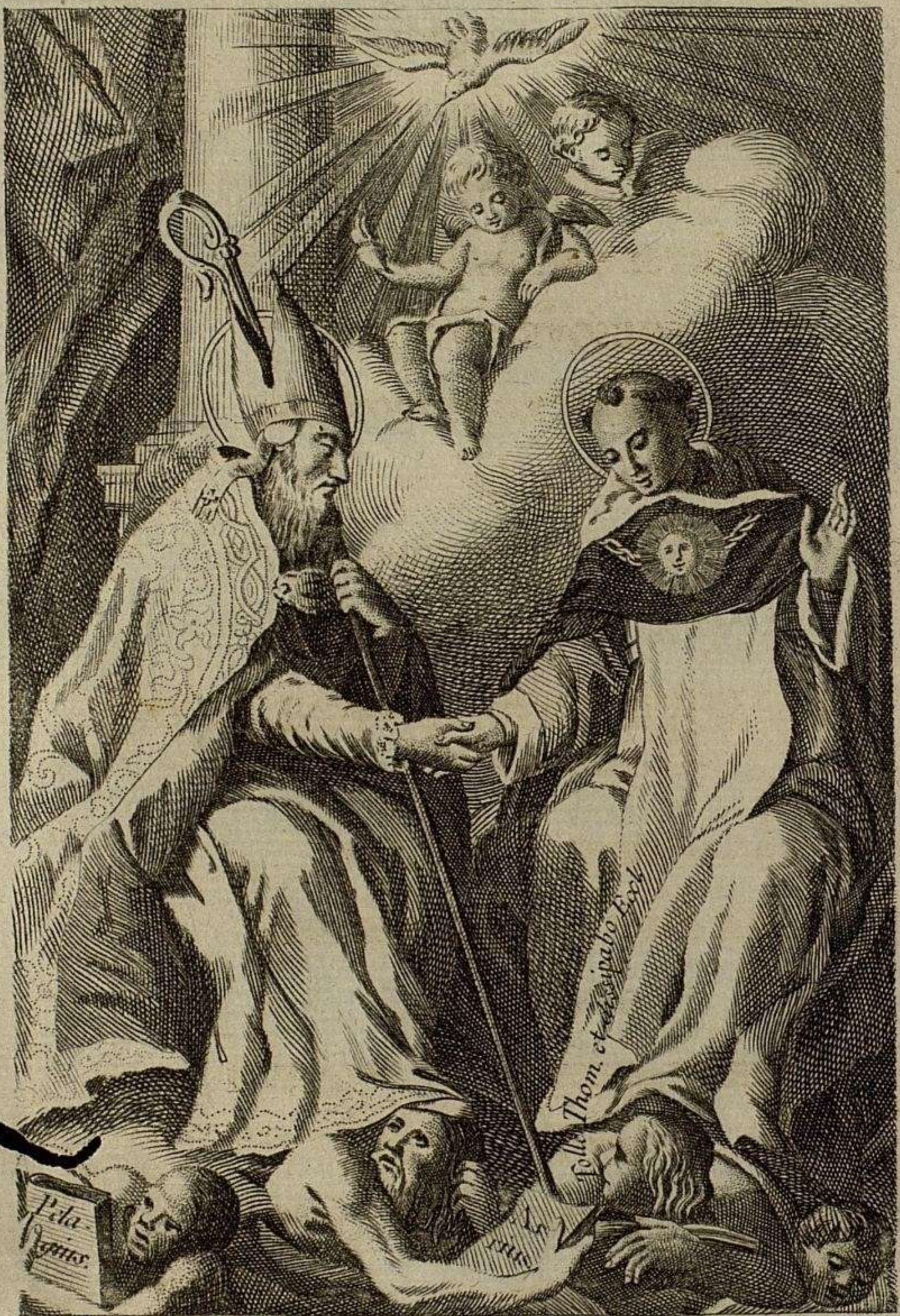
SAN AGUSTIN, Y SANTO THOMAS.