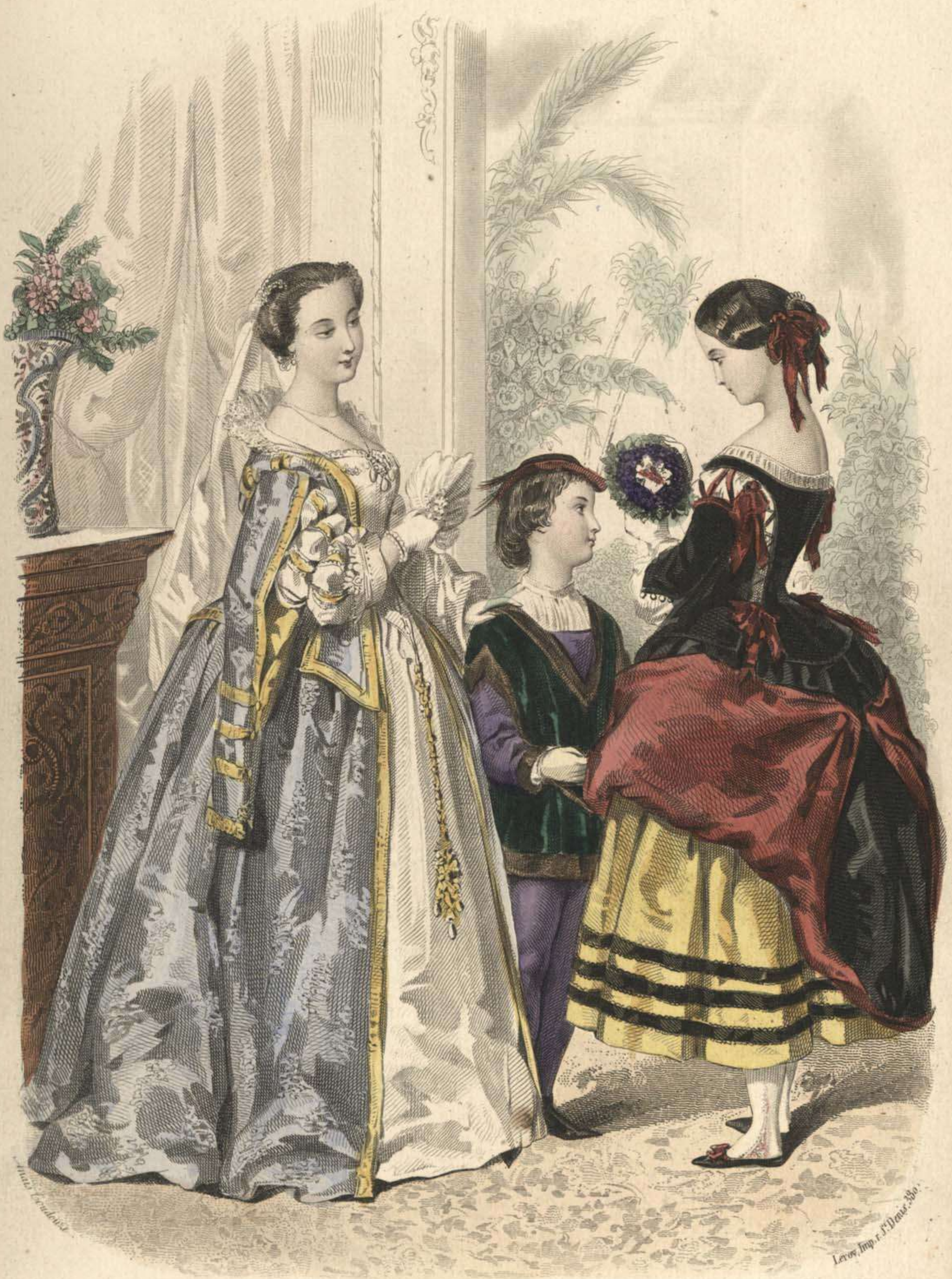
Estafette des Modes Boulevard S t . Martin. 69.