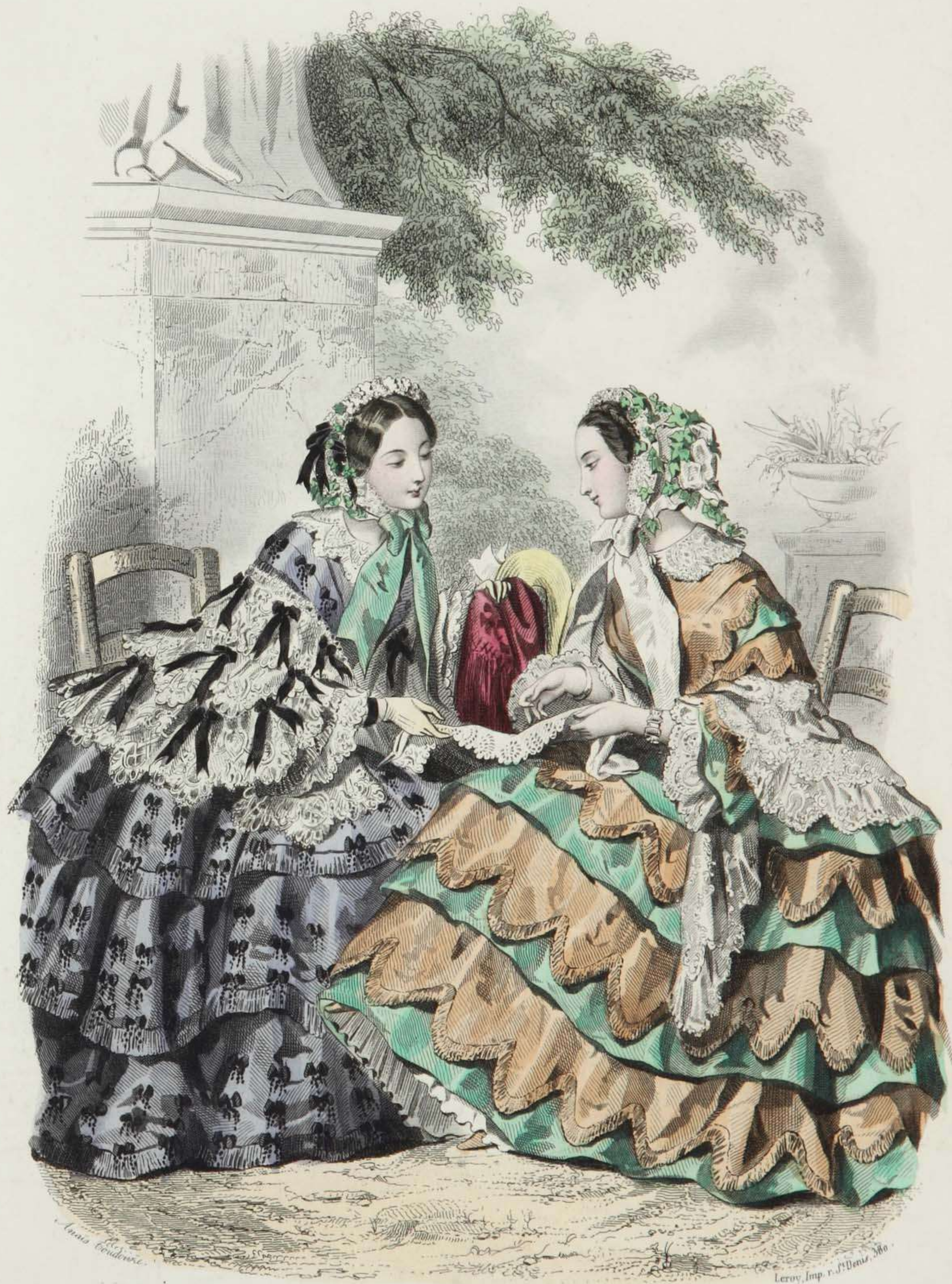
Estafette des Modes Boulevard S. t Martin. 69.