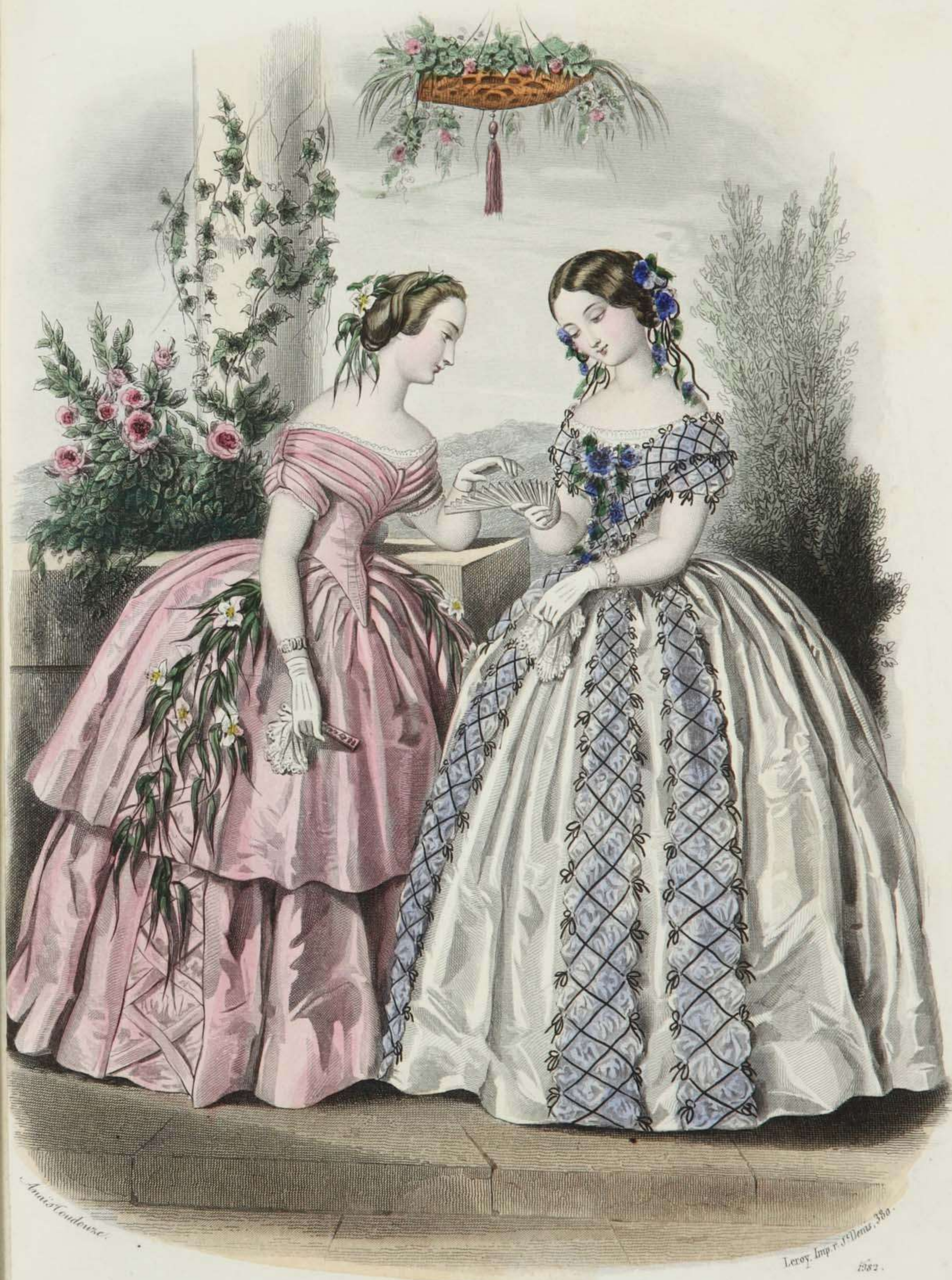
Estafette des Modes, Boulevard S t . Martin, 69.