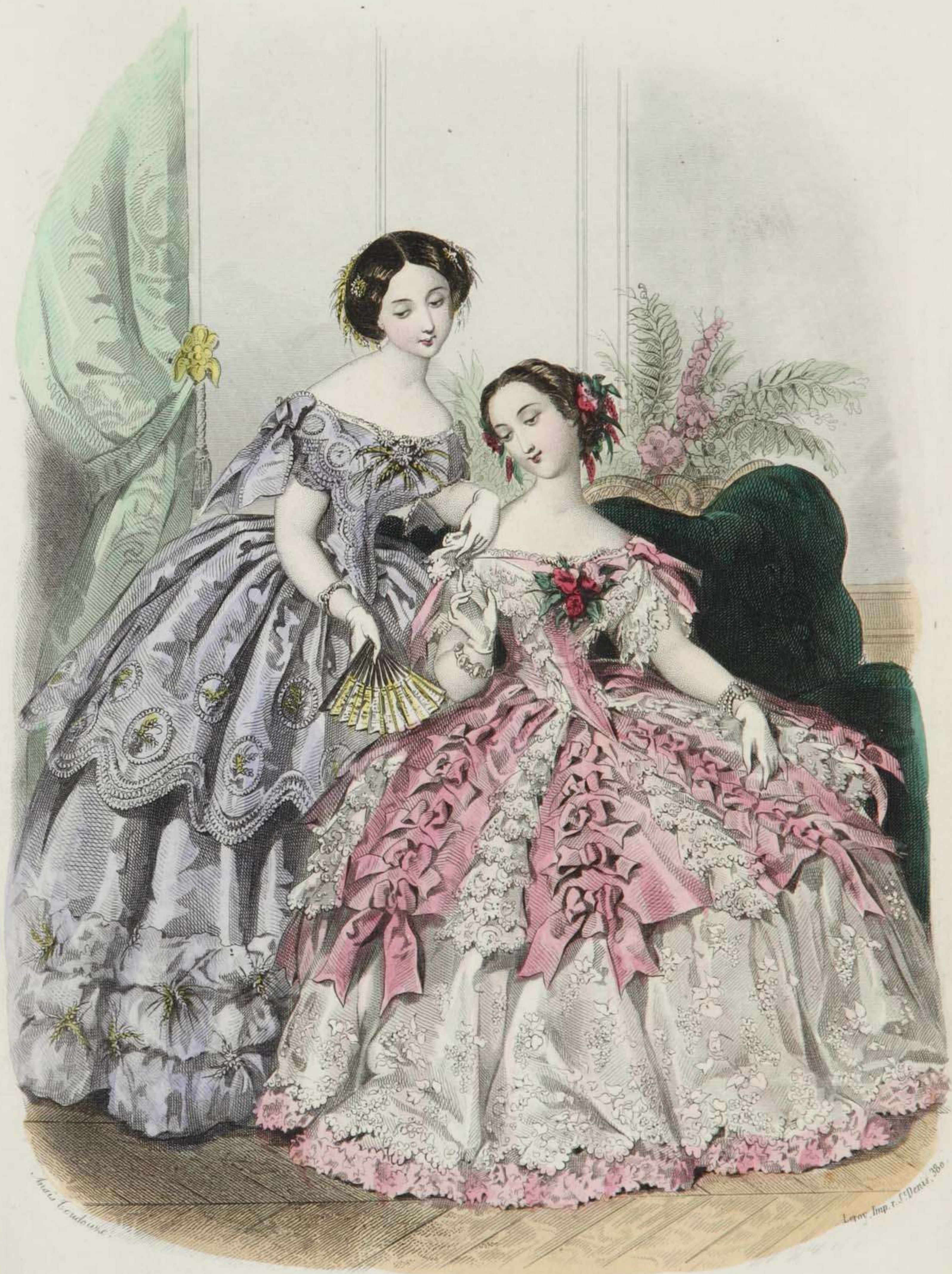
Estafette des Modes Boulevard S t Martin, 69.