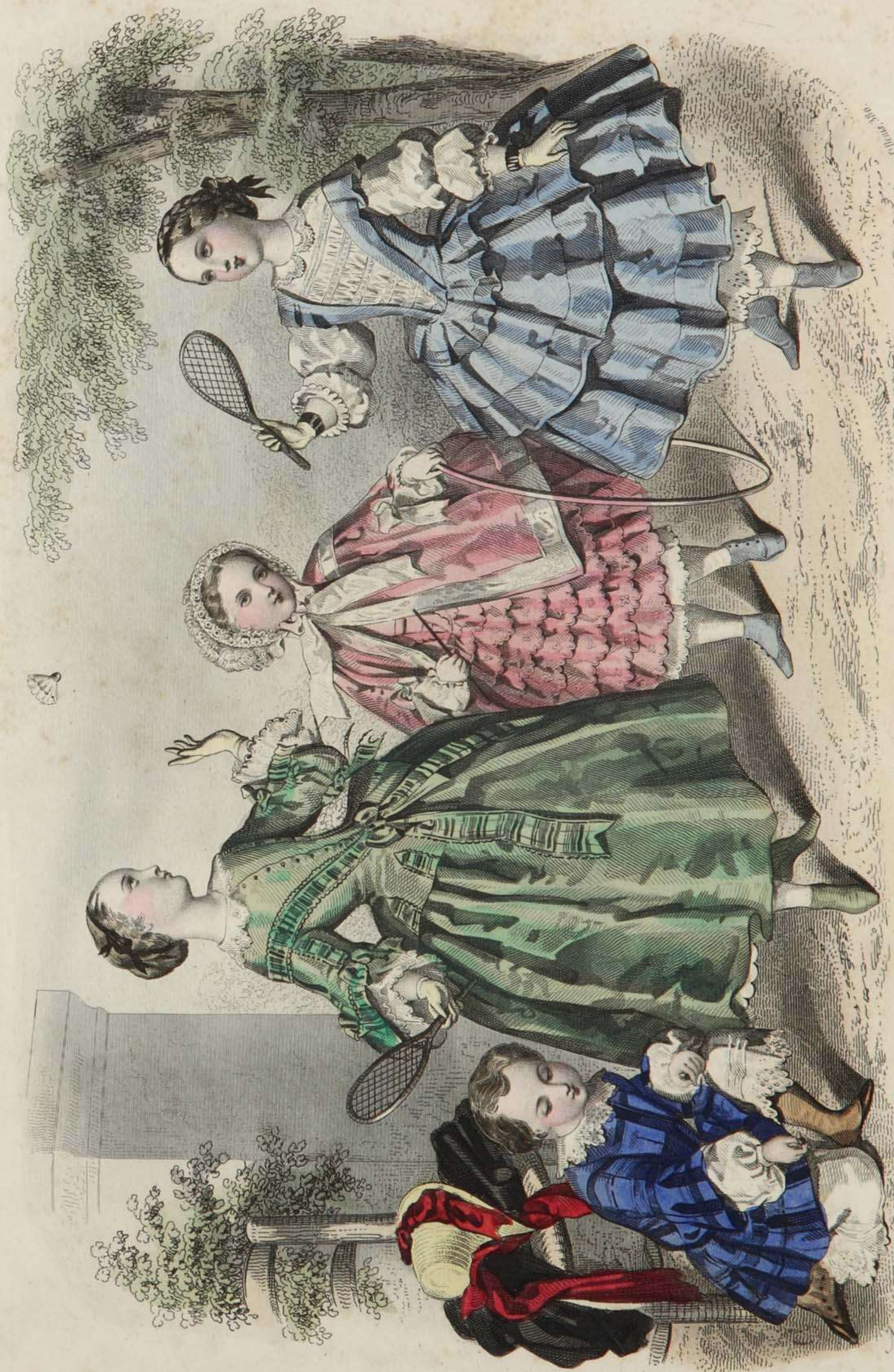
Estafette des Modes Boulevard, S. Martin, 69