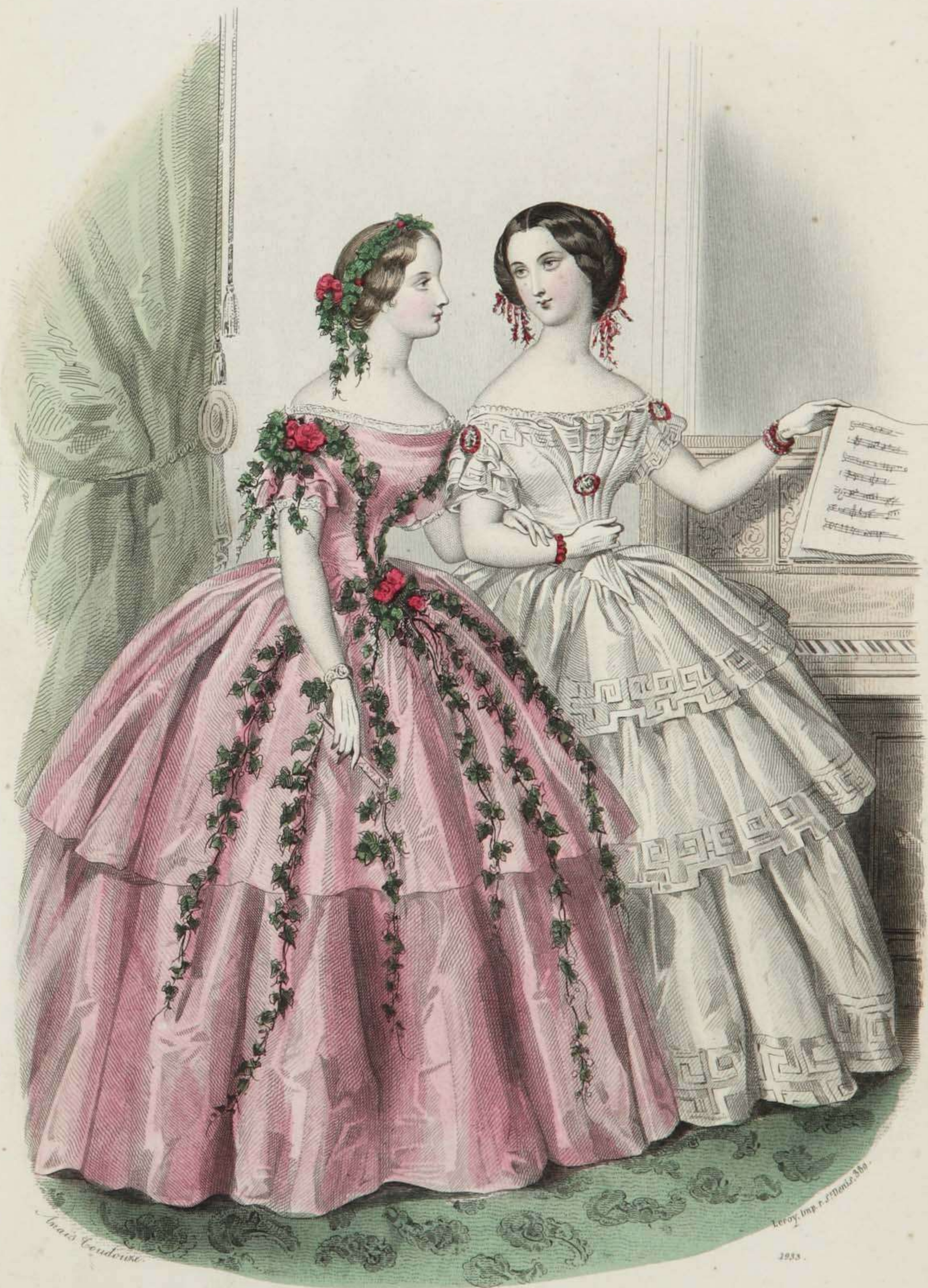
Estafette des Modes Boulevard S. t Martin, 69.