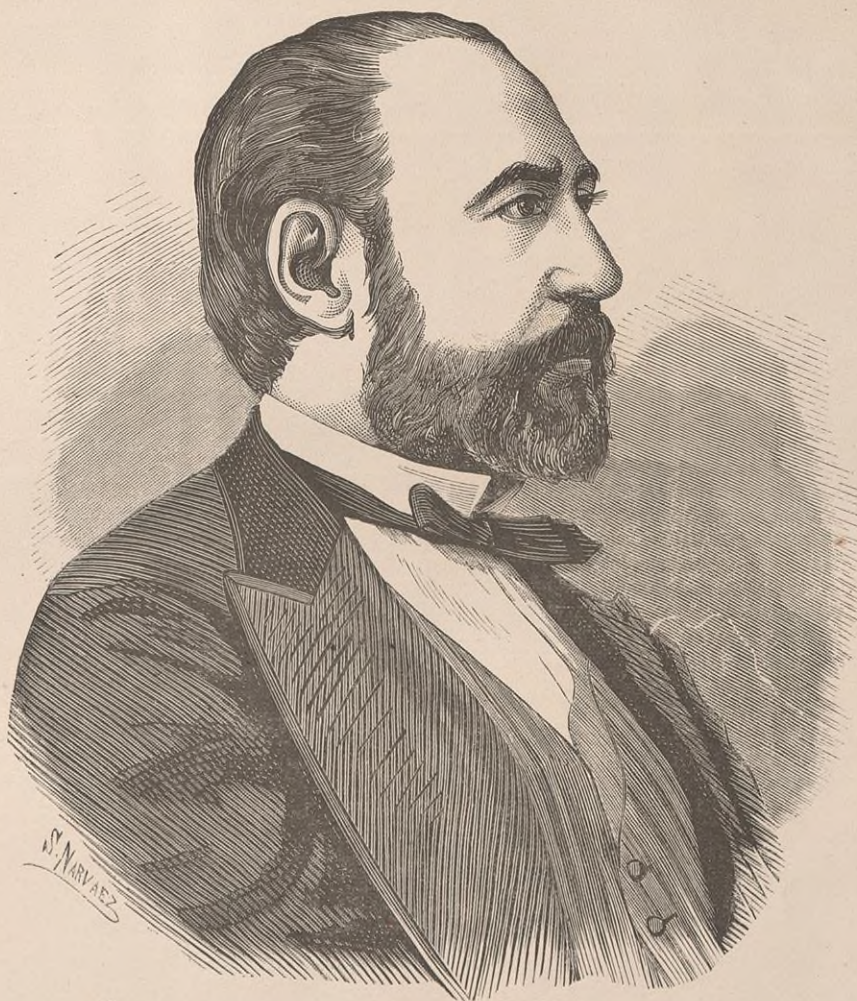
Francisco Asenjo Barbieri