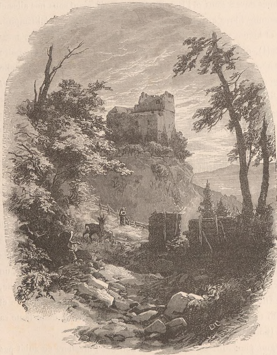
BURG DES HABSBOURG.

Rodolphe IV, en qui cette maison allait atteindre son apogée, était fils d'Albert et d'Edwige de Kybourg. Les Kybourg, on s'en souvient, avaient hérité, comme parents, de la plupart des biens des Zähringen dans la Transjurane. A la mort de Frédéric II, Rodolphe était âgé de trente-deux ans. Demeuré gibelin, c'est-à-dire fidèle à l'Empereur, tandis que son cousin avait épousé les intérêts du sacerdoce, le jeune prince continua de soutenir jusqu'au bout, en la personne même de l'infortuné Conradin, la cause de ces Hohenstauffen auxquels il devait sa propre fortune. Plus tard, ayant mis la main sur l'opulent héritage des Kybourg sans se soucier des prétentions qu'y élevait la maison