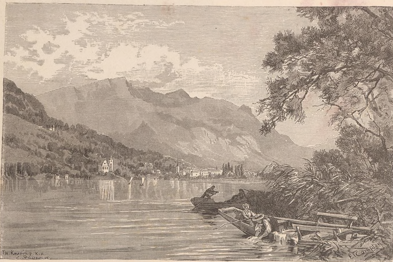
SARNEN ET SON LAC.

La mort même de l'Empereur (1313), qui survint sur ces entrefaites, ne fit pas perdre contenance aux Schwytzois. Décidés à payer jusqu'au bout d'audace, ils prirent immédiatement parti dans le schisme qui divisait les membres de la diète, et des deux élus, dont l'un était le duc Frédéric d'Autriche et l'autre Louis de Bavière, ils reconnurent bravement ce dernier. Puis, comme pour mieux accuser leur résolution, ils firent une nouvelle expédition contre leurs voisins d'Einsiedeln. Depuis des siècles, les abbés du couvent répondaient à toutes leurs réclamations concernant les pâtis dont j'ai parlé, en s'autorisant de chartes impériales et de différents brefs rendus par les papes. Les pâtres d'en bas, décidés cette fois à se faire montrer coûte que coûte ces fameux parchemins, fondirent nuitamment sur l'abbaye, et, maîtres de la place, visitèrent toutes les chambres et toutes les