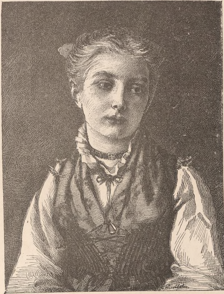
FILLETTE DU CANTON D'URI.