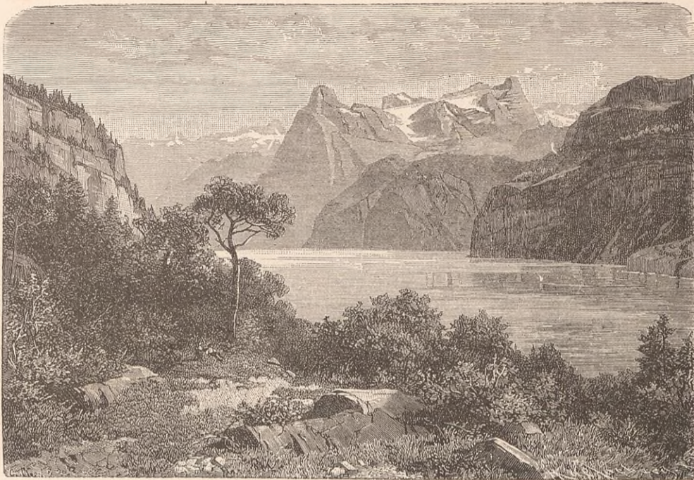
URI : L'URIROTHSTOCK.

Le premier acte du nouvel empereur fut de faire sa paix avec le Saint-Siège ; il comprenait que le temps n'était plus, pour les chefs de la Germanie, d'user leurs forces et leurs ressources en de vaines luttes au delà des monts. Ces longues rivalités de la crosse et de l'épée n'avaient eu d'autre résultat