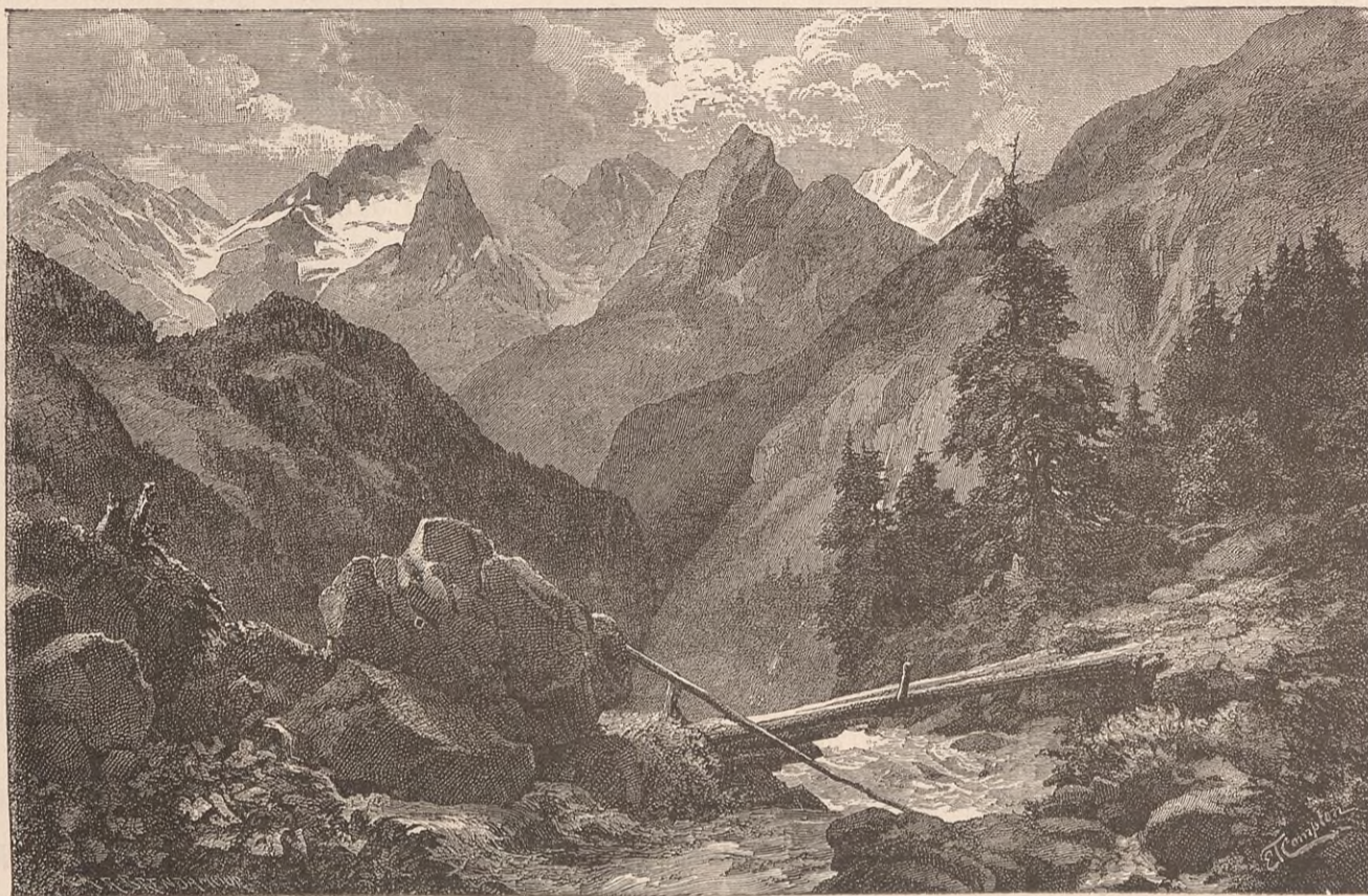
URI : VALLÉE DE MADERAN.

recevoir et de n'admettre dans les Vallées ci-dessus nommées aucun juge ( Amman ) (1) qui aurait acheté sa charge à prix d'argent ou de quelque autre manière, ou qui n'habitera pas parmi nous et ne sera pas notre compatriote. S'il s'élève quelque discussion entre les confédérés, les plus prudents parmi eux devront intervenir pour assoupir la discorde entre les parties, et cela par les moyens qui leur paraîtront les plus expédients (2). Dans le cas où l'une des parties rejettera leur décision, les autres confédérés l'obligeront de s'y soumettre. Avant tout il est statué par les confédérés que, si l'un d'entre eux en tue un autre par surprise, et sans culpabilité ou faute de celui-ci, et qu'on le saisisse, il sera puni de mort, à moins qu'il ne puisse prouver son innocence (3) d'un pareil crime, laquelle pourra seule le