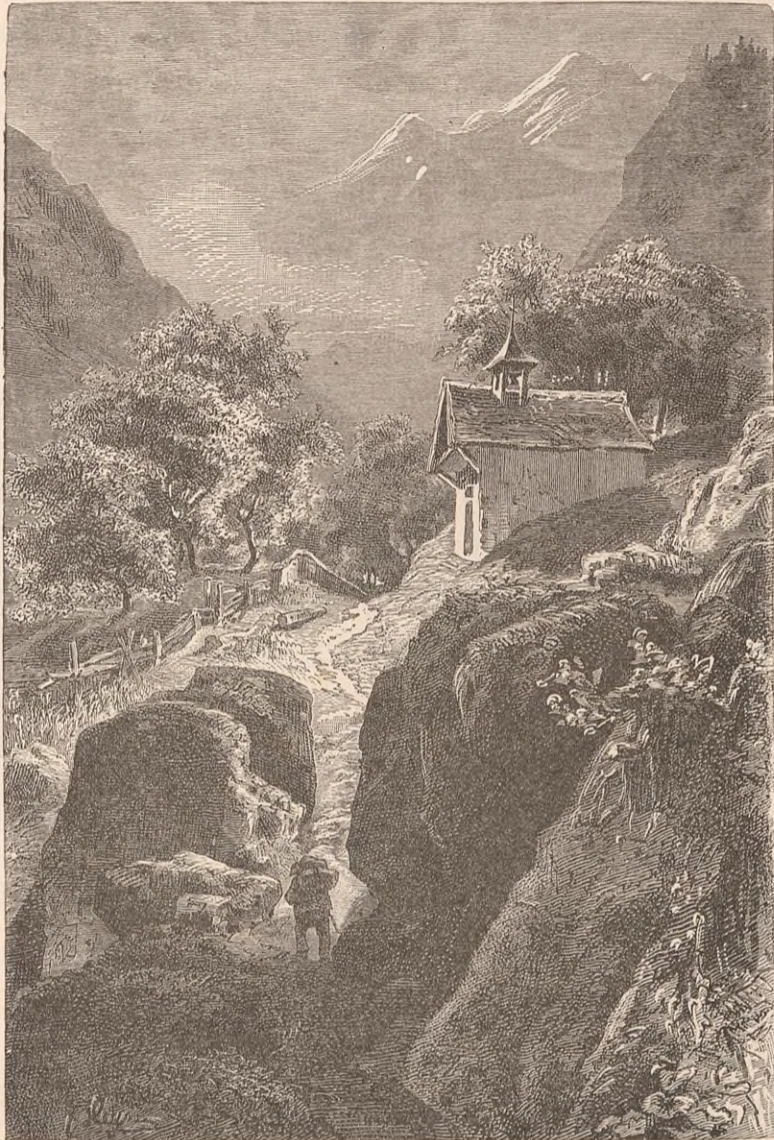
CHAPELLE SAINT-ANTOINE A L'ENTRÉE DU VAL DE MADÉBAN.

Le lecteur a-t-il bien pesé tous les termes du pacte ainsi libellé ? Voilà le véritable et authentique serment des Trois-Suisses ; il a été provoqué non point par l'oppression et le désespoir, mais par l'unique crainte de l'oppression et par une sage prévoyance de l'avenir. Cela s'est fait sans apparat, sans fracas, et sans mains levées vers le ciel ; point d'appels de cor, point de clairs de lune ; rien de la mise en scène qu'y ont postérieurement ajoutée la légende et la poésie. Au bas de ce pacte primitif, il n'y a pas même de noms propres. Qu'importent les hommes ? dit un publiciste. « C'est une grande