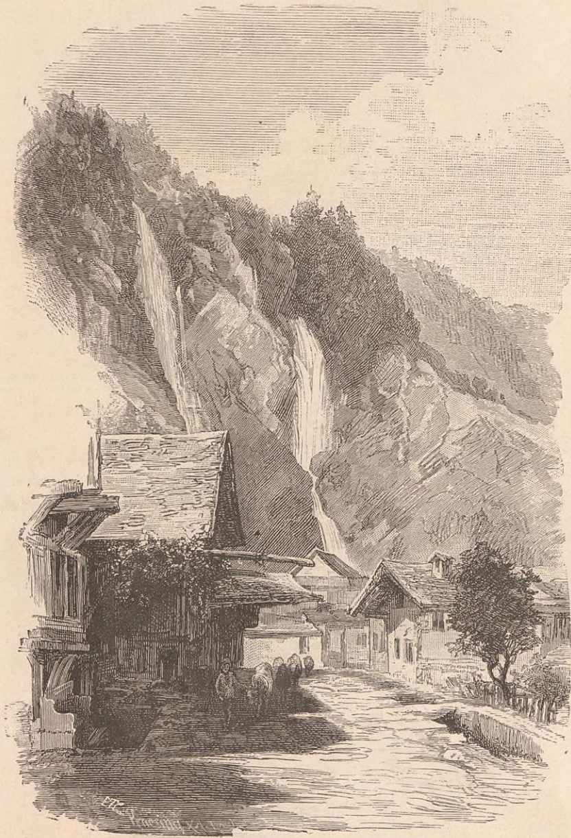
CHUTE DE L'ALPBACH.

De l'autre côté du Kirchet, la vallée principale de l'Oberhasli court sur une longueur de huit lieues