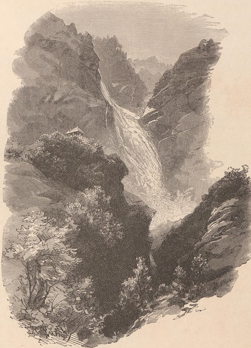
CHUTE SUPÉRIEURE DU REICHENBACH.

Chemin faisant, la colonne émigrante, comme jadis le peuple d'Israël, rencontra les Moabites, c'est-à-dire les comtes du Frankenrych ou empire des Francs ; ils les battirent, et cette victoire les enrichit du coup, en mettant en leur possession un immense butin, qui fut partagé équitablement, — remarquez ce trait national, — entre les grands et les petits. De course en course, les pèlerins de la famine atteignent le Rhin supérieur, le remontent, et arrivent au Mont-Brisé (Brochenbirg). Est-ce la partie du sombre Pilate qui, comme nous le verrons, a porté ce nom ? Non, c'est plutôt la montagne qui dresse au-dessus de Schwytz sa masse fendue comme par le coup de sabre de quelque Titan ; c'est le Mythen à la double corne, sentinelle immuable de la vieille Suisse. La troupe errante planta sa tente dans le creux étroit