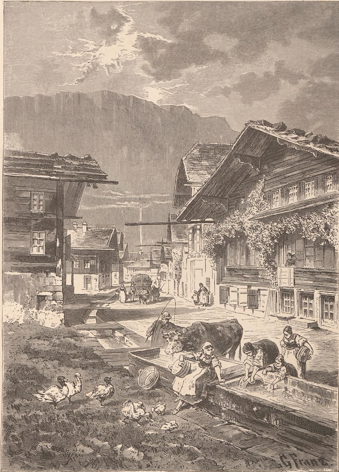
UNE RUE A MEIRINGEN.

En travers de la vallée, entre Meiringen et Hof, s'étend une arête transversale de rocher qui ne