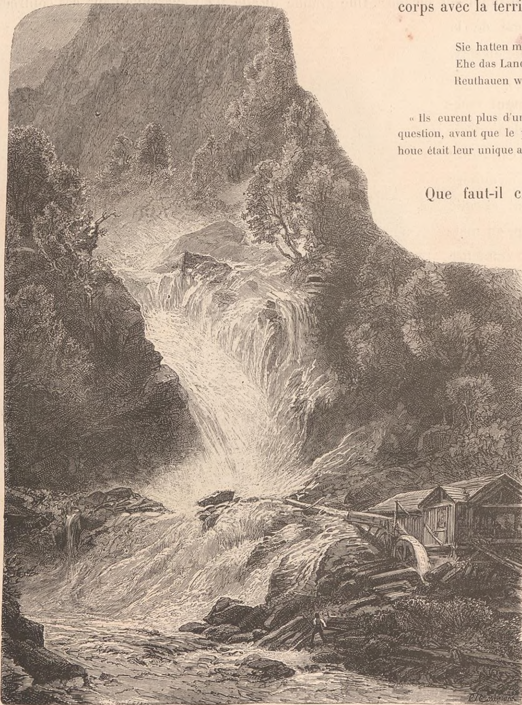
CHUTE INFÉRIEURE DU REICHENBACH.

Ce qui est certain, c'est que l'idiome et les mœurs des Hasliens témoignent d'une étroite parenté d'origine entre eux et les hommes dont le Brünig les sépare. La contrée, qui s'appelait jadis Weissland (le pays blanc), sans doute à cause des blanches cimes qui la circonscrivent de toutes parts, a joui de temps immémorial des franchises communales, du privilège d'élire son magistrat et de se gouverner à sa guise; il est probable seulement que