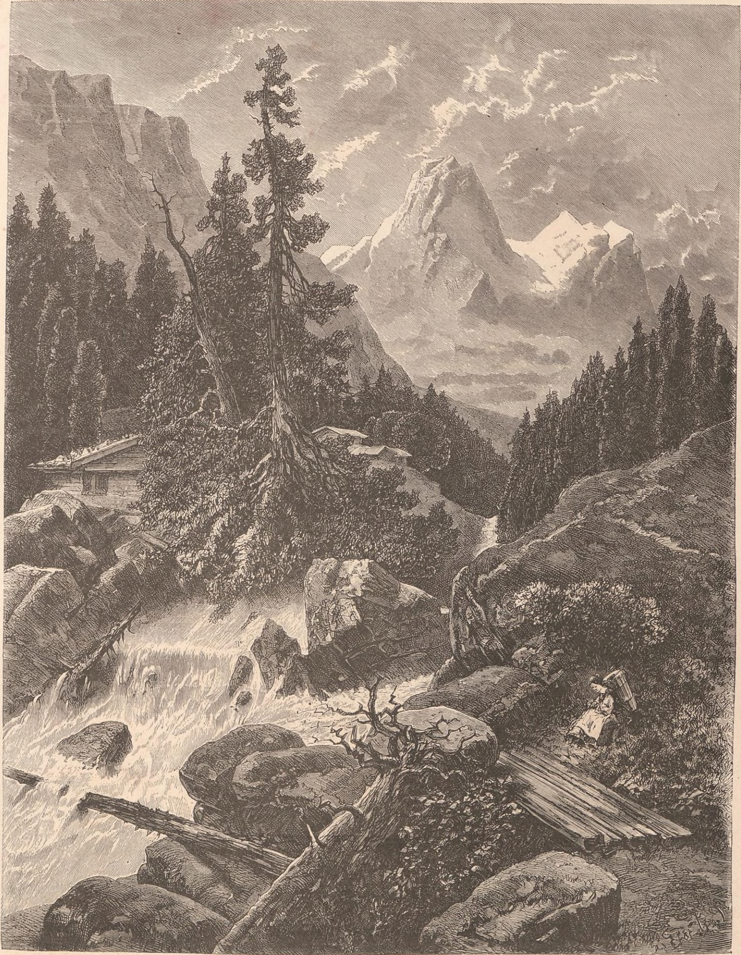
LE REICHENBACH (ROUTE DE ROSENLAUI).