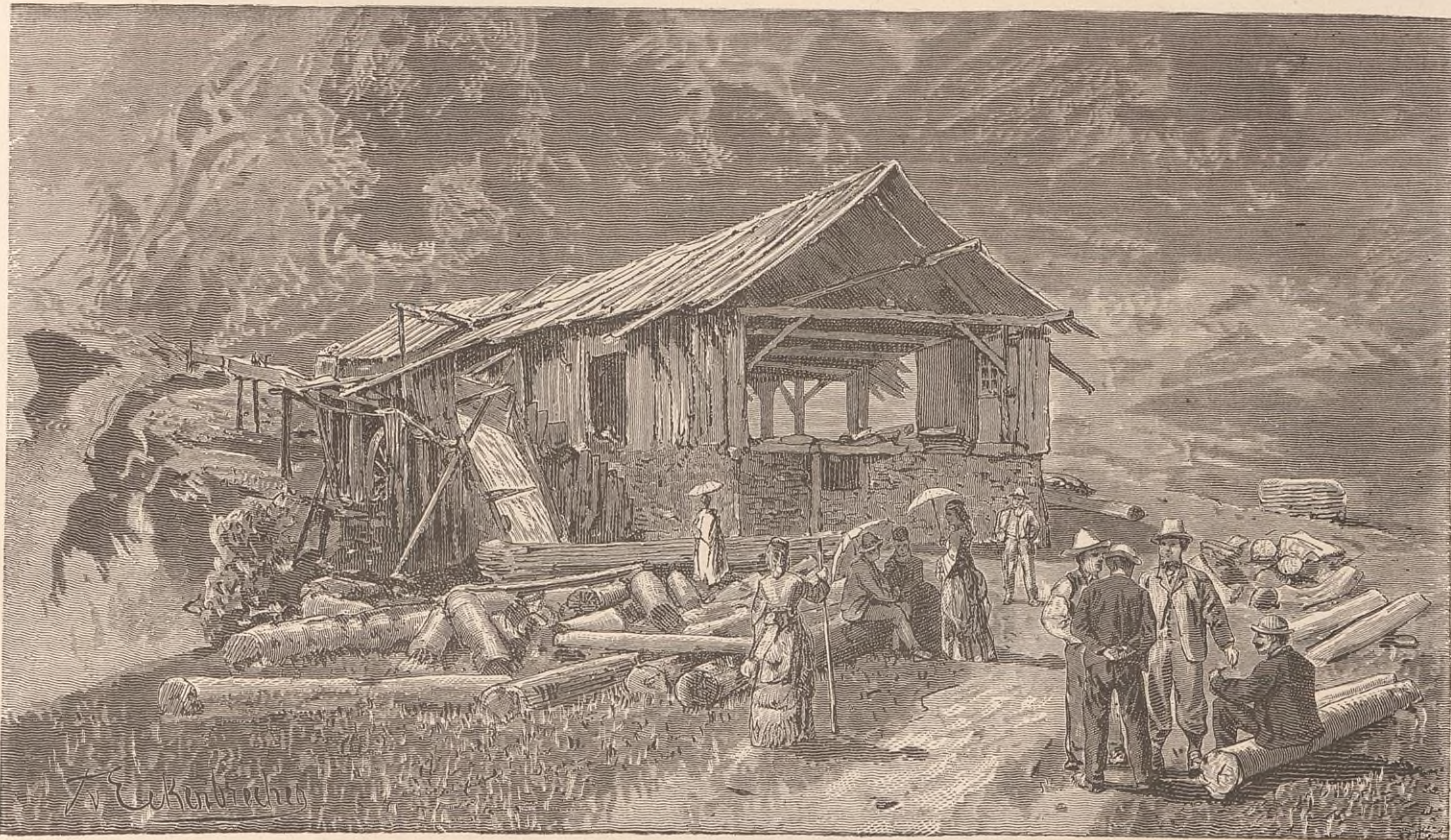
MOULIN A SCIE SUR LE REICHENBACH.

pas de conserver longtemps une certaine finesse de peau et une fraîcheur remarquable de coloris. C'est un point d'ailleurs qui paraît leur tenir à cœur, car elles portent volontiers des gants et des ombrelles par le grand soleil. Leur costume du dimanche a une grâce pittoresque qui frappe l'étranger. La fiancée arbore une haute coiffure, une sorte de couronne en velours noir ornée de perles fausses, de fleurs artificielles, d'agrafes brillantes et de toute sorte de clinquant. Autour de son cou est attachée une tresse noire, et à sa chevelure s'enroulent des rubans multicolores. Quant au fiancé, son costume est tout de laine bleue, avec une guirlande de romarin autour du bras droit, une branche du même arbuste sur la poitrine, et, au chapeau, le bouquet de fleurs. Dans l'Oberland proprement dit, l'accoutrement féminin, même à tous les jours, est, comme vous le savez, assez compliqué : il consiste en une grande