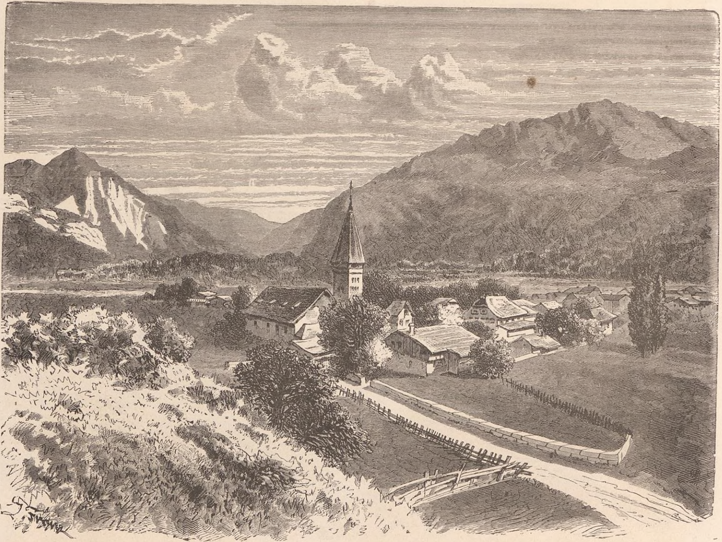
VUE DE MEIRINGEN

difformité : ces petits hommes avaient des pieds d'oie. Or, un jour qu'ils allaient, par complaisance pure, faire la cueillette des fruits d'un cerisier, le paysan auquel appartenait l'arbre sema de la cendre tout autour, à seule fin de voir s'il était vrai que les nains eussent des pieds palmés. Les esprits des bois s'aperçurent du piège, et ils décampèrent : depuis lors, on ne les a plus revus ; mais ce qui prouve surabondamment la vérité de tout ce que je viens de dire, c'est qu'on montre encore une des cavernes où ils ont demeuré jadis, au pied du Wetterhorn.