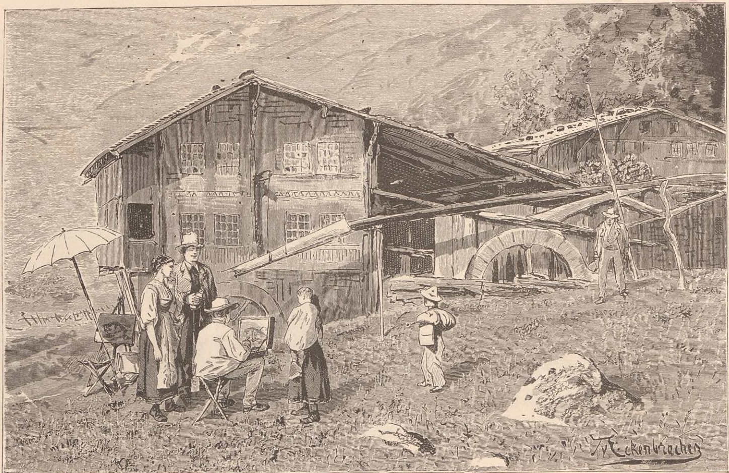
SUR LE HASLIBERG.

Au delà du Kirchet, le haut pays ou Hasliberg offre une image achevée de la vie alpestre. Le plateau est très-riche en Vorweiden : c'est le nom par lequel on désigne ces pacages intermédiaires qui permettent d'épargner les prés de la région basse. Les Vorweiden hasliens montent, en certains endroits, jusqu'à 1,200 mètres; les pâtres y séjournent, partie dans de petits hameaux, partie dans des huttes éparses; près de leurs campements croissent encore le seigle, l'orge, la pomme de terre, le