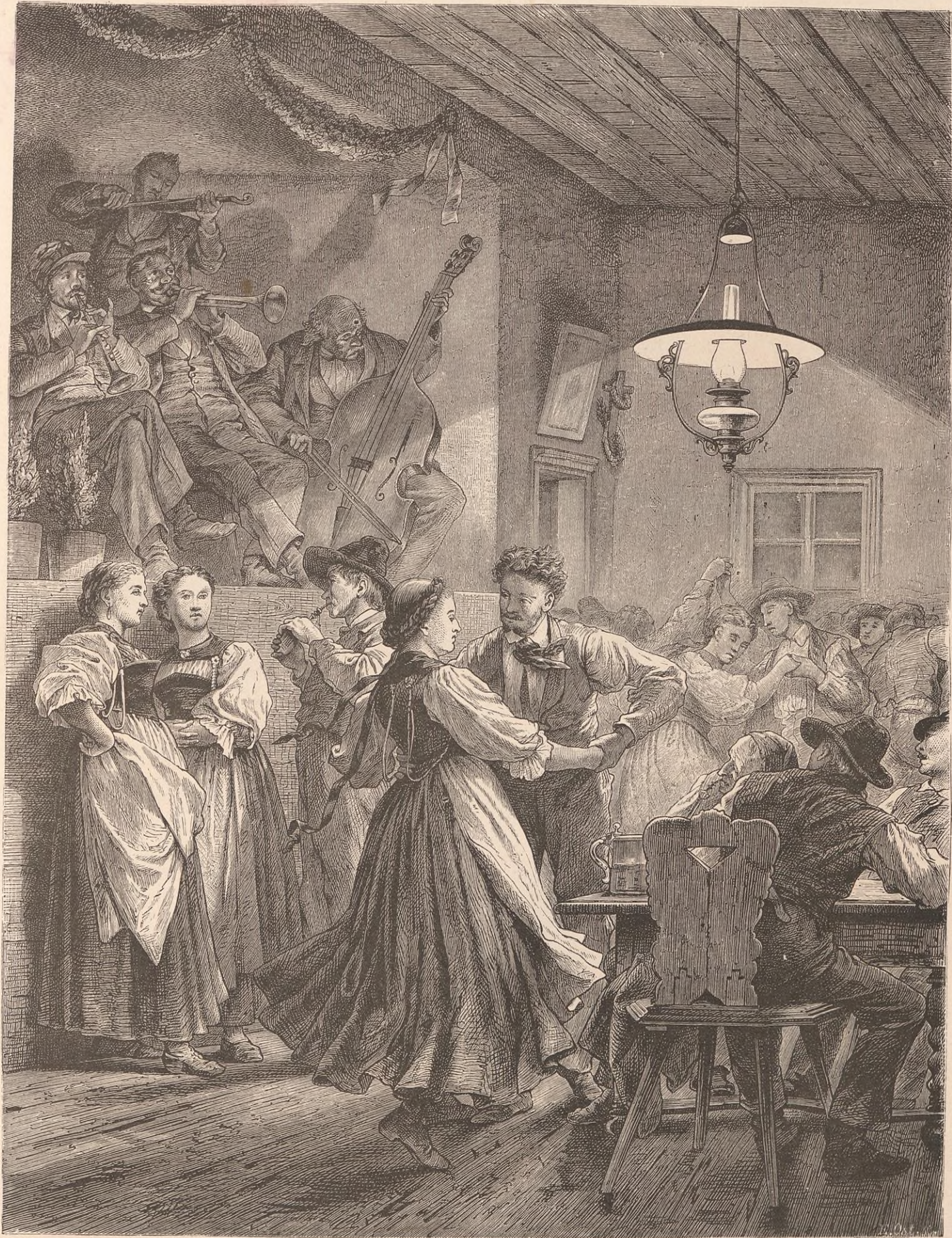
UN BAL A BRIENZ.