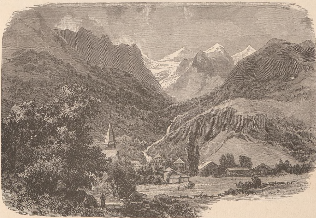
MEIRINGEN ET SES MONTS.

D'autres disent que les montagnards poussèrent l'infamie jusqu'à chauffer à blanc un rocher où ces