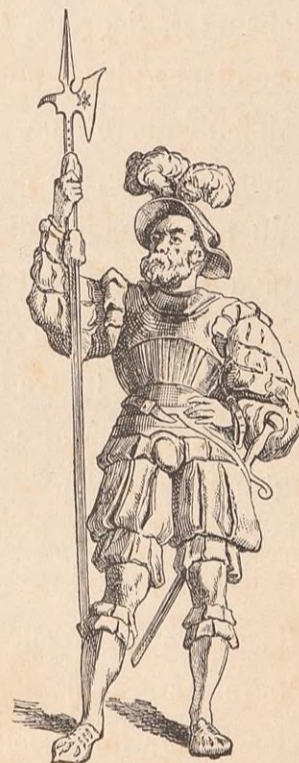
SOLDAT SUISSE DU TEMPS DES GUERRES DU MILANAIS.

Il y eut alors, racontent les historiens, une sorte d'appel au peuple d'une naïve et saisissante originalité. Les Valaisans taillèrent une énorme souche en forme de visage humain, donnèrent à ses traits l'expression d'une morne tristesse, et, l'entourant de verges et d'épines, ils dressèrent cette image de la justice endolorie, la Mazze , comme on l'appela, sur une place de Brieg. Quand la foule se fut assemblée, l'avocat de la Mazze demanda solennellement à la souche de nommer l'auteur de ses souffrances : « Est-ce Silinen ? Est-ce Asperling ? Est-ce Heungarten ? » La Mazze resta silencieuse. « Est-ce donc Rarogne ? » A ce nom, elle s'inclina. Aussitôt tous les patriotes viennent, l'un après l'autre, planter un clou dans la statue, en signe d'adhésion à la sentence ; puis la Mazze est promenée de village en village, de dizain en dizain. Elle finit par visiter le capitaine général, l'évêque lui-même, tous les partisans des Rarogne. Après quoi, l'arrêt est mis à exécution (1414) : les biens des coupables sont saisis, leurs châteaux rasés au niveau du sol (1).