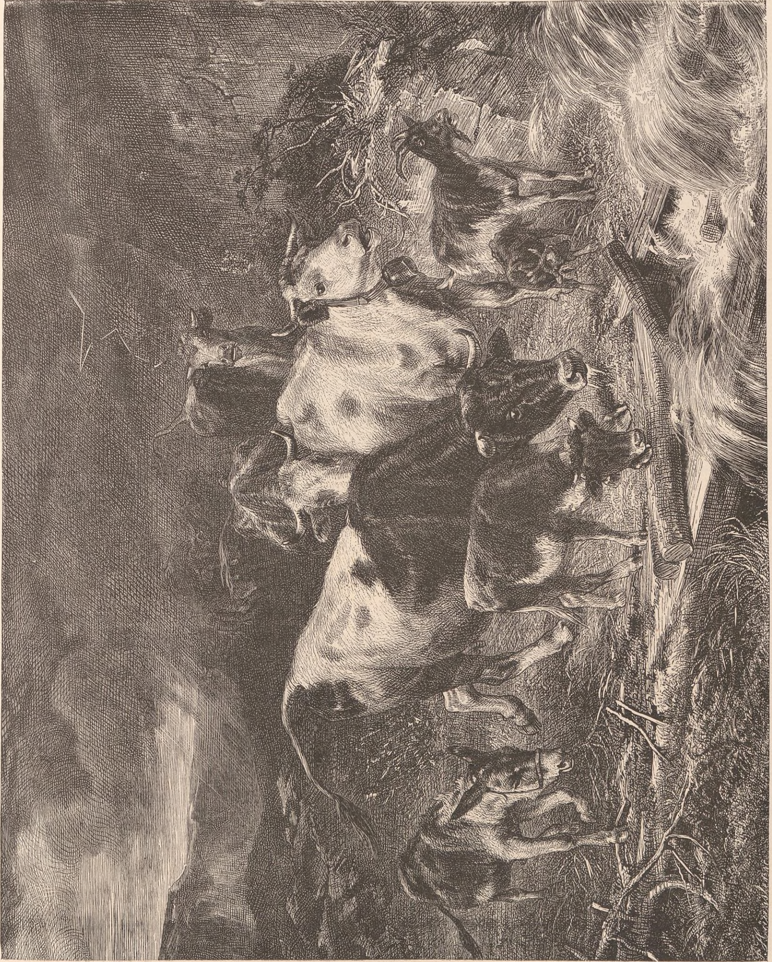
DANS LA TOURMENTE.