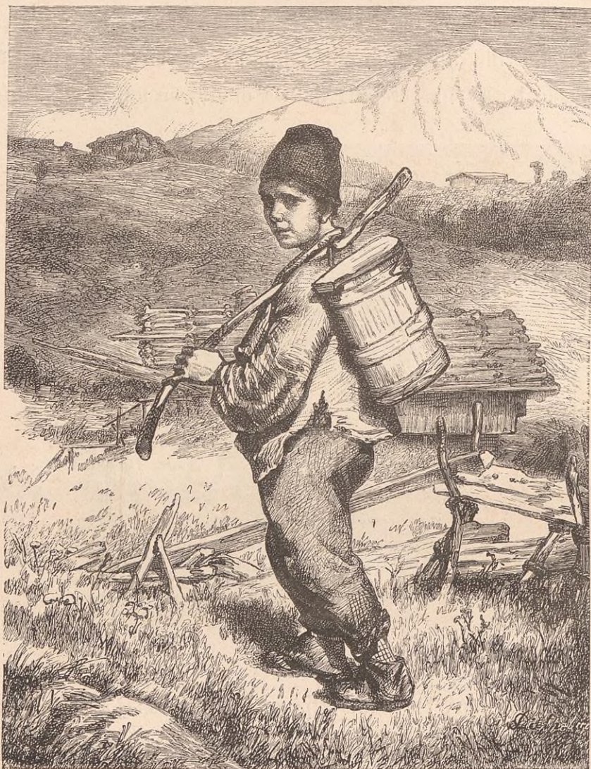
VALET DE PATRE.

Les jours où il fait beau, la vie sur l'alpe n'est qu'une paisible et radieuse églogue ; le soir venu, les bergers chantent leurs iodels , ou bien ils jouent de la trompe. Le troupeau lui-même, par son