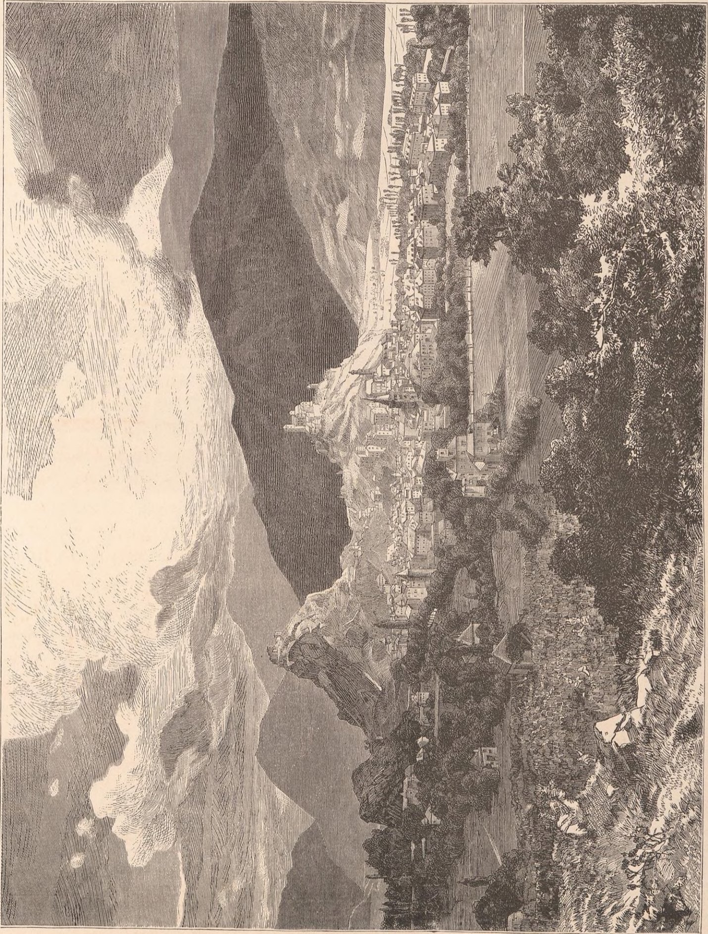
VUE GÉNÉRALE DE SION