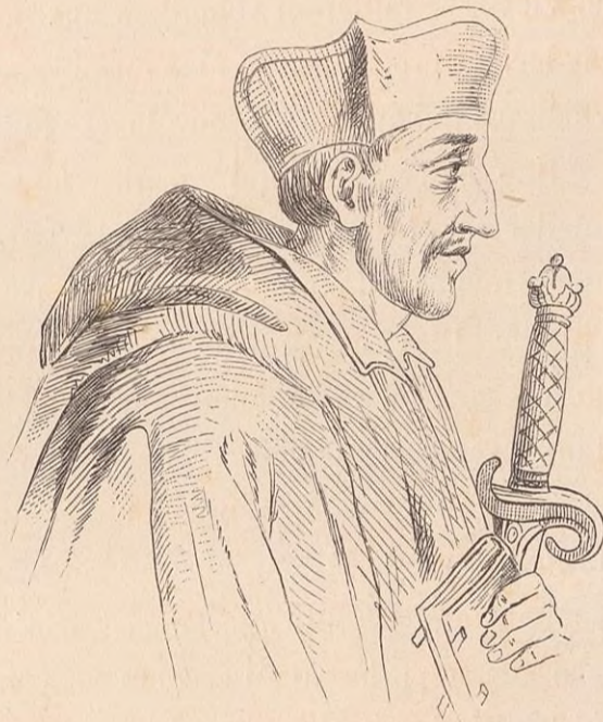
LE CARDINAL MATHIEU SCHINNER.

Aussi, le jour où l'entrée en lice d'un nouveau champion, François I er , menaça de remettre tout en question, le contingent des dizains refusa-t-il de suivre plus avant l'infatigable évêque de Sion, et saisit-il le premier prétexte honnête de regagner ses foyers. Autant en firent les soldats de Berne, autant ceux de Soleure et ceux de Fribourg. Le reste des Confédérés, que Schinner lui-même, à cheval et vêtu de pourpre, lança près de Marignan contre la formidable artillerie de l'armée française, ne purent que sauver l'honneur, et, une fois la bataille perdue, se replier en bon ordre sans perdre leurs étendards. Ainsi finit l'épopée de l'étrange prélat : expulsé une seconde fois du Valais, il dut se retirer à Rome, où il mourut, au mois d'octobre 1522, âgé d'environ cinquante-deux ans. Les Français, qui excellent au choix des sobriquets, avaient donné à Schinner celui de « soldat tondu ». Pour soldat, il l'était ; mais le jouteur, ne l'oublions pas, se doublait en lui d'un fin diplomate. Figure d'ascète, s'il en fut jamais : grand, maigre, osseux, les traits taillés comme à coups de hache, le menton gercé de rides, l'œil gauche à moitié fermé, tel le représentent ses portraits. En campagne d'ailleurs, le