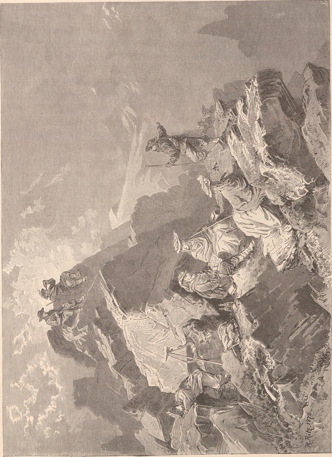
AU PIC D'ARZINOL.