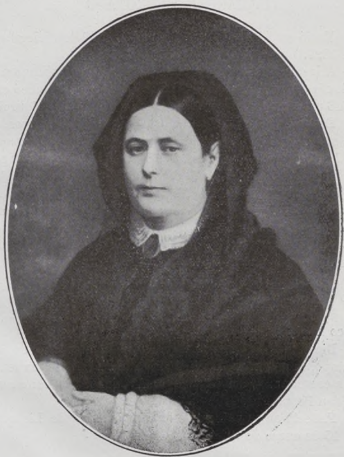
Marquesa de Salamanca.