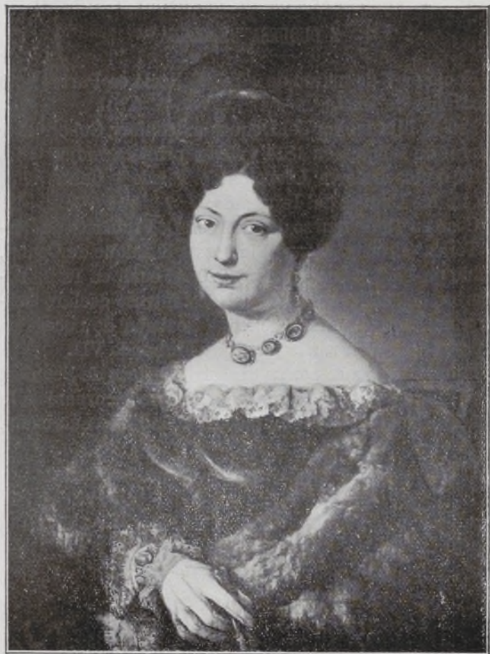
Condesa de Castilofiel.