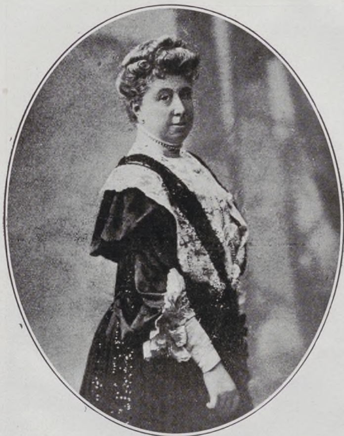
Condesa de Santiago.