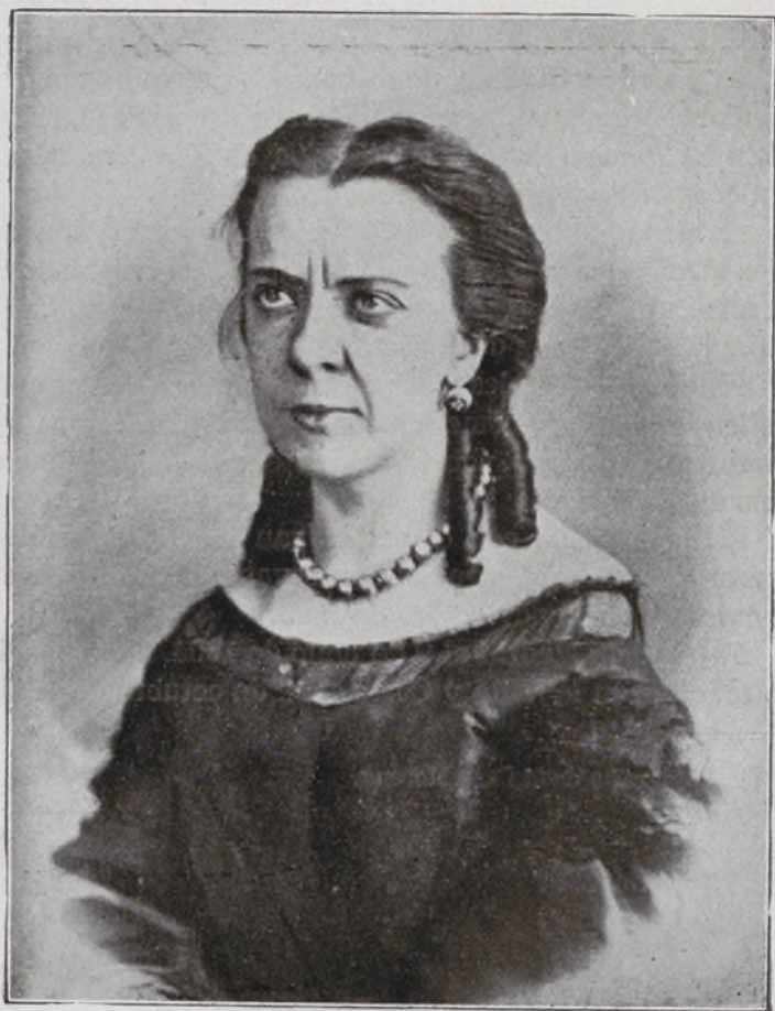
D.ª Maria del Pilar Sinués de Marco.