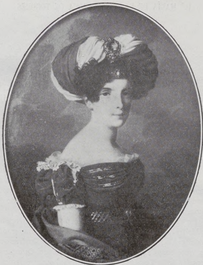
II Duquesa de San Carlos.