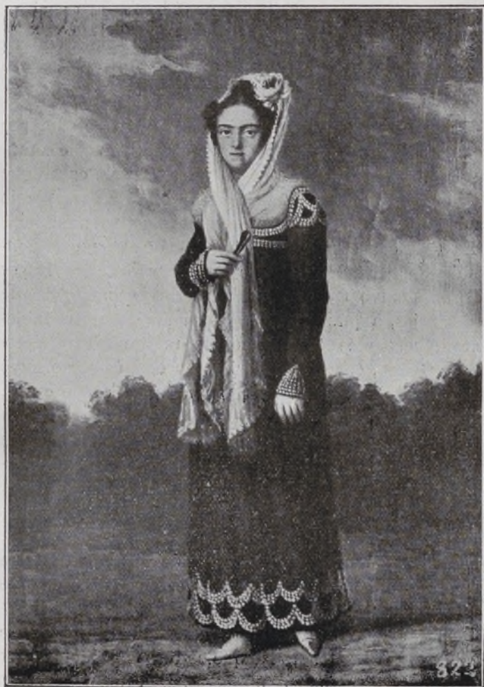
Infanta Maria Francisca de Braganza.