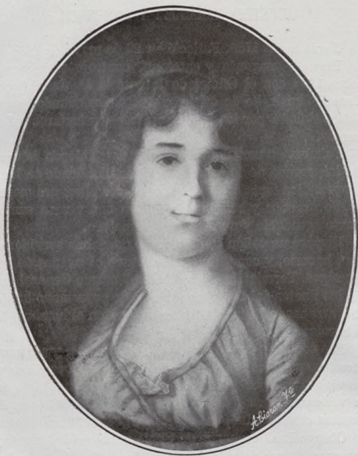
Marquesa de Bélgida y de Mondéjar.