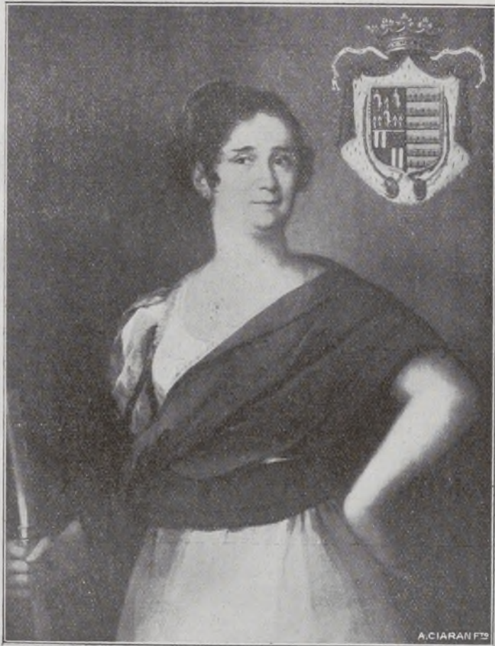
Condessa de Bureta!