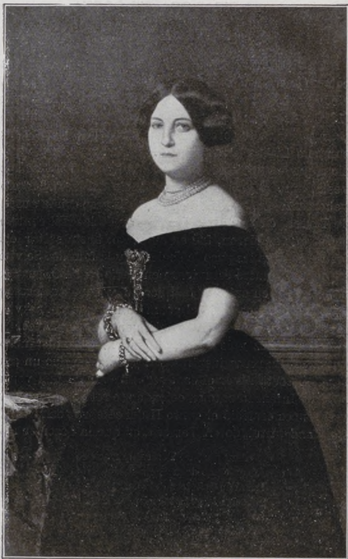
XIII Duquesa de Veragua.