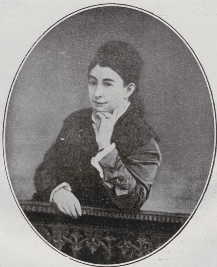
Duquesa de Pastrana.