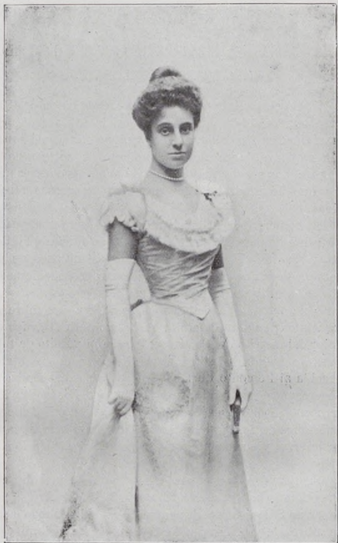
Infanta D.ª Maria Teresa de Borbón.