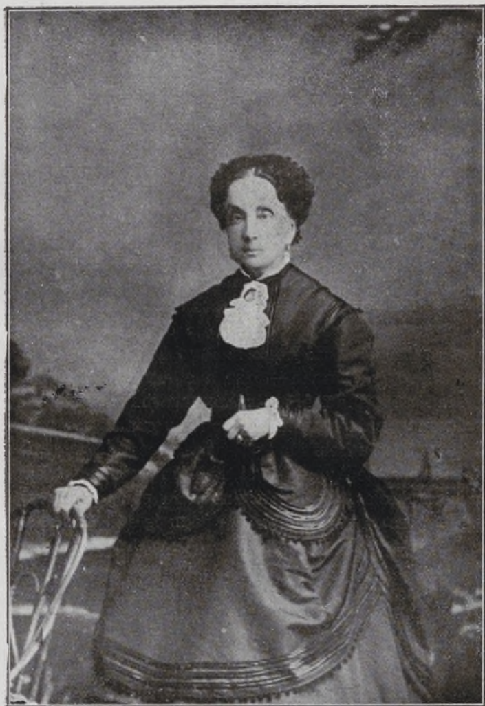
I Marquesa de los Remedios.