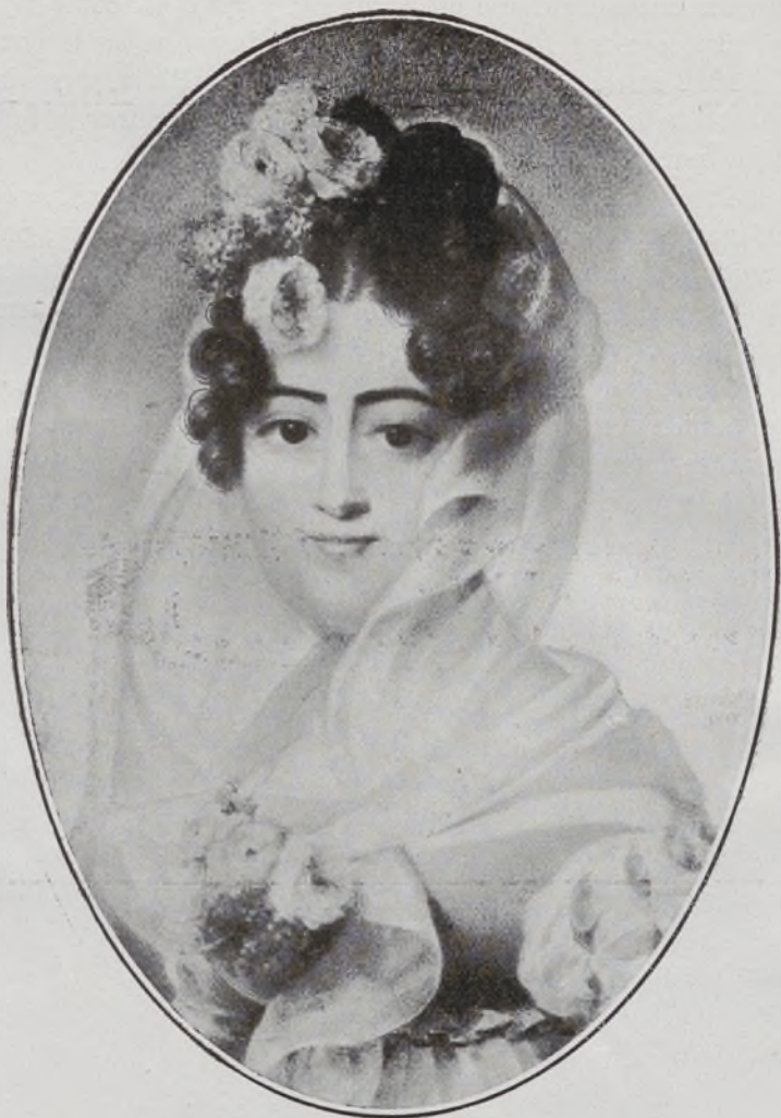
XIV Duquesa de Frias.