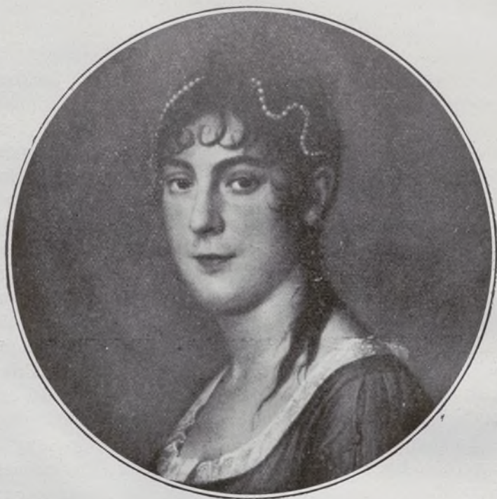
VII Condesa de Montijo.