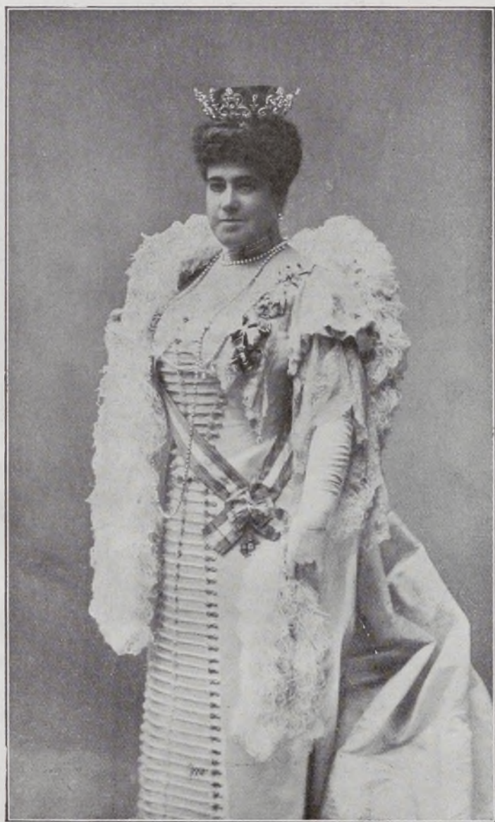
Marquesa de Squilache.