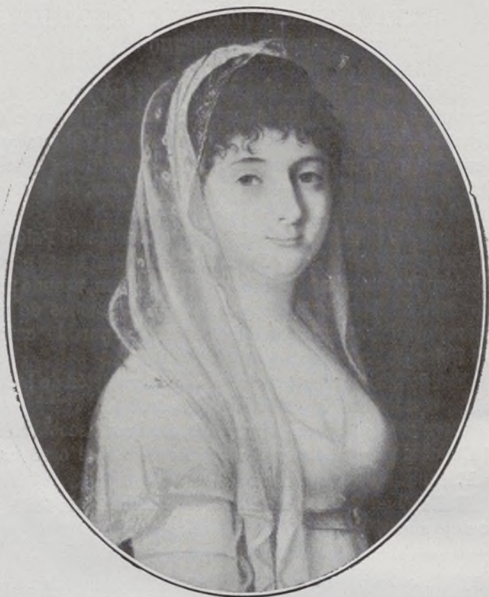
Marquesa de Santa Cruz.