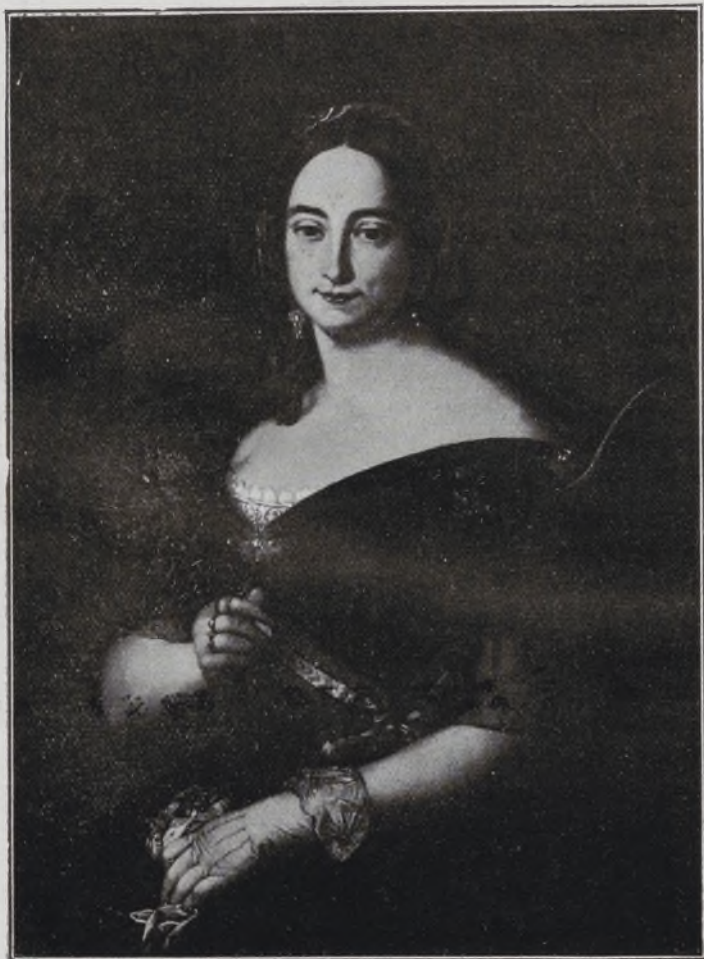
I Duquesa de la Victoria.