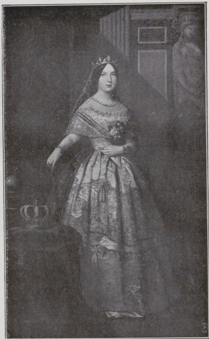
La Reina D. a Isabel II.