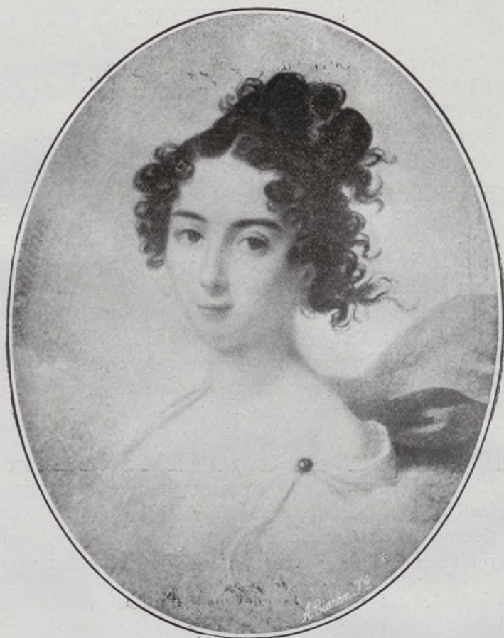
XIX Condesa de Trastamara. Miniatura por Bouton.