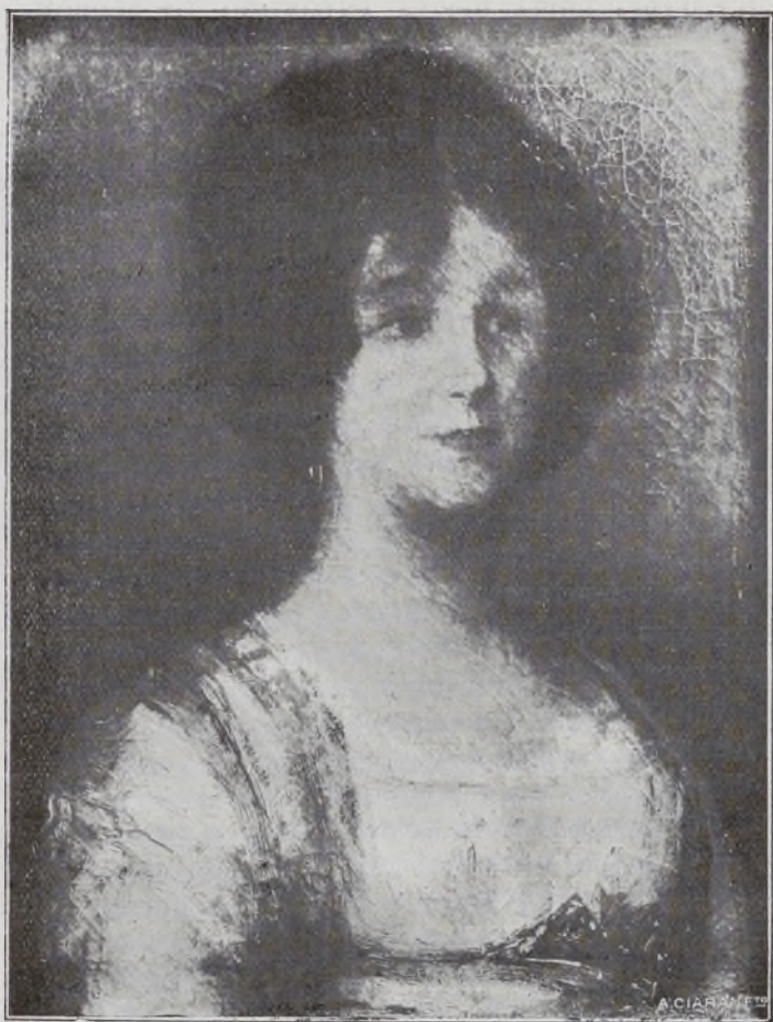
Reina María Isabel de las dos Sicilias.