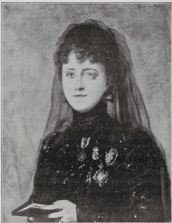
XV Duquesa de Villahermosa.