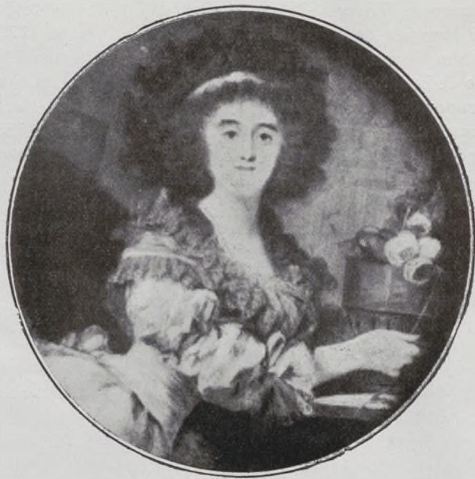
Duquesa de Berwick.