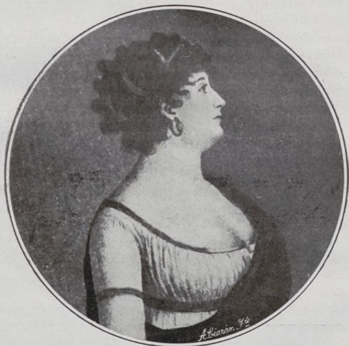
D. a Rosa de la Nueva y Tapia. Acuatinta de la época.