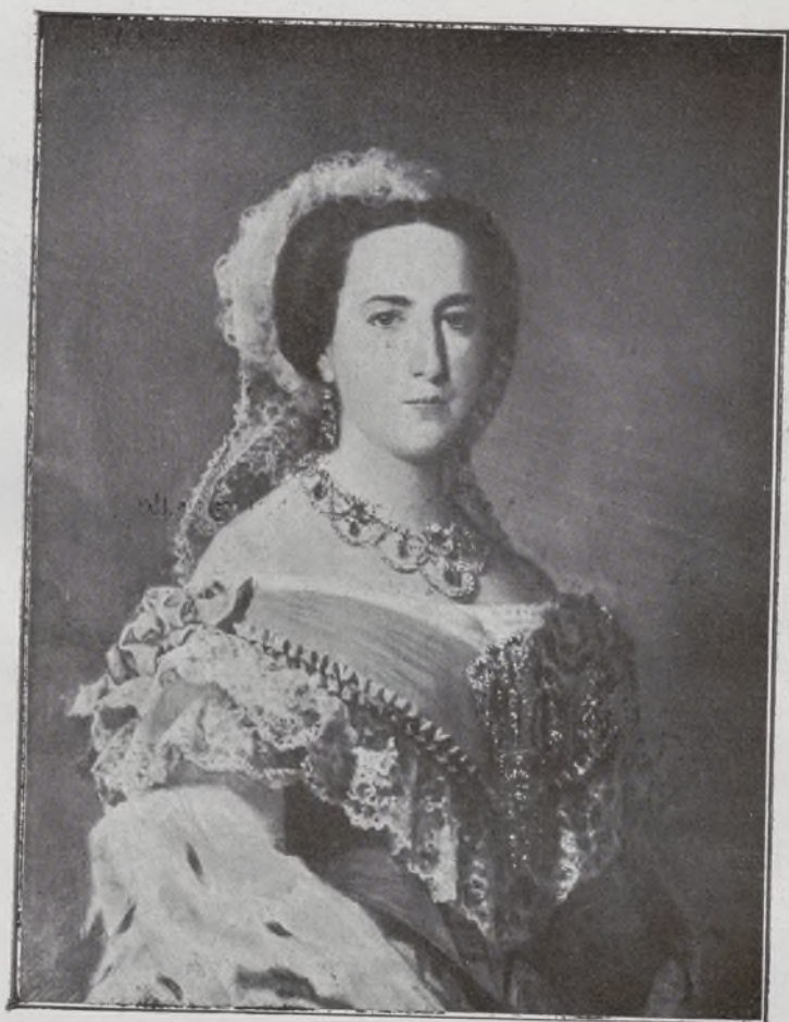
XIV Duquesa de Baena.