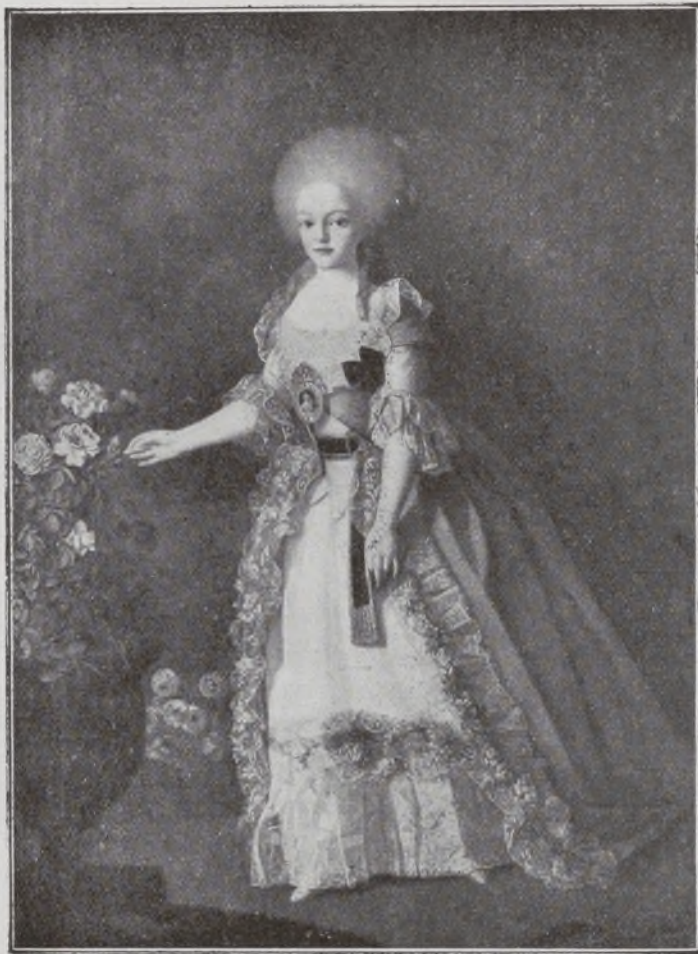
La Reina Carlota de Portugal.