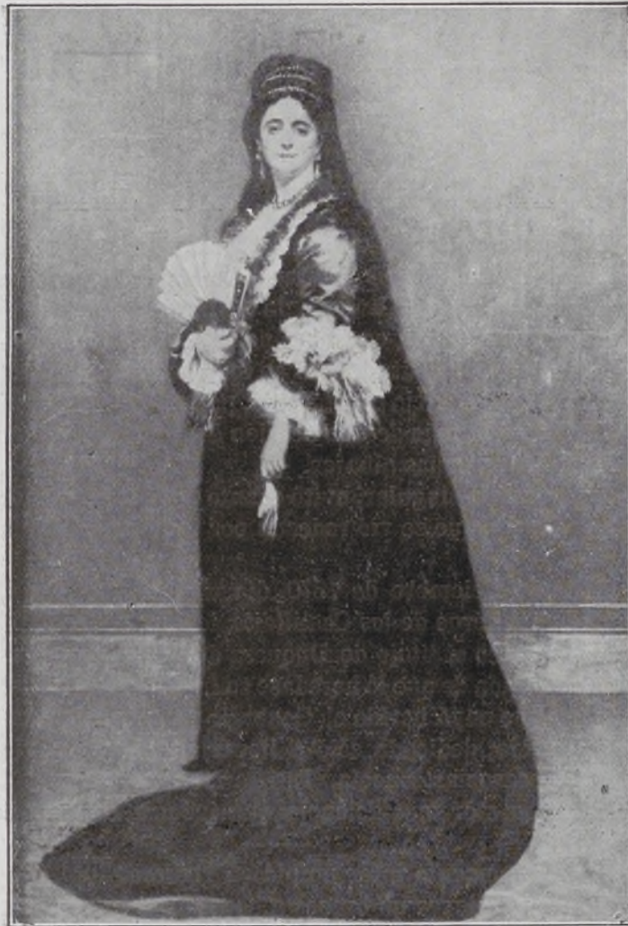
Princesa de Ratazzi.