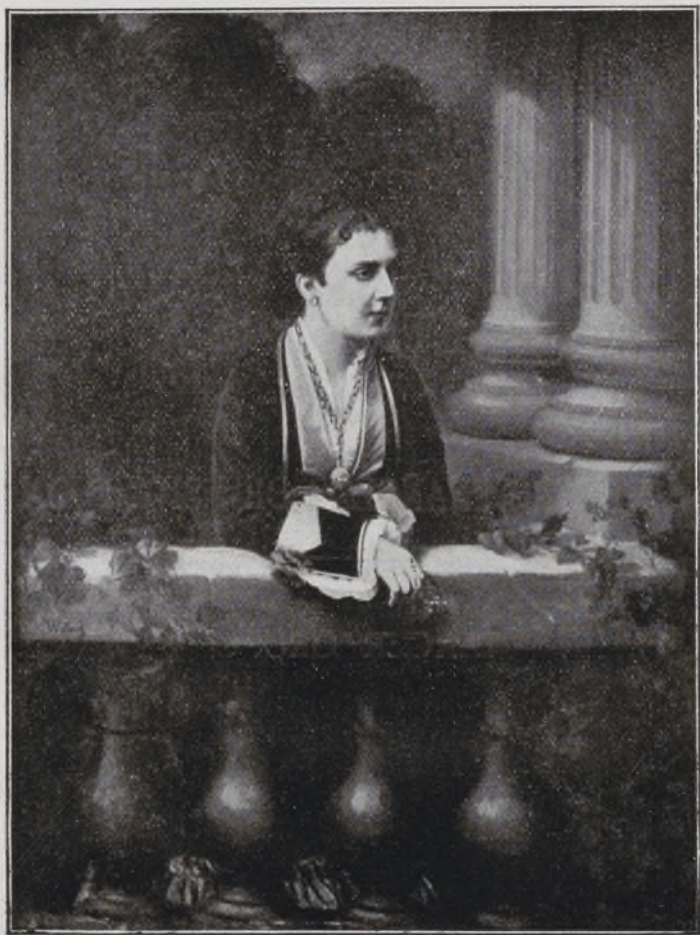
La Reina María de las Mercedes.