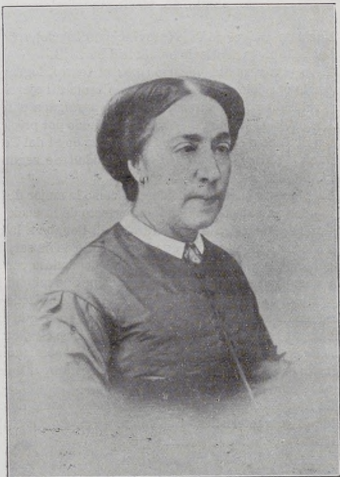
VI Condesa de Campo de Alange.