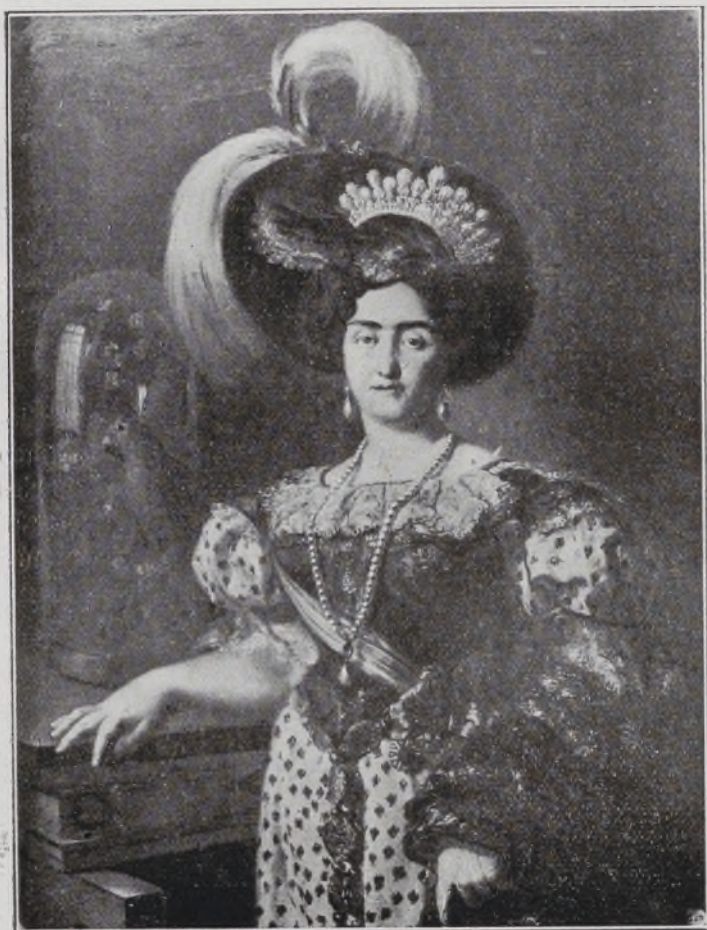
Princesa de Beira.