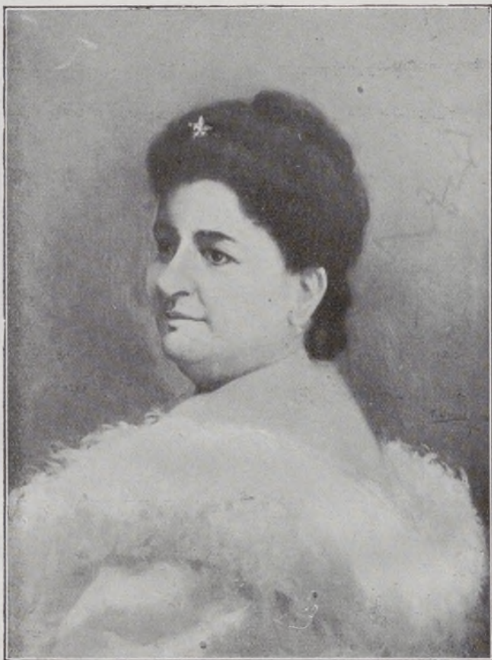
D.ª Emilia Pardo Bazán.