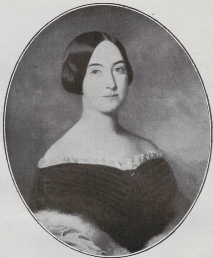
XII Duquesa de Sanlúcar la Mayor.