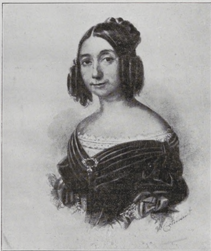
Princesa de Anglona, Marquesa de Javalquinto.