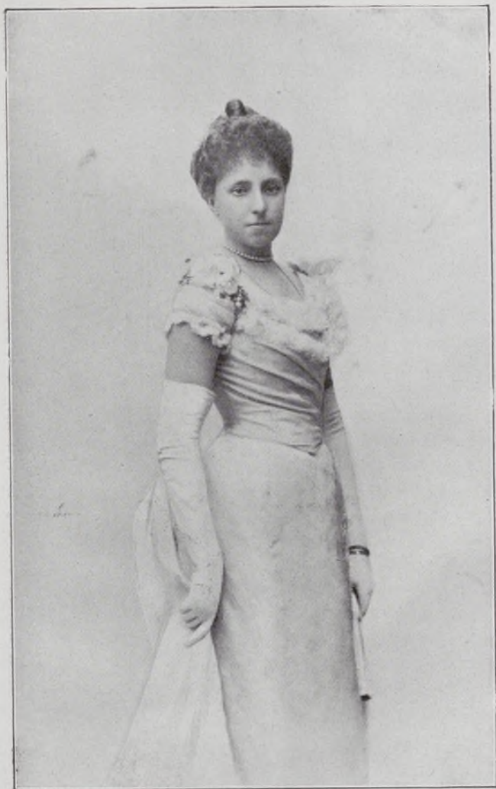
Princesa de Asturias D.ª Maria de las Mercedes.