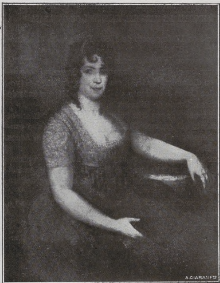
Marquesa de Espeja.