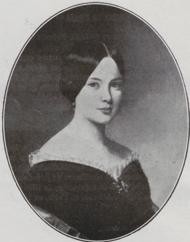
XI Duquesa de Medina de las Torres.