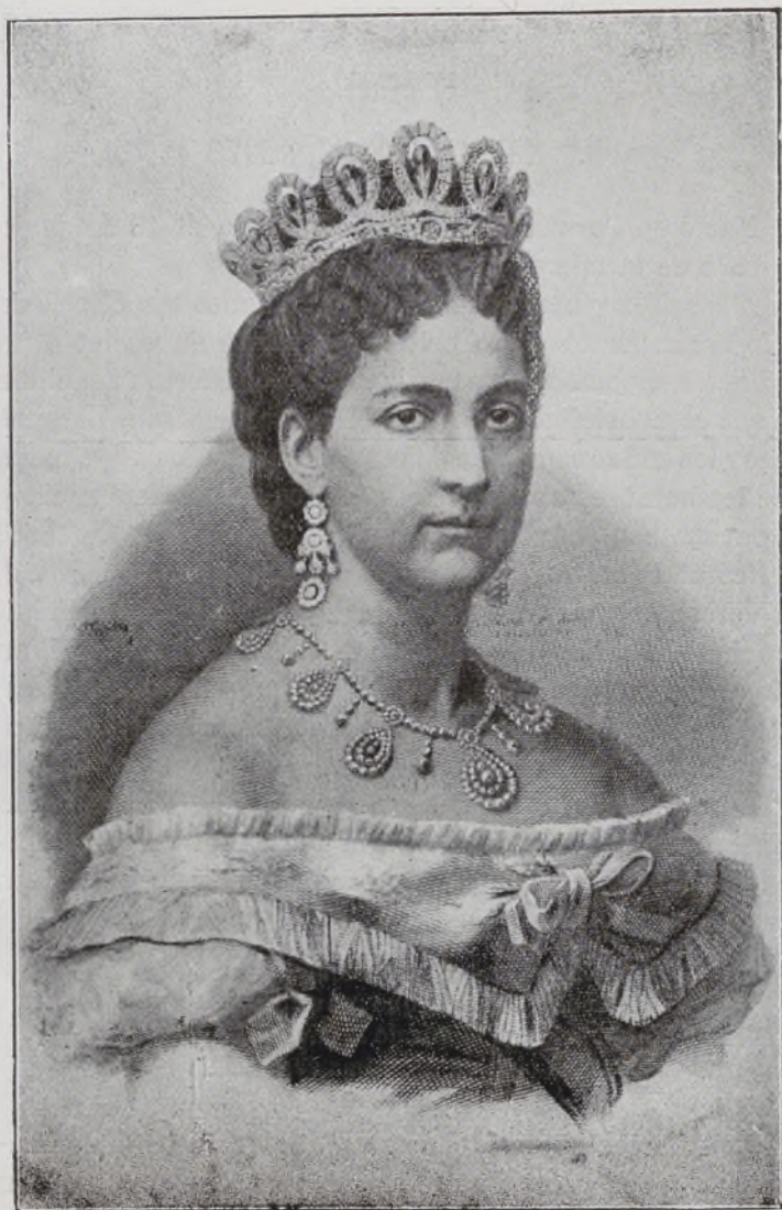
La Reina D. a Maria Victoria.