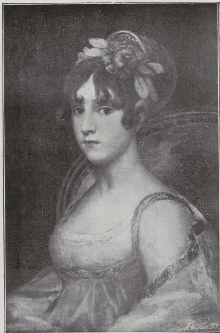
Condesa de Haro.