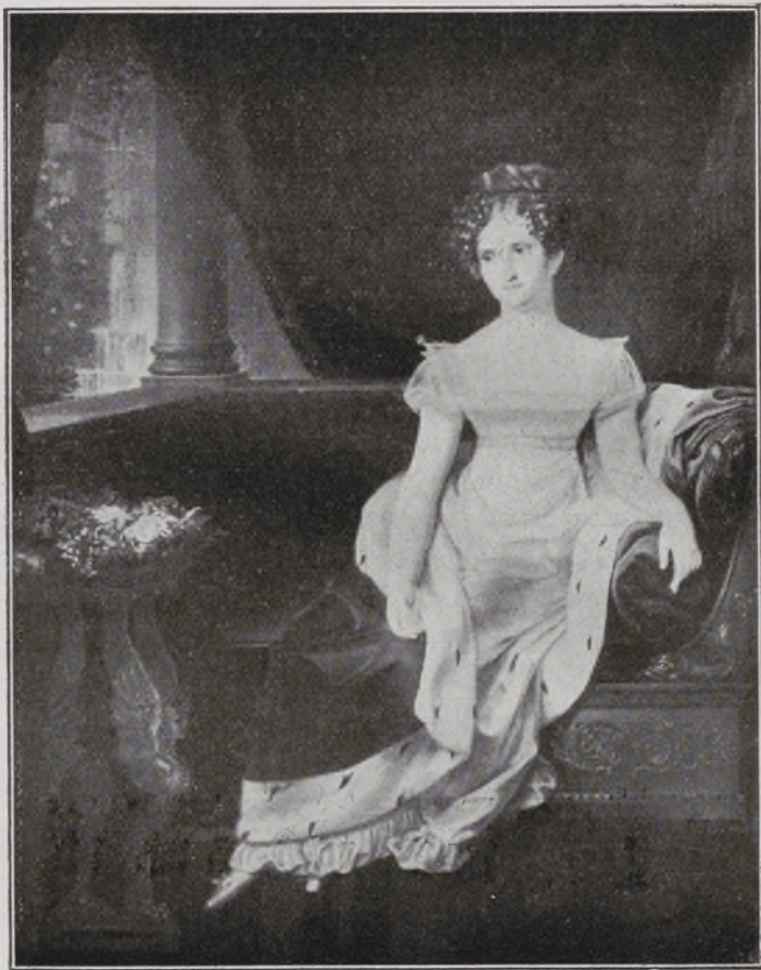
VII Duquesa de Berwick y XIV de Alba.