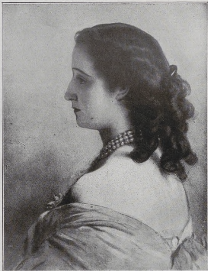
La Emperatriz Eugenia. Por Winterhalter.