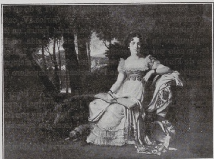
IX Marquesa de Ariza.