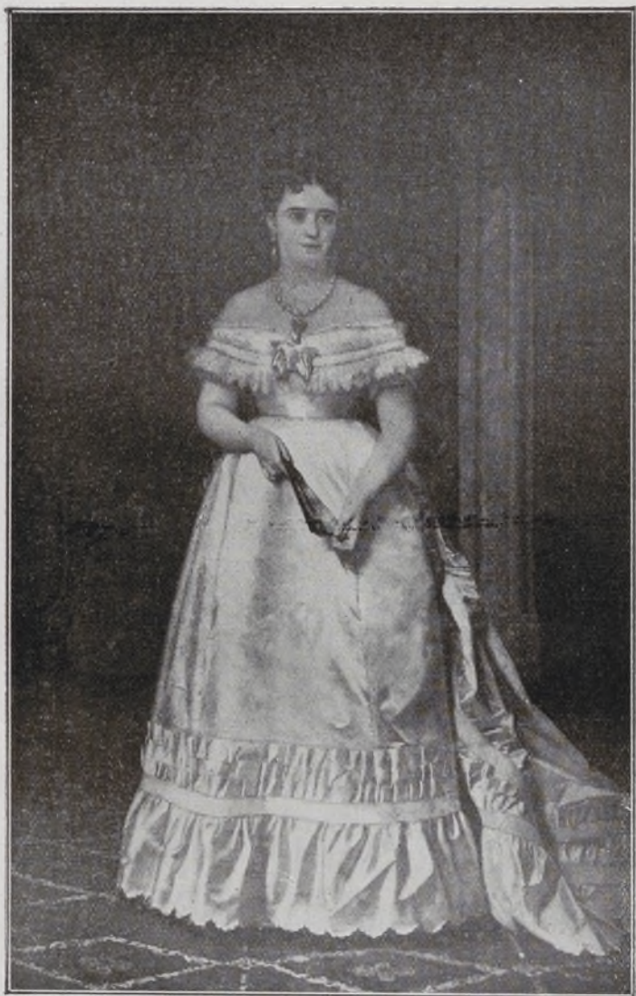
Duquesa de Prim.