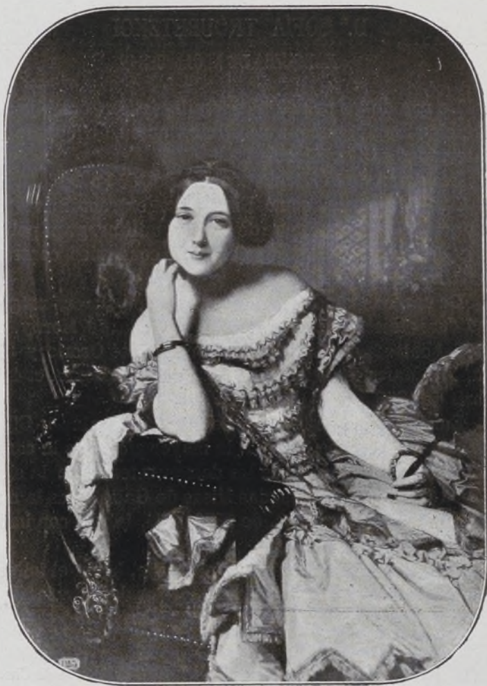
Condesa de Vilches. Por Federico Madrazo.