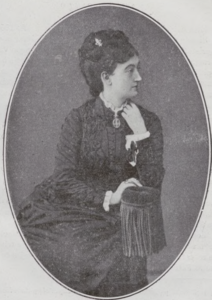
X Marquesa de Javalquinto, Duquesa de Osuna.