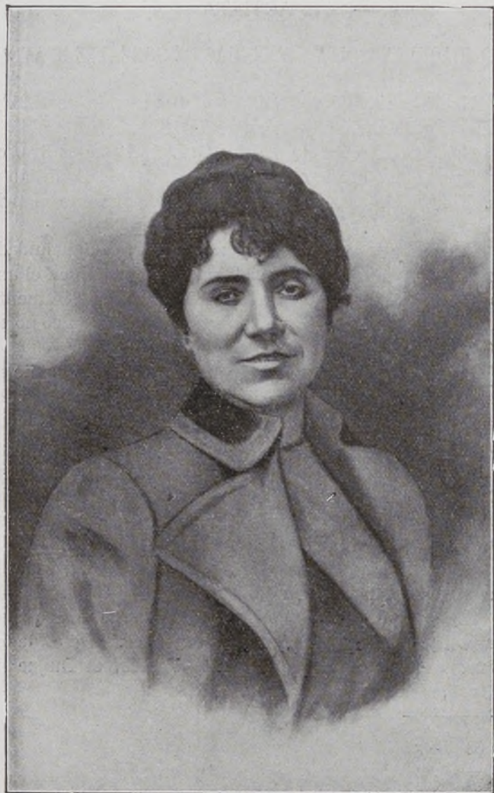
D.ª Rosalía de Castro.