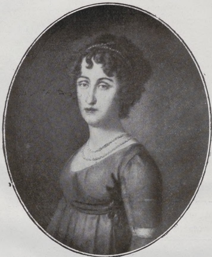
Princesa de Nápoles y de Asturias.