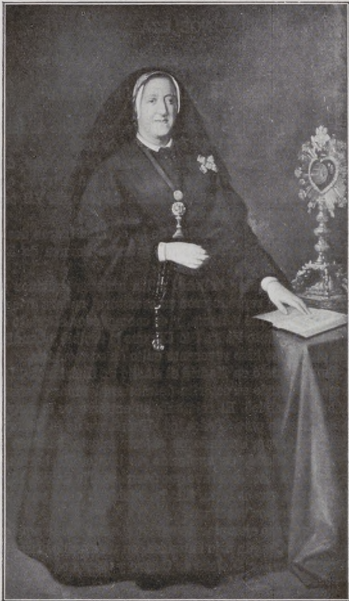
Vizcondesa de Jorbalán.