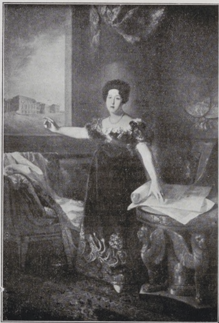
La Reina Isabel María Francisca de Braganza.