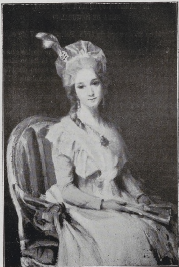
Duquesa de Villahermosa.