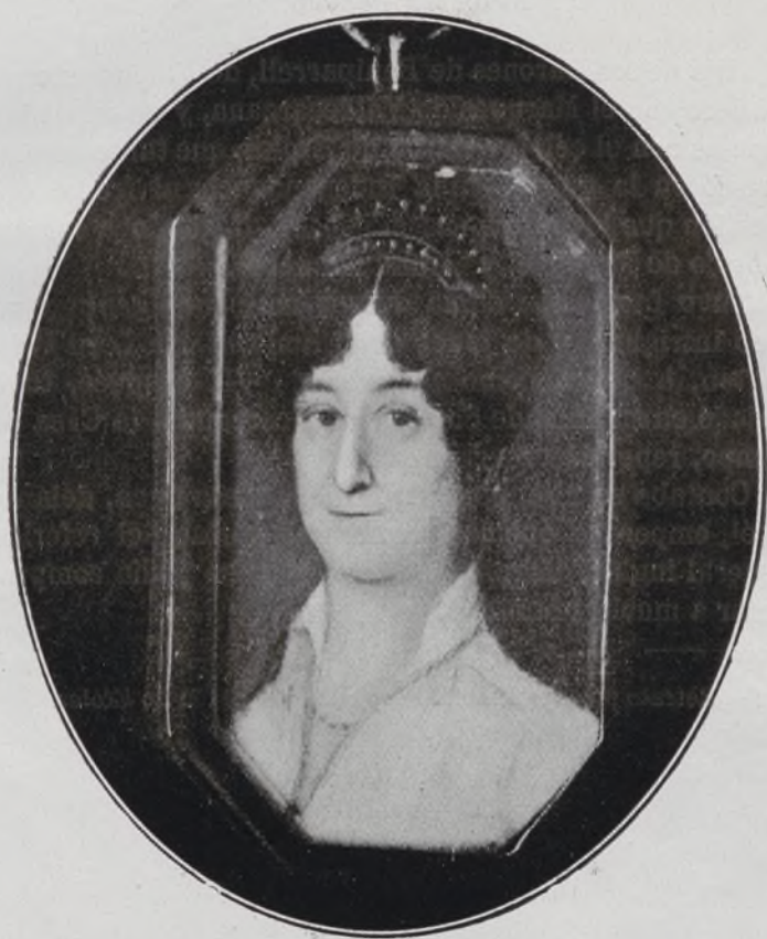
Marquesa de Valdemediano.