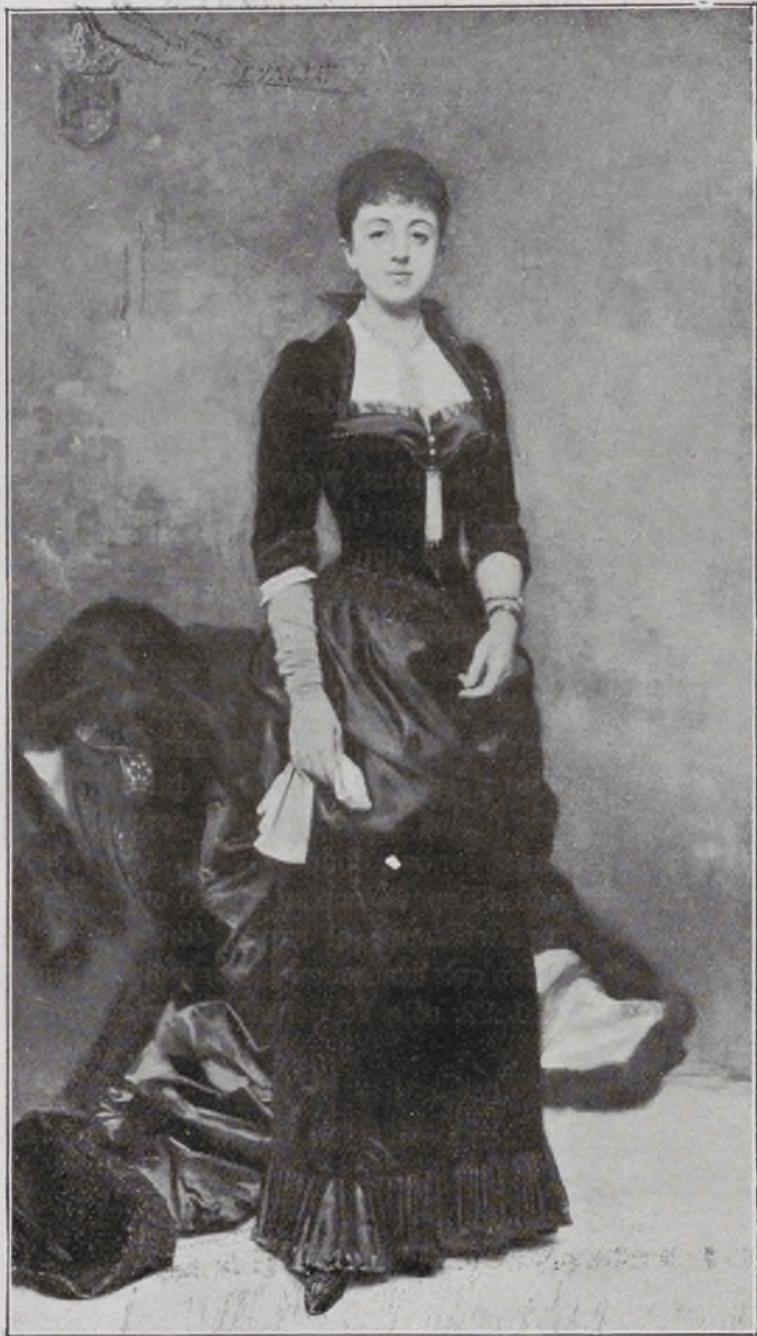
IX Duquesa de Berwick, XVI de Alba. Por Raimundo Madrazo.