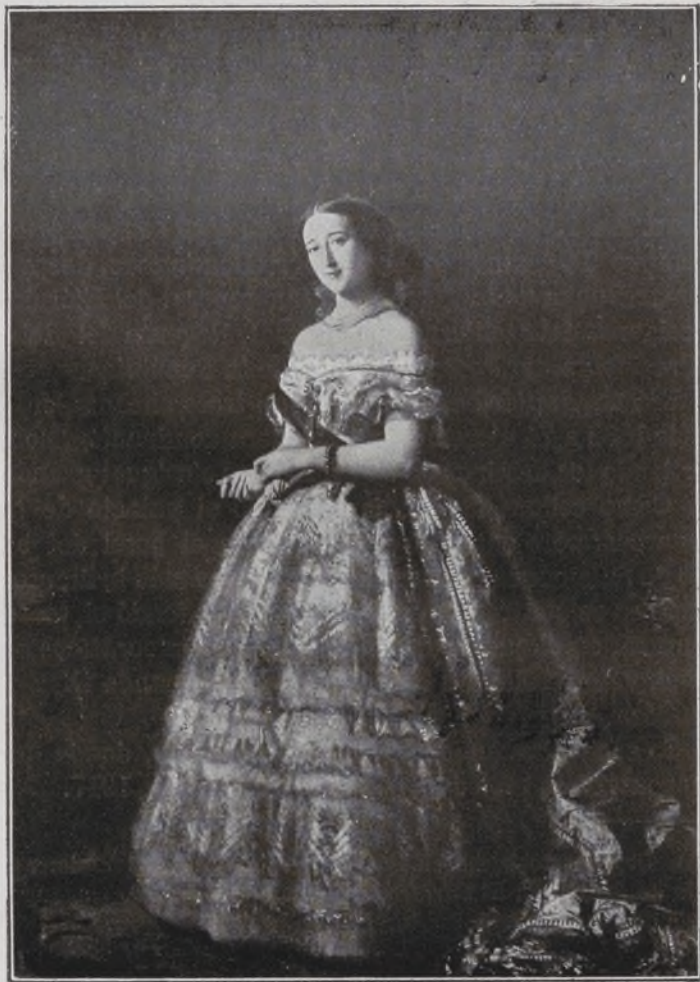
VIII Duquesa de Berwick, XV de Alba.