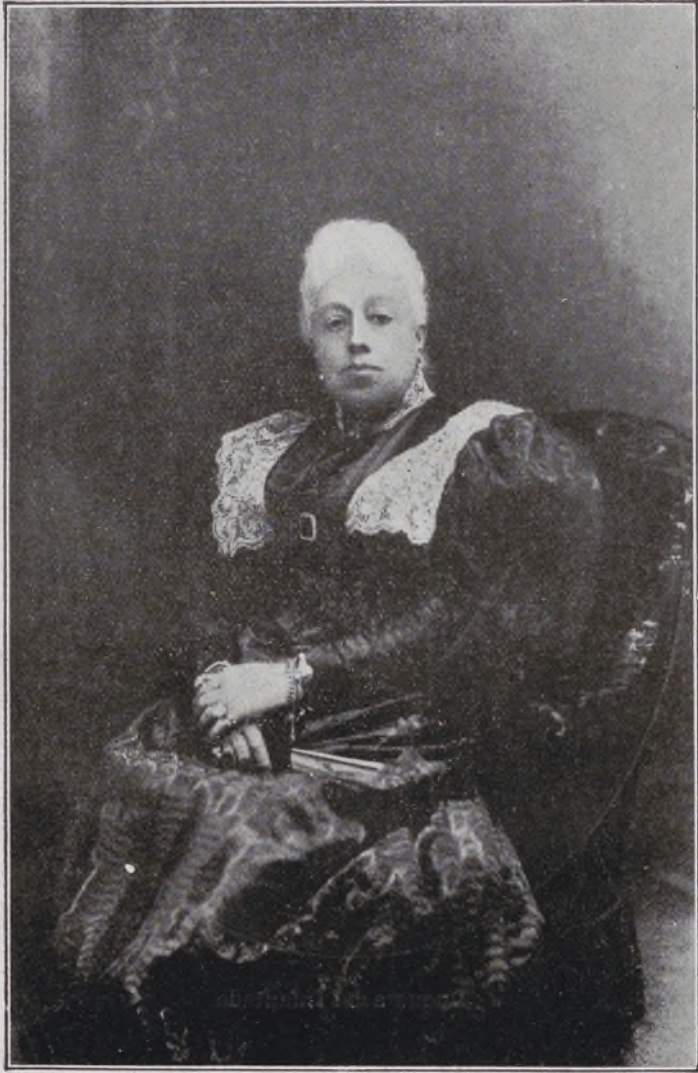
III Duquesa de Fernán Núñez.