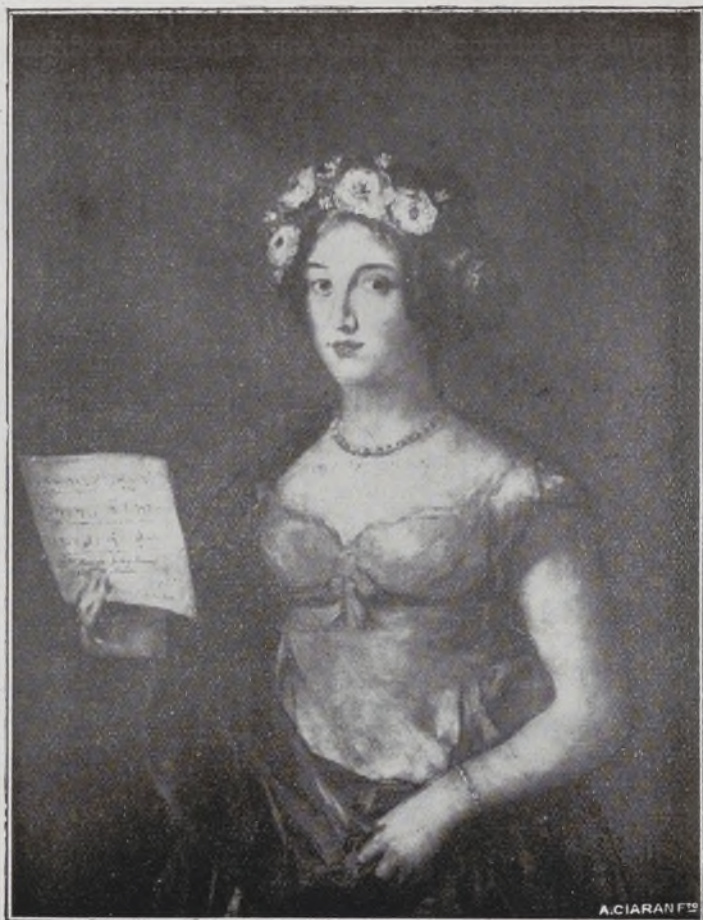
Duquesa de Abrantes.