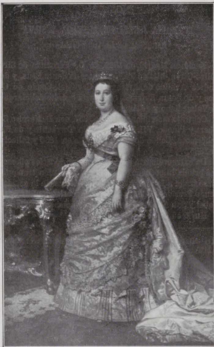
XV Condesa de Sástago.