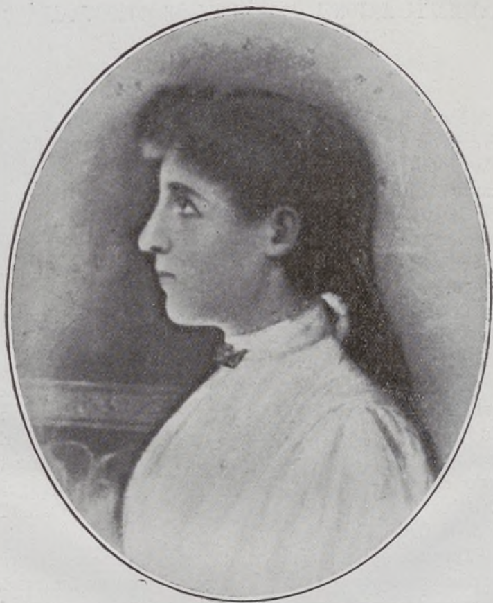
IX Condesa de Parcent.