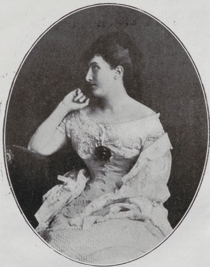
Duquesa del Infantado.