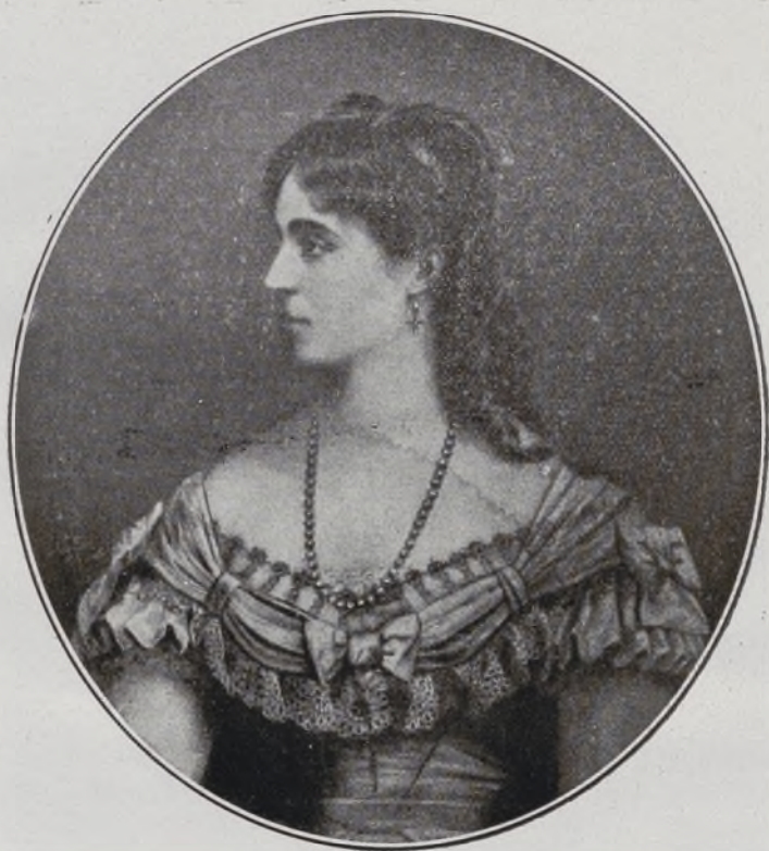
XV Duquesa de Medinaceli.