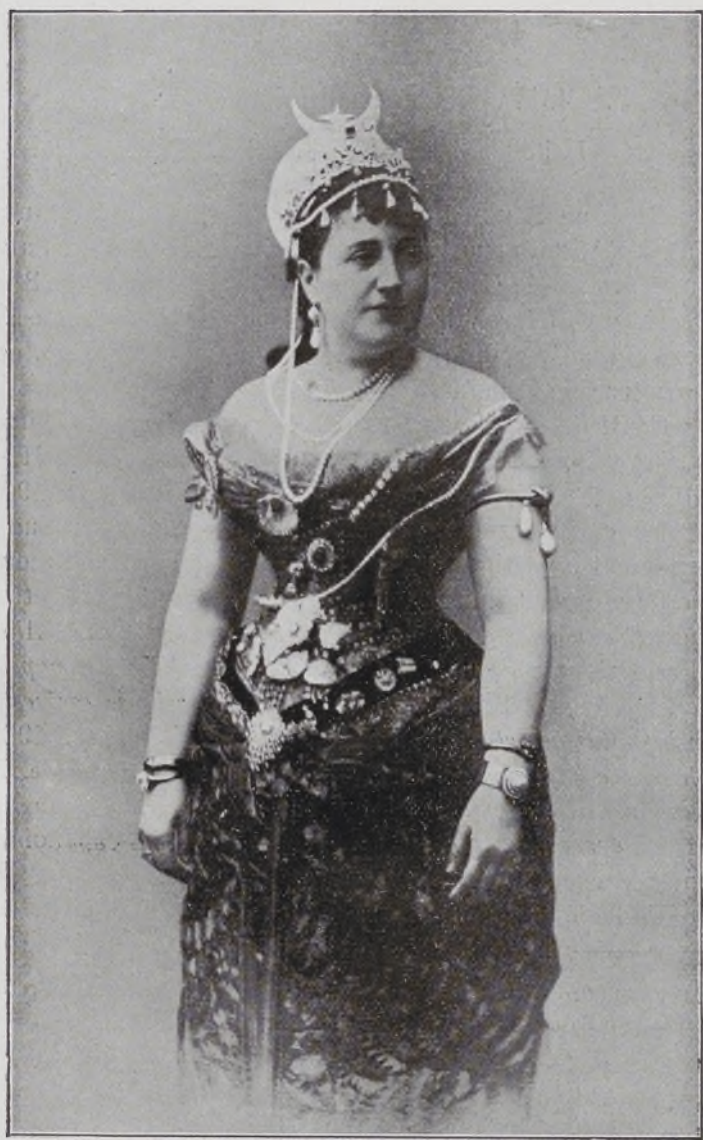
II Marquesa de la Laguna.