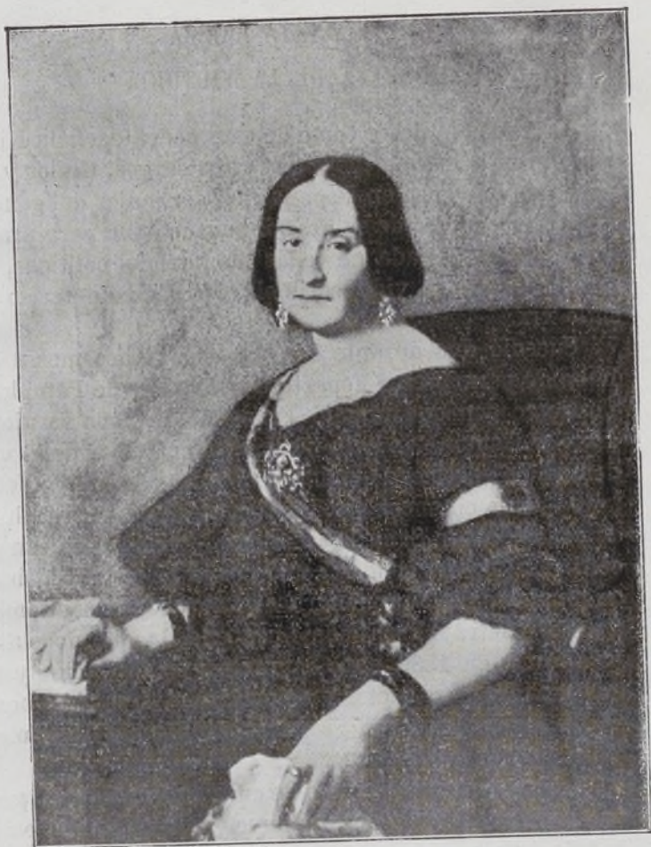
Condesa de Espoz y Mina.