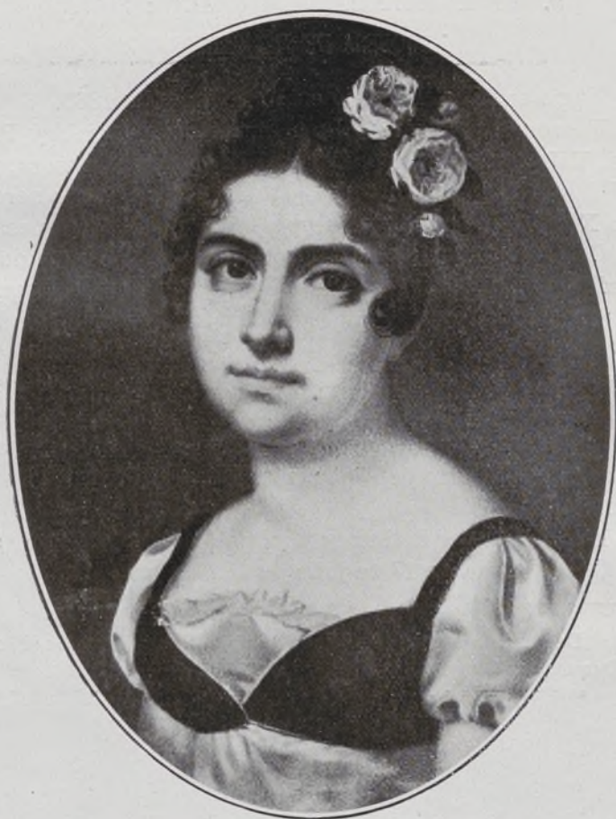
Duquesa viuda de Gor, Vizcondesa de Valoria.