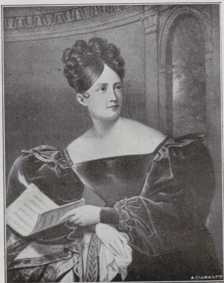
Maria García de Malibran (La Malibran).