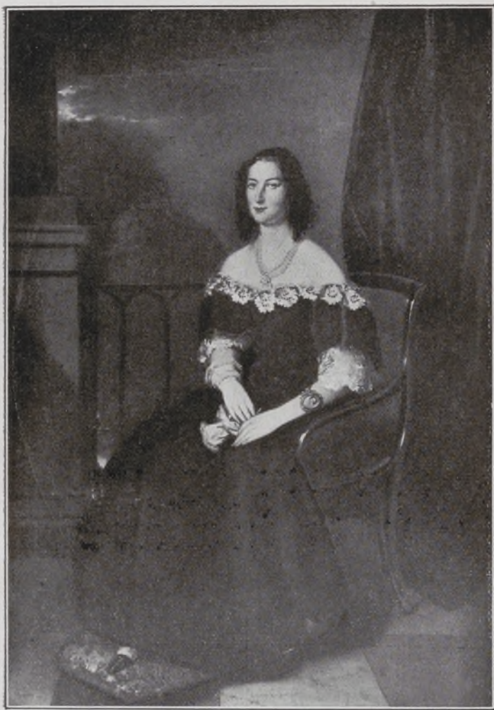
Condesa del Montijo. Por Gutiérrez de la Vega