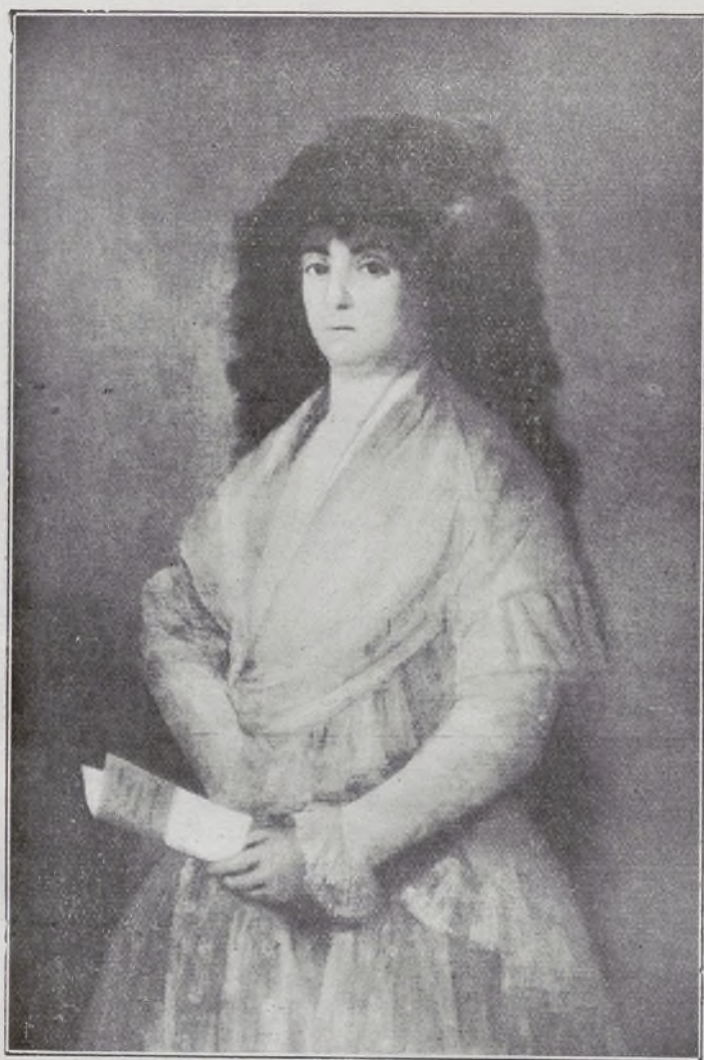
La Tirana. Por Goya.