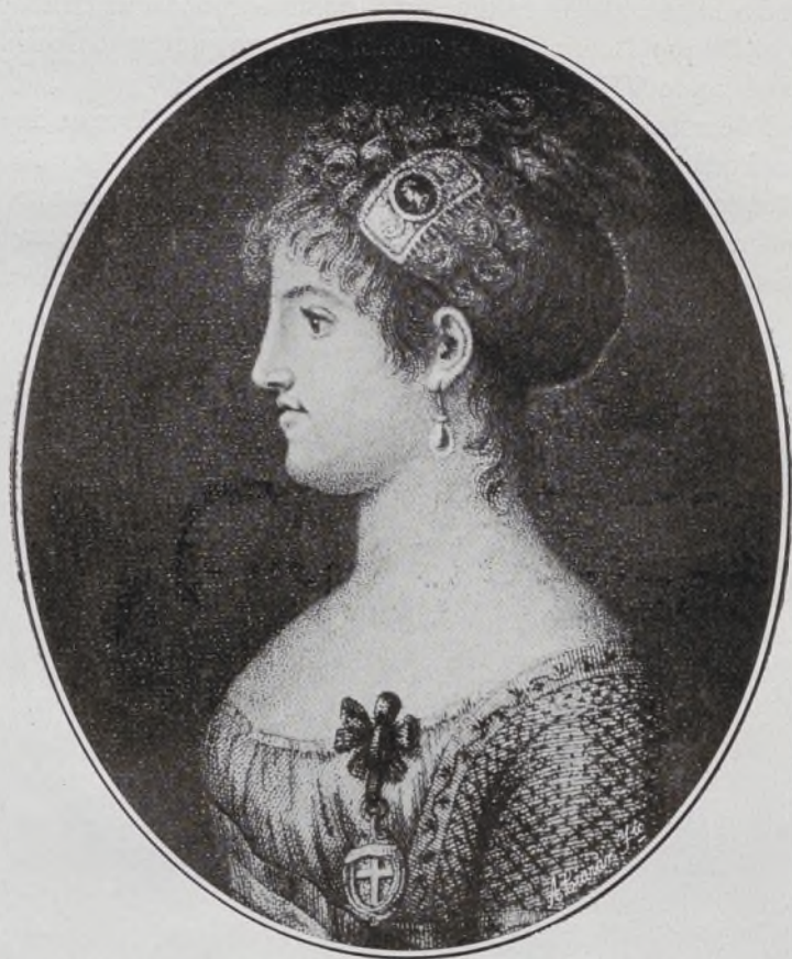
La Reina de Etruria.