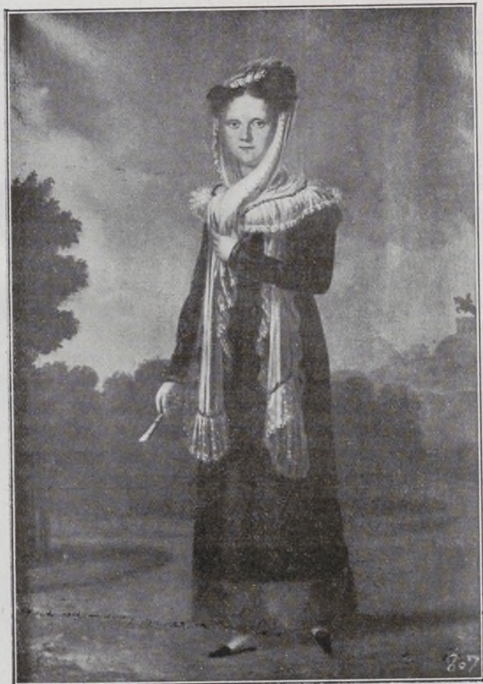
La Infanta Luisa Carlota, Princesa de Nápoles.