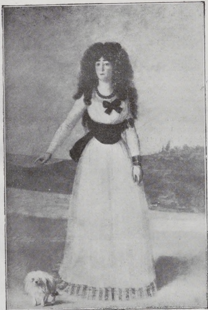
XIII Duquesa de Alba.