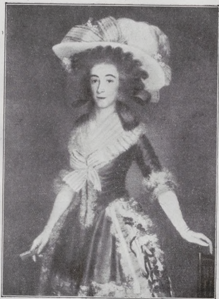
Condesa-Duquesa de Benavente.