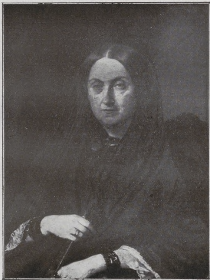
D.ª Cecilia Böhl de Faber y de Larrea. (Fernán Caballero).