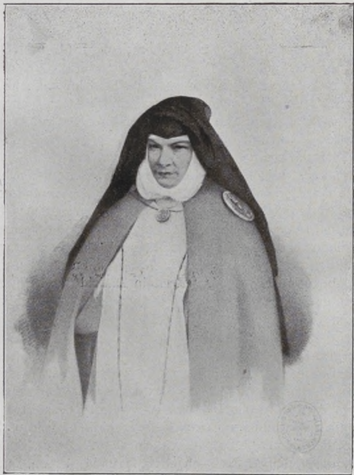
Sor Maria de los Dolores Patrocinio.