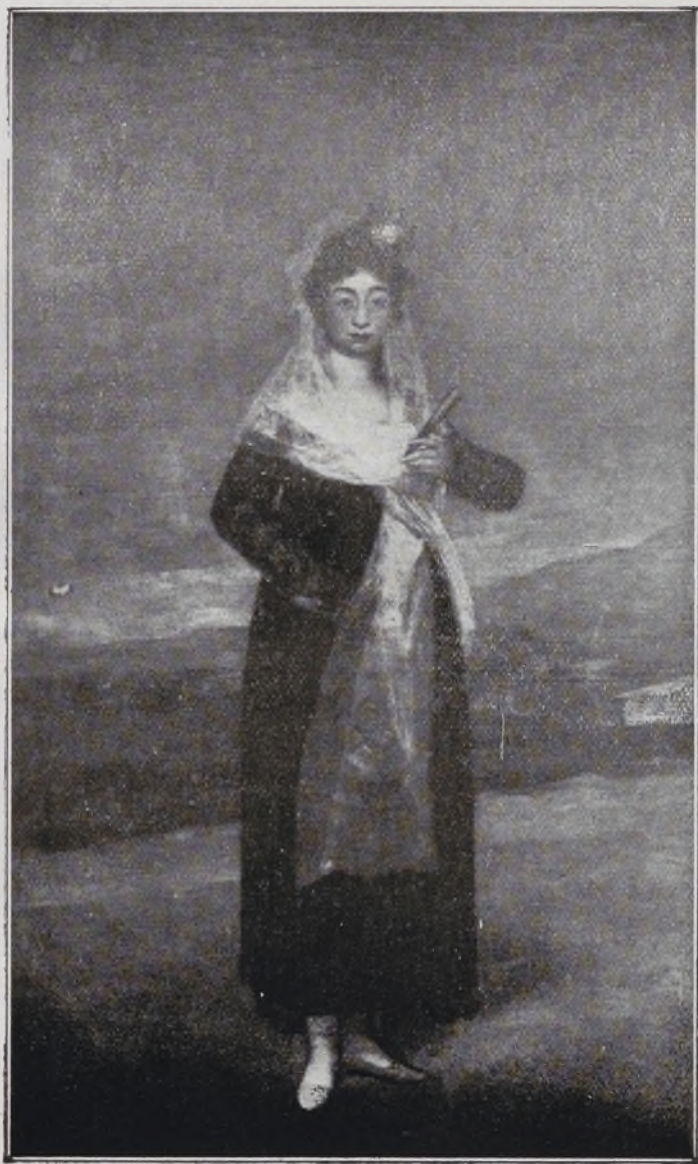
Marquesa de Santiago, Por Goya.