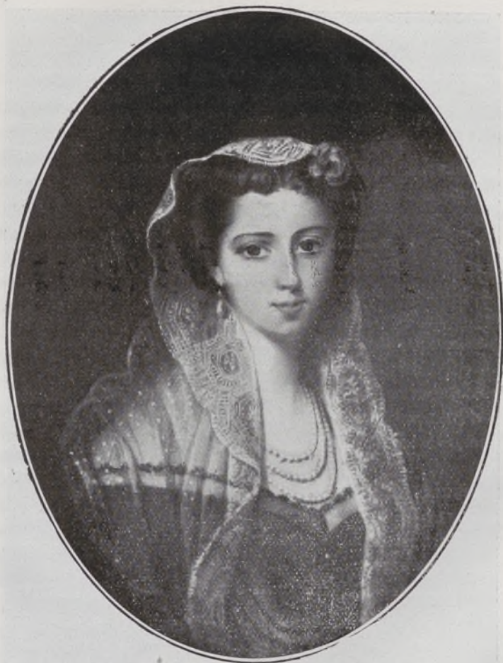
VII Marquesa del Salar