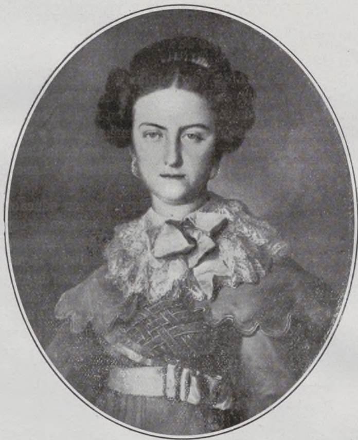
La Reina Maria Josefa Amalia de Sajonia. Por Vicente López.