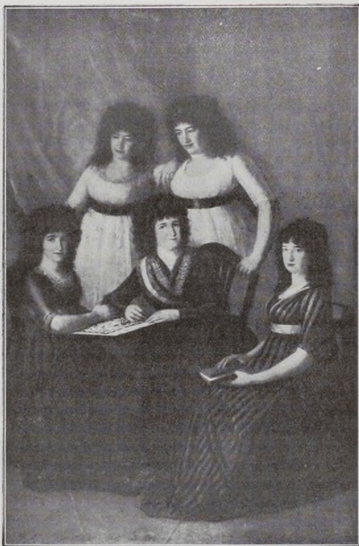
La VI Condesa de Montijo y sus hijas.