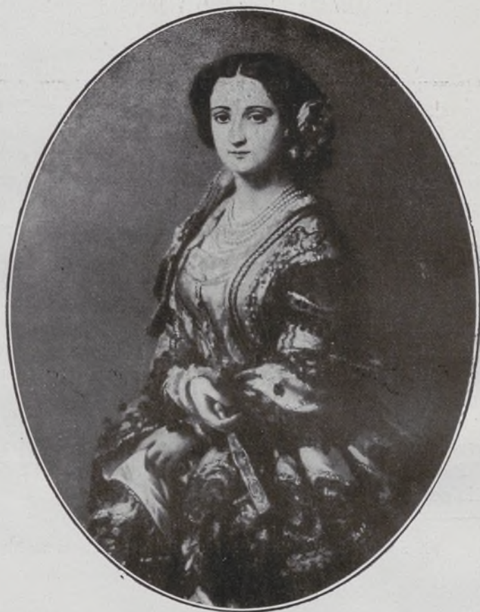
Duquesa de la Torre.