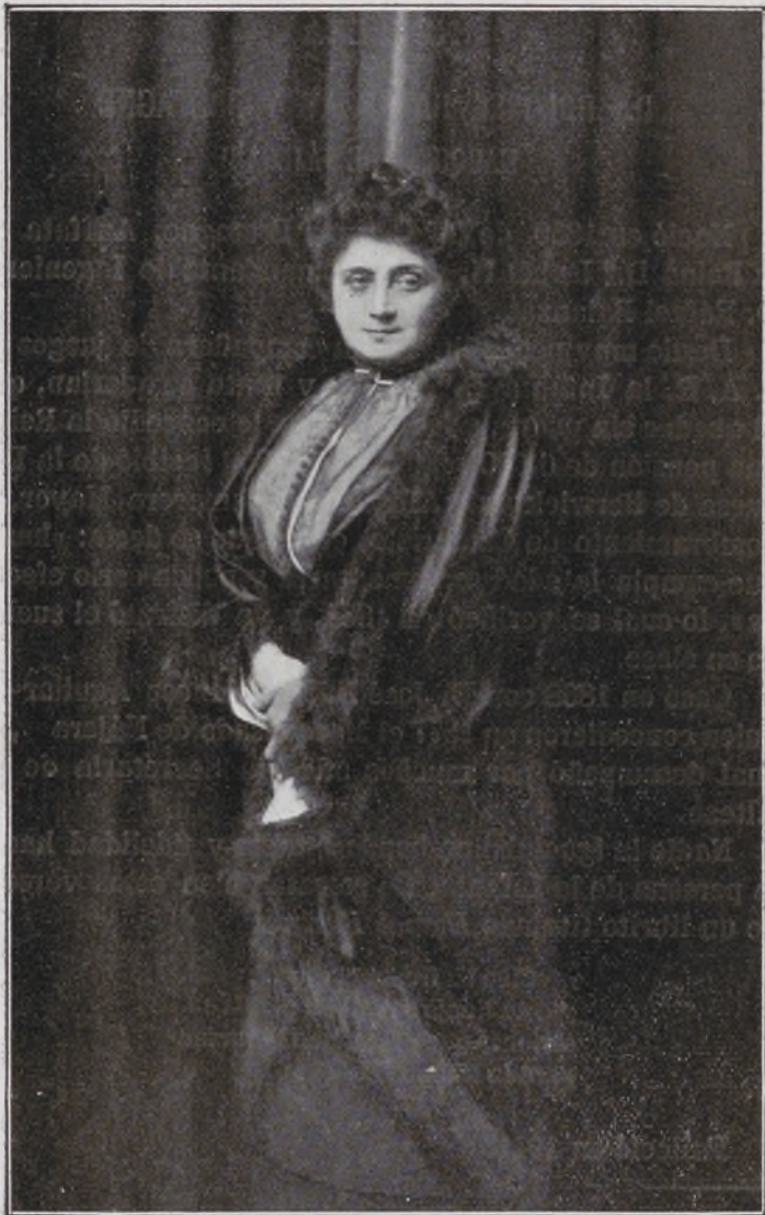
Condesa de San Rafael.