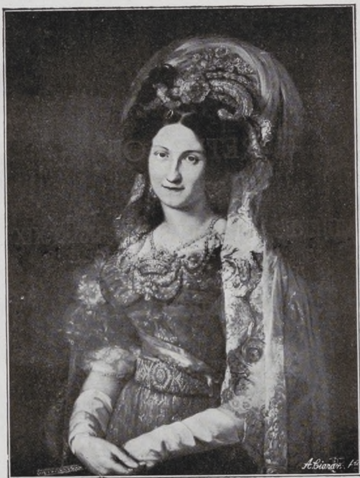
La Reina D. a María Cristina de Borbón.