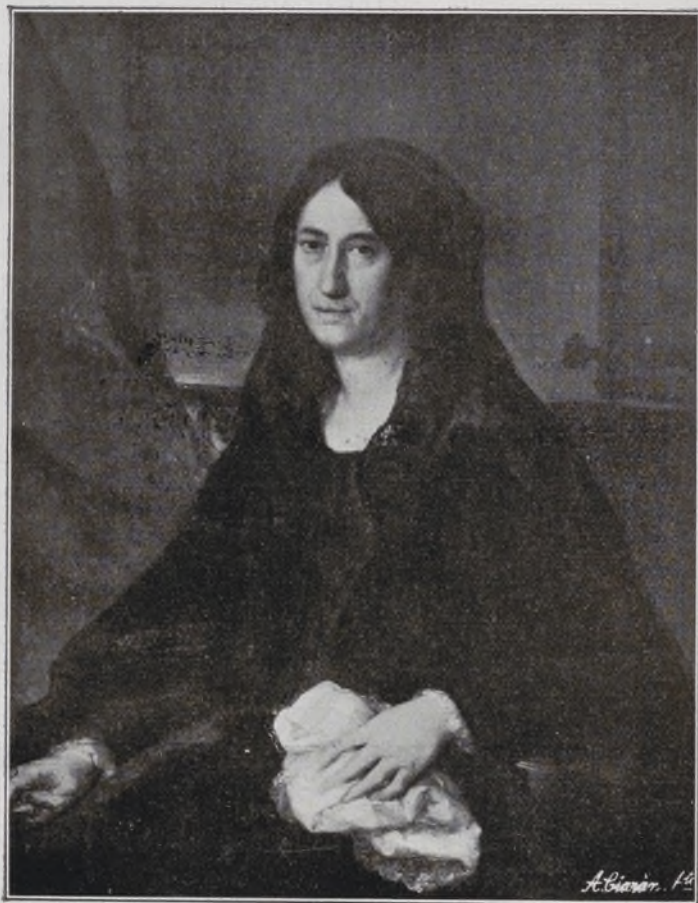
Baronesa de Eroles.