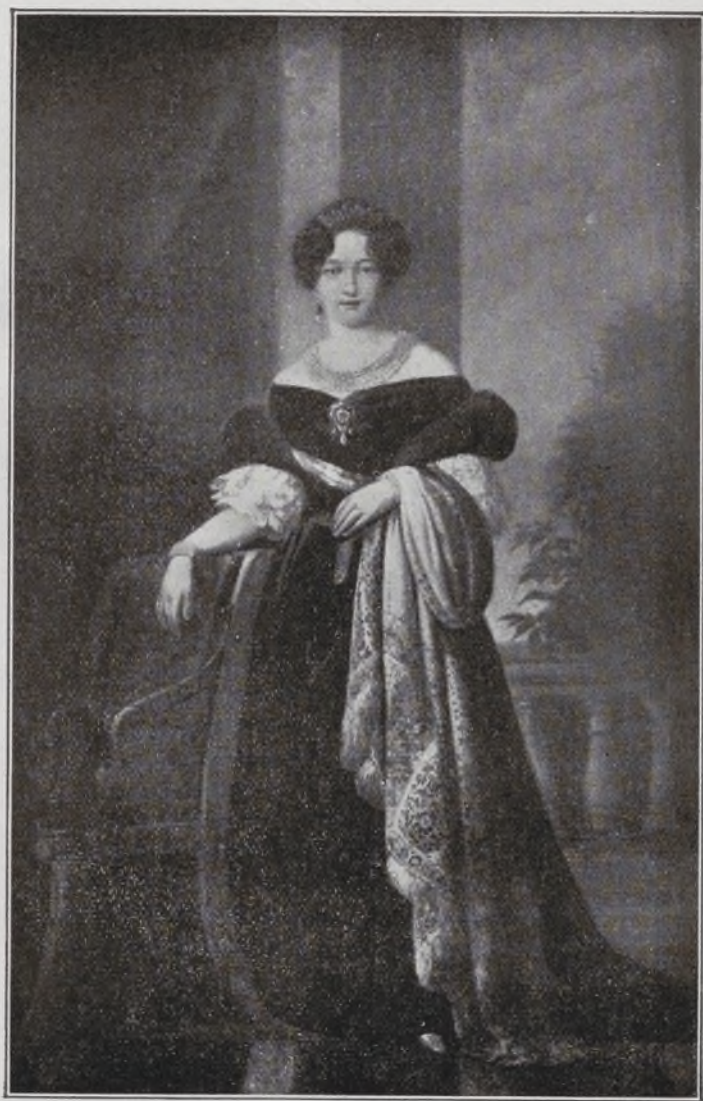
X Duquesa de Osuna.