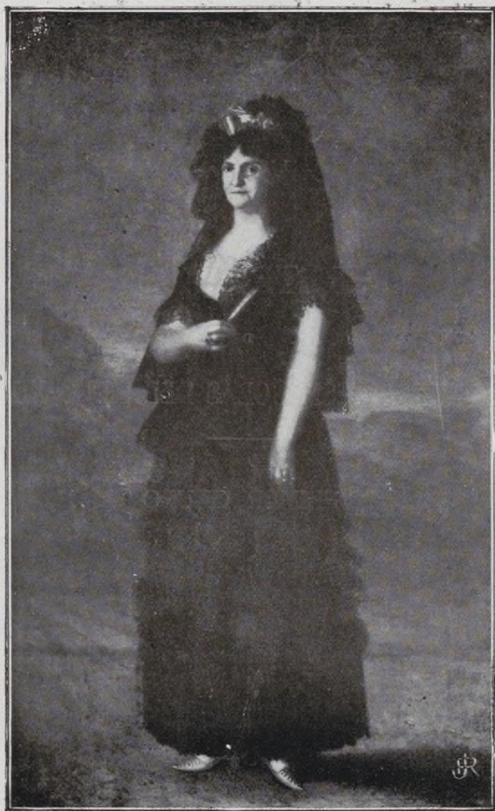
La Reina Maria Luisa.