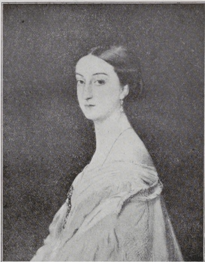
Infanta de España, Condesa de Paris.