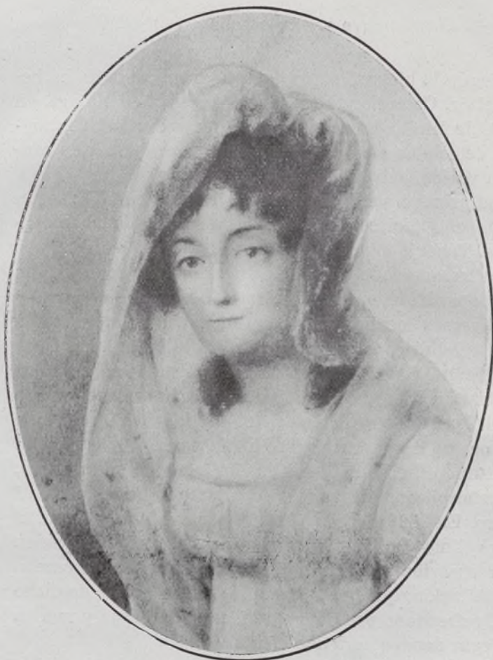
D. a Teresa Cabarrús o Mme. Tallien.