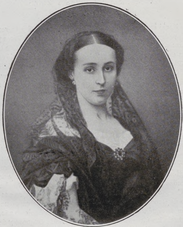
VII Marquesa de la Torrecilla.