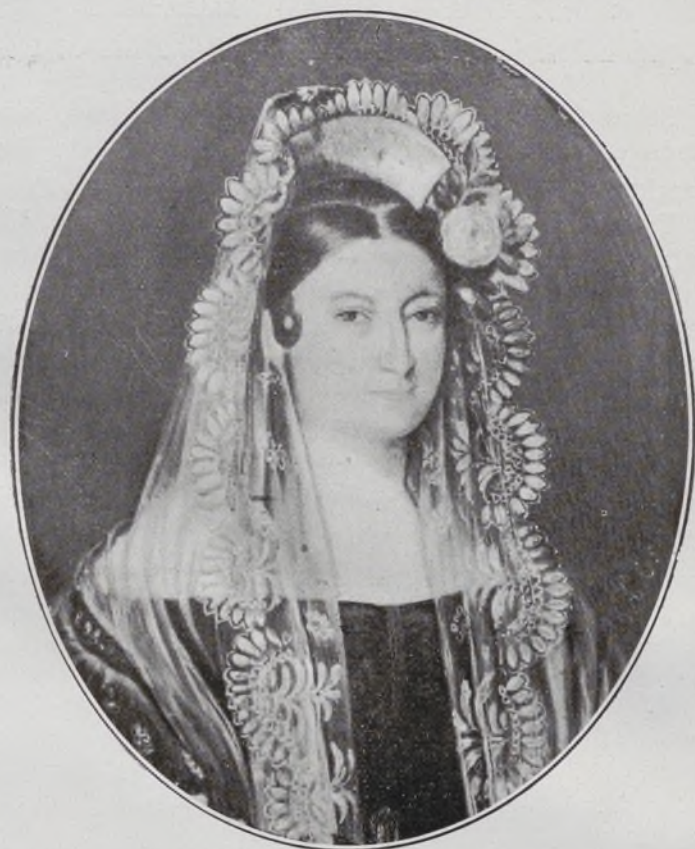
Condesa viuda de Torrejón.