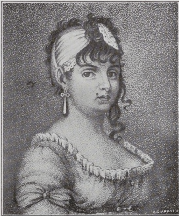
Lorenza Correa. Grabado de la época.