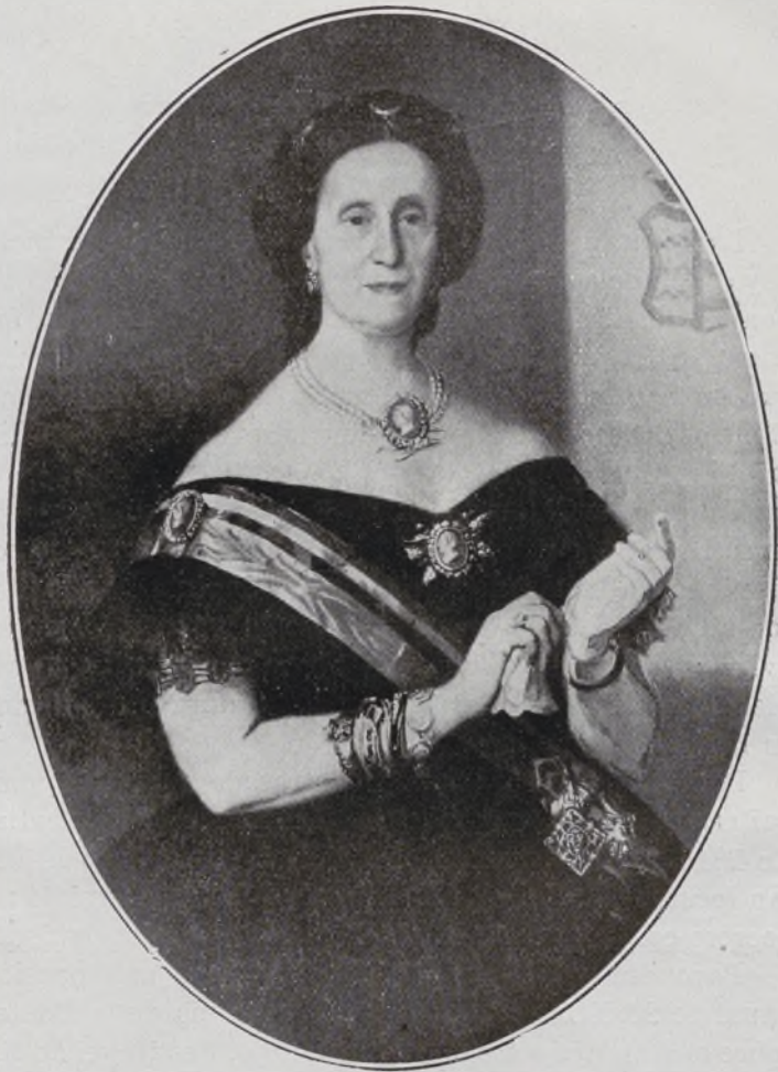
VII Condesa de Sevilla la Nueva.