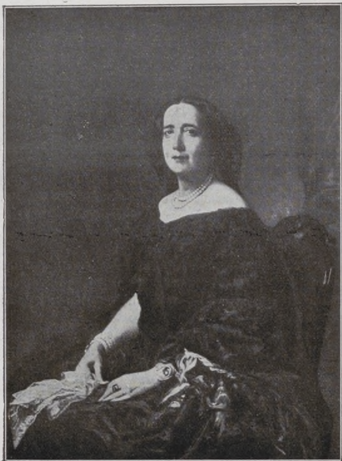
D.ª Gertrudis Gómez de Avellaneda.