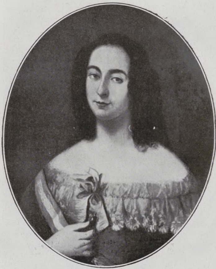
II Condesa de Fontao.