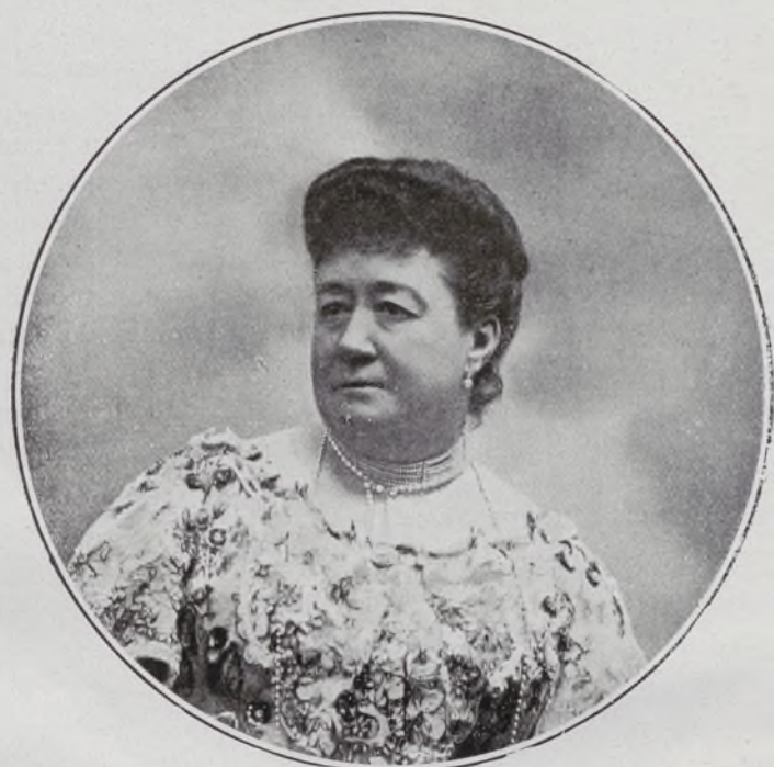
Marquesa de Nájera