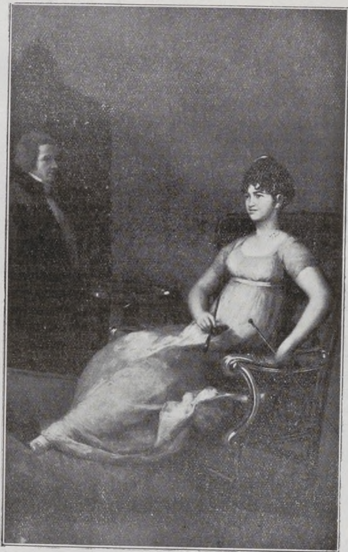
Duquesa de Medina Sidonia. Por Goya.