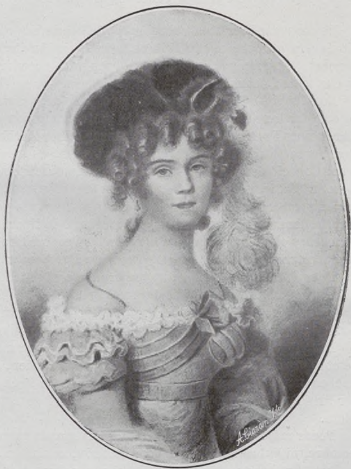
XI Duquesa de Híjar.