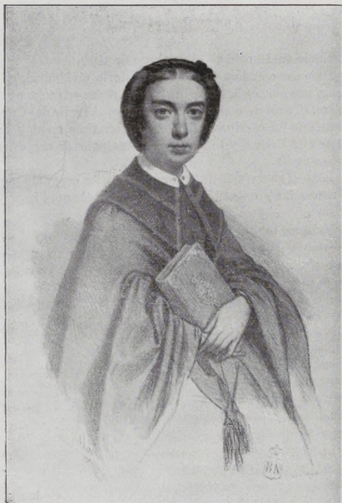
D.ª María del Pilar Sinués de Marco.