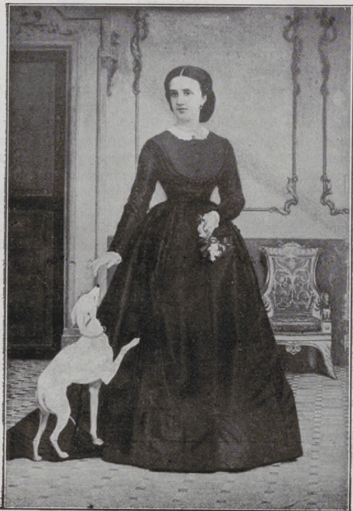
Infanta D. a María Luisa Fernanda de Borbón.