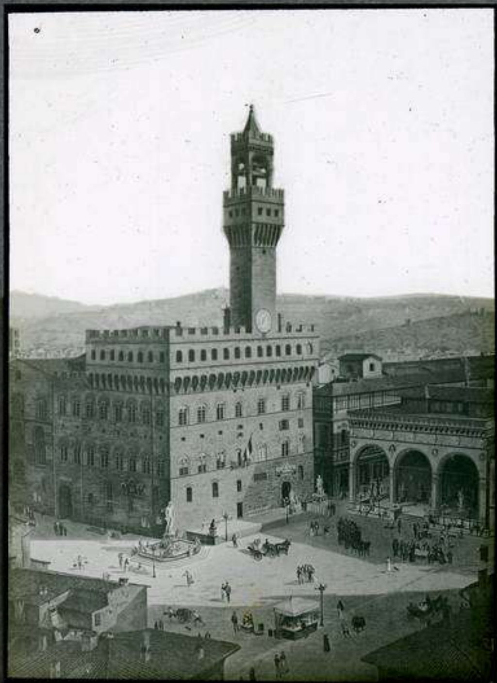
SOGGERESA Avenida Pi y Margall, 7. (Gran Vía) MADRID N.º 205 - Plaza de la Leona en Segovia (Huelva)