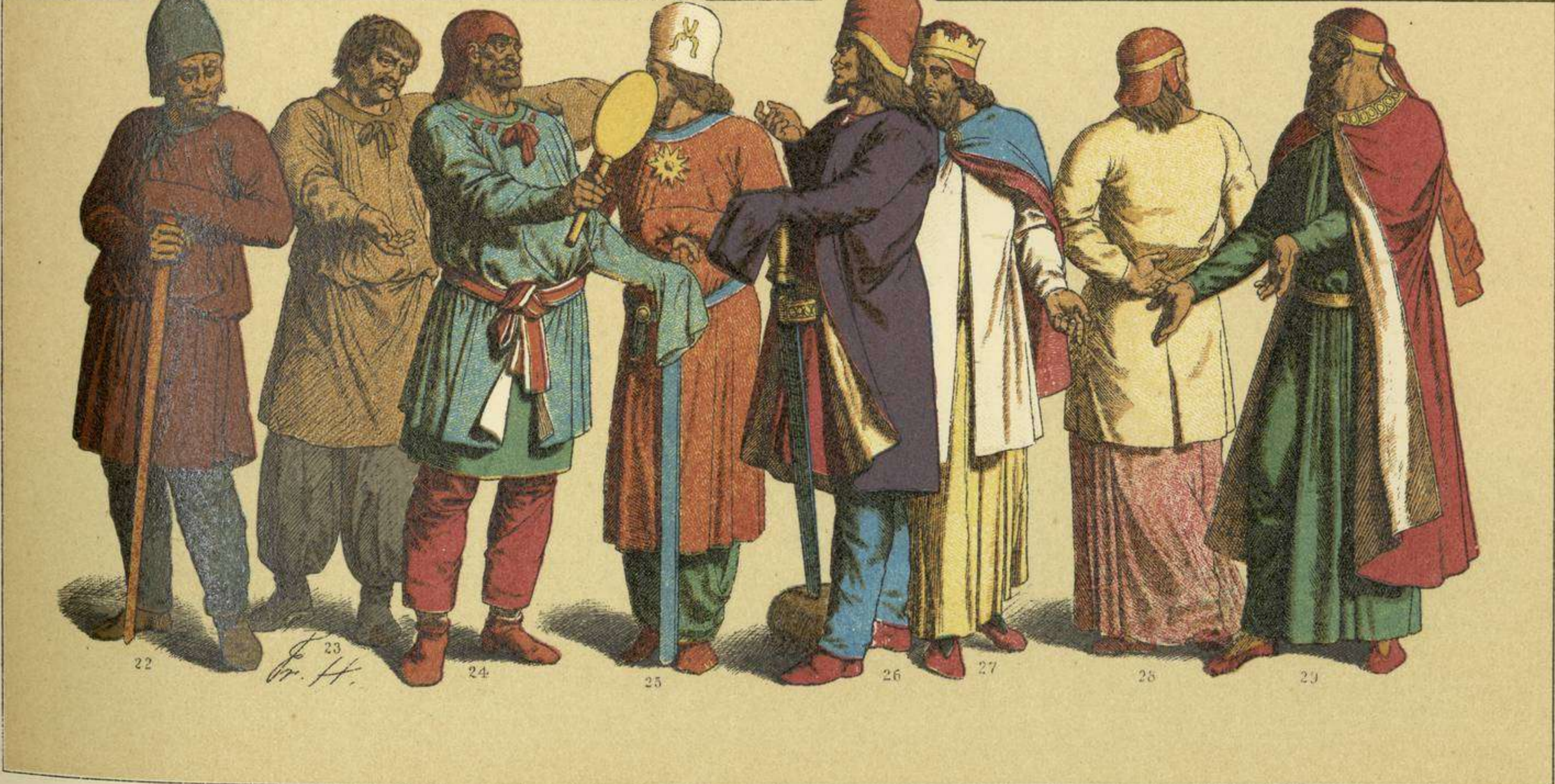
EDAD ANTIGUA.-TRAJES, ARMAS Y ADORNOS DE LOS ESCITAS Y PARTOS