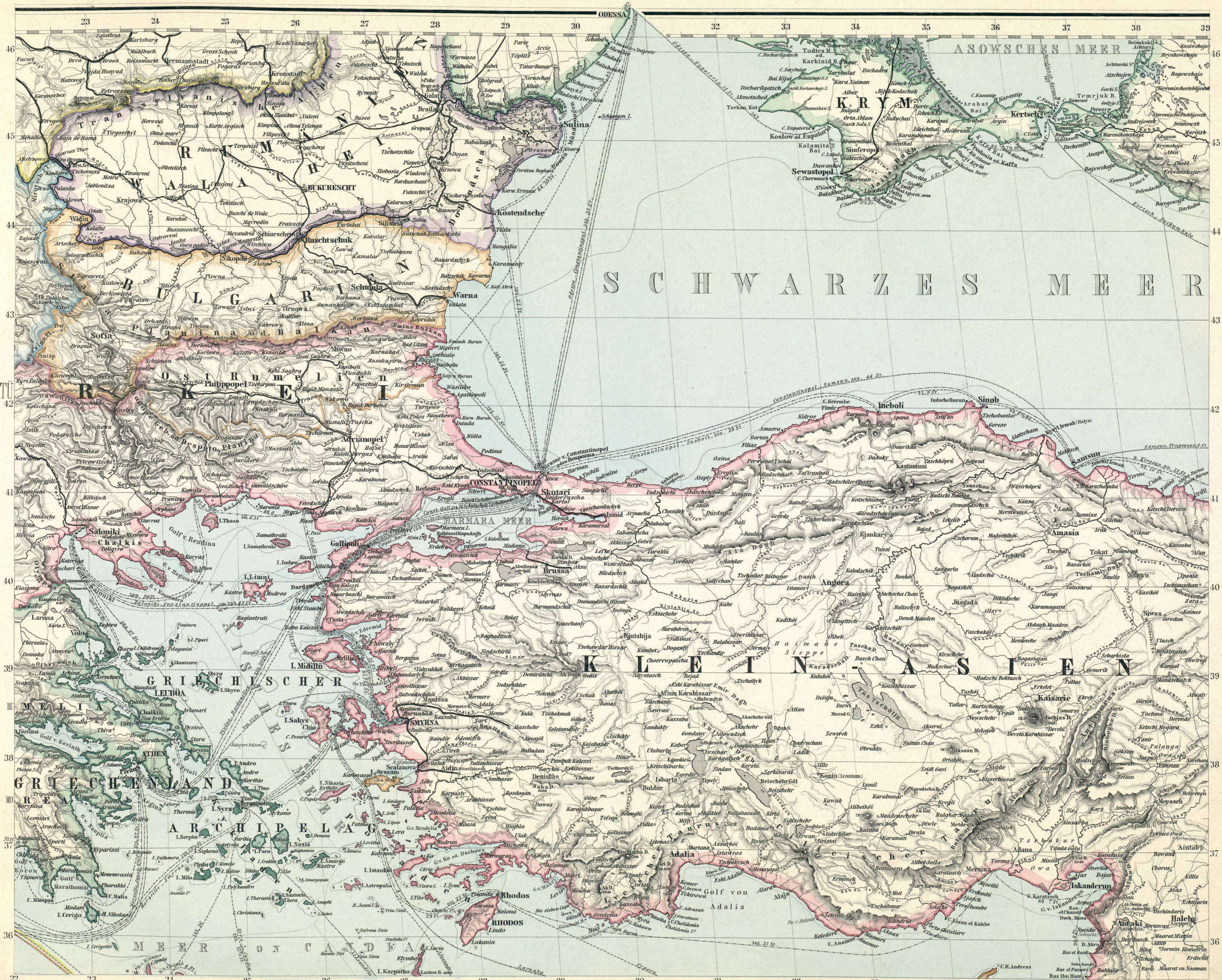
Petermanns Mittelmeer-Karte No. 3.