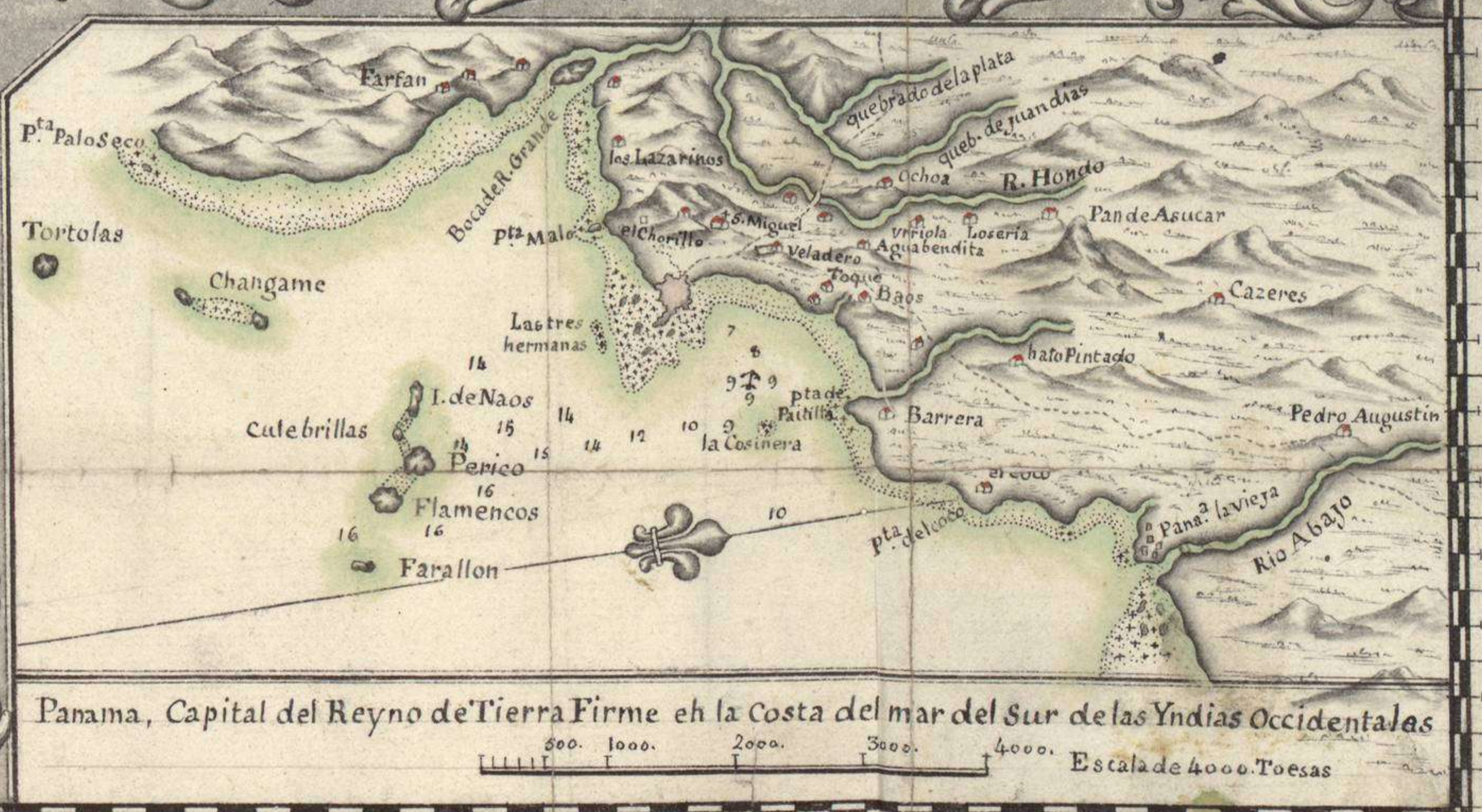
Panama, Capital del Reyno de Tierra Firme eh la Costa del mar del Sur de las Yndias Occidentales

Nota. En estas Costas de la parte del Sur Surge la marea. [en los Nouilunios y Plenilunios.] tres, quatro, y cinco brasas, y se Retiro en la Vaceante, media, tres quartos y una legua en partes Escala de 20. Leguas Españolas de 17½. en un Grado