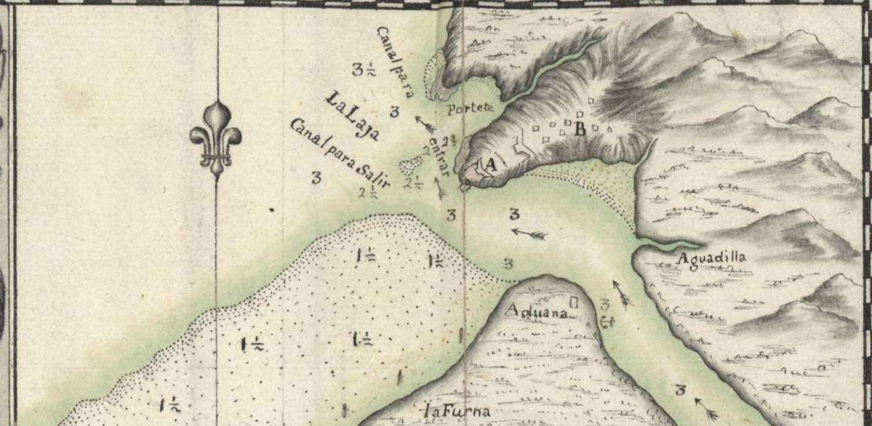
Boca del Rio Chagre A: Castillo de S. Lorenzo, demolido en esta presente Guerra. B: Pueblo de Chagre Yncendiado.