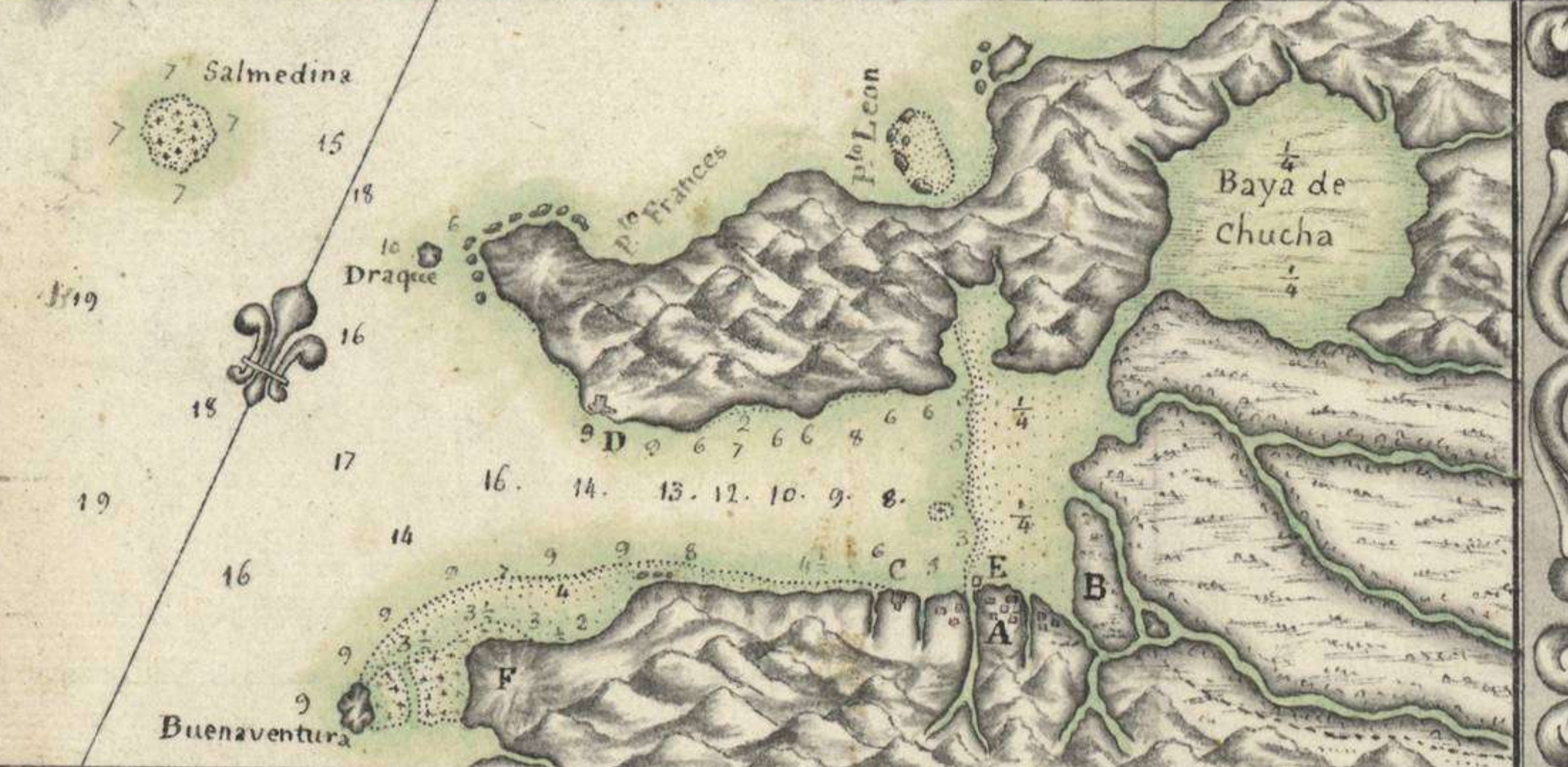
Baya de S. Felipe de Portobelo A: Ciudad de S. Felipe de Portobelo; B: Citió de S. Christobal, destinado para la nueva Ciudad de S. Carlos; C: Castillo de S. Tiago de la Gloria demolido; D: Castillo de San Felipe de todo fierro demolido; E: Castillo de S. Gerónimo demolido; F: Citió de la Rancheria