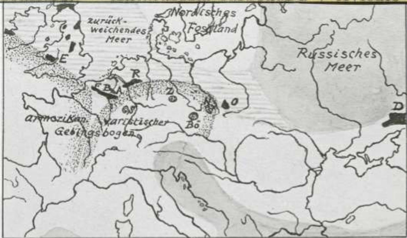
Die mitteleuropäischen Steinkohlenbecken (n. Gothan). Land und Meer zur Oberkarbonzeit (n. Frech) (Schema).