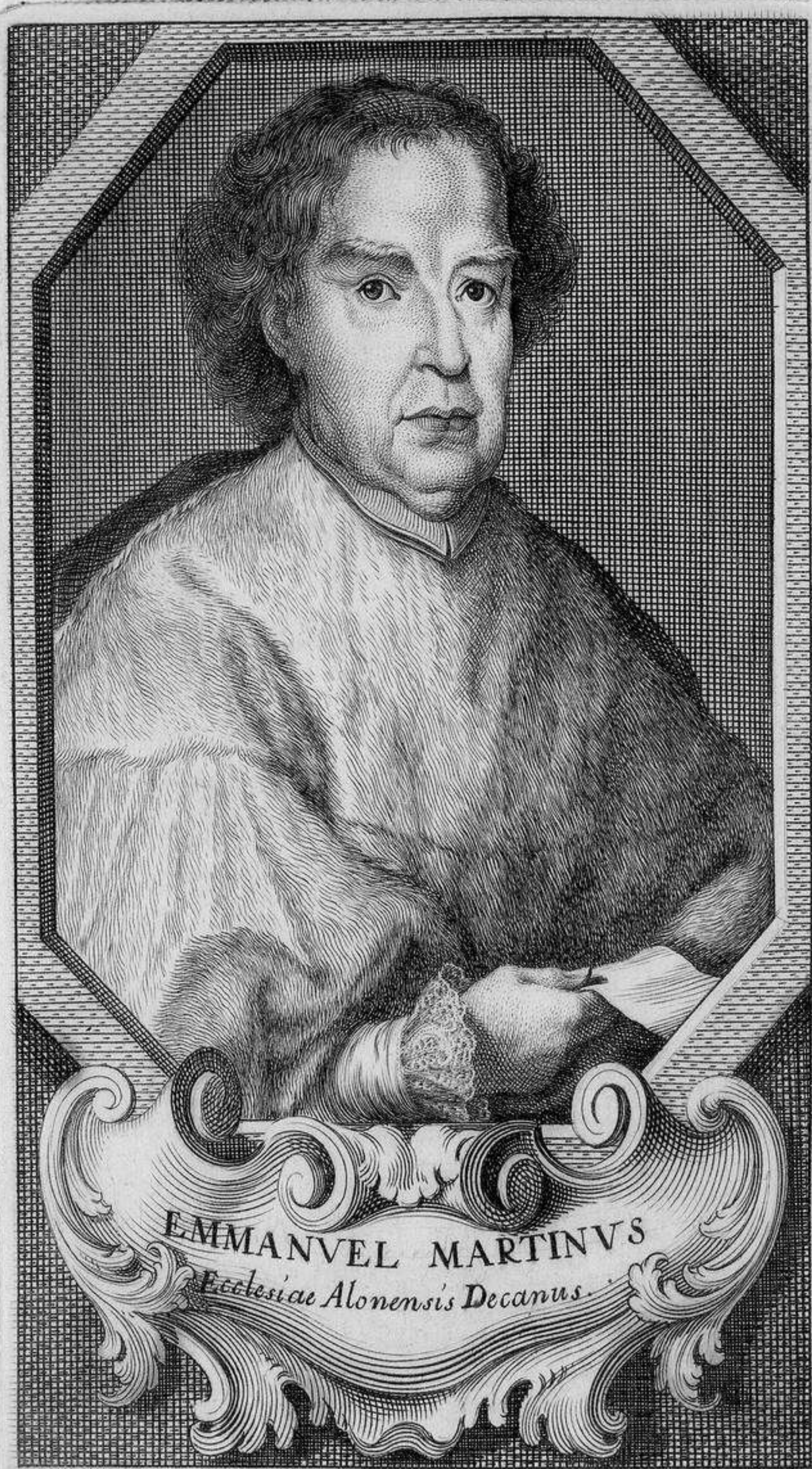
EMMANVEL MARTINVS Ecclesiae Alonensis Decanus.