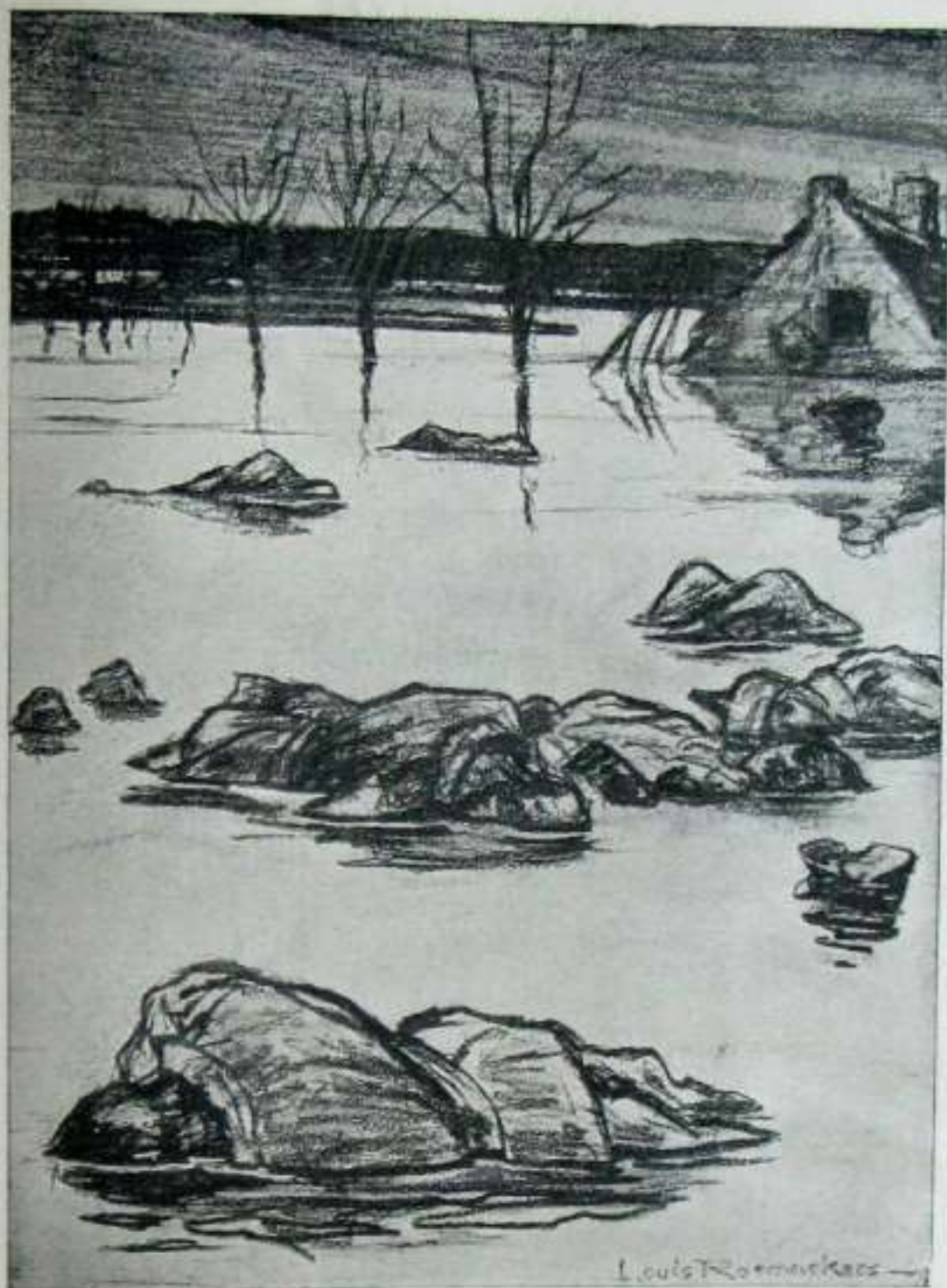
KALAIS 4 ERAKÓ BIDEAN.