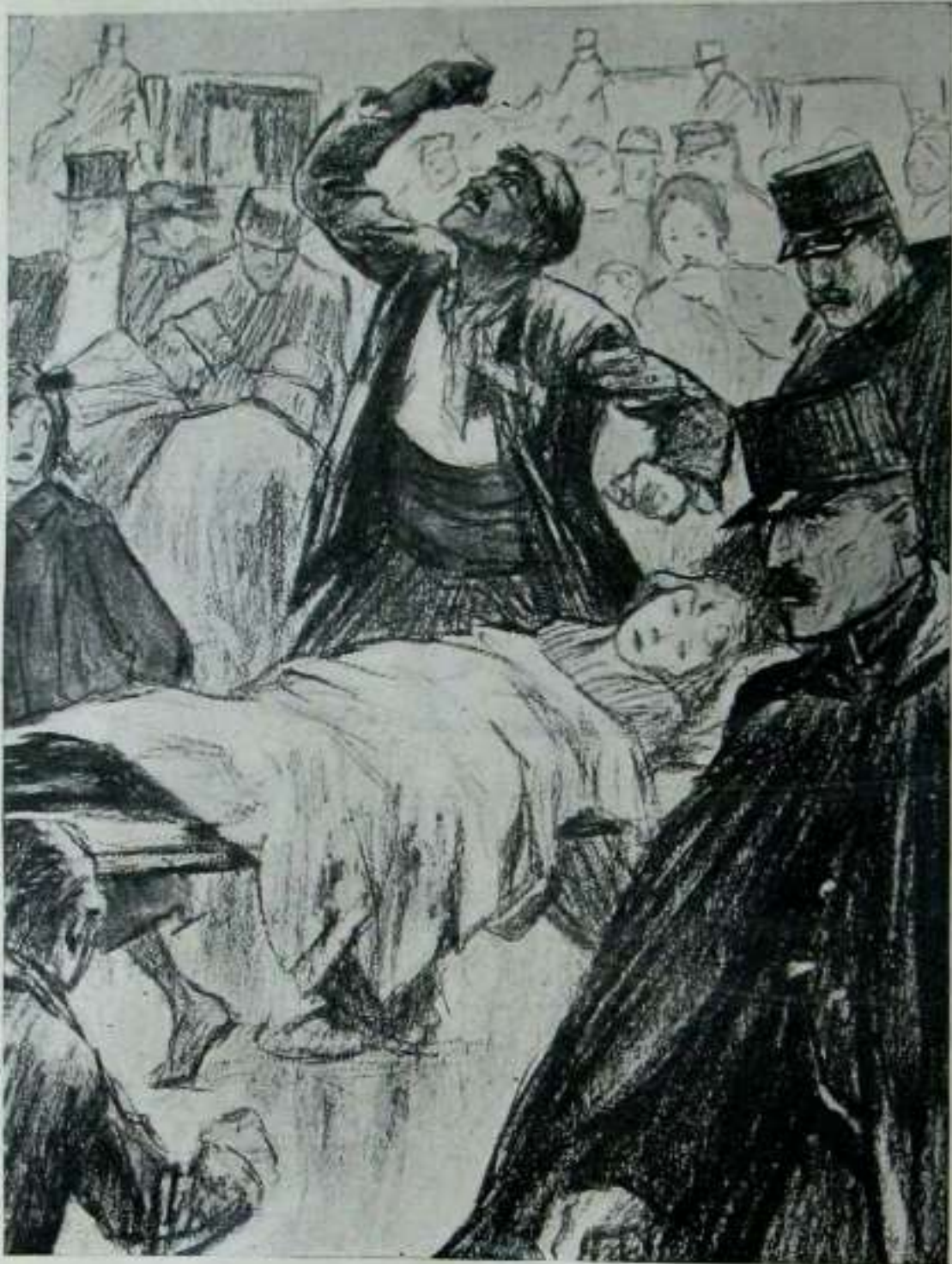
IRAGAN ZEN ZEPPELINA.