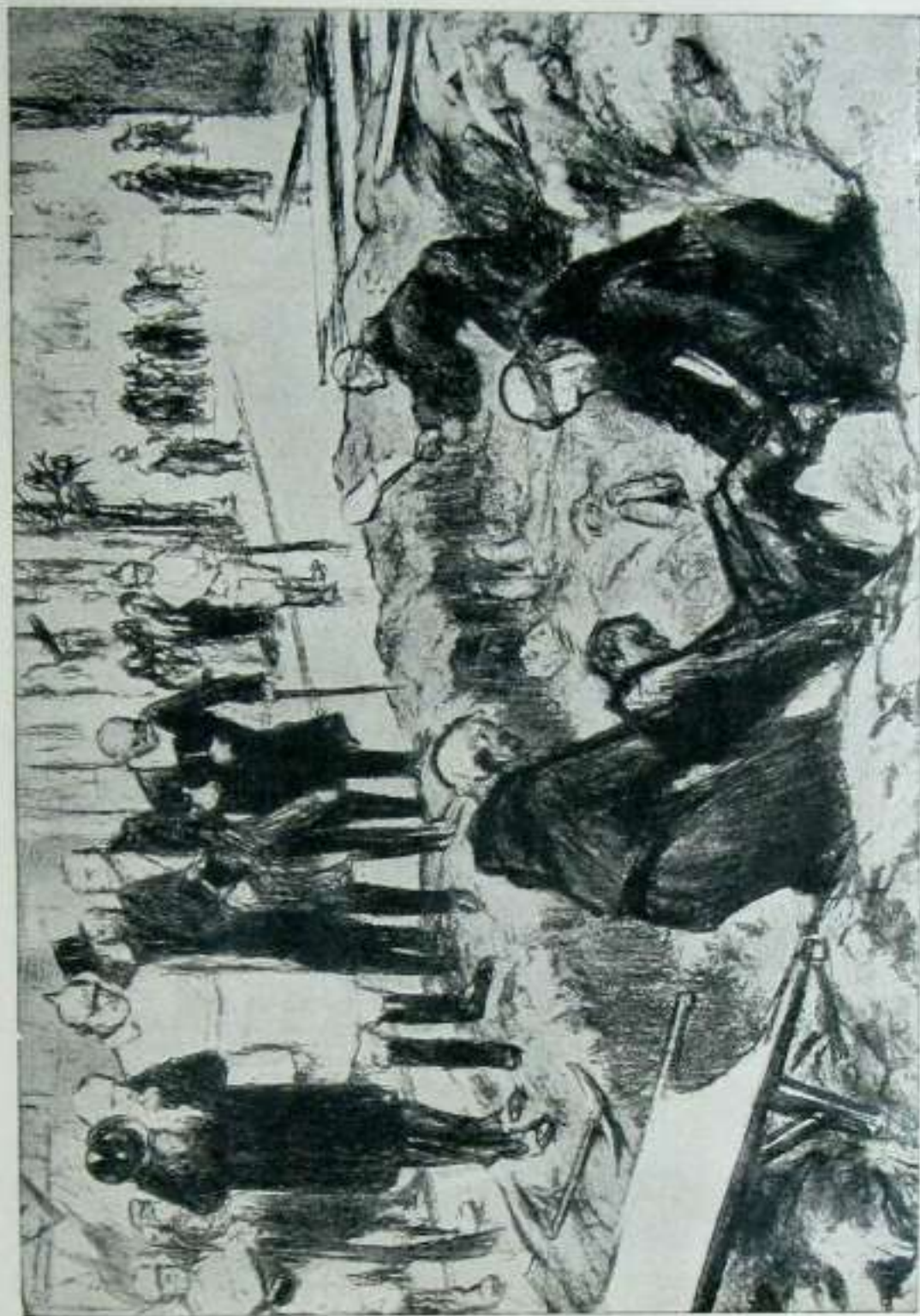
AERSCHOT'ERO ILEN EORTZI BIGARRENA, AYERI ZITUZTEN IARTEROKO NOR ETA NOLA ILL ZIREN.