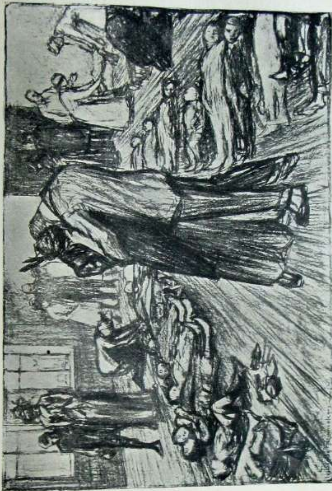
"GOSAMERIKARRAK MATE GAITZATEN EZTUGU NAI, ERABE GAITZATEN BAI ORDEA; "LUSITANIARI" AGITUAZ GUREGANATUKO DITUGU, LURREAN EUN GURENDAZ BANO OBREKI." — "LOS ANGELES HERALD," BRILLIN, 3. MAIATZA 1915.