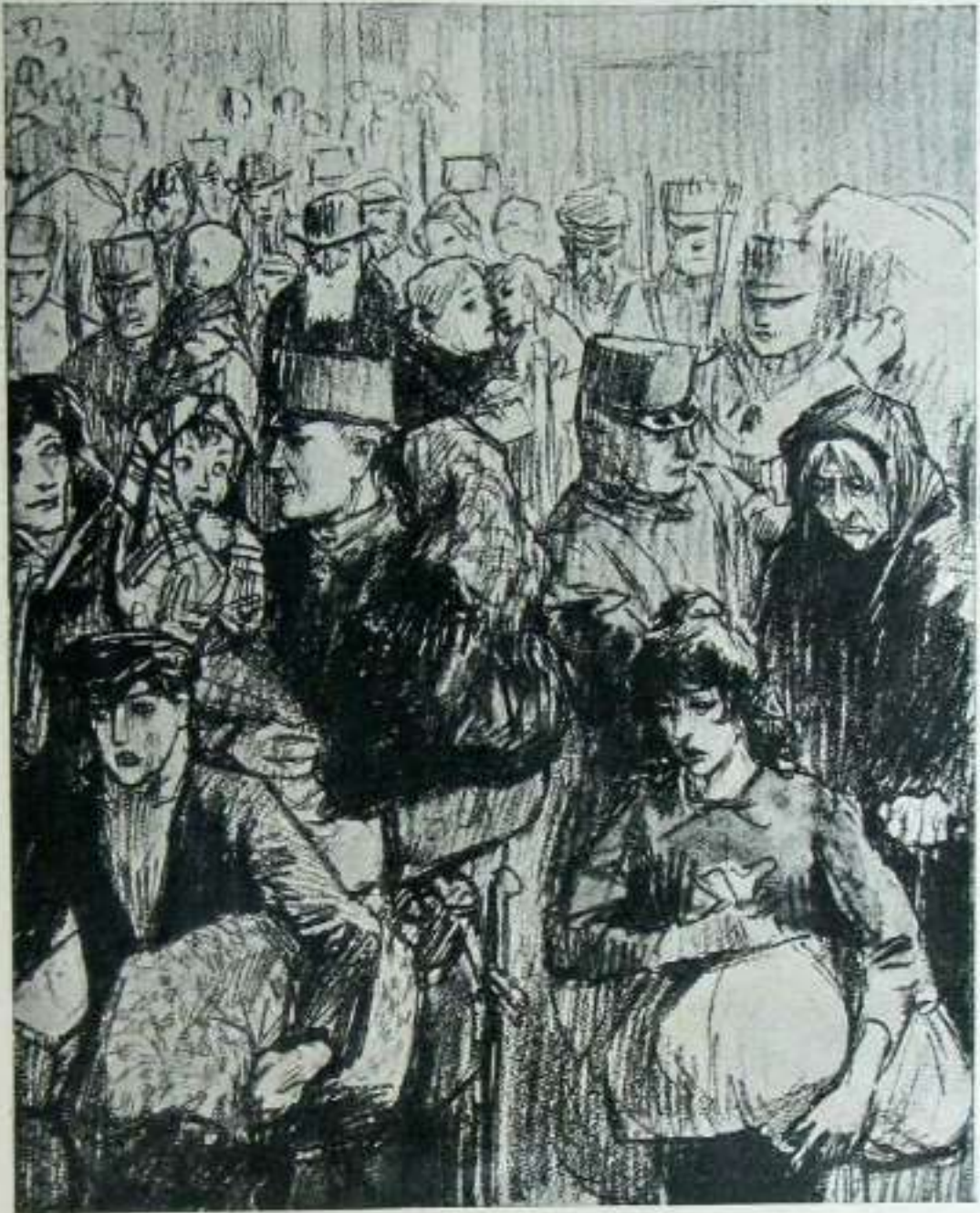
AMBERES' TIK IGESI.