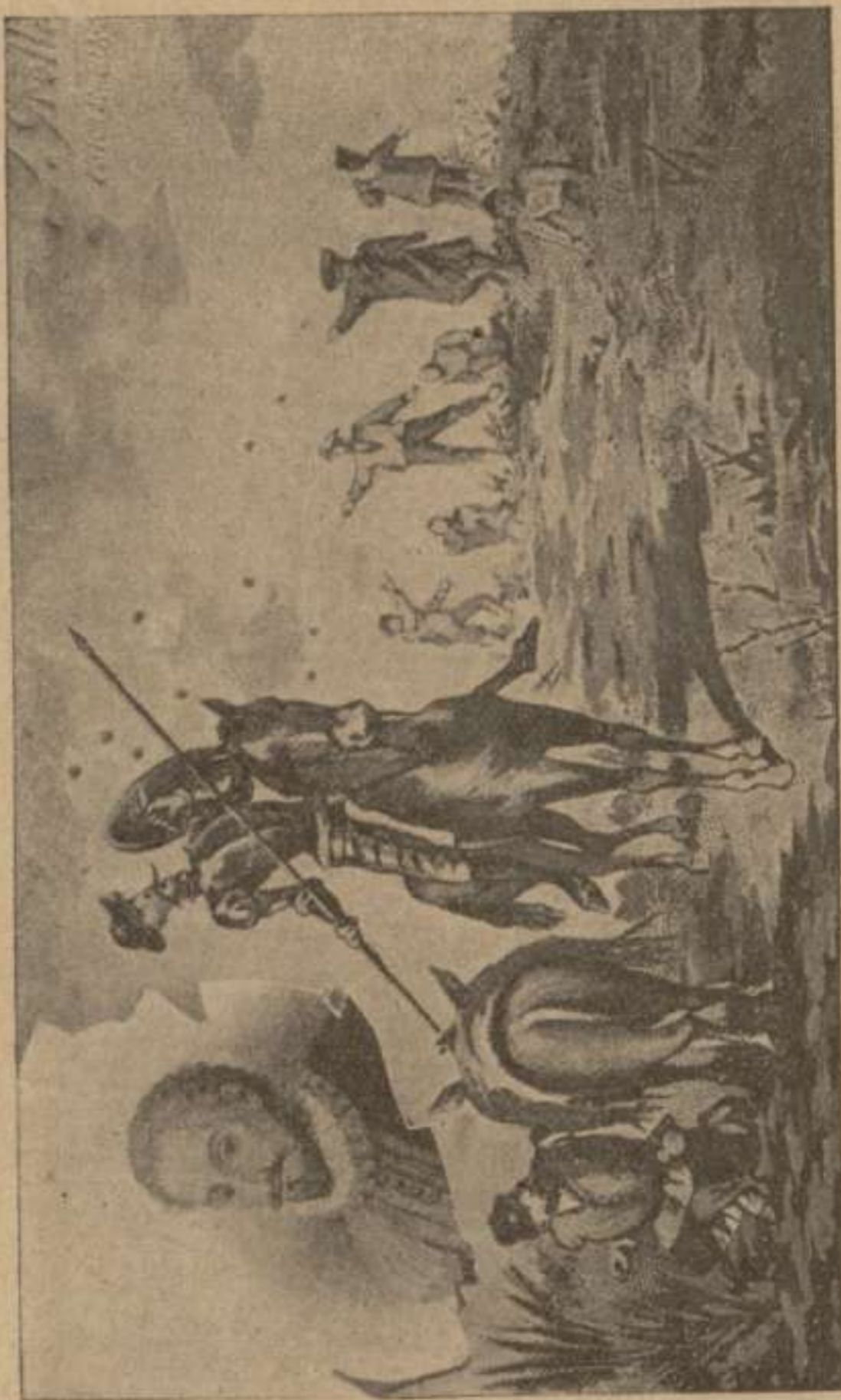
RECUERDO DEL TERCER CENTENARIO DEL QUIJOTE