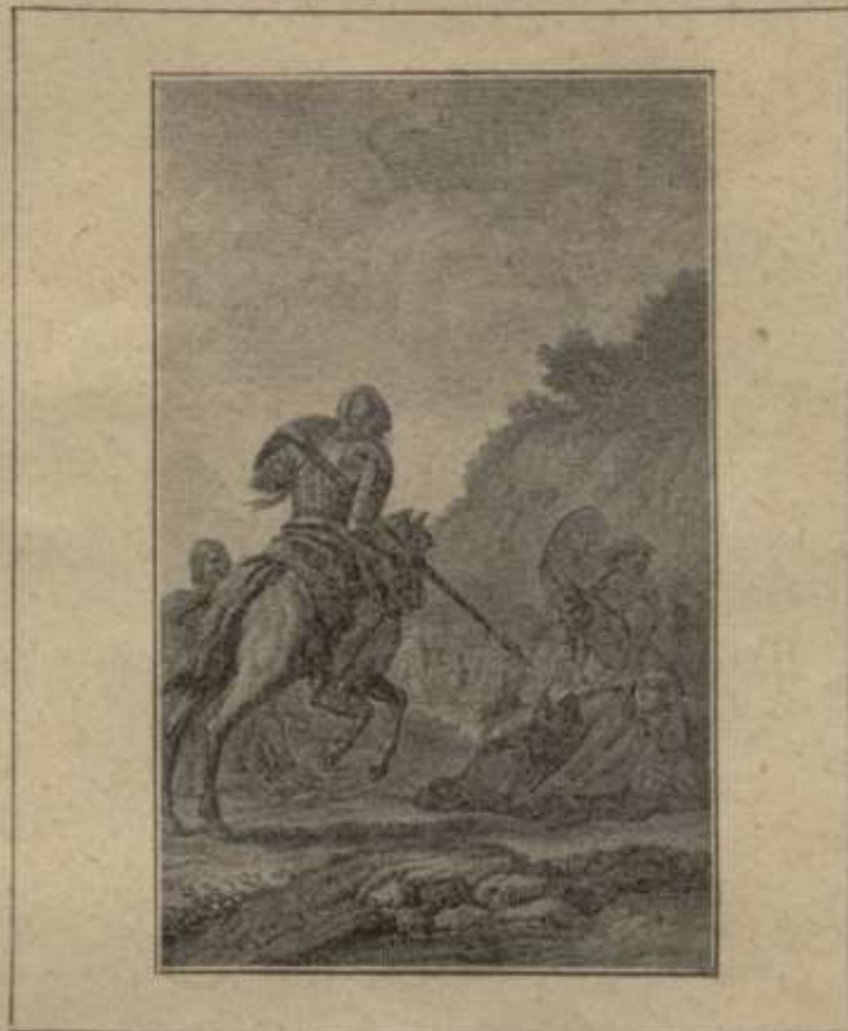
Aventura ab els frares de Sant Benet.—1. a part. Capítul VIII.—Dibuix de Masferrer.—Edició de Vda. y fills de Gorchs.—Barcelona, 1832.