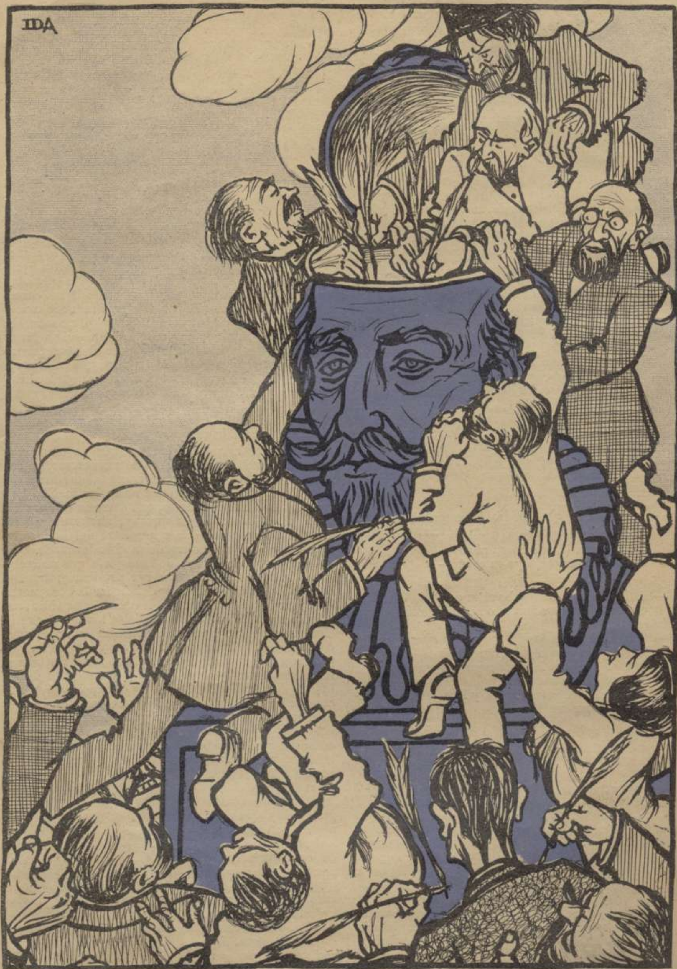
Un tinter ahont tothom hi suca.