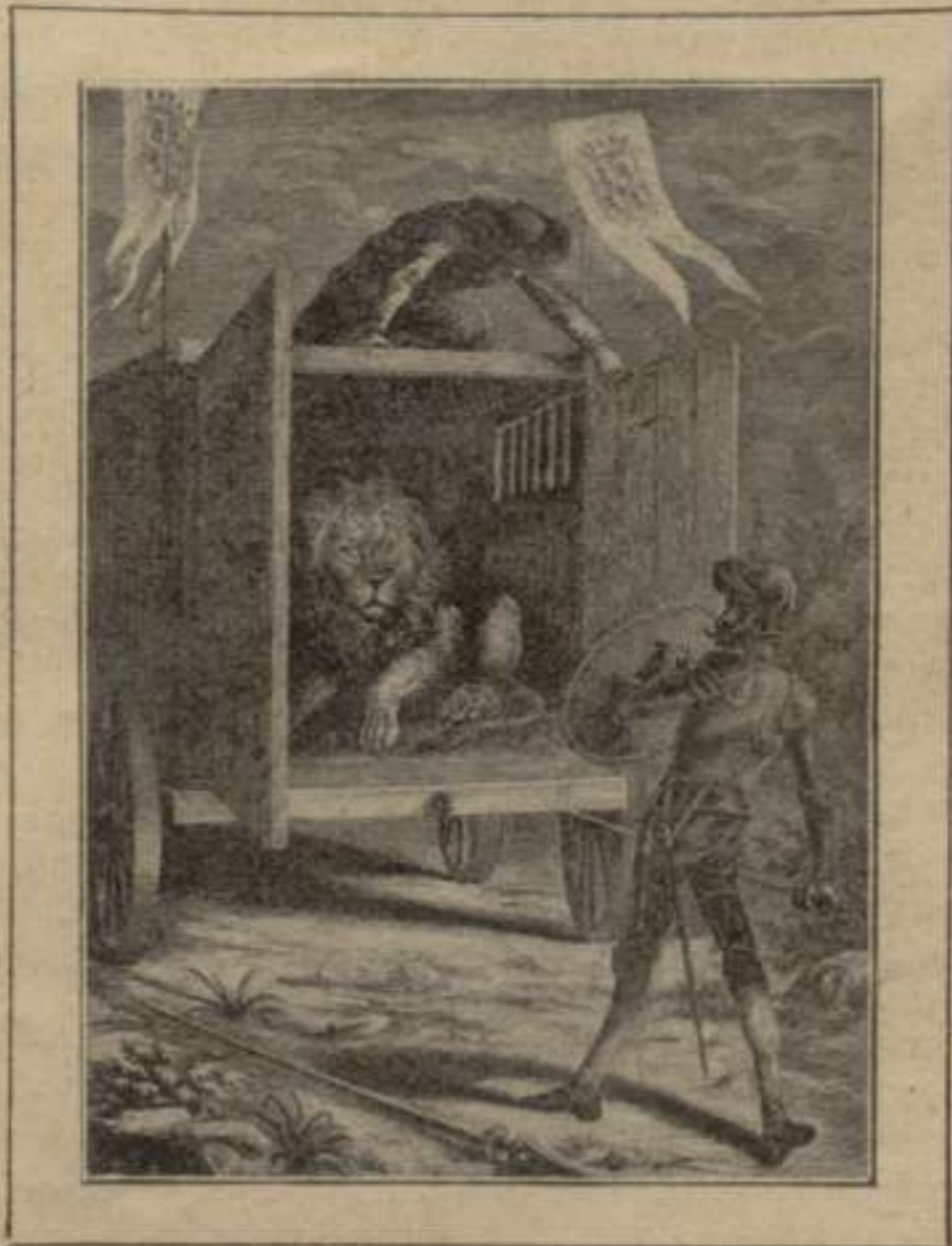
Aventura ab els Lleons.—2. a part. Cap. XVII.—Dibuix de Puiggari.—Edició de C. Miró.—Barcelona, 1884.