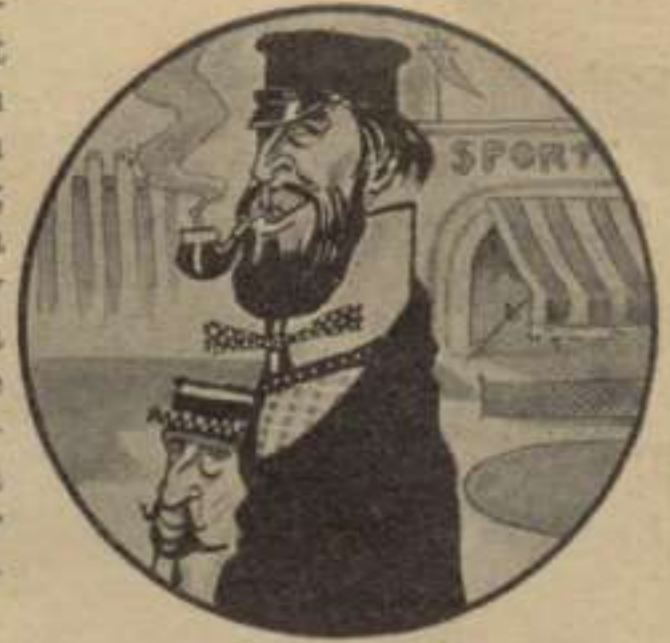
El Xanxo dels Sports.

Tot ha de ser plá, y seré, y encarrilat á la rutina en la nostra estimada terra, per no distreure als que vejetan, y no exaltar las passions, y remoure els entusiasmes; que quan domina el sufragi, el pecat més gran dels votants es pecar per idealisme. Las creencias han de ser conservadoras; creure lo que no pugui pertorbar; creure en un més enllá tranquil que no torbi ni destorbi una digestió serena. La societat te de ser mansa, una mena de estany humá, ahont