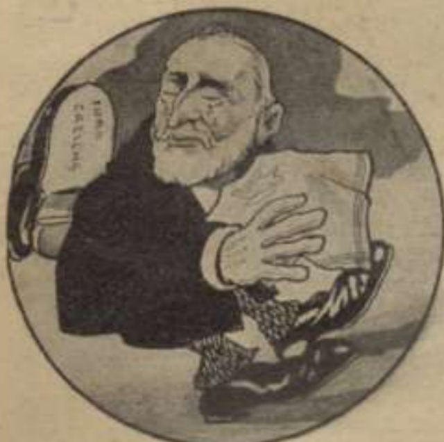
El Xanxo Pantorrillas.

Si 'ns haguessin dit que vindria un moment, qu' en un punt de aquella Espanya del Príncep dels Ingenis, arribaríam á anyorar els llibres de caballería, 'ns hauría semblat un somni.