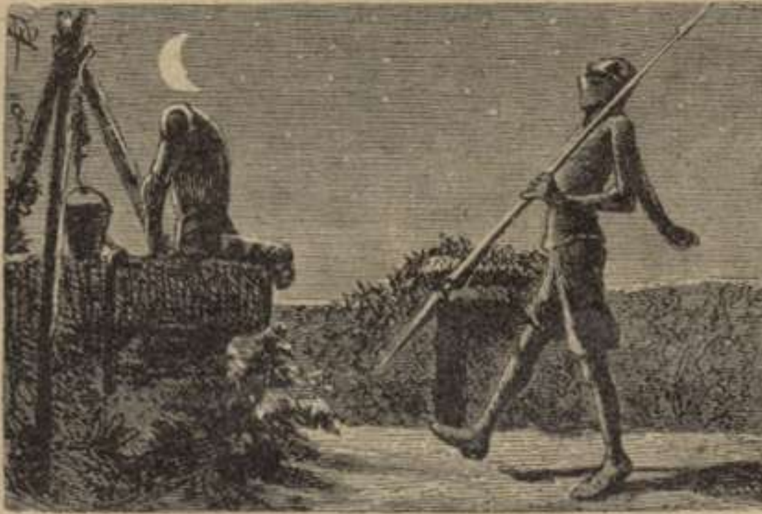
D. Quixot vetllant las armas.—1. a part. Cap. III.