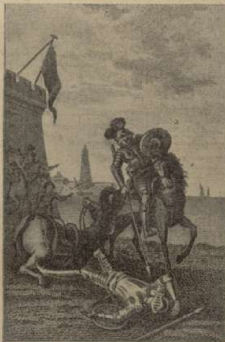
Segona Part.—Capítol LXIV.