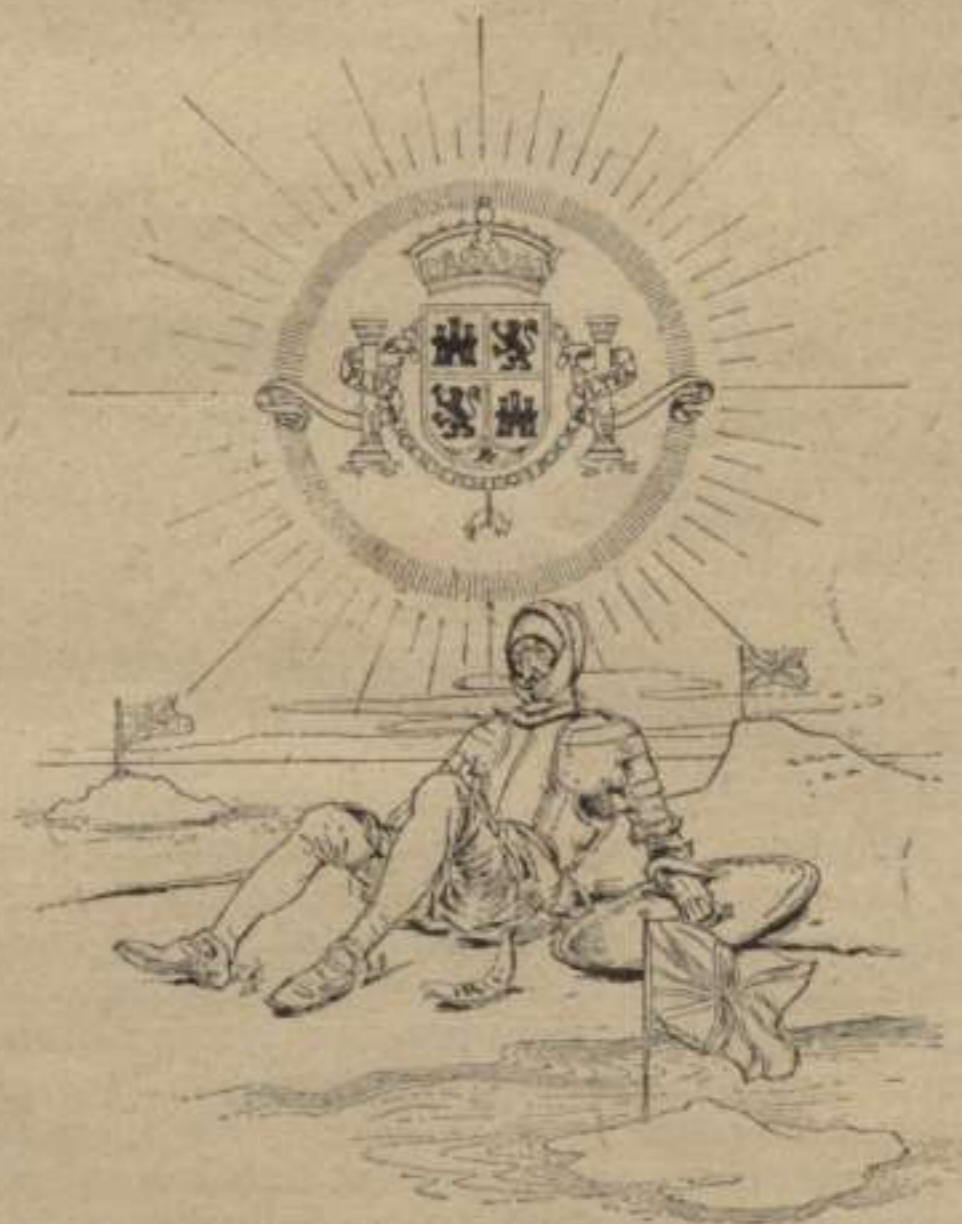
en la qual alianza se li repartirá 'l paper de Sabaté, "continuando nuestras gloriosas tradiciones."

qüenta, desde que vá tornar á Espanya en classe de repatriat, corria adelarat darrera de un destino del govern. Tots els castellans han fet sempre lo mateix. Y aquí está 'l quid de las sevas alabansas: el destino l' volia per Barcelona, terra explotable y tentadora com la que més ho sigui per las sangoneras del Estat. Per aixó 'l murri 'ns ensabonava, porque 'ns volia afeytar.