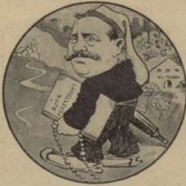
El Xanxo de la "Gent de bé".

Manxa una mica empipat:—¿Vos, potser? Cervantes va posarse á riure. —Ni vosaltres ni jo. ¡Infelissos!.. ¿Encare no coneixeu el temperament d' Espanya?.. Tot aixó de aquest centenari es una comedia insulsa que no significa res, ni tendeix á res, ni un cop representada ha de deixar al seu darrera 'l menor rastre. ¡Commemoració, apoteosis, homenatge nacional!.. ¡Paraulas, paraulas, paraulas!.. ¿Sabeu pera qué servirà tot aquest rebombori?.. Ja us ho diré. El Govern l'aprofitarà pera sostenirse uns quants días més, la premsa pera augmentar la tirada durant dos ó tres vespres, els escriptors per' exhibir la seva vanitat insuperable, las corporacions per' omplirse la casa de senyoras, y las senyoras pera lluhir el vestit nou y estrenar un barret ben alt y ben ample d' alas. ¡Vosaltres y jo, jo y vosaltres!.. A don Quixot y á Sanxo la gent s'ols coneix de nom, y en quant á Cervantes, ni de nom es apenas conegut. En aquest centenari, las nostras figuras no son més que pretextos, excusas, pantallas darrera de las quals s'hi amagan la frivolitat, la superbia, la ignorancia y las ganas de farolejar y de divertir-se. Ni més ni menos.