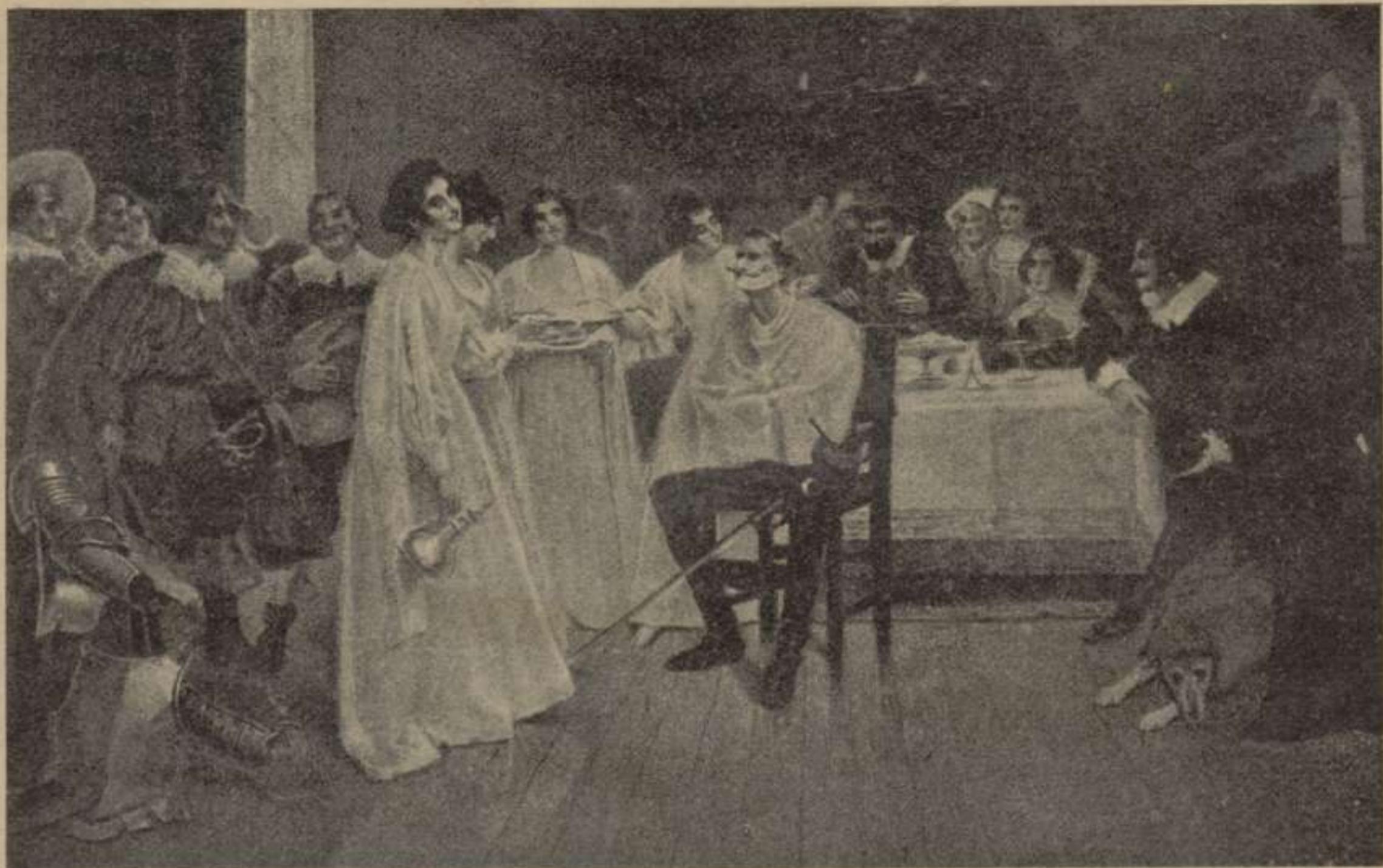
D. Quixot en casa dels Duchs.—Cromo de Laurcà Barrau.