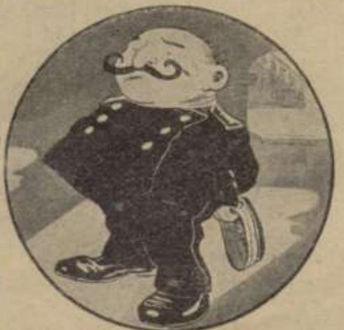
El Xanxo dels Xanxes.