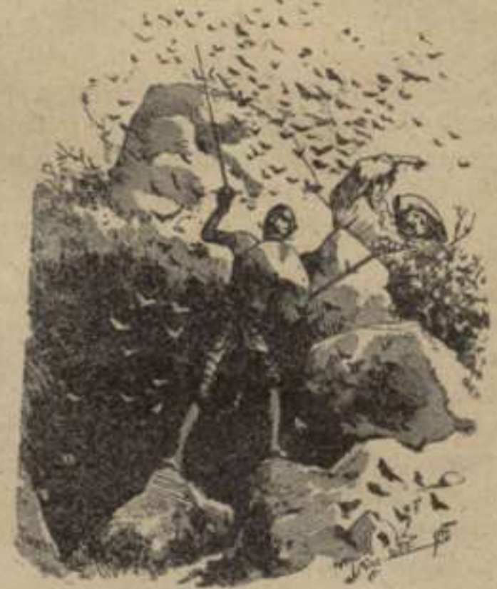
Baixada á la cova de Montesinos.—2. a part. Cap. XXII.