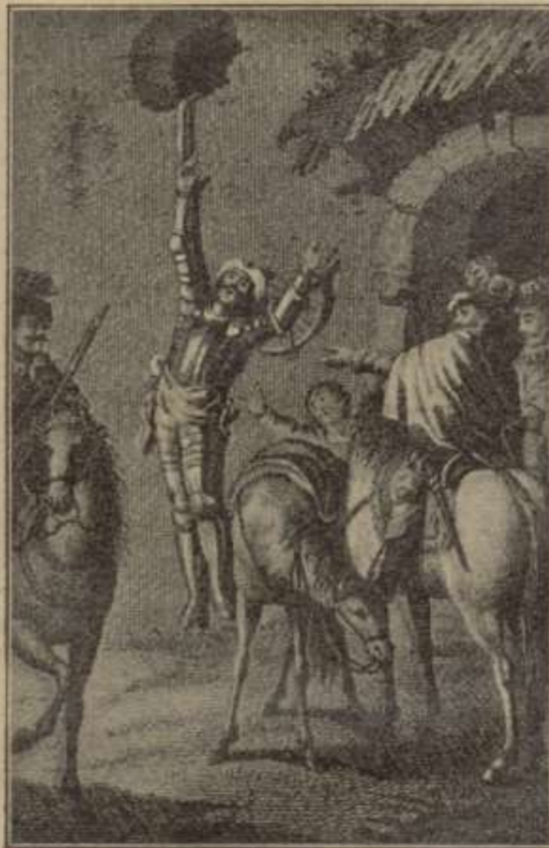
Primera Part.—Capítol XLIII.