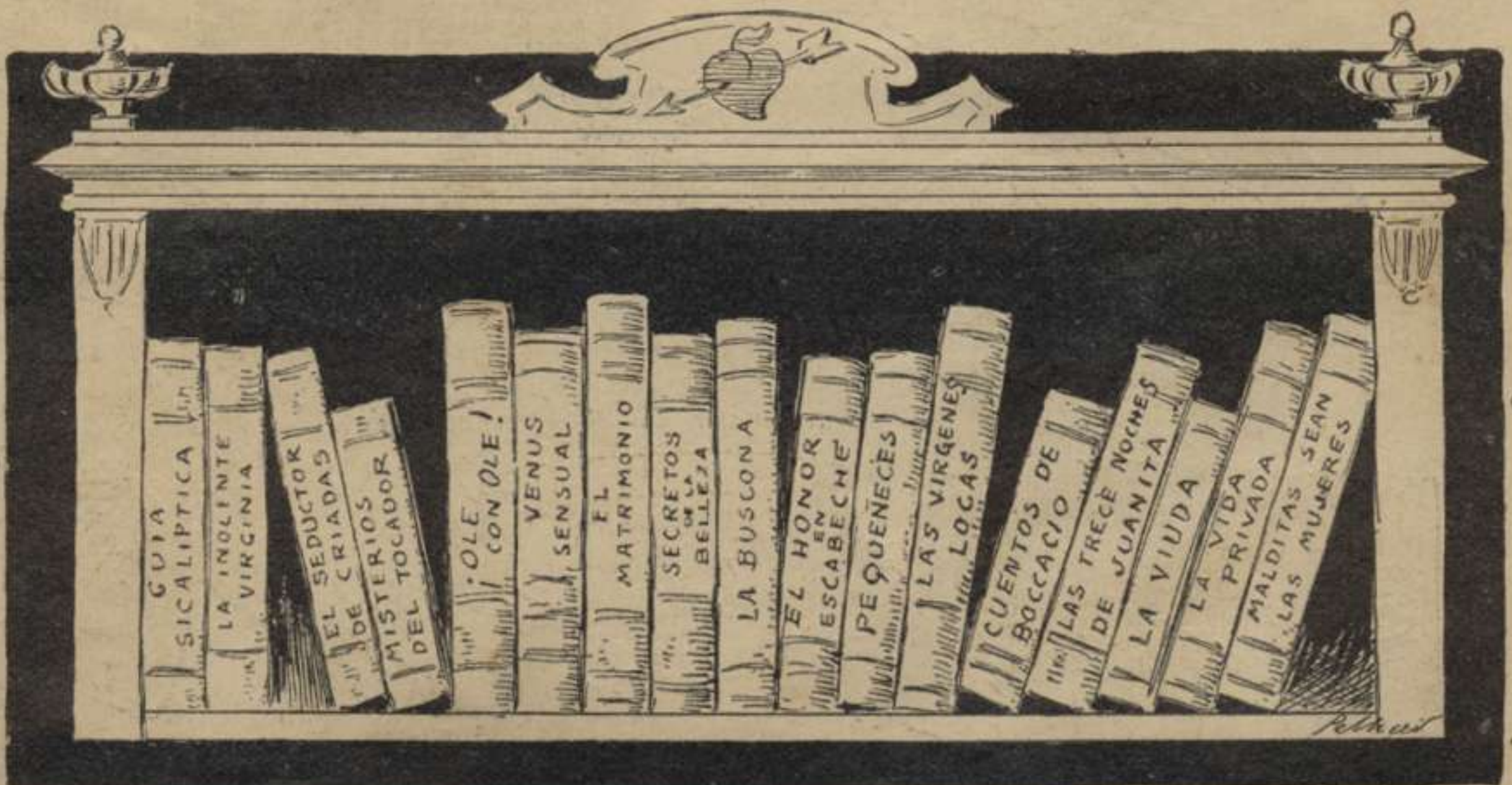
Lo que llegeixen els Quixots d' avuy.

puig no soch interessat. Traballo per vostra gloria, Sols per mon humil treball vull que vostras plantas besin els que deslliuran mas mans. La gent me tindrà per ximple al veure que us aymo tant, y que poguent está á casa, com burgés content y fart, vaig pel món cercant miseria y alguns trompis esgarriats: tot per un dols esguard vostre y 'l bé de l' humanitat.» Dulcinea li contesta: «Sou un caballer com cal digne de que correspongui á una estimació tan gran. Es vritat que sou un ximple, pro un ximple tan especial