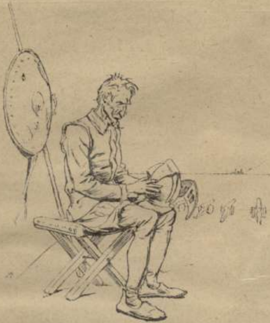
"D. Quijote" ja torna á encaparrarse ab l' armament.

Famosas caricatures de J. Lluís Pellicer, ab ocasió dels desastres colonials