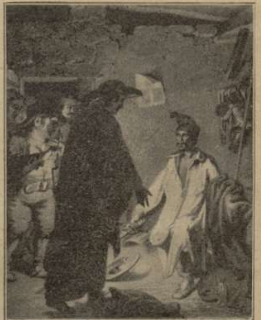
“Bien puede la vuestra grandeza, alta y hermosa señora...”—1.ª part. Capítulo XXXV.