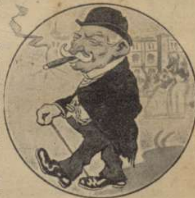
El Quixot de la Tauromaquia.