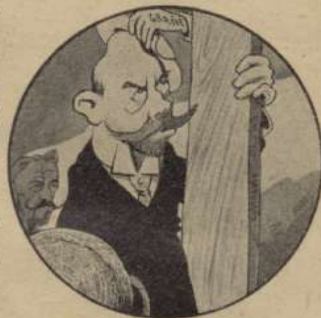
El Quixot Deixa-Taulóns.

—Donchs ¿qui es el que hi representarà?—objectá el de la