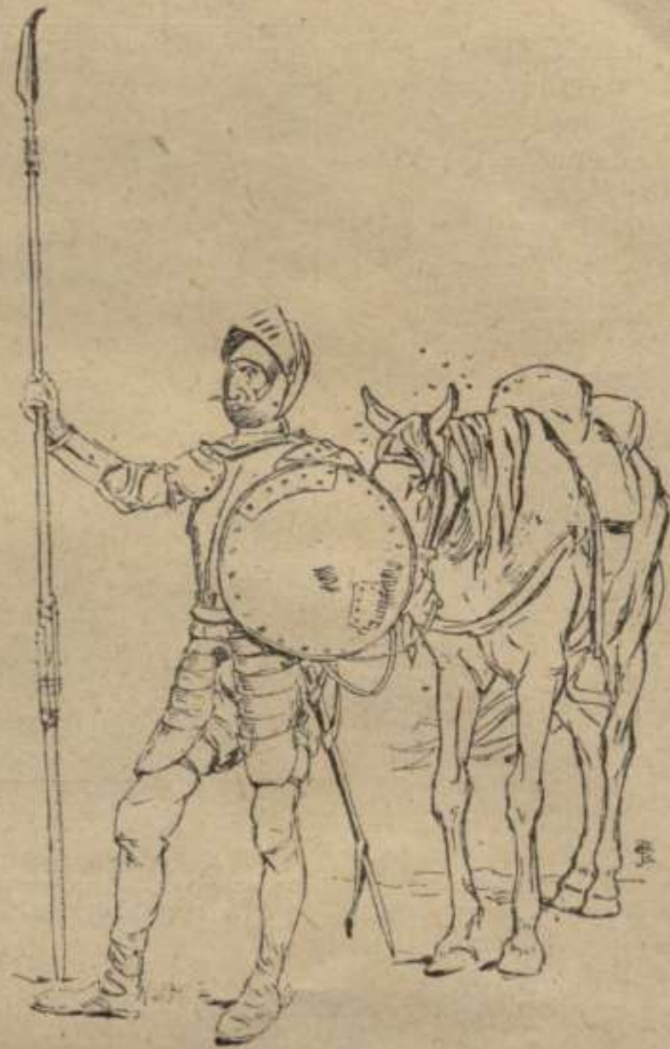
"D. Quijote" s' arma de nou "para poder figurar en la alianza continental contra Inglaterra."

—Prou; pero á la llegua 's veu que no ho feya pas per qué ho sentís, sino porque li convenia. A la