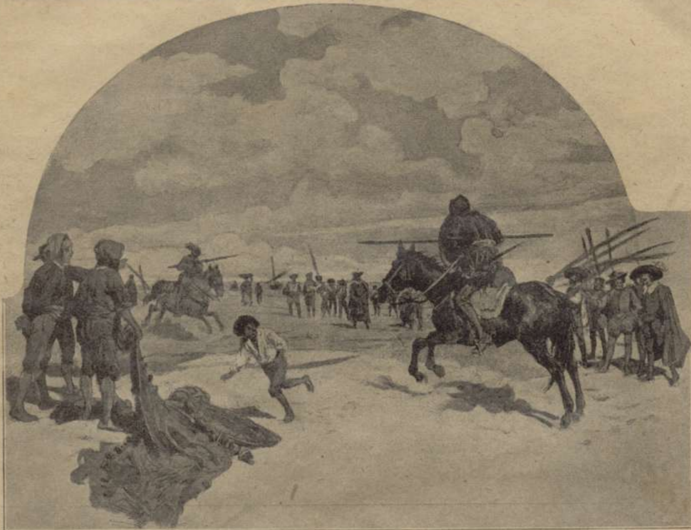
D. Quixot á Barcelona.—Singular combat ab el Caballer de la "Blanca-Luna". - 2.ª part. Cap. LXIV.

ARTISTAS CATALANS, ILUSTRADORS DEL QUIXOT. Dibuixos póstums de J. Lluís Pellicer