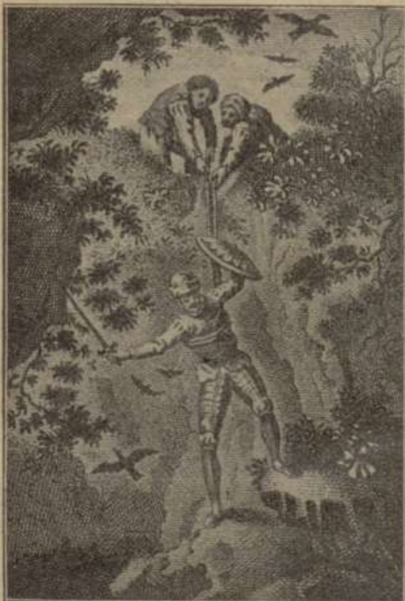
Segona Part.—Capítol XXII.