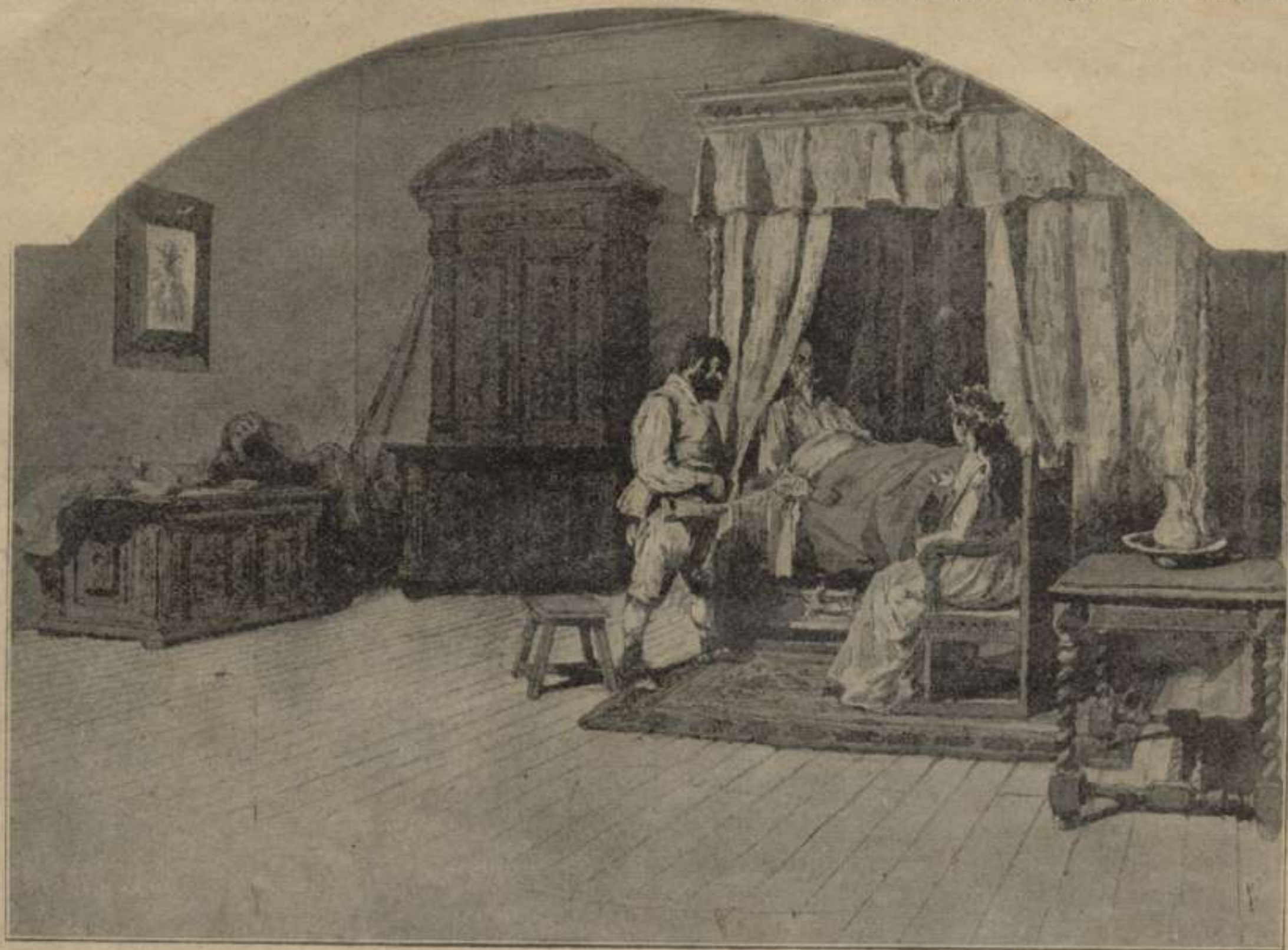
En el castell dels Duchs. L' epissodi de Altíssodora.—2. a part. Cap. LXX.

yan poca de por. Son zel d'apòstol l'encarrilà als mitins de propaganda, y allí no tingué reparo en declarar enemichs del poble, companys de causa dels microbis y butxins de la humanitat als comerciants que despatxan viandas adulteradas, als riehcs avars, als propietaris de fincas poch saludables y als industrials qu'exploitan als treballadors fentlos suhar la cansalada per un esquifit jornal. Tot seguit reculli 'l fruyt de tan santa doctrina. Sospitant el seu amo que era alló una alusió á las traficás y creyentse bescantat, entregantli la mesada, va plantarlo al mitj del carrer sense més explicacions.