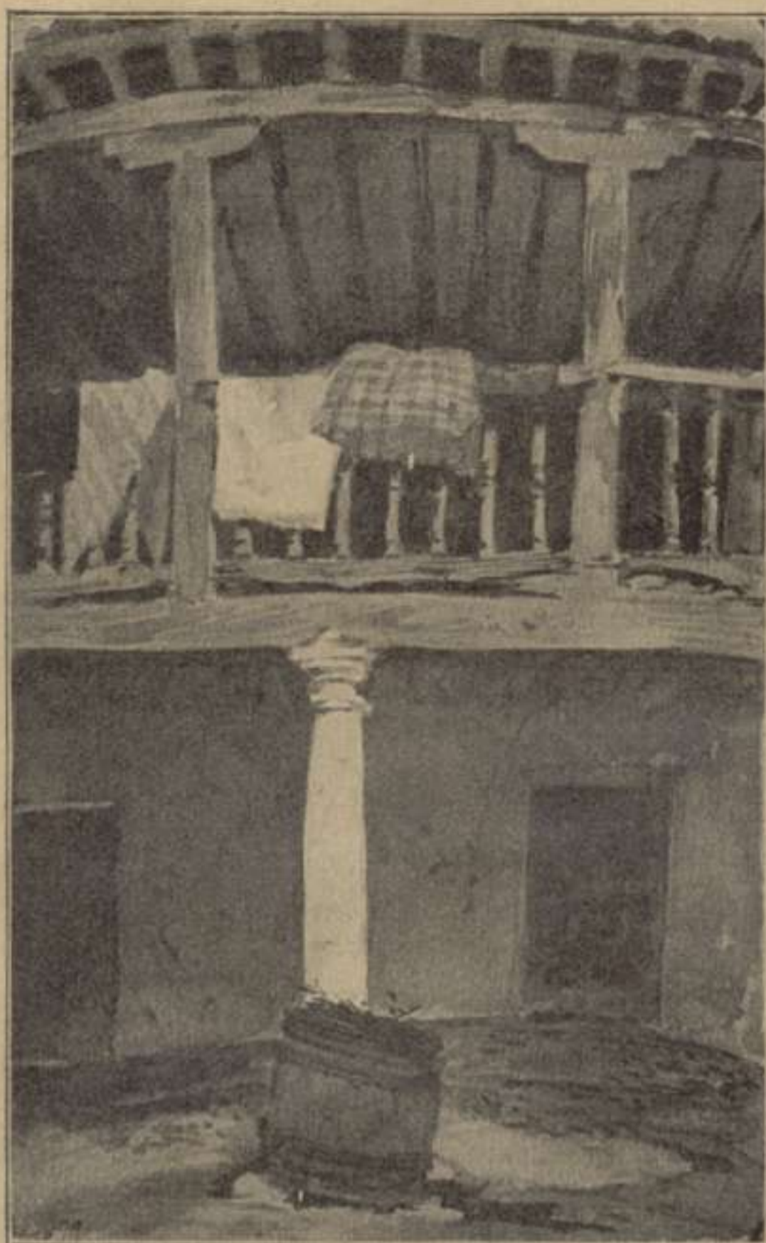
El Pati de la Casa de Medrano. (Argamassilla de Alba).

(2) Dona interès als apuntes de la Casa de Medrano, el fet de haver desaparegut fa pocas senmanas l' edifici, devorat per un incendi.