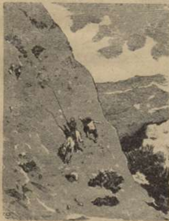
A través de Sierra Morena.—1. a part. Cap. XXIII.