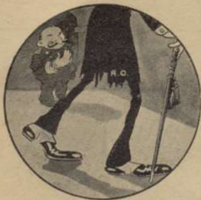
El Quixot de Real Ordre.

tan desusat estrépit venia á pertorbar la pau, durant tres cents anys no interrompuda, del petit cementiri?