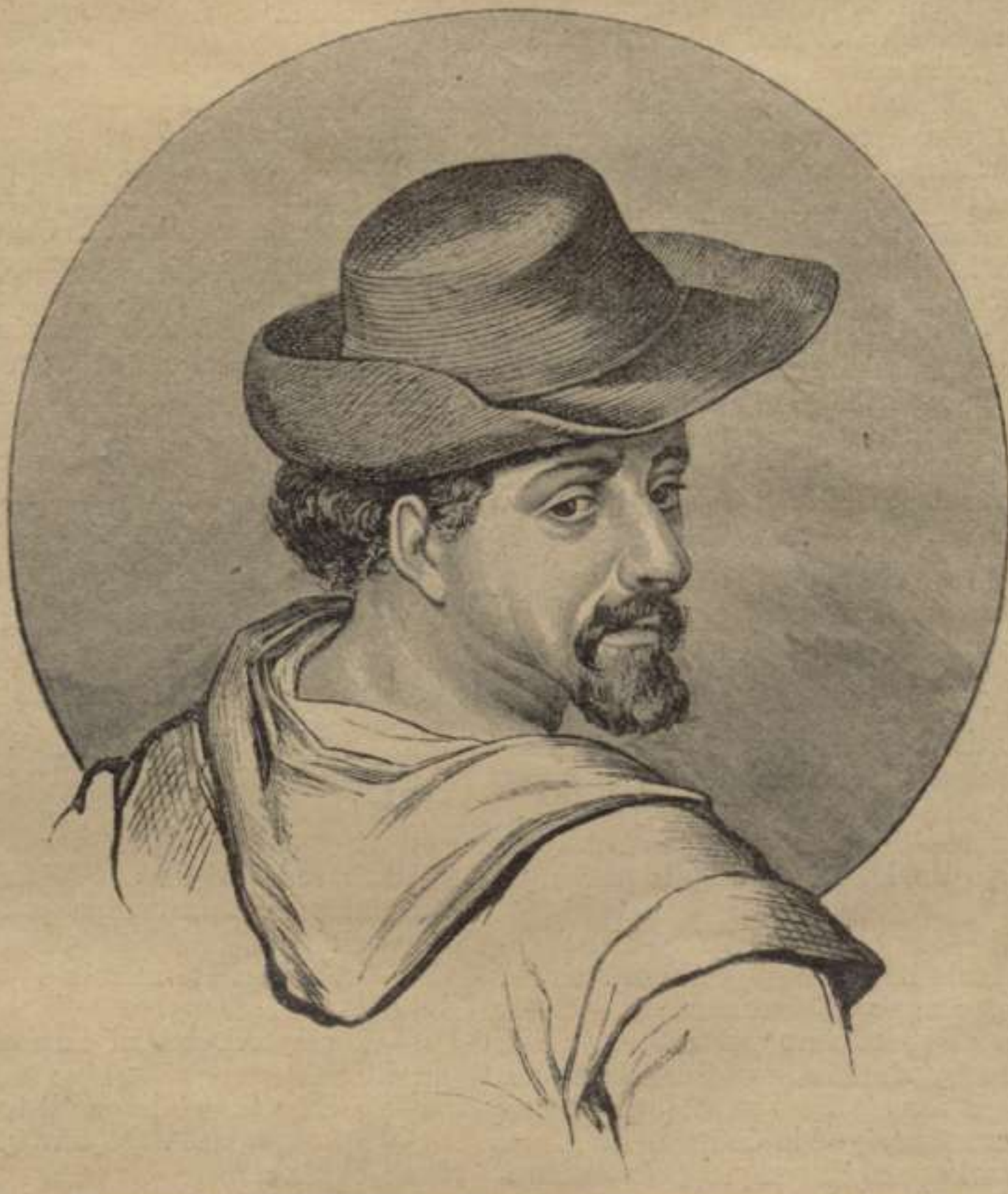
Retrato de CERVANTES, atribuhit al célebre pintor "Pacheco", y apreciat com el mes auténtich.

Eran molts els que, donantlo per mort fá prop de tres centurias, no comprenían com pogués fer acte de presencia personal aquí, á comensos del sigle xx, dat que 'ls grans progressos realisats en aquests últims temps, ab tot y sertan pasmosos, no han arribat encare fins al extrém de fer alsar als difunts dels seus sepulcres pera llansarlos de nou á las agitados corrents de la vida contemporánea. Ni per especial privilegi 's podía concebir que gosessin de aquesta maravillosa prerrogativa 'ls homes