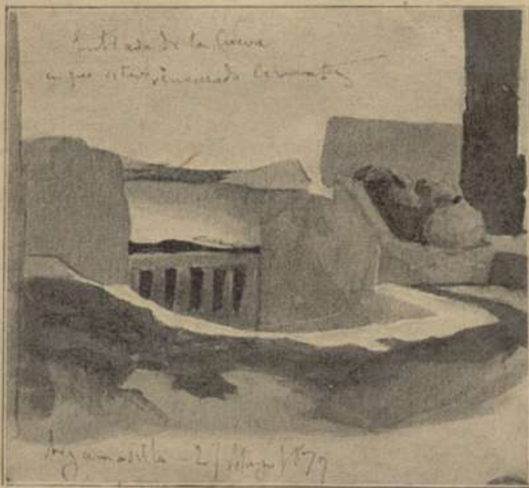
Entrada de la gruta hont se suposa qu' estigué pres Cervantes.

Soto, hont la tradició—ab molt bon sentit—vol que s' haguessin celebrat las bodas de Camatxo; aquí tens la cova de Montessinos, no ja com la degué veure Cervantes sino ab la boca tan esllavissada pels sigles qu' ara més que un pou, com devia ser altre temps, es un gran embut hont se baixa relativament bé per entre las pedras enderrocadas. Aquí tens els célebres batáns rompent la quietut d' aquesta vall hont jau desbordat el Guadiana; aquí hi ha el pastor que senyalantme las ruinas llunyanas d' un castell — de moros , naturalment!—va contarme que de nit Don Quijote hi anava á festejar ab la filla del rey moro, y que á la matinada, quan se 'n tornava, posava á Rocinante las ferraduras al revés pera despistar als que intentessin seguir sos passos. Perque has de saber que pel bon poble manxego—que no ha llegit, ni sentit llegir sisquera el Quijote — Don Quijote es l' héroe llegendarí per excelencia: es el Cid y el Tenorio á la vegada y ¡admira't! de vegadas fins en Serrallonga.