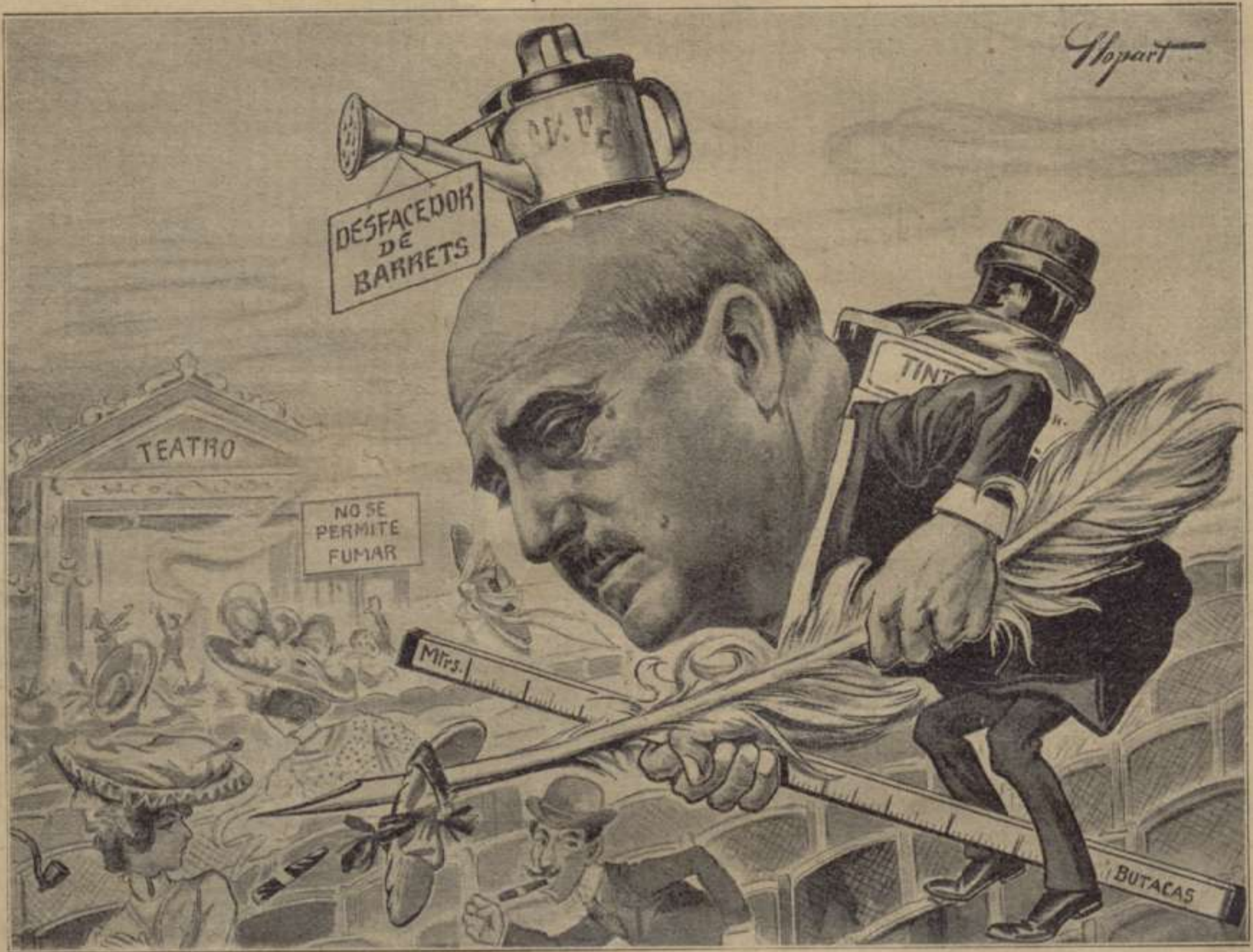
Pertretxat de ploma y metro, gastant, mes que tinta, humor, es de cómichs y empressaris el terror.

per las poéticas regions de la fantasía; son cor, sado-llat d'altruisme, cercava espay ahont esplayar sos nobles sentiments, y la pobresa y la desgracia l'tenian empresonat com un mal-factor!