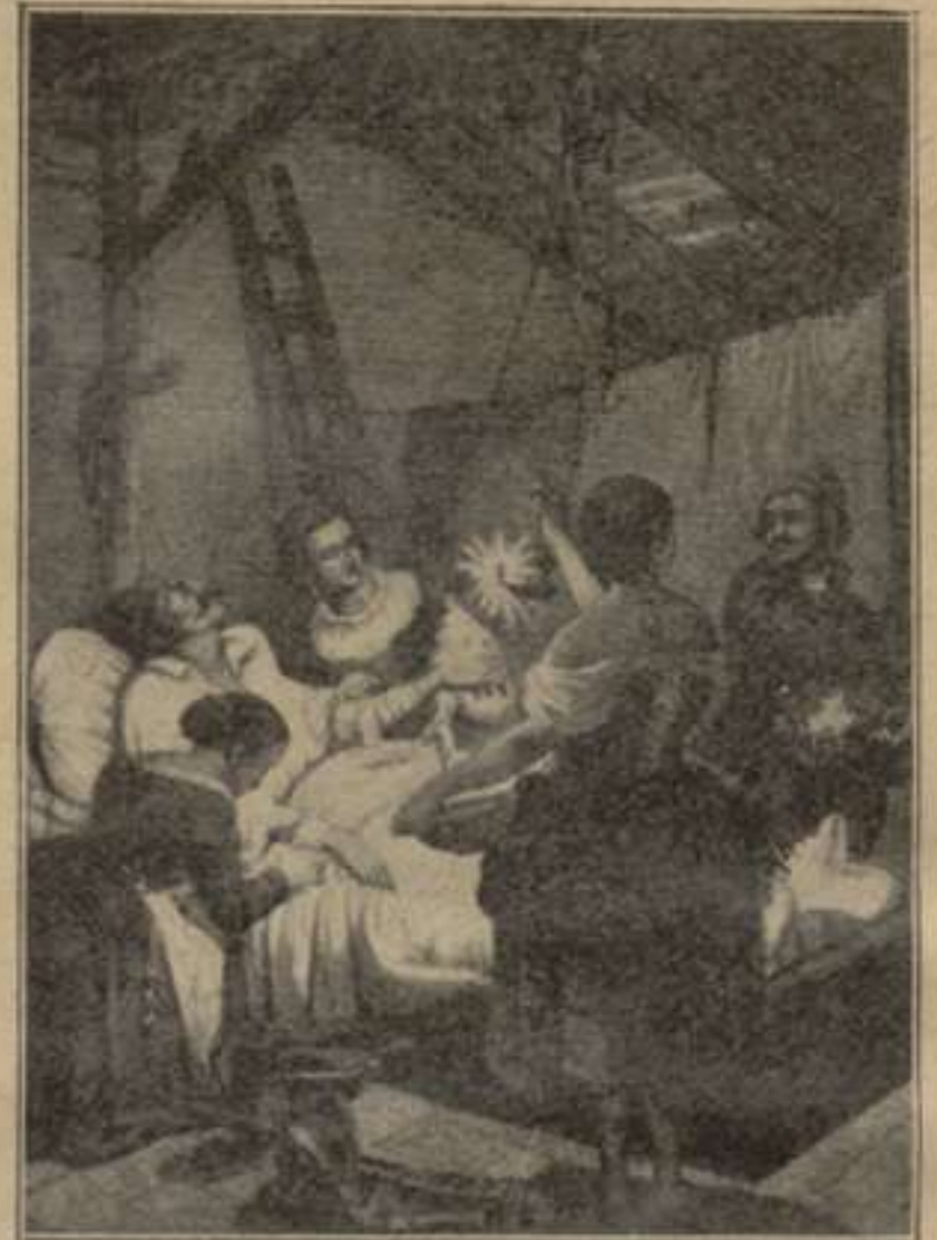
“La ventera y su hija le emplastaron de arriba abajo.”—1.ª part. Cap. XVI.