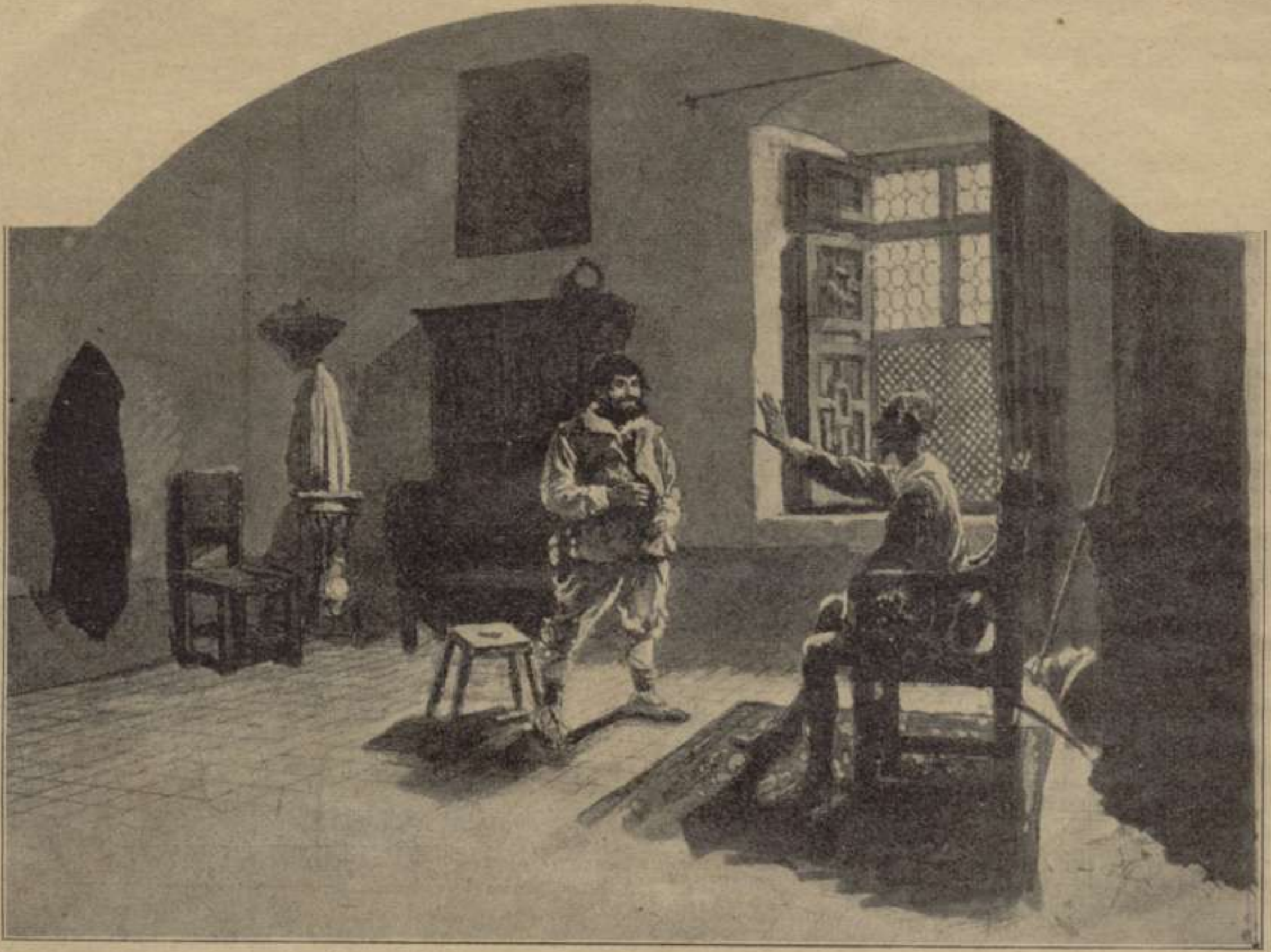
D. Quixot aconsellant a Sanxo Panxa, en vigílies de pendre possessió de l' Insula Baratària. - 2.ª part. Cap. XLII.

ARTISTAS CATALANS, ILUSTRADORS DEL QUIXOT.—Dibuixos póstums de J. Lluís Pellicer (*)