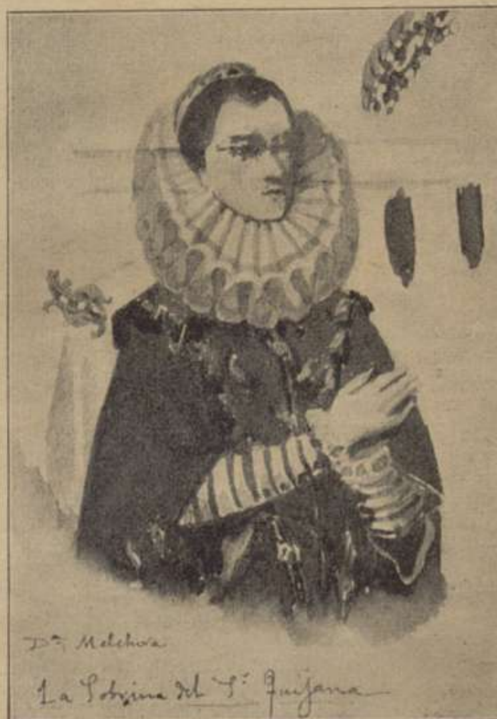
Els retrats de la Iglesia de Argamassilla de Alba.