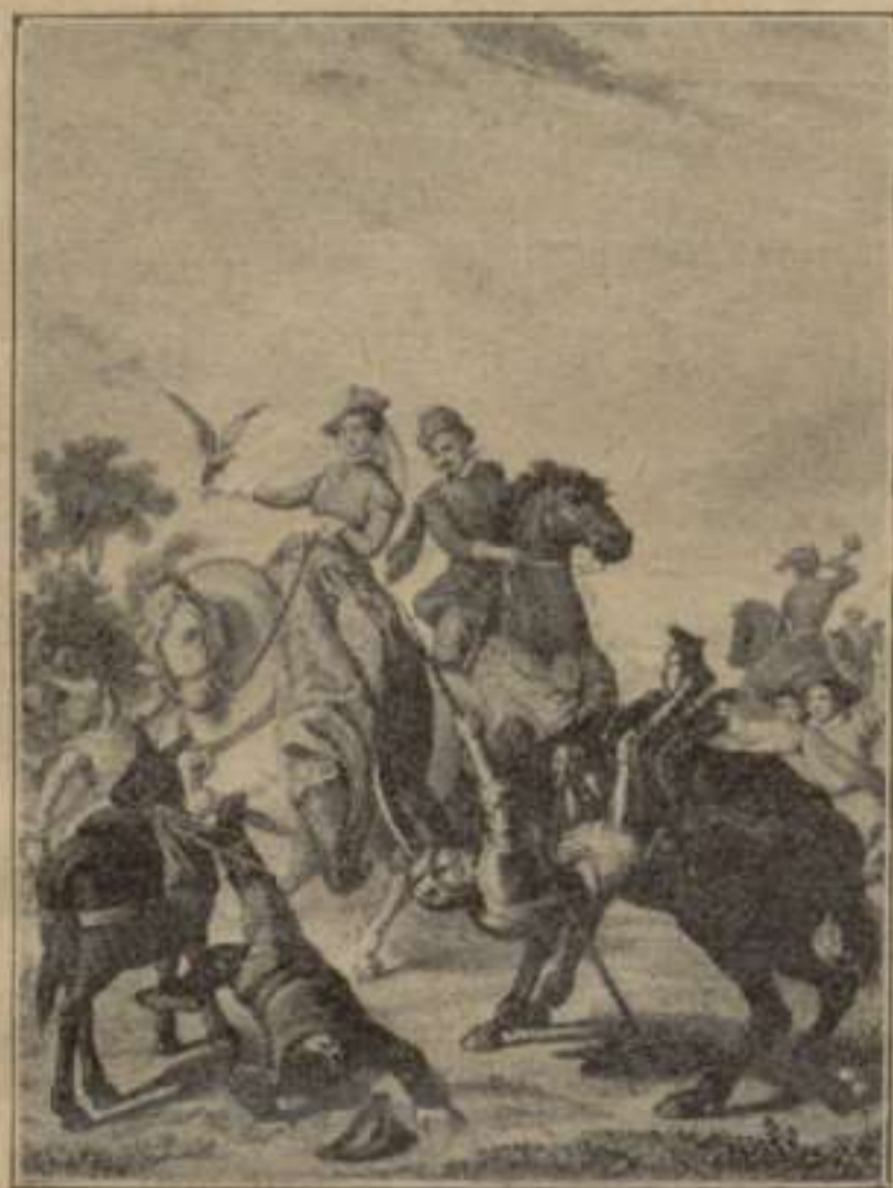
“D. Quijote y Sancho se vienen al suelo al aparse para saludar.”—2. a part. Cap. XXX.

(De l'edició monumental de T. Gorchs — Barcelona, 1863.)