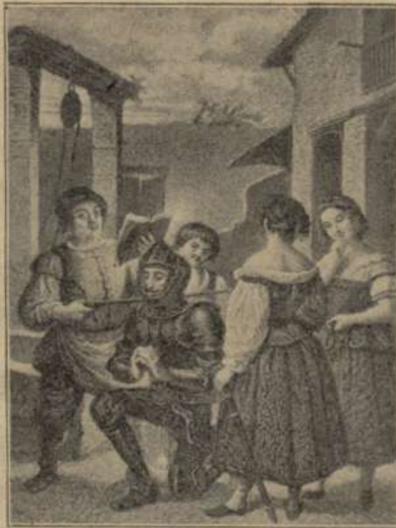
“Y dióle sobre el cuello un buen golpe, y tras él con su mesma espada un gentil espaldarazo.”—1.ª part. Cap. III.

(De l'edició monumental de T. Gorchs.—Barcelona, 1863.)