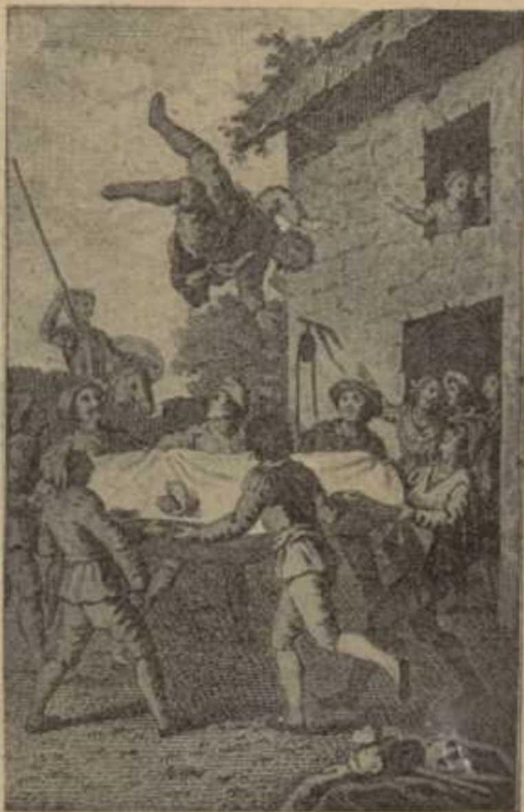
Primera Part.—Capítol XVII.

Il·lustracions de l'edició de SERRA y MARTI.—Barcelona, 1808