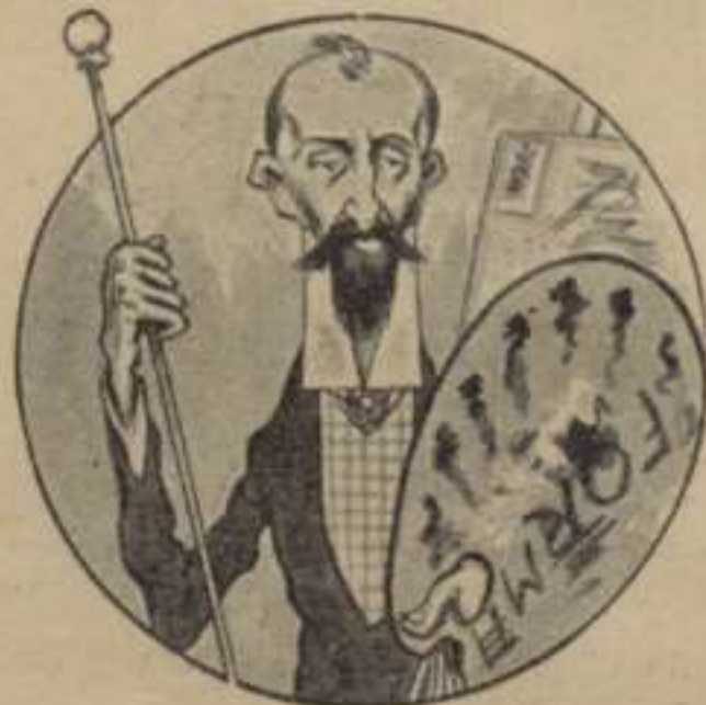
El Quixot del Art.

A l' altra part de la paret del cementiri, un home, en mitj d' un rotllo d' amichs, llegia en veu alta un diari. Desde allí se l' entenía perfectament.