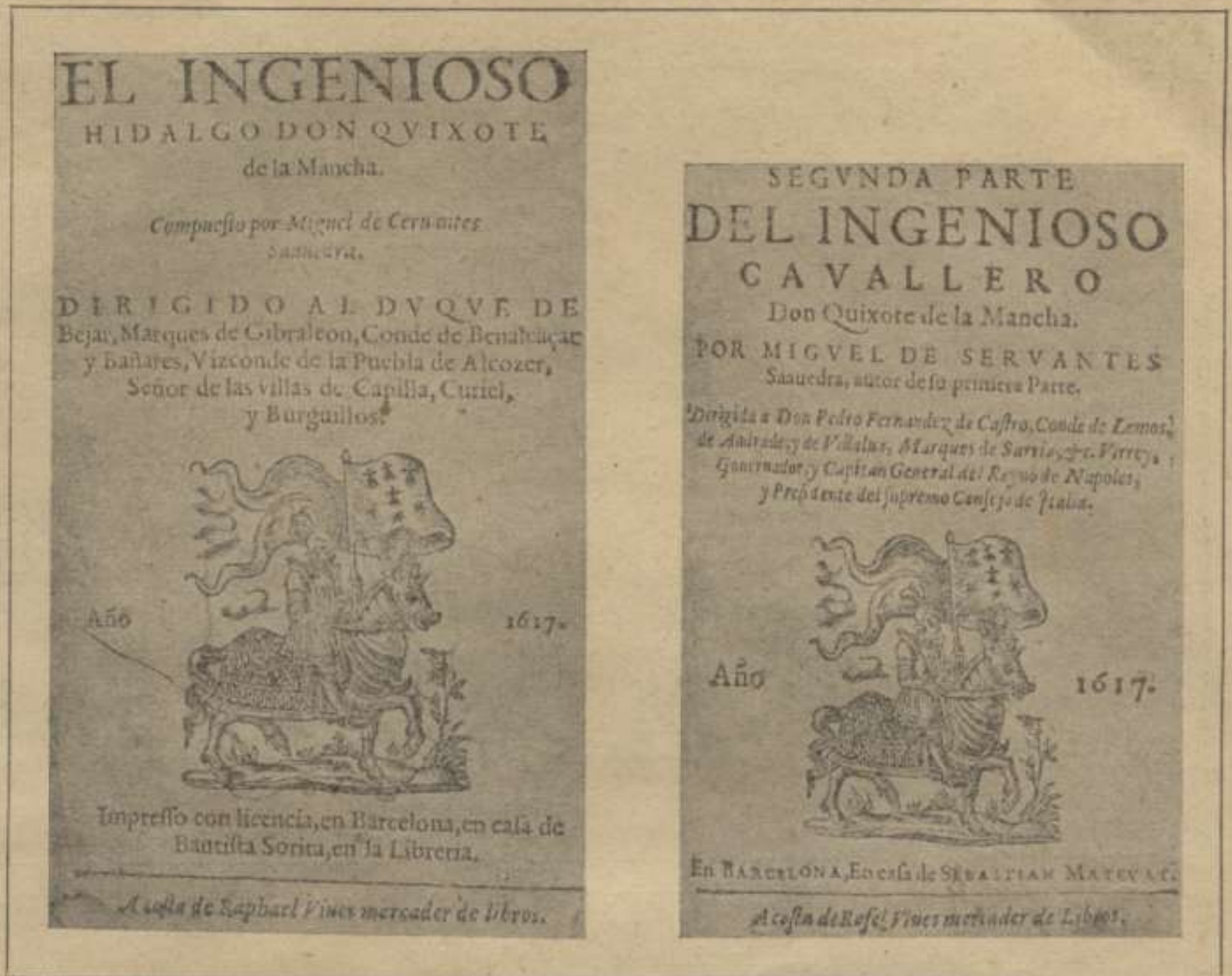
FACSIMILS del primer QUIXOT ILUSTRAT, estampat á Barcelona (*)