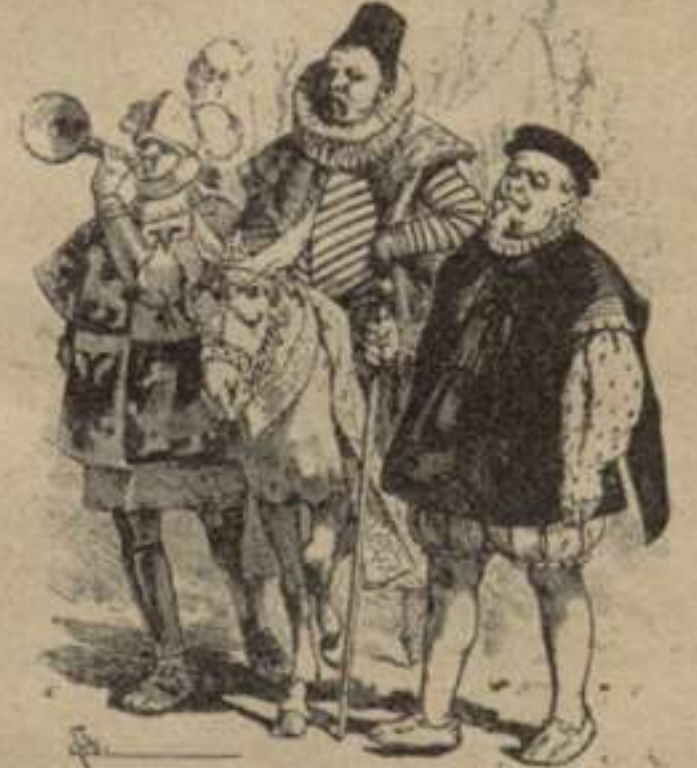
Sanxo Panxa, governador de la Insula Barataria.—2. a part. Cap. XLV.

ret pera poder observar de allí estant lo que passaria.