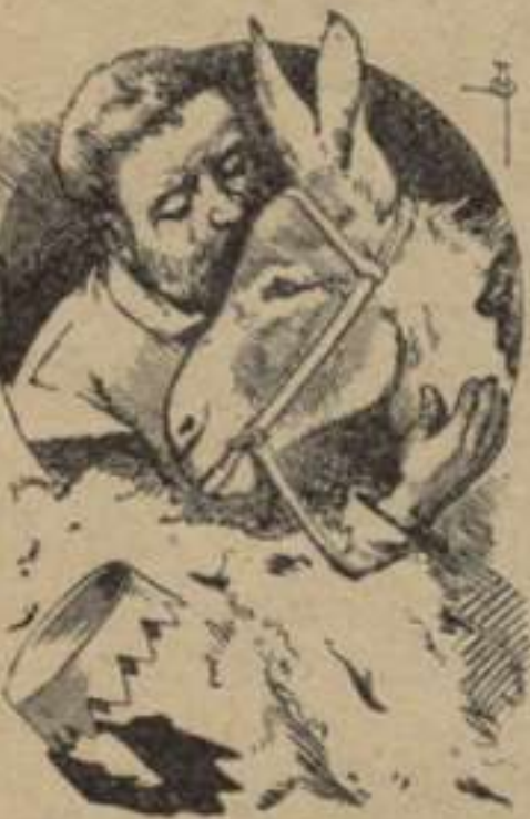
Enterniment de Sanxo Panxa.—1. a p. ta Cap. XXX.

Entraren Don Quixot y Sanxo Panxa al Cinematograf y 's posaren arrimats á la pa-