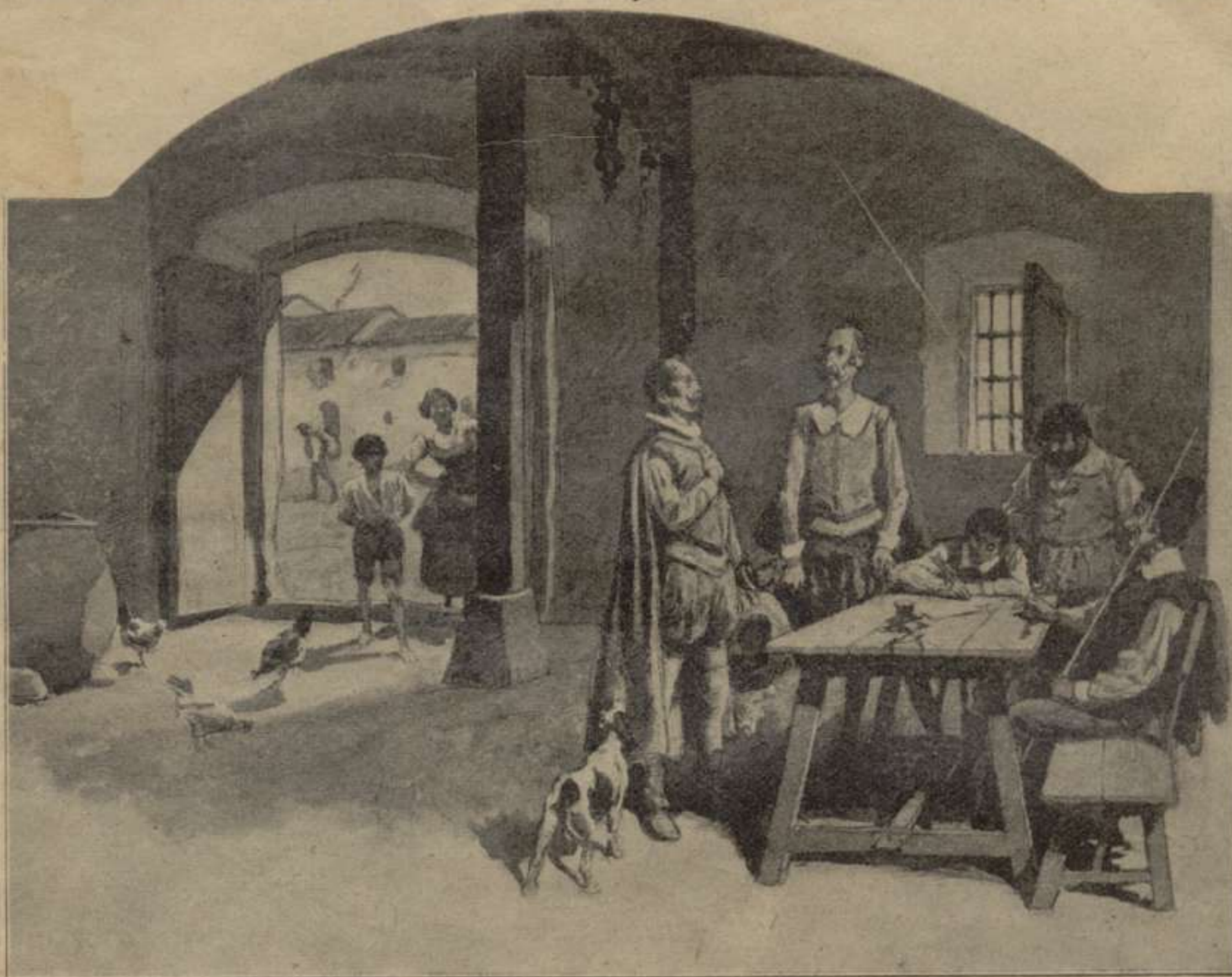
Declaració de D. Alvaro Tarfe, davant del arcalde, exigida per D. Quixot de la Manxa, al anar de retorn á casa seva. 2. a part. Cap. LXXII.