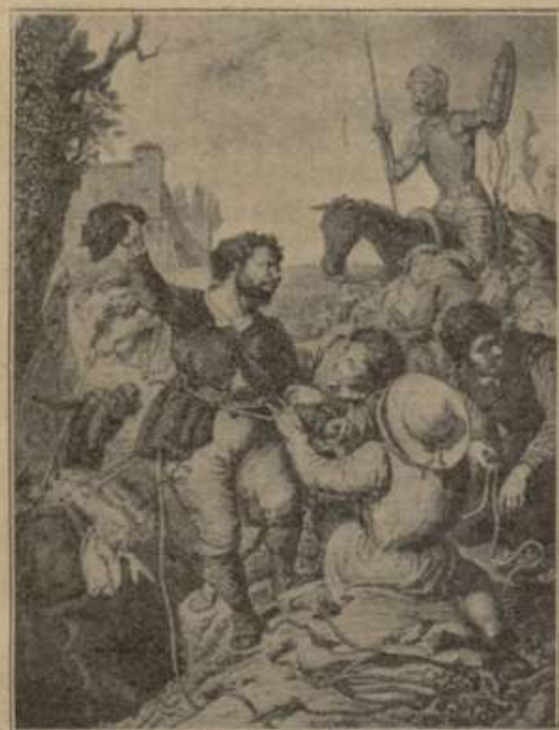
“Llevaron sogas y maromas y sacaron á Sancho Panza.”—2. a part. Capítul LV.