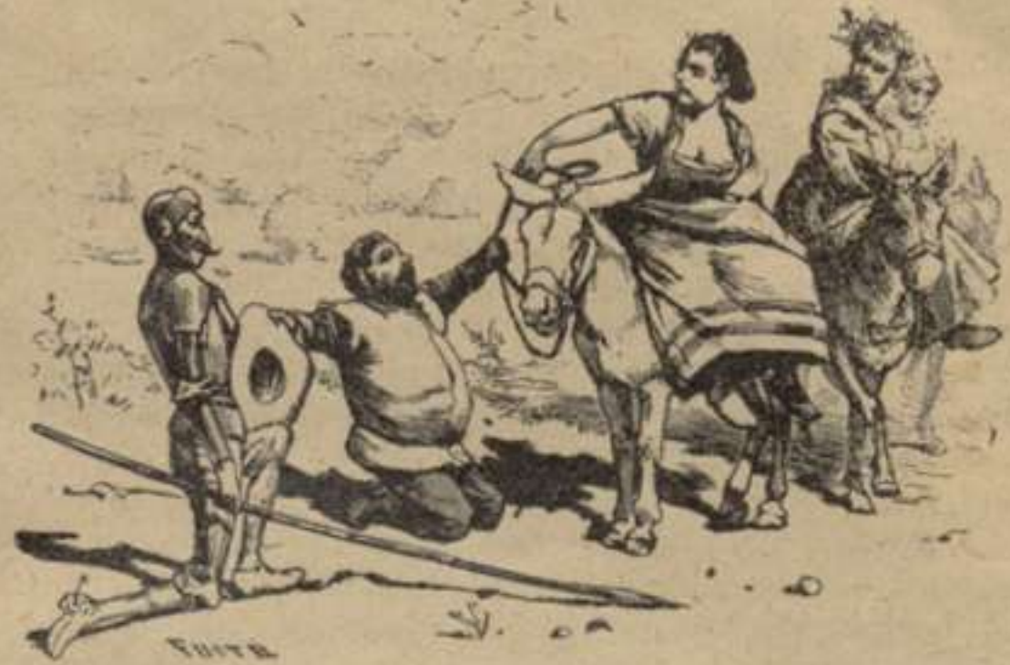
Reverenciant á las damas.—2. a part. Cap. X.