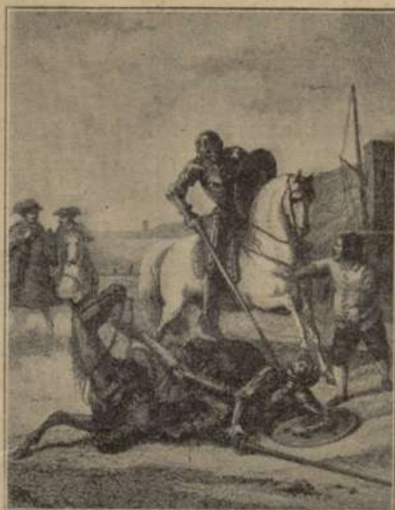
“Poniéndole la lanza sobre la visera, le dijo: —Vencido sois, caballero.”—2. a part. Cap. LXIV.