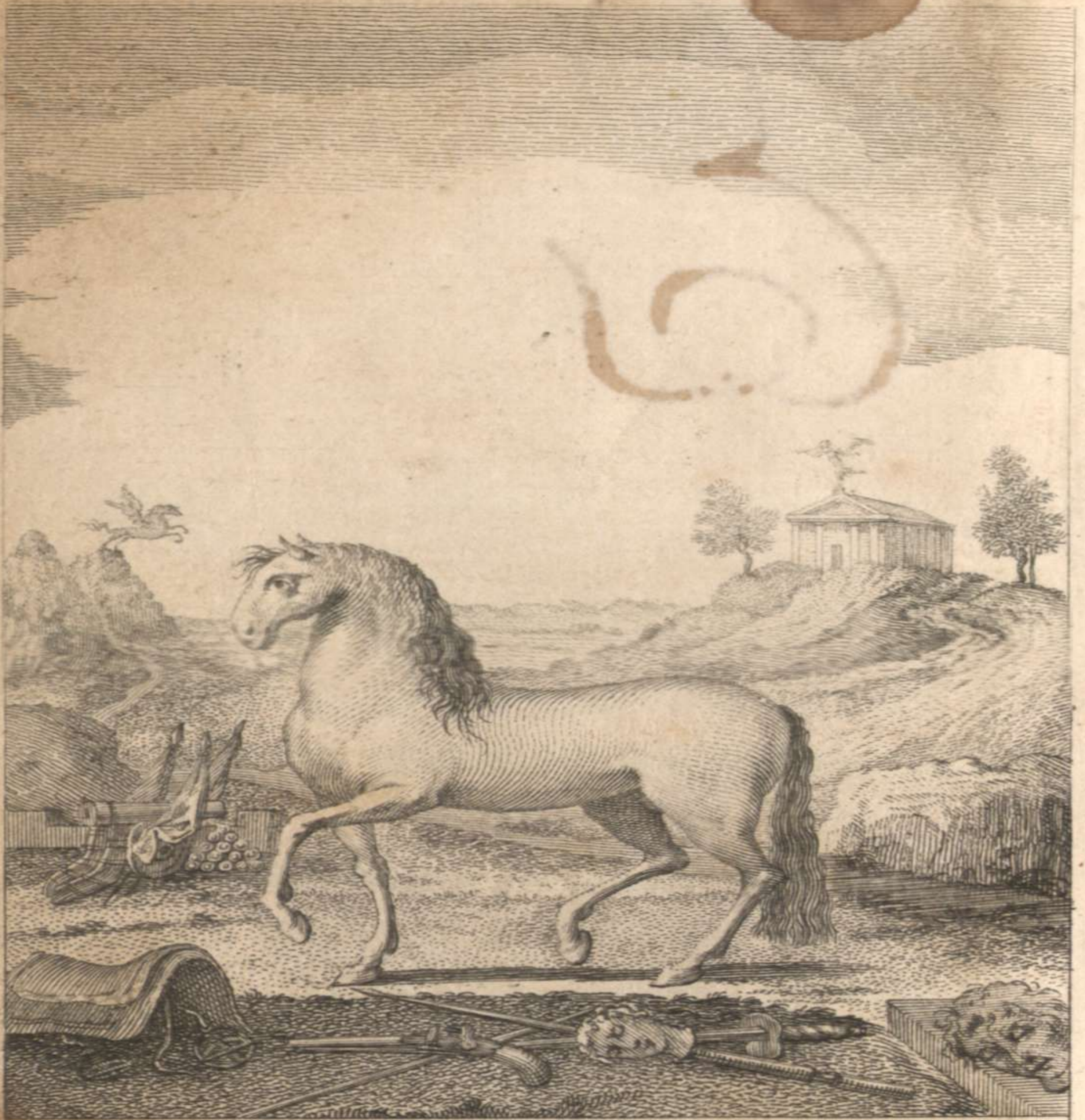
AD PUGNAM LUDUMQUE PARATUS