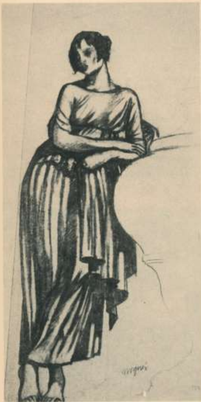
Figura femenina. Estudi per a la decoració de la casa Plandiura.