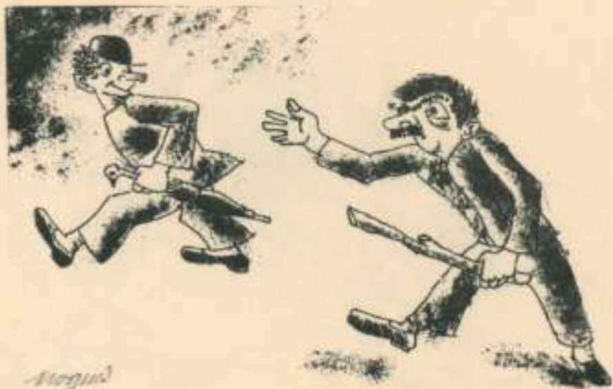
V. Home actiu amb garrot.