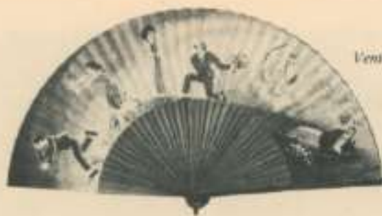
Ventall decorat cap a 1938.