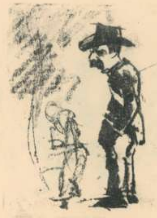
XXXVI Afeccionat al treball.