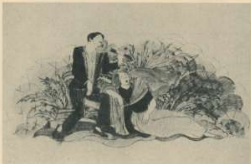
Dibuix preparatori per a la decoració d'un piano, entorn de 1940.