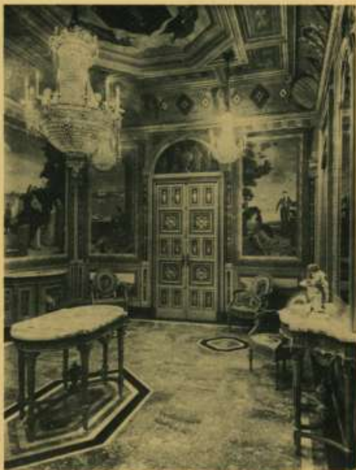
Sala de la casa Plandlura, decoració iniciada el 1917.