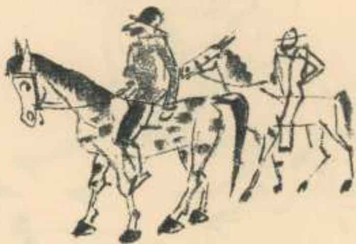
XXXII Dos cavallers.