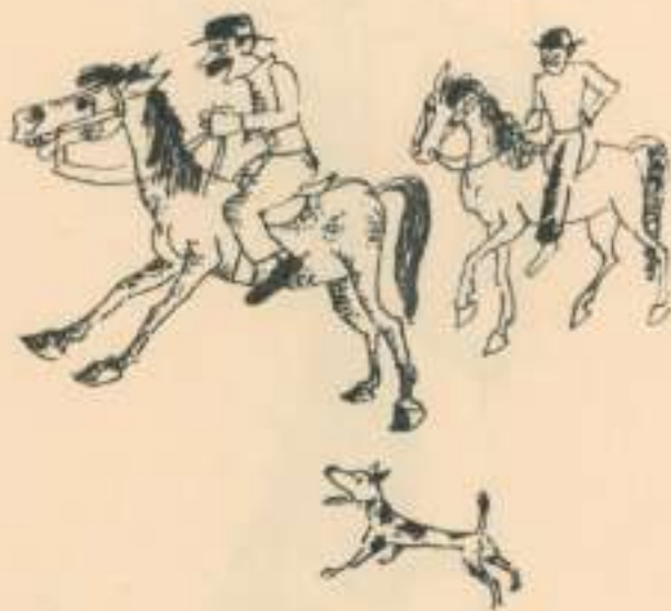
XLIII Dois cavaliers i un gos.