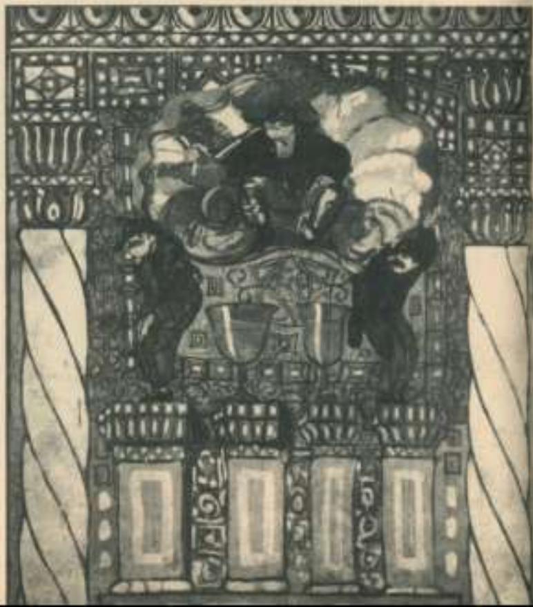
Detall del Celler de les Galeries Laietanes.