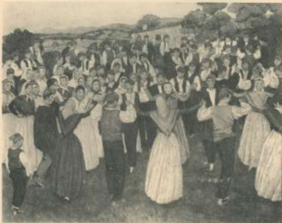
Sardanes a Banyoles. Oli sobre cartó, 1907.