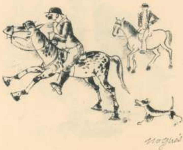
XIII Dos cavallers i un gos.