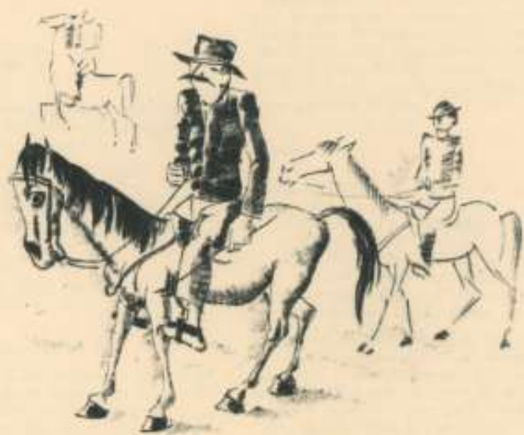
1 Tres cavallers.