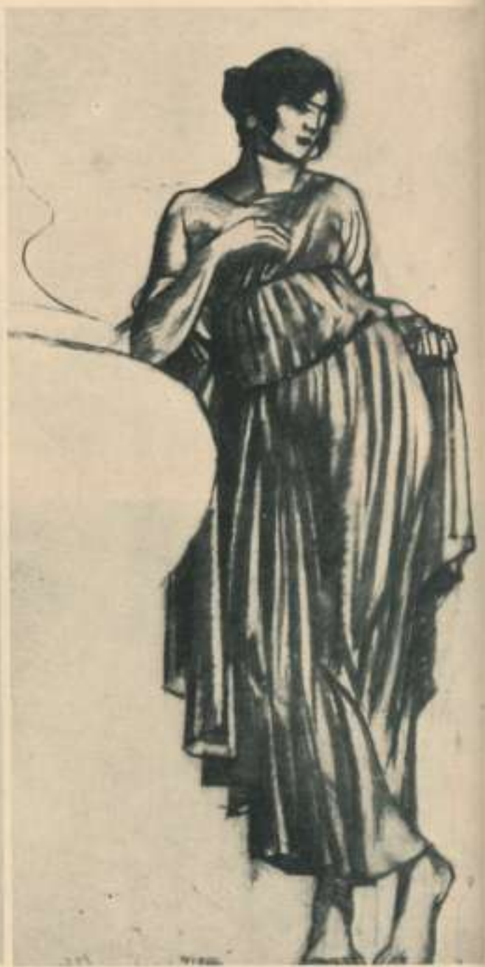
Figura femenina. Estudi destinat a la casa Plandiura.