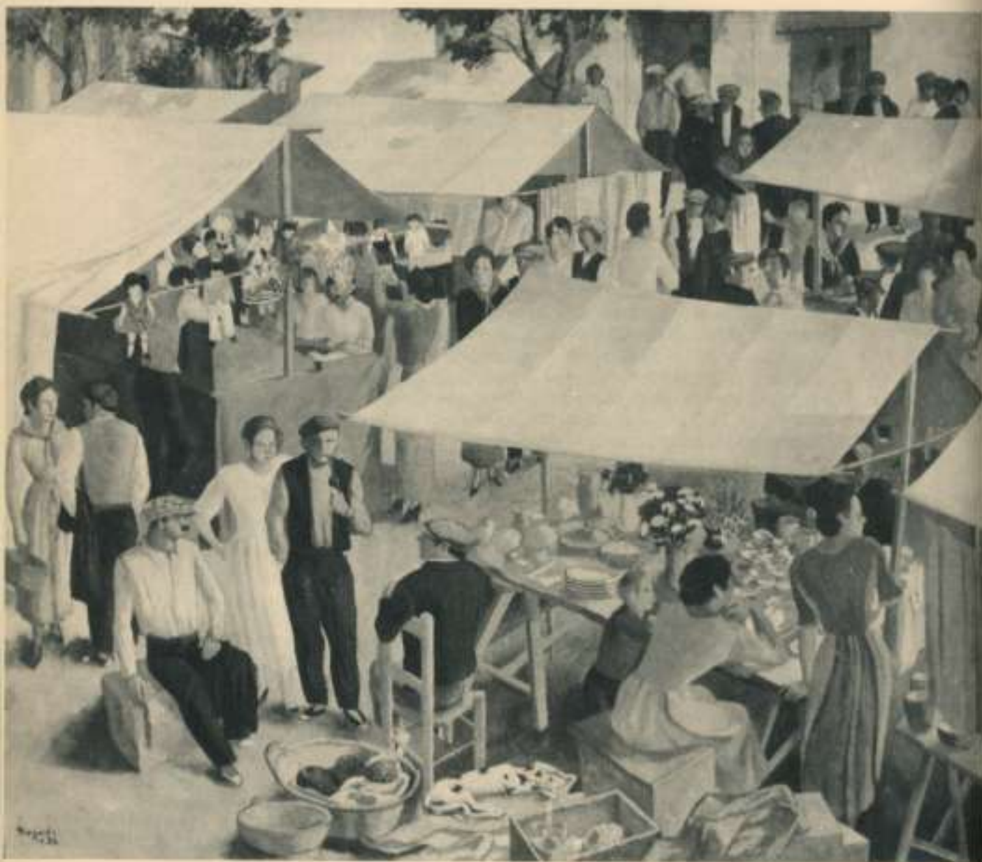
La fira d'Olot. Oli sobre tela de 1936