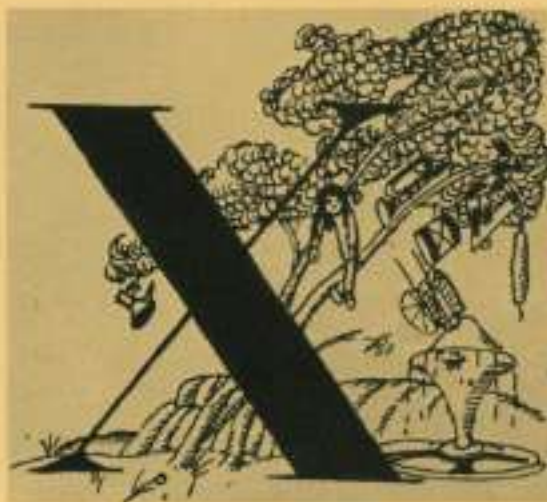
Variants de la lettre X. Dibuix.