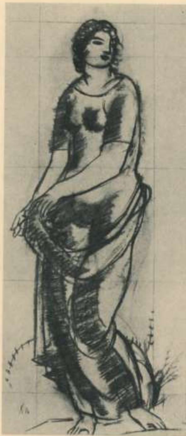
Figura femenina. Estudi per a la decoració de Can Culleret.