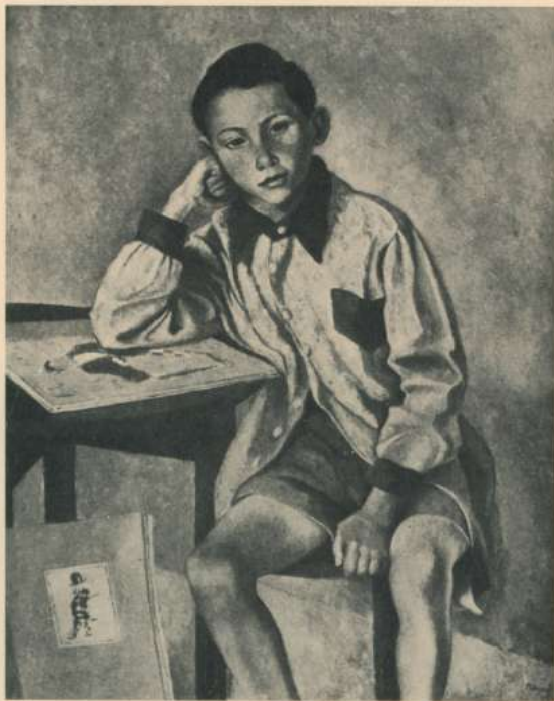
Noi amb bara blava. Olí de 1940.