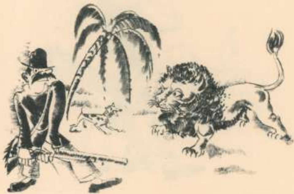
III Caçador de leons.