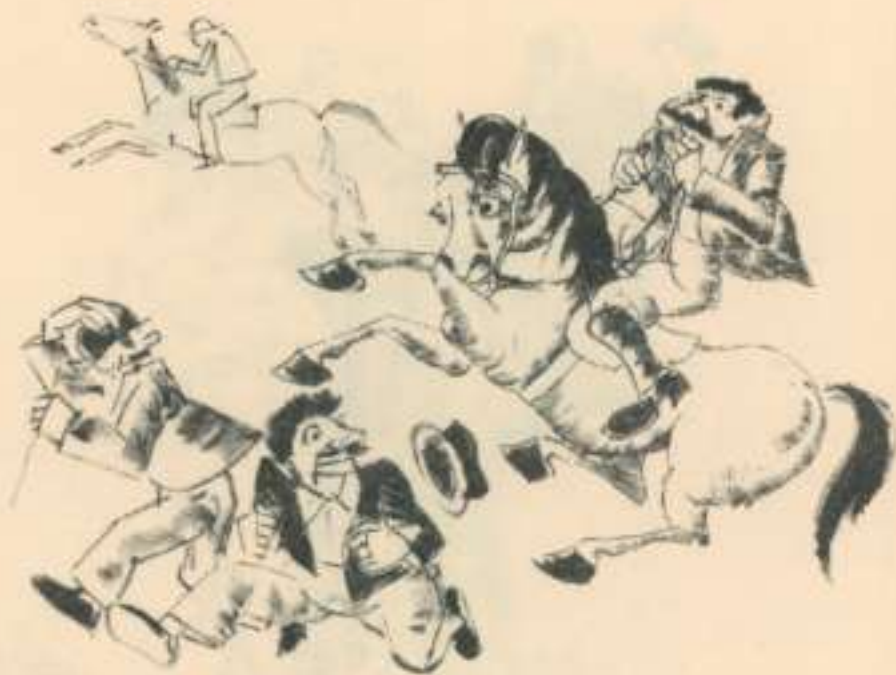
XVIII Un cavalier à dos que fugen.