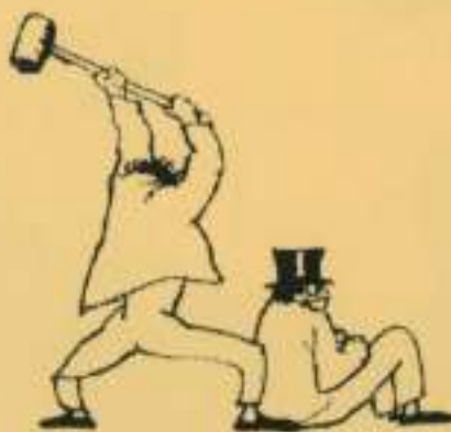
Dibuix per a un anunci.