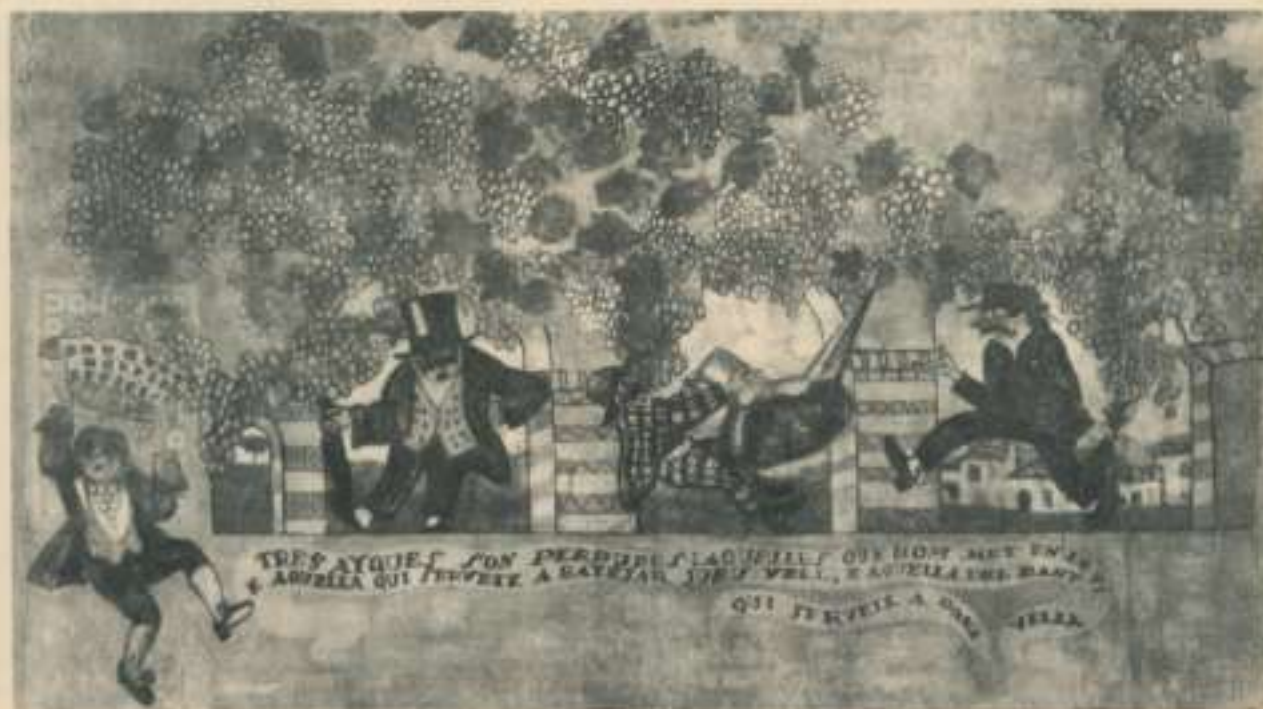
Un altre detall del manet Coller .

Va ser moderat, equilibrat, equànim, reflexiu, voluntariós (encara que el mot no el llegim al Fabra). Les seves mans, en principi no molt àgils, són disciplinades amb esforç per l'artista fins a fer amb elles el que vol. Intel·ligentment, sap escoltar i, quan convé, conversar, en veu baixa. Renyit amb qualsevol escola, arriba a ser un autodidacte d'ampla lectura i d'una curiositat intel·lectual sense límits. D'esperit religiós, però no practicant, s'interessa per la teologia i no deixa mai de banda els estudis filosòfics. I, contra el que afirma una duradora i estúpida llegenda de mandrós, és un treballador extraordinari.