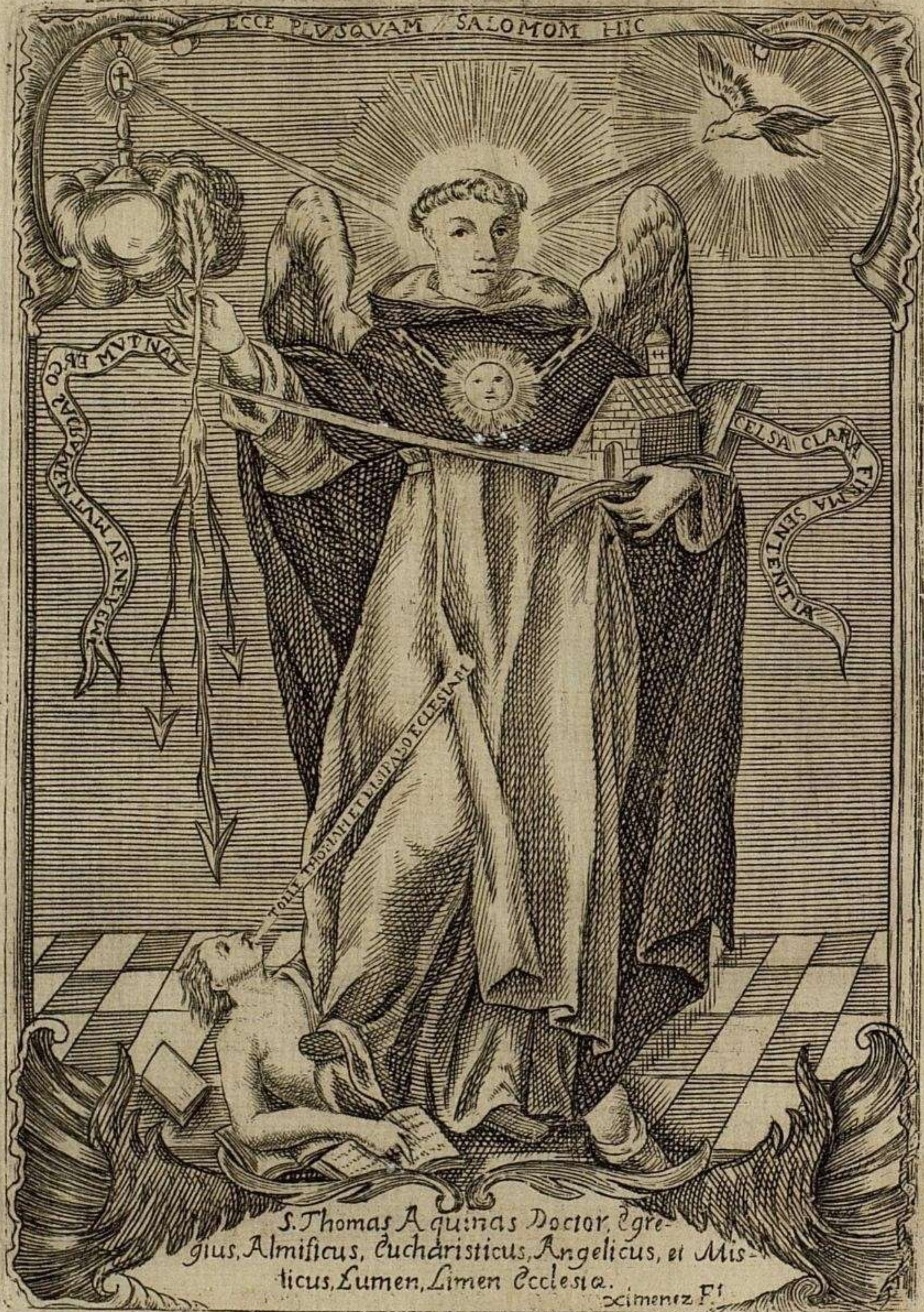
S. Thomas Aquinas Doctor, Egre- gius, Almiscus, Eucharisticus, Angelicus, et Mis- ticus, Lumen, Limen Ecclesia.